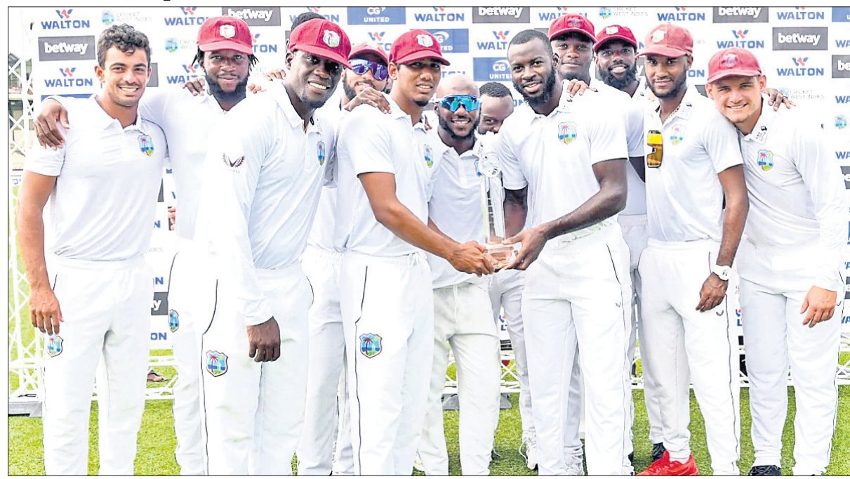
ବାଲାଦେଶ ବିପକ୍ଷରେ ଟେଷ୍ଟ ସିରିଜ୍ ବିଜୟୀ ଫ୍ରେଷ୍ଟଇଣ୍ଡିଜ୍ ଦଳ।

ପରିଣତ କରିଥିଲା। ଶେଷରେ ତାଙ୍କ ନେତୃତ୍ୱରେ ଲର୍ଡ଼ଠାରେ ଘୁମିଲାଖୁକୁ ହରାଇ ଇଂଲଣ୍ଡ ପ୍ରଥମଥର ପାଇଁ ଆଇସିସି ବିଶ୍ୱକପ୍ ହାତେଇଥିଲା। ସେ ୨୦୧୦ ଡି ୨୦ ବିଶ୍ୱକପ୍ ଚାମ୍ପିୟନ ଦଳର ମଧ୍ୟ ସଦସ୍ୟ ଥିଲେ। ମୋର୍ଗାନ ଉପରେ ସେ ଦିନିଆରେ ୧୨୬ ଥର ଏବଂ ଡି ୨୦ରେ ୭୨ ଥର ଇଂଲଣ୍ଡ ଦଳର ନେତୃତ୍ୱ ନେଇଥିଲେ। ୧୬ ବର୍ଷର ଲମ୍ବା ଅନ୍ତର୍ଜାତୀୟ କ୍ୟାରିୟରରେ ମୋର୍ଗାନ ୧୬ ଟେଷ୍ଟ ମଙ୍ଗଳବାର ସୁନା ଦିଆଯାଇଛି। ଏହି ସିରିଜ୍ ନଭେମ୍ବର ୧୮ରୁ ୩୦ ପର୍ଯ୍ୟନ୍ତ ଖେଳାଯିବ। ପରେ ଜାନୁଆରୀରେ ଘୁମିଲାଖୁ ସାମିତ ଉଭୟ ସିରିଜ୍ ପାଇଁ ଭାରତ ଆସିବ। "ଡି ୨୦ ବିଶ୍ୱକପ୍ ପରେ ଭାରତୀୟ ଦଳ ଘୁମିଲାଖୁ ଗସ୍ତରେ ଆସି ଫ୍ରେଲିଂଟନ, ଶ୍ରେତାଗା ଓ ନାସିୟରରେ ଡି ୨୦ ଏବଂ ଅକ୍ଟୋବର, ହାମିଲଟନ ଓ ଟ୍ରିଷ୍ଟରକଠାରେ ଦିନିଆ ଖେଳିବ। ତା' ପରେ ବ୍ଲୁକ୍ୟାମ୍ପ ଦଳ ପ୍ରଥମେ ପାକିସ୍ତାନ ଓ ଭାରତ ଗସ୍ତ କରିବ। ଫେବୃଆରୀରେ ଦଳ ସୁଦେଶ ଫେରି ଇଂଲଣ୍ଡ ବିପକ୍ଷରୁ ନ୍ୟାସ୍ ବିଶ୍ୱକପ୍ ଟେଷ୍ଟ ସିରିଜ୍ ଲାଗି ପ୍ରସ୍ତୁତ ହେବ" ବୋଲି ଏନେସିସି ପକ୍ଷରୁ ଜାରି କରାଯାଇଥିବା ବିବୃତିରେ କୁହାଯାଇଛି।