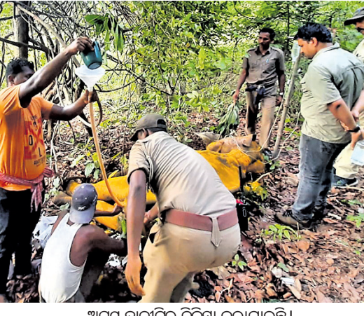
ଅସୁସ୍ଥ ହାତୀଟିର ଚିକିତ୍ସା କରାଯାଇଛି।