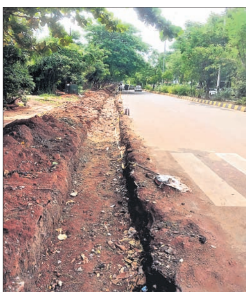
ନାଲକୋ ଛକରୁ ପ୍ରେସ୍ ଛକ ମଧ୍ୟରେ ଗତ ୩ ମାସ ହେବ ରାସ୍ତାକଡ଼ ଖୋଳା ହୋଇପଡ଼ିଛି।

ଓଡ଼ିଶା ଡେମ୍ଫ ହେଉଥିବା ଡ୍ରେନ୍ ମୁକ୍ତୀ ନିୟମିତ ଯାଞ୍ଚ କରାଯିବ। ମୁକ୍ତୀ ଡ୍ରେନ୍ରେ ଦୂର୍ଯ୍ୟତା ଏଡ଼ାଇବାକୁ ଯୌର ଅଧିକାରୀମାନେ ନିଜ ଅଞ୍ଚଳରେ ଆବଶ୍ୟକ ପ୍ରତିକାର ବ୍ୟବସ୍ଥାକୁ ପୁନଃ ନିଶ୍ଚିତ କରିବେ। ସହରାଞ୍ଚଳ ବନ୍ୟାରେ ଡ୍ରେନ୍ ମୁକ୍ତୀ ଯେଉଁଠି ମୃତ୍ୟୁହତ୍ୟା ନ ପାଇତେ ସେଥିପାଇଁ ସମ୍ପୂର୍ଣ୍ଣ ବିଭାଗ ଉତ୍ତରଦାୟୀ ରହିବ। ଡ୍ରେନ୍ ଓ ରାସ୍ତାର ପ୍ରତ୍ୟକ୍ଷ ଯାଞ୍ଚ ହେଉଛି କି