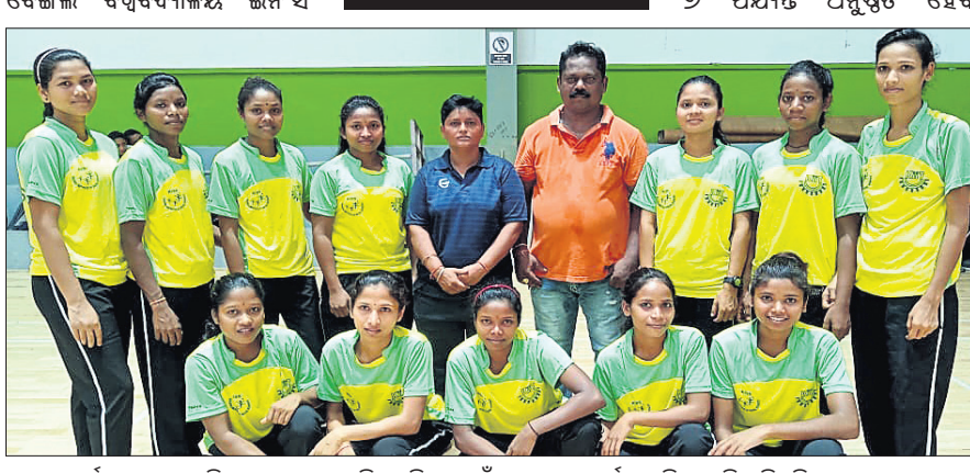
ସର୍ବଭାରତୀୟ ମହିଳା ଖୋ ଖୋ ଚାମ୍ପିୟନଶିପ୍ ପାଇଁ ଯୋଗ୍ୟତା ଅର୍ଜନ କରିଥିବା କିନ୍ତୁ ବିଶ୍ୱବିଦ୍ୟାଳୟ ଦଳ।

କିନ୍ତୁ ୩ ପଦ୍ମରେ ଉତ୍କଳକୁ ଏବଂ ଭିକିଏସ୍ ପୂର୍ବାଞ୍ଚଳ ୬ ପଦ୍ମରେ କଲ୍ୟାଣୀକୁ ହରାଇ ଦେଇଥିଲା। ନକ୍ସାଭାଗ ମ୍ୟାଚ ଶେଷରେ ସର୍ବଭାରତୀୟ ପ୍ରତିଯୋଗିତା ପାଇଁ ଯୋଗ୍ୟତା ପାଇଥିବା ଅନ୍ୟ ୨ଟି ଦଳ ହେଲେ ମୁନିଭାସିଟି ଅର୍ଥୁ କଲ୍ୟାଣୀ (ପଶ୍ଚିମବଙ୍ଗ) ଏବଂ ବୀର ବାହାଦୁର ସିଂ ପୂର୍ବାଞ୍ଚଳ ବିଶ୍ୱବିଦ୍ୟାଳୟ (କେରଳ), ଉତ୍କଳ ପ୍ରଦେଶ। ସର୍ବଭାରତୀୟ ଆନ୍ତର୍ ବିଶ୍ୱବିଦ୍ୟାଳୟ ମହିଳା ଖୋ ଖୋ ଚାମ୍ପିୟନଶିପ୍ କର୍ନାଟକର ମୁନିଭାସିଟି ଅର୍ଥୁ ମହାଶୂରଠାରେ ଲୁଲାଇ ୫ରୁ ୭ ପର୍ଯ୍ୟନ୍ତ ଅନୁଷ୍ଠିତ ହେବ।