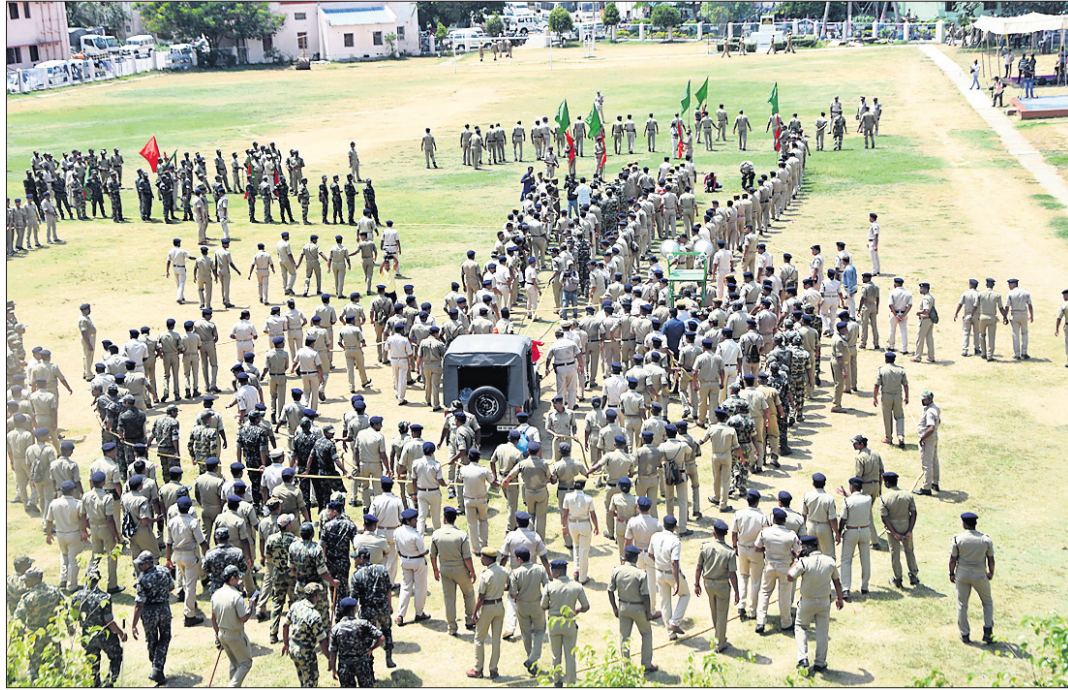
ରଥଯାତ୍ରା ପୂର୍ବରୁ ପୋଲିସ ପ୍ରଶାସନ ପକ୍ଷରୁ ପୂରୀର ରିଜର୍ଭ ପୋଲିସ ଲାଇନ୍ ପଡ଼ିଆରେ ମକତ୍ତଲ କରାଯାଇଛି ।

ରଥଯାତ୍ରା ଦିନର କାର୍ଯ୍ୟକ୍ରମକୁ ନେଇ ମଙ୍ଗଳବାର ପୋଲିସ ପ୍ରଶାସନ ପକ୍ଷରୁ ରିଜର୍ଭ ପୋଲିସ ଲାଇନ୍ ପଡ଼ିଆରେ ଏକ ମକତ୍ତଲ କରାଯାଇଛି ।