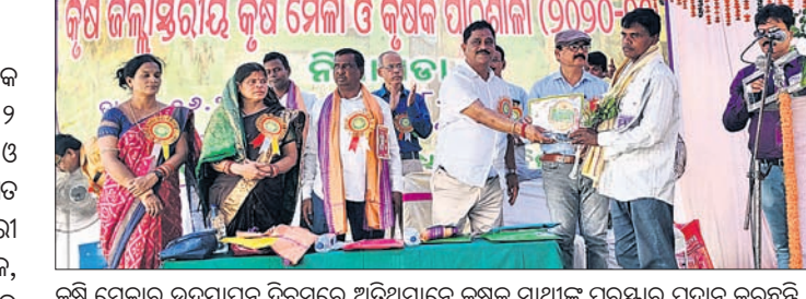
କୃଷି ସମାବେଶ ଉଦ୍‌ଘାଟନ ଦିବସରେ ଅତିଥିମାନେ କୃଷକ ସାଥୀକୁ ପୁରୁଷାର ପ୍ରଦାନ କରୁଛନ୍ତି।

ନିମାପଡ଼ା କୃଷି ଜିଲ୍ଲା ପକ୍ଷରୁ କୃଷି ଓ କୃଷକ ସମିପ୍ତାକରଣ ବିଭାଗ ସହାୟତାରେ ୨ ଦିନିଆ କୃଷି ଜିଲ୍ଲାପ୍ରଧାନୀ କୃଷିମେଳା ଓ କୃଷକ ପାଠଶାଳା ମଙ୍ଗଳବାର ଉଦ୍‌ଘାଟିତ ହୋଇଯାଇଛି।