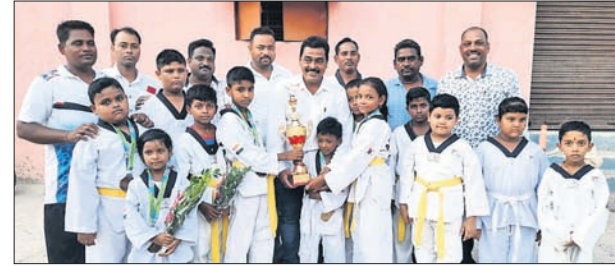
ପିପିଲି, ୨୮ ୧୨ (ସ.ପୁ./ଭି.ଏ.ଏ.ଏ.):

ପୁରୀ ରେଳବାଇ ଇଣ୍ଡିଆନ୍ ଷ୍ଟାଡ଼ିୟମରେ ମଙ୍ଗଳବାର ଅନୁଷ୍ଠିତ ଜିଲ୍ଲାପ୍ରଧାନୀ ଚାଏକୋଷ୍ଠ ପୁନିୟୁପ୍ରତିଯୋଗିତାରେ ପିପିଲି ଦଳର ସମାପ୍ତି ହୋଇଛି।