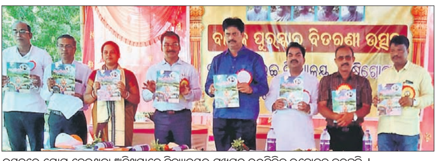
ଉତ୍ସବରେ ଯୋଗ ଦେଇଥିବା ଅଭିଭାବକମାନଙ୍କୁ ପୁସ୍ତକ ପଢ଼ାଇବା ପାଇଁ ଉଦ୍ଦେଶ୍ୟ ରଖାଯାଇଛି ।