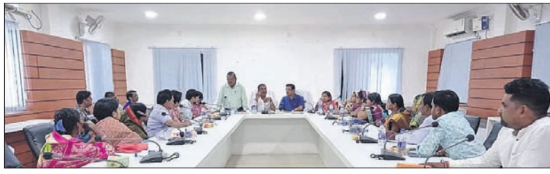
ବୈଠକରେ ନଗରପାଳଙ୍କ ସମେତ ଅନ୍ୟମାନେ।