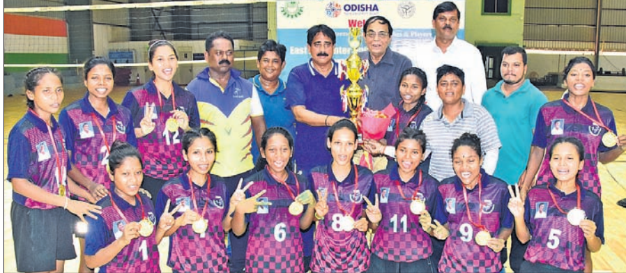
ପୂର୍ବାଞ୍ଚଳ ଆନ୍ଧ୍ର ବିଶ୍ୱବିଦ୍ୟାଳୟ ମହିଳା ଖୋ ଖୋରେ ଚାମ୍ପିୟନ କିଟ୍ ବିଶ୍ୱବିଦ୍ୟାଳୟ ଦଳ।

ଭୁବନେଶ୍ୱର, ୨୯।୬ (କ୍ରୀଡ଼ା ପ୍ରତିନିଧି): ଆସୋସିଏସନ ଅଫ୍ ଇଣ୍ଡିଆନ ୟୁନିଭର୍ସିଟିଜ୍ (ଏଆଇୟୁ) ଅନୁମୋଦନକ୍ରମେ କିଟ୍ ବିଶ୍ୱବିଦ୍ୟାଳୟ ବିଜୁ ପଟ୍ଟନାୟକ ଇନ୍‌ସ୍ଟିଚ୍ୟୁଟ୍ ଅଫ୍ ଟେକ୍ନୋଲୋଜି ଆନ୍ଧ୍ରବିଶ୍ୱବିଦ୍ୟାଳୟ ମହିଳା ଖୋ ଖୋ ଚାମ୍ପିୟନଶିପ୍ ବୁଧବାର ଶେଷ ପର୍ଯ୍ୟନ୍ତ ହେବା ପରେ କିଟ୍ ବିଶ୍ୱବିଦ୍ୟାଳୟ ଆଗ୍ରଣିକ ଭାବେ ଚାମ୍ପିୟନ ହୋଇଛି।