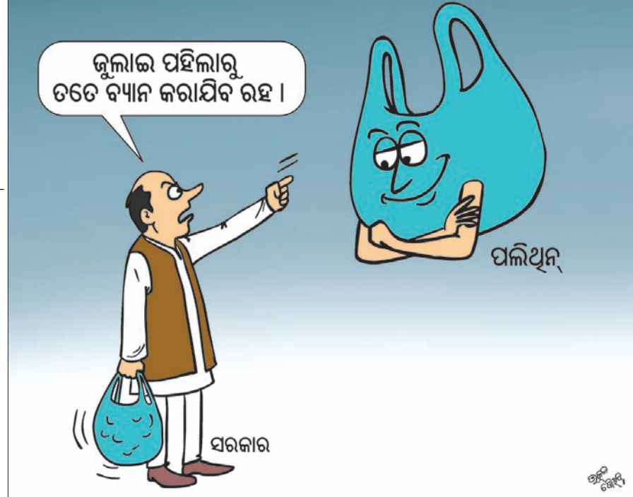
ଜୁଲାଇ ପହିଲାକୁ ତଟେ ବ୍ୟାନ କରାଯିବ ରହ।

ସକାଶେ ଏସିଆନ ଟେକ୍ନୋଲୋଜି ଏକା (ଏଡିଏ) ଏବଂ ସିନାପୁର ଇନ୍ଭେଷ୍ଟର୍ସ ଅଫ୍ ଚେମ୍ବରସ୍ ଏକ୍ସିକ୍ୟୁଟିଭ୍ ଆଇଡିଆଏସ୍ ଇଣ୍ଡିଆ ପ୍ରାଧିକାରଣରେ ନିକେଟରେ ଭୁବନେଶ୍ୱରରେ ଏକ ବିଶ୍ୱ ଦକ୍ଷତା କେନ୍ଦ୍ର ଗଠନ କରାଯାଇଛି। ପୁଞ୍ଜି ନିବେଶକାରୀମାନଙ୍କୁ ସହାୟତା ପାଇଁ ଓଡ଼ିଶା ସରକାର ସିନାପୁର ଫୋର୍ସ୍, ଗୋ ସୁଲ୍ଡଫ୍, ବିପି ଇଣ୍ଡଷ୍ଟ୍ରି ଏବଂ ବିଏସ୍ପି କମିଟି ଶିଳ୍ପ ଓ ଭିଜିଟୁରୀ ବିକାଶ ପାଇଁ ରାଜ୍ୟ ସରକାର ୫-ଟି ଟ୍ରାନ୍ସପରେଟ୍, ଟେକ୍ନୋଲୋଜି, ଟିଏଫ୍, ଟିଏଫ୍, ଟିଏଫ୍ ଆଣ୍ଡ୍ ଟ୍ରାନ୍ସପୋର୍ଟରେ) ଭଳି ବହୁ ପଦକ୍ଷେପ ନେଇଛନ୍ତି। ଏହା ରାଜ୍ୟରେ ଶିଳ୍ପ ବାତାବରଣ ସୃଷ୍ଟି କରିପାରିବ। ଏଥିପାଇଁ ରାଜ୍ୟରେ ନିଯୁକ୍ତି ବୃଦ୍ଧି ସହ ରାଜ୍ୟ ସଂଗ୍ରହରେ ମଧ୍ୟ ଅଭିବୃଦ୍ଧି ଘଟିଛି ବୋଲି ପୁଞ୍ଜିନିବେଶ ଆହ୍ୱାନରେ କୁହାଯାଇଛି। ଏହି ଇନ୍ଭେଷ୍ଟର୍ସ ମିଟ୍ରେ ପୁଞ୍ଜିନିବେଶ ଓ ତାଙ୍କ ଟିଏ କମ୍ପାନୀଗୁଡ଼ିକ ସହ ଓଲିଭିଆ ଆଇଡିଆଏସ୍ କରିଛନ୍ତି। ସମସ୍ତ ସହଯୋଗ ଯୋଗାଇ ଦେବାକୁ ପୁଞ୍ଜିନିବେଶ କମ୍ପାନୀଗୁଡ଼ିକ ଭାରତ ଦେଇଛନ୍ତି। ଓଡ଼ିଶା ଟିଏ ସହିତ ରାଜ୍ୟ ଓ ଦେଶର ବହୁ କମ୍ପାନୀ ପୁଞ୍ଜିନିବେଶ ଏକ ଉଚ୍ଚସ୍ତରୀୟ ପ୍ରତିନିଧିତ୍ୱ ମଧ୍ୟ ଏହି ସମ୍ମିଳନୀରେ ଯୋଗ ଦେଇଛନ୍ତି।