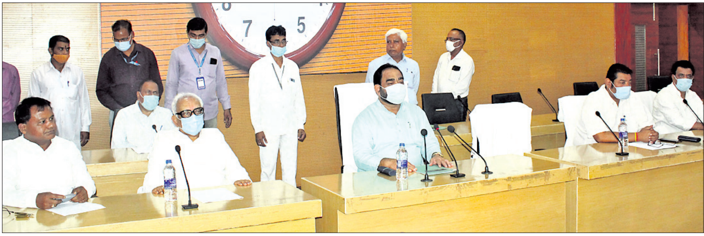
ବିଧାନସଭା ସମ୍ମିଳନୀ କକ୍ଷରେ ଭୂଧର ଅନୁଷ୍ଠିତ ସର୍ବଦଳୀୟ ବୈଠକରେ ବାଚସ୍ପତି ବିକ୍ରମକେଶରୀ ଆରୁଖ ଓ ଅନ୍ୟ ଦଳର ବିଧାୟକମାନେ ।