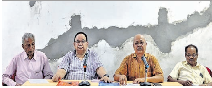
ଖବରଦାତା ସମ୍ମିଳନୀରେ ମିଳିତ କମିଟି କର୍ମକର୍ମାମାନେ ।