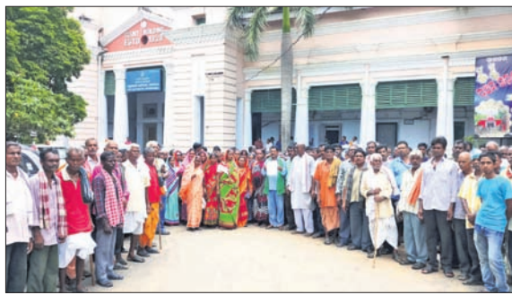
କିଲାପାଳଙ୍କ ଦ୍ଵାରା ହୋଇଥିବା ମହୁଲପୁଞ୍ଜି ଗ୍ରାମବାସୀ