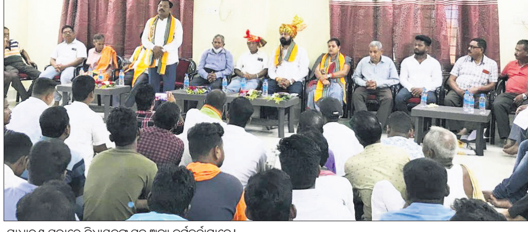
ସାଧାରଣ ସଭାରେ ବିଧାୟକଙ୍କ ସହ ଅନ୍ୟ କର୍ମକର୍ତ୍ତାମାନେ।