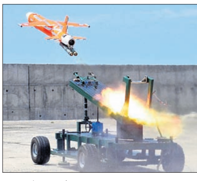
‘ଅଭ୍ୟାସ’ କ୍ଷେପଣୀୟର ଉଦ୍ଦେଶ୍ୟପଣ।

ପ୍ରତିରକ୍ଷା ଅନୁସନ୍ଧାନ ଏବଂ ବିକାଶ ସଂଗଠନ (ଡିଆର୍‌ଆଇ) ର ଏରୋନେଟିକାଲ୍ କ୍ଷେପଣପର୍ଯ୍ୟନ୍ତ ଏକ୍ସପ୍ରିମେଣ୍ଟ ଦ୍ୱାରା ‘ଅଭ୍ୟାସ’ ଡେଇଟାସ୍ତର