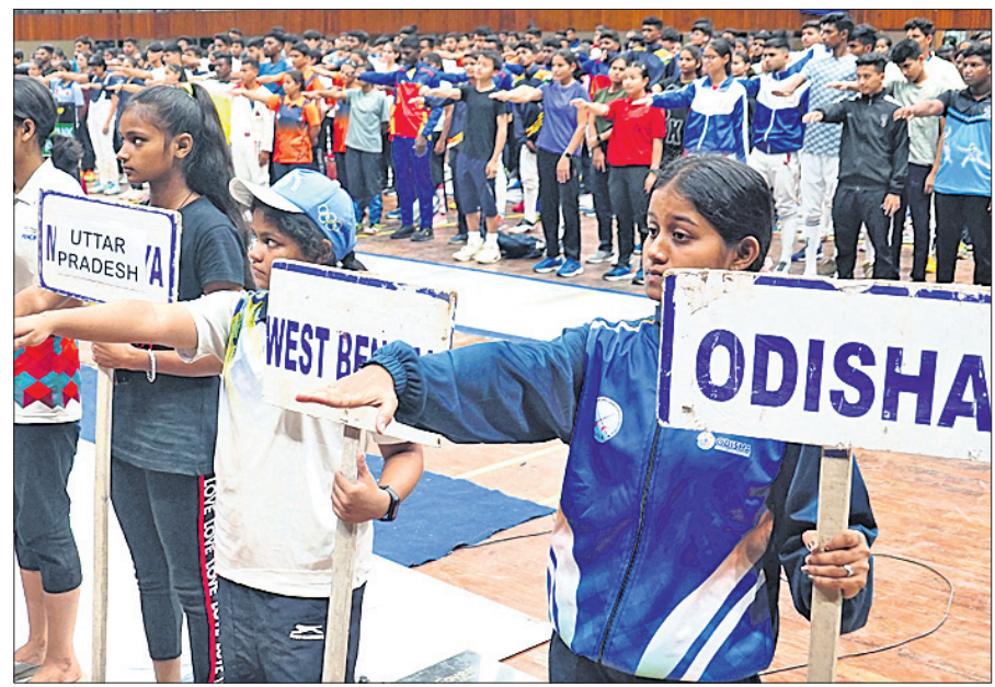
ଅଂଶଗ୍ରହଣକାରୀ ପ୍ରତିଯୋଗୀଙ୍କ ଶପଥ ଗ୍ରହଣ।