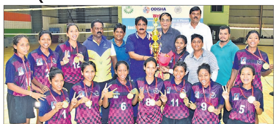
ପୂର୍ବାଞ୍ଚଳ ଆନ୍ଧ୍ର ବିଶ୍ଵବିଦ୍ୟାଳୟ ମହିଳା ଖୋ ଖୋରେ ଚାମ୍ପିୟନ କିଟ୍ ବିଶ୍ଵବିଦ୍ୟାଳୟ ଦଳ।

ଭୁବନେଶ୍ଵର, ୨୯।୬ (କ୍ରୀଡା ପ୍ରତିନିଧି): ଆସୋସିଏସନ ଅଫ୍ ଇଣ୍ଡିଆନ୍ ୟୁନିଭର୍ସିଟି (ଏଆଇୟୁ) ଅନୁମୋଦନକ୍ରମେ କିଟ୍ ବିଶ୍ଵବିଦ୍ୟାଳୟ ବିଶ୍ଵ ପକ୍ଷୀୟ ଲନଡୋର ଷ୍ଟାଡିୟମରେ ପୂର୍ବାଞ୍ଚଳ ଆନ୍ଧ୍ର ବିଶ୍ଵବିଦ୍ୟାଳୟ ମହିଳା ଖୋ ଖୋ ଚାମ୍ପିୟନଶିପ୍ ବୁଧବାର ଶେଷ