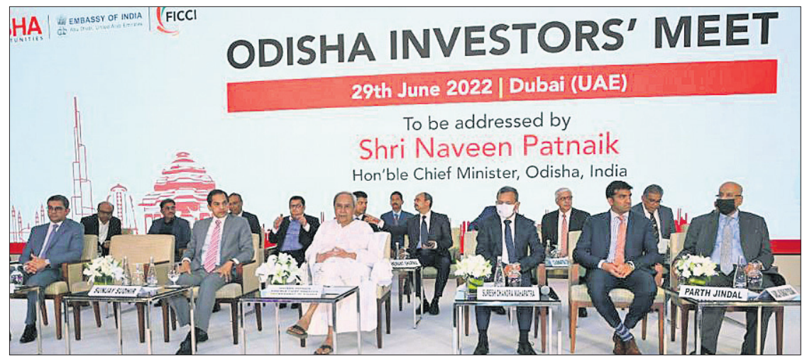
ରୁଧିରୀକର ଓଡ଼ିଶା ଇନ୍ଭେଷ୍ଟର୍ସ ମିଟ୍ ଅବସରରେ ପୁଞ୍ଜିନିବେଶକାରୀଙ୍କ ଗହଣରେ ପୃଷ୍ଠାମନ୍ତ୍ରୀ ନବୀନ ପଟ୍ଟନାୟକ।

ଏ ବାବଦରେ କମ୍ପାନୀ ୫୦ କୋଟି ଟଙ୍କାର ପୁଞ୍ଜିନିବେଶ କରିବ। ଏଥିରେ ୩୦୦ ଜଣଙ୍କୁ ପ୍ରତ୍ୟକ୍ଷ ଓ ୫୦୦୦ ଜଣଙ୍କୁ ପରୋକ୍ଷରେ ନିଯୁକ୍ତି ମିଳିପାରିବ। ଲୁଲୁ ଇଣ୍ଡରନିଆରୀନାଲ ଶିପିଂମାଲ୍ ପ୍ରାଇଭେଟ ଲିମିଟେଡ୍ ୧୫୦୦ କୋଟି ଟଙ୍କାର ବିନିଯୋଗରେ ରାଜ୍ୟରେ ଶିପିଂମାଲ, ହାଇପରମାର୍କେଟ୍ ପ୍ରତିଷ୍ଠା କରିବାକୁ ଆଗ୍ରହ ପ୍ରକାଶ କରିଛି। ଏଥିରେ ପ୍ରାୟ ୫ ହଜାର ଜଣଙ୍କୁ ପ୍ରତ୍ୟକ୍ଷ ଓ ୧୦ ହଜାର ଲୋକଙ୍କୁ ପରୋକ୍ଷ ନିଯୁକ୍ତି ମିଳିପାରିବ। ସେହିପରି ଡିପି ଓଲିଭିଆ ଆଣ୍ଡ ହିନ୍ଦୁସ୍ତାନ ପୋର୍ଟସ୍ ଲିମିଟେଡ୍ ରାଜ୍ୟରେ ବନ୍ଦର, ଏକ୍ସକ୍ଲେଜିଭ୍ ଏବଂ ଆଇସିଡି କ୍ଷେତ୍ରରେ ପୁଞ୍ଜିନିବେଶ କରିବାକୁ ଆଗ୍ରହ ପ୍ରକାଶ କରିଛି। ଏଥିପାଇଁ କମ୍ପାନୀ ୮ ହଜାର କୋଟି ଟଙ୍କାର ପୁଞ୍ଜିନିବେଶ କରିବ ବୋଲି ନିବେଶକ ସମ୍ମିଳନୀରେ ସୂଚନା ଦେଇଛି।