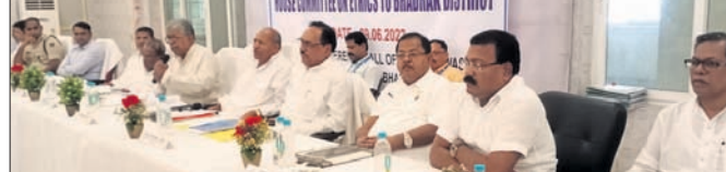
ବୈଠକରେ ବିଧାନସଭା ସଦାଚାର କମିଟି ସଦସ୍ୟ ଓ ଅନ୍ୟ ଅଧିକାରୀ ।

ସମାପ୍ତ ରହିବା ଆବଶ୍ୟକ । ୨୦୦୨ ଡିସେମ୍ବର ୫ରେ ବିଧାନସଭା ସଭାପତିଙ୍କ ଦ୍ଵାରା ଗଠିତ ବିଧାନସଭା ସଦାଚାର କମିଟି ସମାପ୍ତୀ ବୈଠକ ଉପରେ ଆଜି ସଭାପତିଙ୍କ ସମ୍ମୁଖରେ ବିଧାନସଭା ସଦାଚାର କମିଟିର ସମସ୍ତ ସଭ୍ୟମାନଙ୍କର ଉପସ୍ଥିତିରେ ବିଧାନସଭା ସଦାଚାର କମିଟିର ସମାପ୍ତୀ ବୈଠକ ଅନୁଷ୍ଠିତ ହୋଇଥିଲା ।