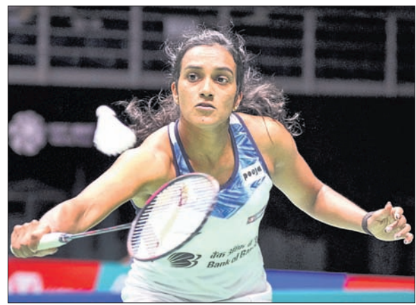
ଶର୍ଦ୍ଧା ଖେଳିବା ଅବସରରେ ପି.ଭି. ସିନ୍ଧୁ।

କ୍ରୀଡାଳୀଙ୍କୁ, ୨୯।୬: ଭାରତୀୟ ମହିଳା ବ୍ୟାଡମିଣ୍ଟନର ସୁଲଭା ନେହାଲଙ୍କୁ ଏଠାରେ ଚାଲିଥିବା ମାଲେସିଆ ଓପନ ପ୍ରଥମ ରାଉଣ୍ଡରେ ବିପରୀତ ଫଳାଫଳ ମିଳିଛି।