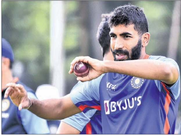
ଏକଦିନୀୟ ଗ୍ରାଉଣ୍ଡରେ ବୁମ୍ରା ଅଧିନାୟକ ଭାବେ ନିର୍ବାହନ କରୁଥିବା ରୋହିତ ଓହରିଲେ।

କୋଭିଡ୍-୧୯ରୁ ସୁସ୍ଥ ହୋଇ ନ ଥିବାରୁ ଚିନ୍ତା ଲକ୍ଷ୍ୟ ଆରମ୍ଭ କରିଥିବା ରୋହିତ ଓହରିଲେ। ବୁମ୍ରା ଅଧିନାୟକ ଭାବେ ନିର୍ବାହନ କରୁଥିବା ଟେଷ୍ଟ ଟିମ୍ ଲକ୍ଷ୍ୟ ଆରମ୍ଭ କରିଥିବା ବ୍ୟତୀତ ବୁମ୍ରା ଅଧିନାୟକ ଭାବେ ମଧ୍ୟ ଉପସ୍ଥିତ ରହିଥିଲେ।