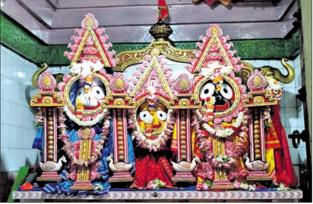
ହାଲ ସୁନାବେତା ଜଗନ୍ନାଥ ମନ୍ଦିରରେ ମହାପ୍ରଭୁଙ୍କ ନବ ଯୌବନ ବେଶ ଏବଂ ଜୟପୁରରେ ନେତ୍ର ଉତ୍ସବ ଅବସରରେ ଶ୍ରୀଜୀଉ।