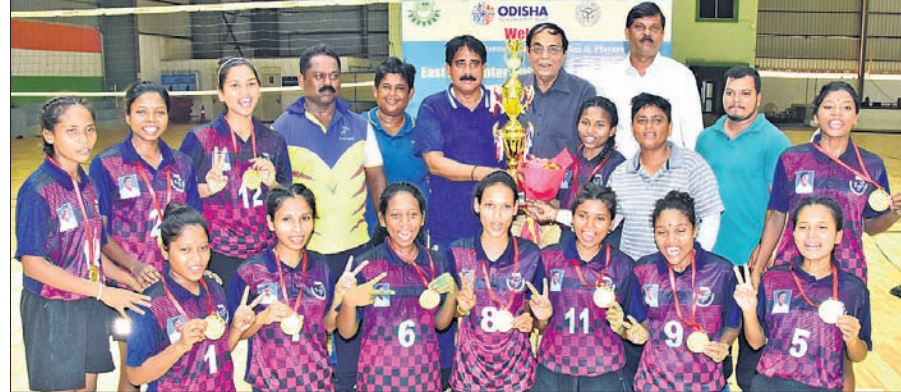
ପୂର୍ବାଞ୍ଚଳ ଆନ୍ଧ୍ର ବିଶ୍ୱବିଦ୍ୟାଳୟ ମହିଳା ଖୋ ଖୋରେ ଚାମ୍ପିୟନ କିର୍ ବିଶ୍ୱବିଦ୍ୟାଳୟ ଦଳ।

ଭୁବନେଶ୍ୱର, ୨୯।୬ (କ୍ରୀଡ଼ା ପ୍ରତିନିଧି): ଆସୋସିଏସନ ଅଫ ଇଣ୍ଡିଆନ ଯୁନିଭର୍ସିଟି (ଏଆଇୟୁ) ଅନୁମୋଦନକ୍ରମେ କିର୍ ବିଶ୍ୱବିଦ୍ୟାଳୟ ବିଶ୍ୱ ପକ୍ଷୀୟକ ଲନ୍‌ଡୋର ଷ୍ଟାଡିୟମରେ ପୂର୍ବାଞ୍ଚଳ ଆନ୍ଧ୍ର ବିଶ୍ୱବିଦ୍ୟାଳୟ ମହିଳା ଖୋ ଖୋ ଚାମ୍ପିୟନଶିପ୍ ବୁଧବାର ଶେଷ