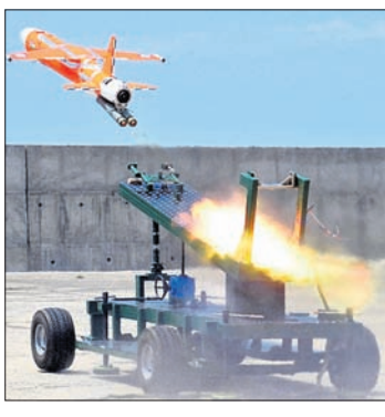
'ଅଭ୍ୟାସ' କ୍ଷେପଣାସ୍ତ୍ରର ଉଡ଼ଣପଥ ।

ବାଲେଶ୍ୱର ଅଫିସ, ୨୯.୬ ବାଲେଶ୍ୱର ଜିଲ୍ଲା ଚାନ୍ଦିପୁର ସମ୍ପତ୍ତି ପରୀକ୍ଷଣ କେନ୍ଦ୍ର (ଆଇଟିଆର)ରୁ ବୁଧବାର ହାଇଡ୍ରୋ ଏକ୍ସପ୍ଲୋସିଭ୍ ଏକ୍ସପ୍ଲୋଜିଭ୍ ଚାର୍ଜ୍ (ଡିଏ) କ୍ଷେପଣାସ୍ତ୍ର ପରୀକ୍ଷଣ ସଫଳ ହୋଇଥିବା ଜଣାଯାଇଛି । ପରୀକ୍ଷଣ ଲାଗି ଚାର୍ଜ୍ ବିନାମିଟ୍ଟି ପୂର୍ବ ନିର୍ଦ୍ଧାରିତ ନିମ୍ନ ଉଚ୍ଚତା ଉଡ଼ାଣ ପଥରେ ଭୁବୁ ଆଧାରିତ ନିୟନ୍ତ୍ରଣକୁ ଉଡ଼ାଯାଇଥିଲା । ଯାହାକି ରାଜ୍ୟ ଏବଂ ଲୋକେଣ୍ଡ୍ର-ଅପ୍ରିକାଲ୍ ଚାର୍ଜ୍ ସିଷ୍ଟମ୍ ସହିତ ଆଇଟିଆର ଦ୍ୱାରା ନିୟୋଜିତ ବିଭିନ୍ନ ଟ୍ରାକ୍ ସେକ୍ଟର ଦ୍ୱାରା ତଦାରଖ କରାଯାଇଥିଲା । ପ୍ରତିରକ୍ଷା ଅନୁସନ୍ଧାନ ଏବଂ ବିକାଶ ସଂଗଠନ (ଡିଆରଡିଓ) ର ଏକ୍ସପ୍ଲୋସିଭ୍ ଡେଭଲପମେଣ୍ଟ ଏଣ୍ଡ୍‌ସିସ୍ଟେମ୍ସ୍ ଦ୍ୱାରା 'ଅଭ୍ୟାସ' କ୍ଷେପଣାସ୍ତ୍ର ପରିକଳ୍ପନା ଏବଂ ବିକଶିତ ହୋଇଛି । ଏହି ସଫଳ