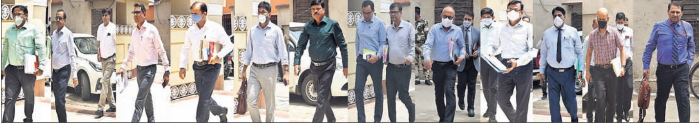
ଏଆଇଟି ବୈଠକରେ ଯୋଗଦେବାକୁ ଆସିଥିବା ଅଧିକାରୀ ।

କଳାଧନ ସମ୍ପର୍କିତ ଏସ୍‌ଆଇଟି ବୈଠକ ■ ଭୁବୁ କାରବାରରେ କଳାଧନର ବ୍ୟାପକ ବିନିଯୋଗ ■ ପାନାମା ଯେପର୍ଯ୍ୟନ୍ତ କ୍ଷେତ୍ରରେ ୪୦୦ରୁ ଅଧିକ ମାମଲା ରୁଜୁ ■ ପାଣ୍ଡୋରା ଯେପର୍ଯ୍ୟନ୍ତ ମାସକ ମଧ୍ୟରେ ୭୦ ମାମଲା ■ ଆୟ ବହିର୍ଭୂତ ସମ୍ପତ୍ତି ଠୁଳ ଚଢ଼ଣରେ ଲଢ଼ି, ଆୟକରକୁ ସାମିଲ କର