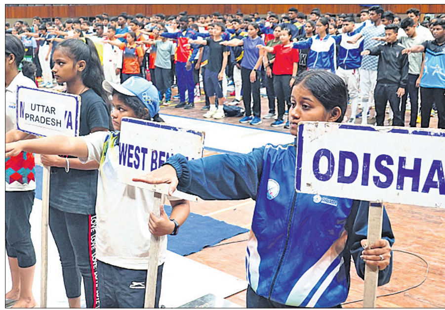
ଅଂଶଗ୍ରହଣକାରୀ ପ୍ରତିଯୋଗୀଙ୍କ ଶପଥ ଗ୍ରହଣ।