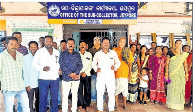
ବାବିପତ୍ର ଦେବାକୁ ଆସିଥିବା ଗ୍ରାମବାସୀ।

ଛାତ୍ରଛାତ୍ରୀଙ୍କ ଅନିଚ୍ଛା ସତ୍ତ୍ୱେ ନିର୍ମାଣ ହେଉଥିବା ଏହି ବିଦ୍ୟାଳୟ ଗୃହ ସମ୍ପର୍କରେ ଉପ ଜିଲ୍ଲାପାଳଙ୍କୁ ଅବଗତ କରାଯାଇଛି। ନିର୍ମାଣସ୍ଥଳଠାରୁ ୨ଶହ ମିଟର ଦୂରରେ