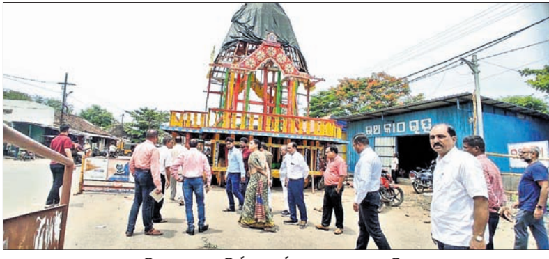
ଜିଲାପାଳ ରଥ ନିର୍ମାଣ କାର୍ଯ୍ୟର ଅନୁଧ୍ୟାନ କରୁଛନ୍ତି।

ରାୟଗଡ଼ା ଅଫିସ, ୨୯୯୭ ଶ୍ରୀ ଶ୍ରୀକ୍ଷେତ୍ର ରାୟଗଡ଼ାଠାରେ ଯୋଗ୍ୟଯାତ୍ରା ପାଇଁ ନେଇ ପ୍ରସ୍ତୁତି ଓ ରଥ ନିର୍ମାଣ କାର୍ଯ୍ୟ ଚାଲିଛି।