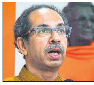
ଜଣେ ପ୍ରତିନିଧିତ୍ୱ ରଖୁଥିଲେ। ଶିବସେନାକୁ ୫ ବର୍ଷରୁ ଅଧିକ ବର୍ଷ ମୁଖ୍ୟମନ୍ତ୍ରୀ ପଦ

ଶିବସେନା ବିଦ୍ରୋହୀଙ୍କ ଦ୍ୱାରା ମହାରାଷ୍ଟ୍ର ମୁଖ୍ୟମନ୍ତ୍ରୀ ପଦକୁ ଗାଦିଚ୍ୟୁତ ହୋଇଥିବା ଉତ୍ତର ଠାକୁରେ ଭାଜପାକୁ ଚାଲେନ୍ କରିଛନ୍ତି। ଶୁକ୍ରବାର ଏକ ଖବରଦାତା ସମ୍ମିଳନୀ ଆୟୋଜିତ କରି ଉତ୍ତର କରିଛନ୍ତି, 'ତଥାକଥିତ ଶିବ ସେନା'କୁ ଭାଜପା ମହାରାଷ୍ଟ୍ର ମୁଖ୍ୟମନ୍ତ୍ରୀ କରାଇଛି। କିନ୍ତୁ ୨୦୧୯ରେ ନିଜ ପ୍ରତିଷ୍ଠିତ ମୁତାବକ ଏହି ଆସନରେ ଭାଜପା କାହିଁକି ଶିବସେନାର