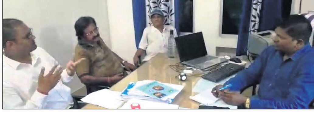
ଏଡିଲଓଙ୍କୁ ସହିତ ଅଭିଭାବକ ମହାସଂଘର ପ୍ରତିନିଧିଙ୍କ ଆଲୋଚନା।