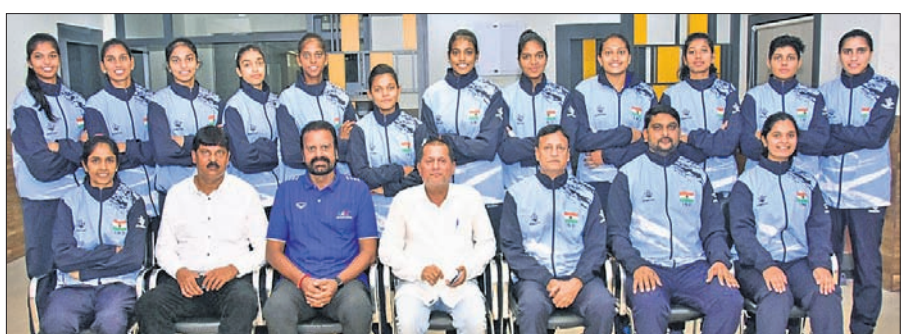
ଭିଏପିଆଇ ସଭାପତି ଅନୁପ ସାମନ୍ତଙ୍କ ସହ ୨୦ ବର୍ଷରୁ କମ୍ ଭାରତୀୟ ମହିଳା ଭଲିବଲ୍ ଦଳ।