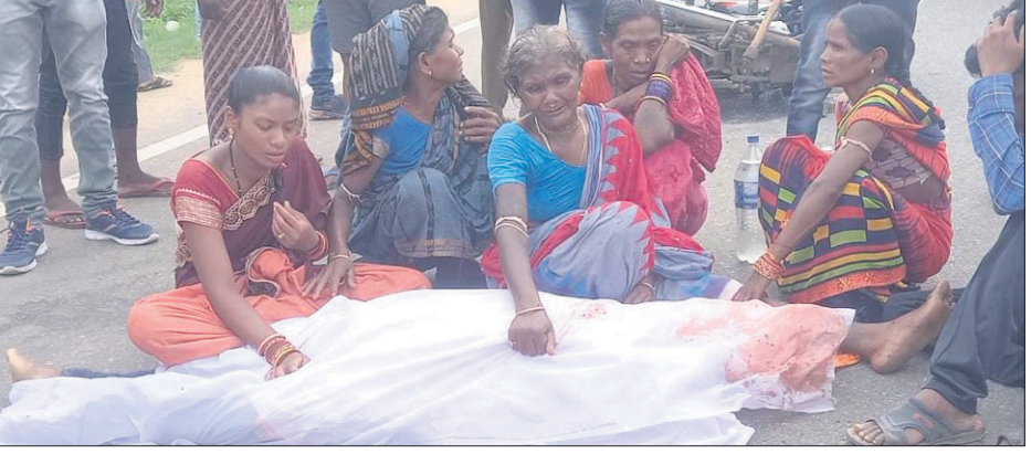
ମୃତଦେହ ରଖି ରାସ୍ତାରେକୋ କରାଯାଇଛି।