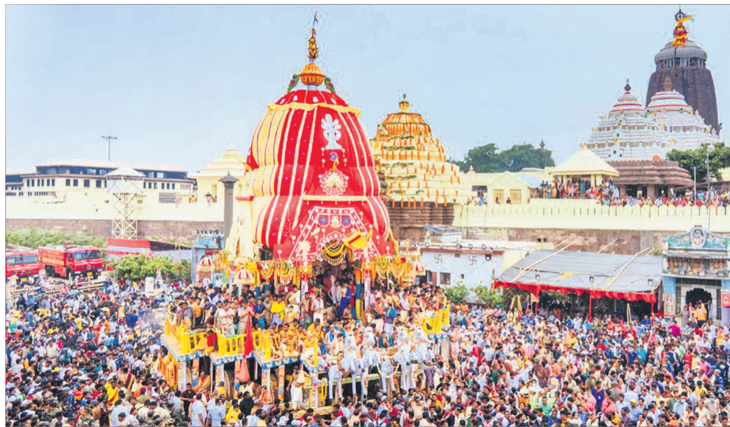
ଶ୍ରୀମନ୍ଦିର ସମ୍ମୁଖରୁ ନନ୍ଦିଘୋଷ ରଥକୁ ଭକ୍ତମାନେ ଚାଣି ନେଉଛନ୍ତି ।