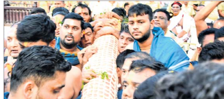
ଶ୍ରୀବଳଭଦ୍ର, ମା' ସୁଭଦ୍ରା ଓ ଶ୍ରୀସୁଦର୍ଶନଙ୍କ ରଥକୁ ପହଞ୍ଚି ବିଜେ ।