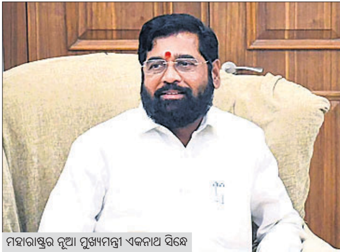
ମହାରାଷ୍ଟ୍ରର ନୂଆ ମୁଖ୍ୟମନ୍ତ୍ରୀ ଏକନାଥ ସିନ୍ଧେ

■ ବସିବ ୨ ଦିନିଆ ସ୍ୱତନ୍ତ୍ର ବିଧାନସଭା ଅଧିବେଶନ ■ ବିଦ୍ରୋହୀ ବିଧାୟକଙ୍କୁ ଭେଟିଲେ ନୂଆ ମୁଖ୍ୟମନ୍ତ୍ରୀ