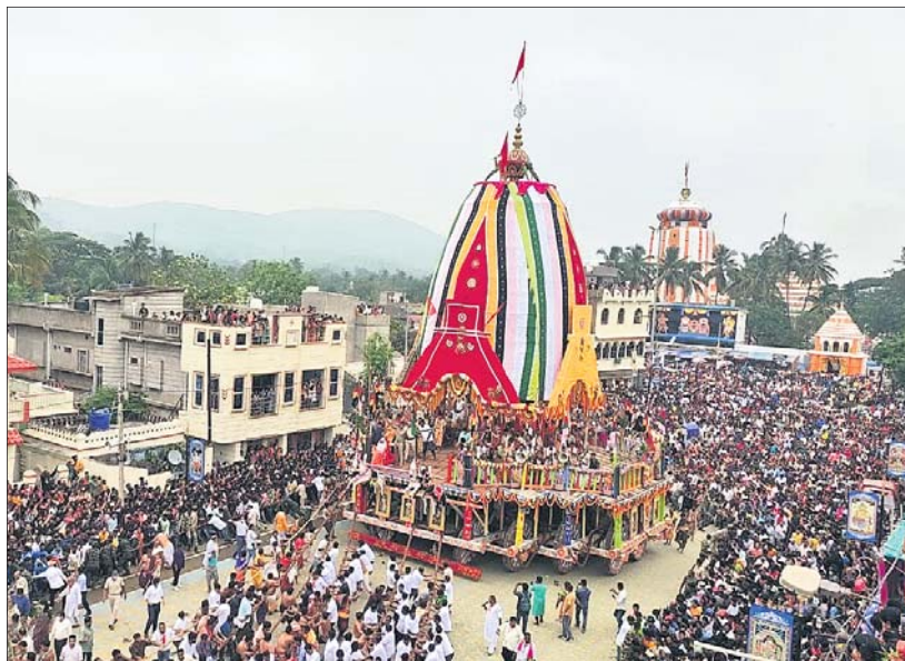
କେନ୍ଦୁଝର ବଳଦେବଜୀଉଙ୍କ ରଥକୁ ଚାଣିଲେ ଭକ୍ତ ।