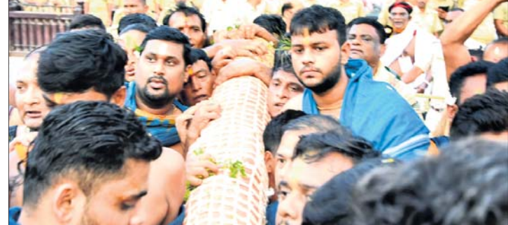
ଶ୍ରୀବଳଭଦ୍ର, ମା' ସୁଭଦ୍ରା ଓ ଶ୍ରୀସୁଦର୍ଶନଙ୍କ ରଥକୁ ପହଞ୍ଚି ବିଜେ ।