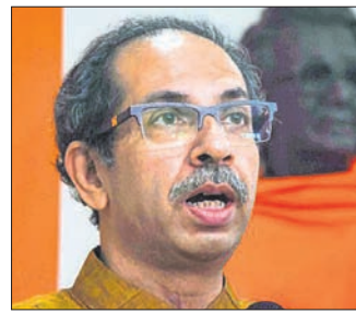
୨୦୧୯ରେ ମୁଖ୍ୟମନ୍ତ୍ରୀ ପଦ ନାହିଁକି ଦେଲେନି: ଉତ୍ତର

ତାଙ୍କ ସହ ଯେପରି ବିବାହଯାତ୍ରା କରିଛି ସେପରି ମହାରାଷ୍ଟ୍ରବାସୀଙ୍କ ପାଇଁ ନ କରୁ ବୋଲି ଉତ୍ତର ଦେଲେନି। ସିନ୍ଧେ କଣେ ଶିବସେନା ମୁଖ୍ୟମନ୍ତ୍ରୀ ହୁଅନ୍ତି। ବିଦ୍ରୋହୀ ଗଣତନ୍ତ୍ର ଉପହାସ କରିଛନ୍ତି। ଲୋକଙ୍କ ଭୋଟ ନଷ୍ଟ ହୋଇଥିବା ଉତ୍ତର ଦେଲେନି।