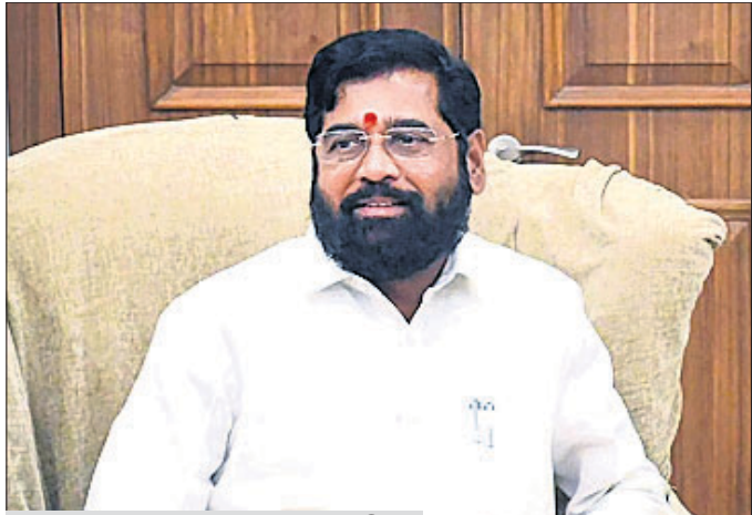
ମହାରାଷ୍ଟ୍ରର ନୂଆ ମୁଖ୍ୟମନ୍ତ୍ରୀ ଏକନାଥ ସିନ୍ଧେ

ବୋଲି ଜଣାପଡ଼ିଛି। ଶନିବାର ମହାତ୍ମା ୧୨ ପର୍ଯ୍ୟନ୍ତ ବିଧାନସଭା ବାଚସ୍ପତି ନିର୍ବାଚନ ପାଇଁ ନାମାଙ୍କନପତ୍ର ଗ୍ରହଣ