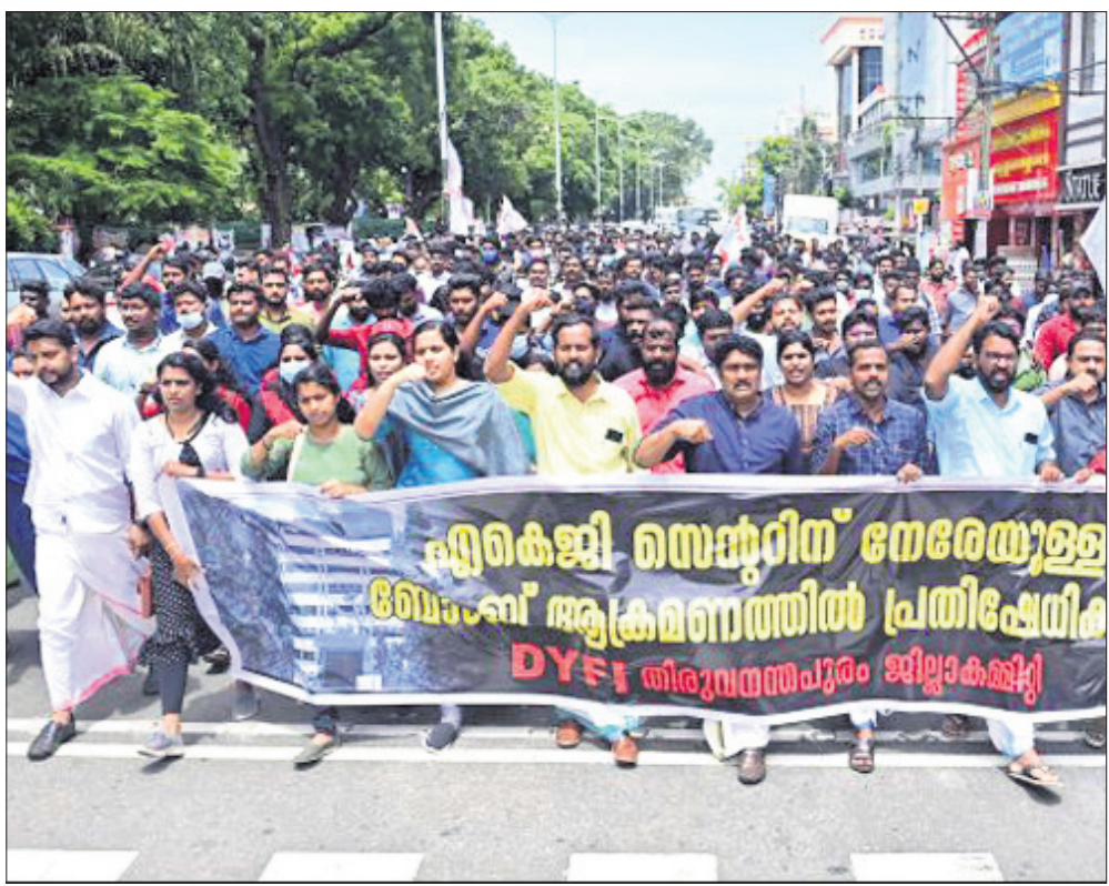
ଅନୁଭବପୁରରୁ ବିପିଆଇ(ଏନ) ରାଜ୍ୟ ମୁଖ୍ୟମନ୍ତ୍ରୀ ଉପରେ ଆନୁଗମ୍ୟ ଘଟଣାକୁ ବିରୋଧ କରି ଡିମାଣ୍ଡ ପତ୍ର ଆଇ ପକ୍ଷରୁ ଶୁକ୍ରବାର ବିକ୍ଷୋଭ ପ୍ରଦର୍ଶନ।