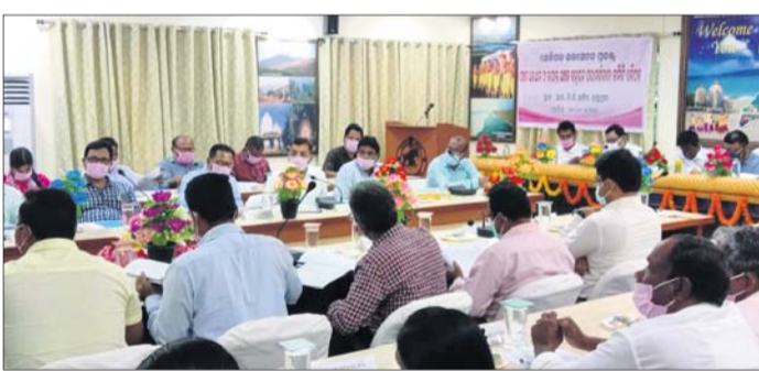
ବୈଠକରେ ବିଭାଗୀୟ ଅଧିକାରୀ ଓ ଅଧ୍ୟକ୍ଷମାନେ।