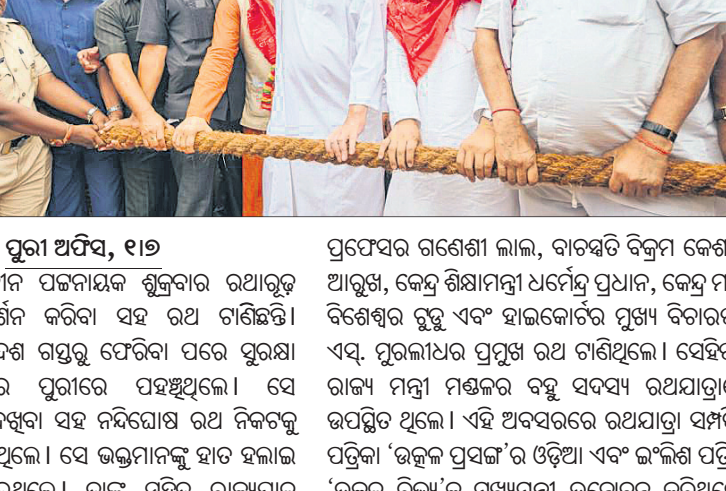
ପୁରୀ ଅର୍ପଣ, ୧୬

ରଥ ଚାଣିଲେ ରାଜ୍ୟପାଳ, ମୁଖ୍ୟମନ୍ତ୍ରୀ ରଥଯାତ୍ରା ଉପଲକ୍ଷେ ଦେଶର ବହୁ ପ୍ରତିଷ୍ଠିତ ବ୍ୟକ୍ତି ଦେଶବାସୀଙ୍କୁ ଶୁଭେଚ୍ଛା ଜଣାଇବା ସହ ସମସ୍ତଙ୍କ ମଙ୍ଗଳ କାମନା କରିଛନ୍ତି । ରାଷ୍ଟ୍ରପତି ରାମନାଥ କୋବିନ୍ଦ ରୁଇର୍ କରି କହିଛନ୍ତି, ରଥଯାତ୍ରା ଉପଲକ୍ଷେ ସମସ୍ତ ଦେଶବାସୀଙ୍କୁ ଶୁଭେଚ୍ଛା ଜଣାଇଛନ୍ତି । ସମସ୍ତଙ୍କ ଜୀବନରେ ପୁଷ୍ଟ, ଶାନ୍ତି ଓ ସମୃଦ୍ଧି ଆସିବାକୁ ସେ ଶ୍ରୀଜଗନ୍ନାଥଙ୍କ ନିକଟରେ ପ୍ରାର୍ଥନା କରିଛନ୍ତି । ସେହିପରି