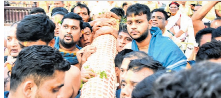
ଶ୍ରୀବକ୍ତବ୍ୟ, ମା' ସୁଭଦ୍ରା ଓ ଶ୍ରୀରାଧିକାଙ୍କ ରଥକୁ ପହଞ୍ଚି ବିଜେ ।