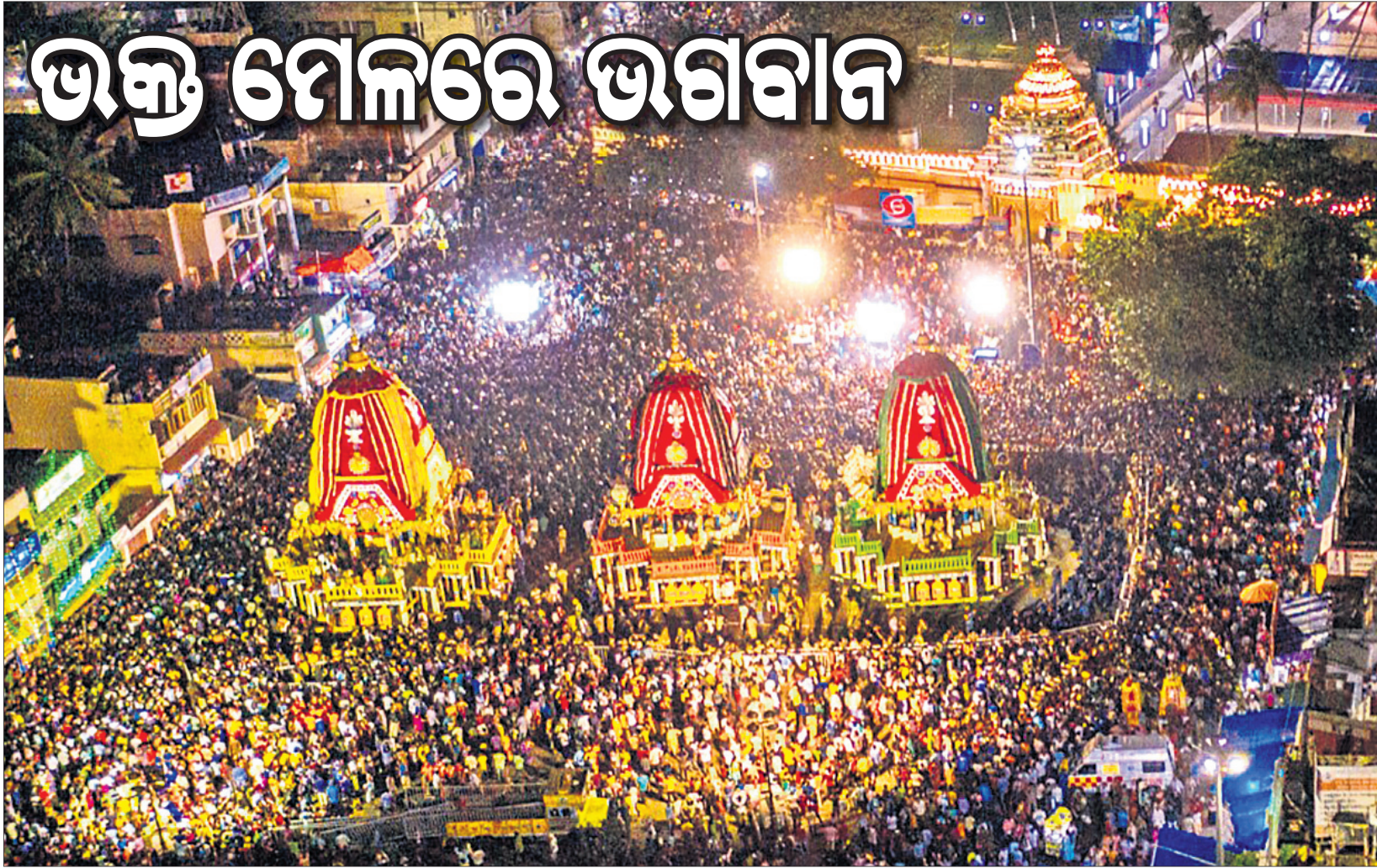
ପୁରୀ ଶ୍ରୀରାଧିକା ମନ୍ଦିର ସମ୍ମୁଖରେ ତିନିରଥ ।