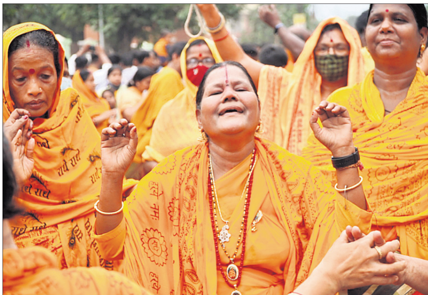
ମହିଳା ଭକ୍ତମାନେ ସଂକୀର୍ତ୍ତନ ପରିବେଷଣ କରୁଛନ୍ତି ।