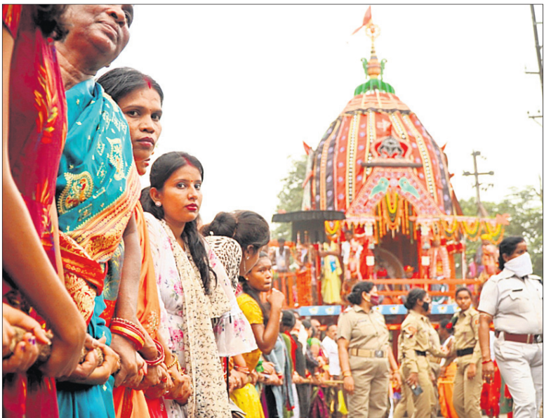
ଅନୁଗୋଳ ଶୈଳଶ୍ରୀକ୍ଷେତ୍ରରେ ସୁଭଦ୍ରାଙ୍କ ରଥକୁ ମହିଳାମାନେ ଚାଣ୍ଡିଛନ୍ତି ।