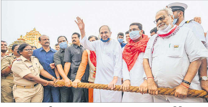
ପୁରୀ ଅର୍ପିତ, ୧।୭

ମୁଖ୍ୟମନ୍ତ୍ରୀ ନବୀନ ପଟ୍ଟନାୟକ ଶ୍ରଦ୍ଧାଘାଟିରେ ରଥାଚାରଣ ପହଞ୍ଚିବାରୁ ଦର୍ଶନ କରିବା ସହ ରଥ ଚାଣ୍ଡିଲେ । ମୁଖ୍ୟମନ୍ତ୍ରୀ ବିଦେଶ ଗସ୍ତରୁ ଫେରିବା ପରେ ପୁରୀରୁ ବନ୍ଦ୍ୟା ନ୍ୟାସରେ ପୁରୀରେ ପହଞ୍ଚିଥିଲେ । ସେ ଘୋଷଯାତ୍ରା ଦେଖିବା ସହ ନନ୍ଦିଘୋଷ ରଥ ନିକଟକୁ ଆସି ରଥ ଚାଣ୍ଡିଲେ । ସେ ଭକ୍ତମାନଙ୍କୁ ହାତ ହଲାଇ ଶୁଭେଚ୍ଛା ଜଣାଇଥିଲେ । ତାଙ୍କ ସହିତ ରାଜ୍ୟପାଳ