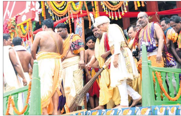
ତାଳଧ୍ୱଜ ରଥରେ ଗଜପତି ମହାରାଜା ବିଦ୍ୟାବିଂହ ଦେବଙ୍କ ଛେରାପହରା ।