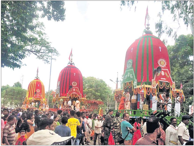
କୋରାପୁଟ ଶ୍ରୀବର ଶ୍ରୀକ୍ଷେତ୍ରରେ ରଥଯାତ୍ରା ।