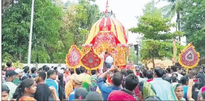
ଶ୍ରଦ୍ଧାଳୁମାନେ ରଥକୁ ଗଣି ନେଉଛନ୍ତି।

ବାଲେଶ୍ୱର ଜିଲ୍ଲା ଚଢ଼ୁଆ ବାଲ ଗୋପାଳପୁର ଶିଳ୍ପାଳୟ ଇମାମାନଗର ଜଗନ୍ନାଥ ମନ୍ଦିରରେ ରଥଯାତ୍ରା ଶୁକ୍ରବାର ପାଳିତ ହୋଇଛି। ମହାପ୍ରଭୁ ଶ୍ରୀଜଗନ୍ନାଥ ଭାଇ ଭଉଣୀ ଓ ସୁଦର୍ଶନଙ୍କ ଗହଣରେ ରଥାଚାରଣ ହୋଇ ଗୁଣ୍ଡିଚା ମନ୍ଦିରକୁ ବିଜେ କରାଯାଇଛି। ଭକ୍ତମାନେ ରଥକୁ ଭିଡ଼ି ଗୁଣ୍ଡିଚା ମନ୍ଦିରରେ ପହଞ୍ଚାଇଥିଲେ।