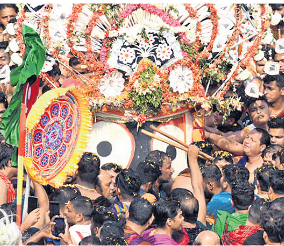
ଶ୍ରୀଜଗନ୍ନାଥ ମହାପ୍ରଭୁଙ୍କୁ ରଥକୁ ପହଞ୍ଚି ବିଜେ କରାଯାଉଛି।