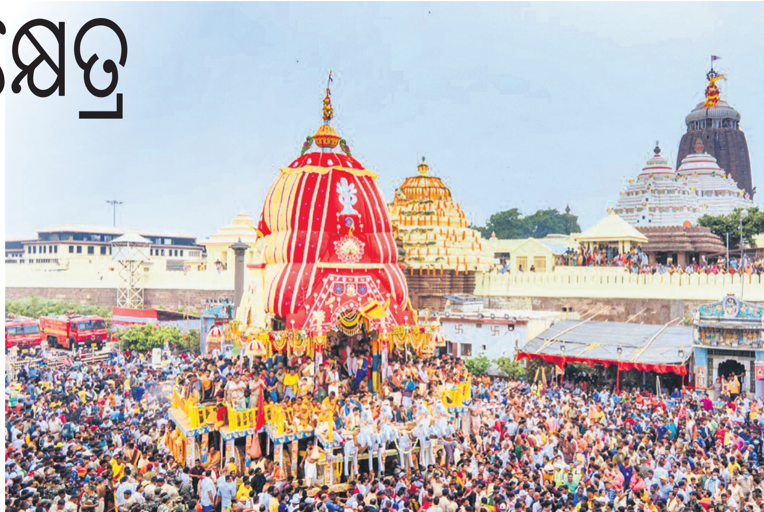
ଶ୍ରୀମନ୍ଦିର ସମ୍ମୁଖରୁ ନନ୍ଦିଘୋଷ ରଥକୁ ଭକ୍ତମାନେ ଚାଣି ନେଉଛନ୍ତି।