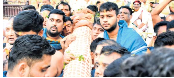
ଶ୍ରୀବଳଭଦ୍ର, ମା' ସୁଭଦ୍ରା ଓ ଶ୍ରୀସୁଦର୍ଶନଙ୍କ ରଥକୁ ପହଞ୍ଚି ବିଜେ ।