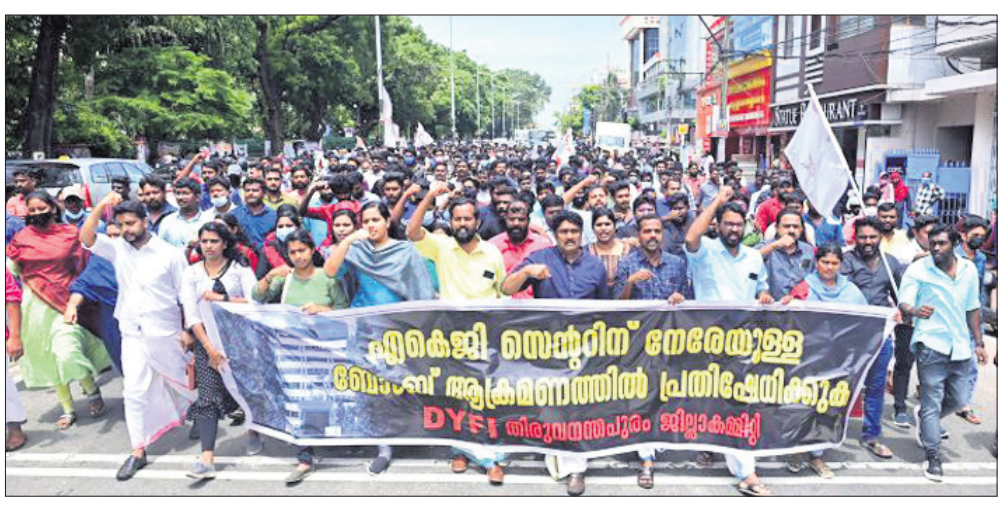
ଅନୁଭବପୁରସ୍ଥିତ ସିପିଆଇ(ଏମ୍) ରାଜ୍ୟ ମୁଖ୍ୟମନ୍ତ୍ରୀ ଉପରେ ଆକ୍ରମଣ ଘଟଣାକୁ ବିରୋଧ କରି ଡିଏମ୍‌ଏଫ୍‌ଆଇ ପକ୍ଷରୁ ଶୁକ୍ରବାର ବିକ୍ଷୋଭ ପ୍ରଦର୍ଶନ ।