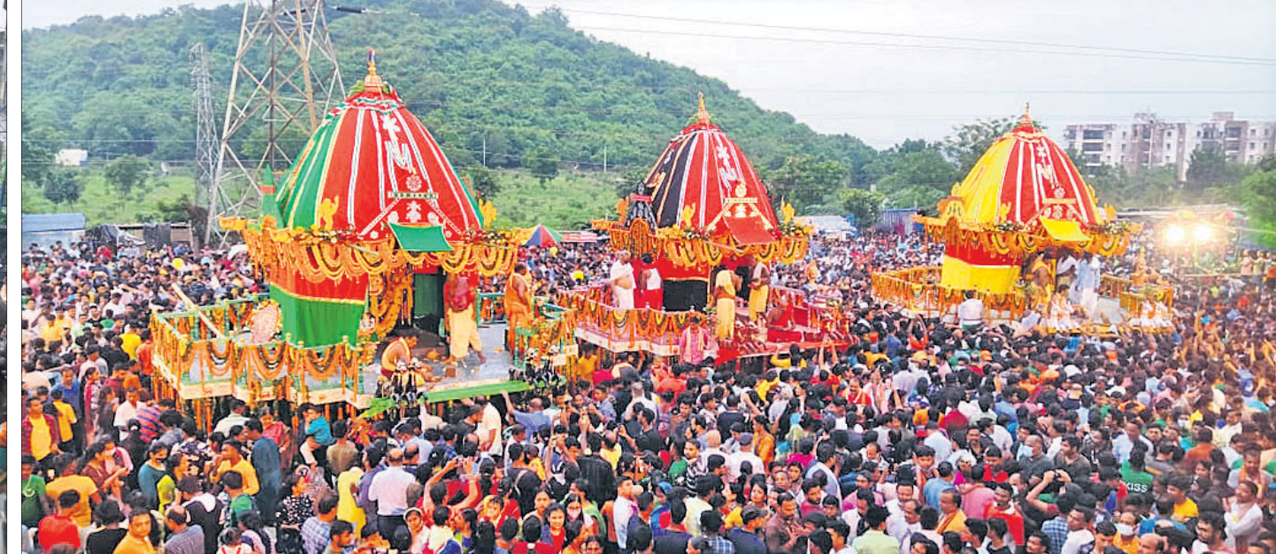
ଭୁବନେଶ୍ୱରରେ ଶ୍ରୀବାଣୀ କ୍ଷେତ୍ର ବିଧି କରାଯାଇ ମନ୍ଦିରରେ ଅନୁଷ୍ଠିତ ରଥଯାତ୍ରା ।