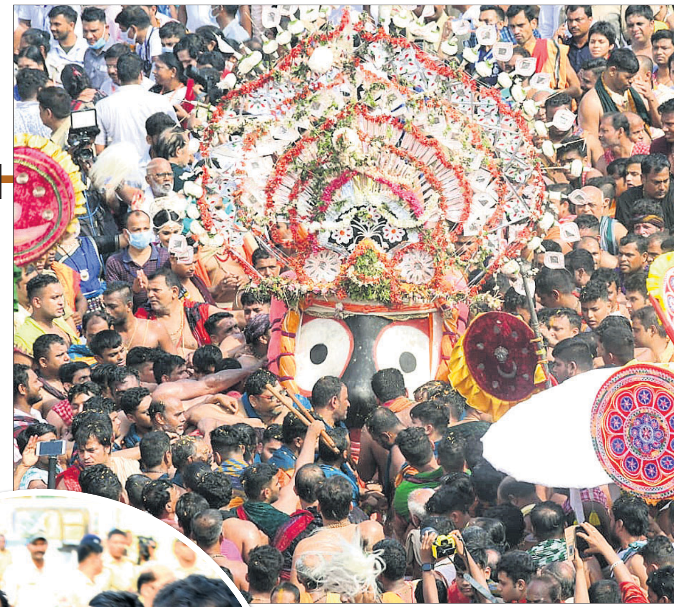
ଧାଡ଼ି ପଦ୍ମରେ ରଥକୁ ବିକେ ହେଉଛି ମହାପ୍ରଭୁ ଶ୍ରୀନରାୟଣ, ଶ୍ରୀନରାୟଣ, ମା'ସୁଭଦ୍ରା ଓ ଶ୍ରୀସୁଭର୍ଗନ ।