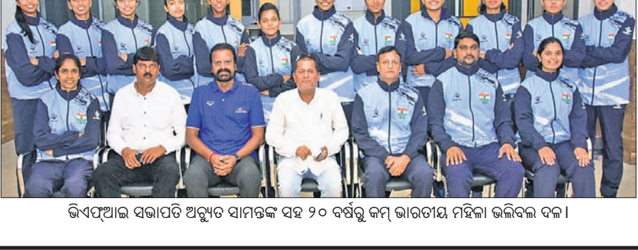
ଭିଏପିଆଇ ସହାୟତାରେ ସମ୍ପାଦକ ସହ ୨୦ ବର୍ଷରୁ କମ୍ ଭାରତୀୟ ମହିଳା ଭଲିବଲ୍ ଦଳ।