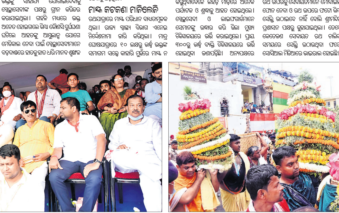
ପୁରୀ ରଥଯାତ୍ରା ଅବସରରେ ବିଭିନ୍ନ ବିଭାଗର ମନ୍ତ୍ରୀ ଏବଂ ଅନ୍ୟମାନେ ।