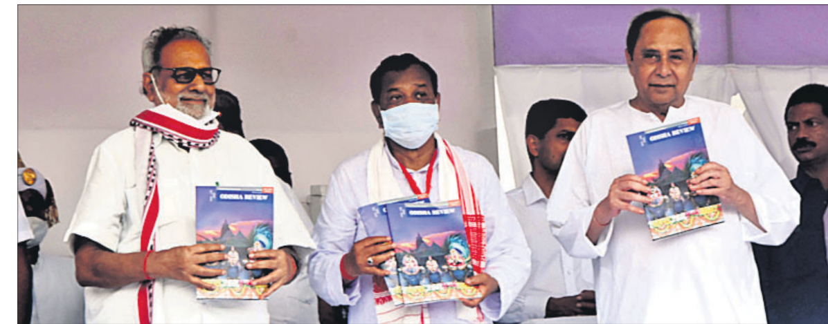
ରାଜ୍ୟପାଳ ପ୍ରଫେସର ଗଣେଶା ଲାଲ, ମୁଖ୍ୟମନ୍ତ୍ରୀ ନବୀନ ପଟ୍ଟନାୟକ ଏବଂ ପୁରୀ ଓ ଲୋକ ସମ୍ପର୍କ ମନ୍ତ୍ରୀ ପ୍ରଦୀପ ଅନାତ 'ଭକ୍ତ ରିଭ୍ୟୁ'କୁ ଲୋକାର୍ପଣ କରୁଛନ୍ତି ।