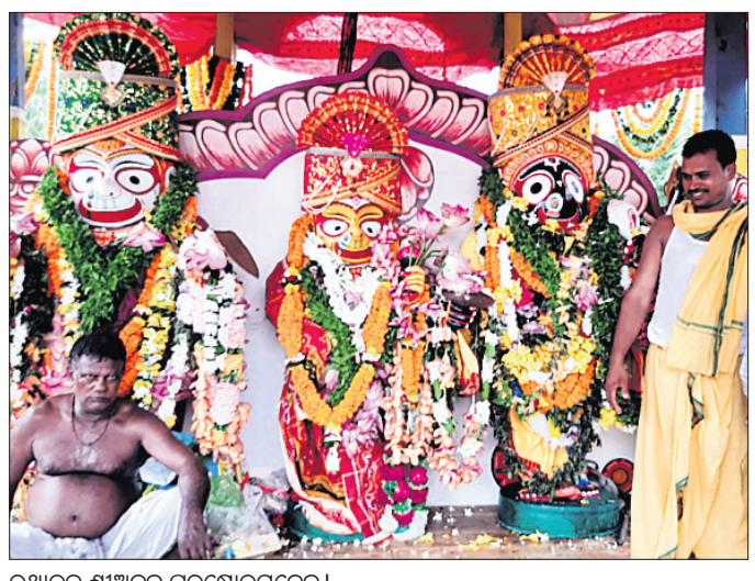
ରଥାଗୁଡ଼ ଶ୍ରୀଅନନ୍ତ ପୁରୁଷୋତ୍ତମଦେବ।

ପୁରୀ ବର୍ଷ ପରେ ଭକ୍ତ ଓ ଭଗବାନଙ୍କ ମଧ୍ୟରେ ହୋଇଥିଲା ମହାନିକନ। ଶୁକ୍ରବାର ଖୋର୍ଦ୍ଧା ଜାଗାପାଟଣାସ୍ଥିତ ଶ୍ରୀଅନନ୍ତ ପୁରୁଷୋତ୍ତମ (ପୂର୍ଣ୍ଣବିଗ୍ରହ)ଙ୍କ ରଥଯାତ୍ରାରେ ୫୦ ହଜାରରୁ ଊର୍ଦ୍ଧ୍ୱ ଶ୍ରଦ୍ଧାଳୁଙ୍କ ସମାଗମ ହୋଇଥିଲା। ଭକ୍ତଙ୍କ ଗହଣରେ ଗୁଣ୍ଡିଚା ମନ୍ଦିର ଅଭିମୁଖେ ବାହାରିଥିଲେ ଶ୍ରୀଜୀଉ। ଶ୍ରୀ ଅନନ୍ତପୁରୁଷୋତ୍ତମ(ଶ୍ରୀଜଗନ୍ନାଥ)ଙ୍କ ବଡ଼ଭାଇ ବଳଭଦ୍ର ଓ ଦେବୀ ସୁଭଦ୍ରାଙ୍କୁ ସାଙ୍ଗରେ ଧରି ଗୋଟିଏ ରଥରେ ରଥାଗୁଡ଼ ହୋଇ ଭକ୍ତଙ୍କୁ ଦର୍ଶନ ଦେଇଥିଲେ। ଏହି ଦେବ ଦୁଇଭାଉଁଶ ଦର୍ଶନ ଲାଗି ଜାଗାପାଟଣା ଲୋକାରଖ୍ୟ ହୋଇ ପଡ଼ିଥିଲା। ଘଣ୍ଟ, କାହାଳୀ, ମୃଦଙ୍ଗ, ହୁଳହୁଳି, ଜୟ ଜୟକାରରେ କମ୍ପିତ୍ୟା ପରିବେଶ। ସୃଷ୍ଟି ହୋଇଥିଲା ଏକ ଆଧ୍ୟାତ୍ମିକ ପରିବେଶ। ସନ୍ଧ୍ୟା ୬ଟା ସୁଦ୍ଧା ଠାକୁର ଗୁଣ୍ଡିଚା ମନ୍ଦିରରେ ପହଞ୍ଚିଥିଲେ।