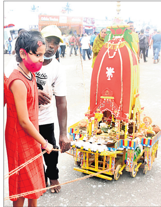
ପୁରୀ ସହରରେ ପିଲାମାନଙ୍କ କୁନିରଥ ।