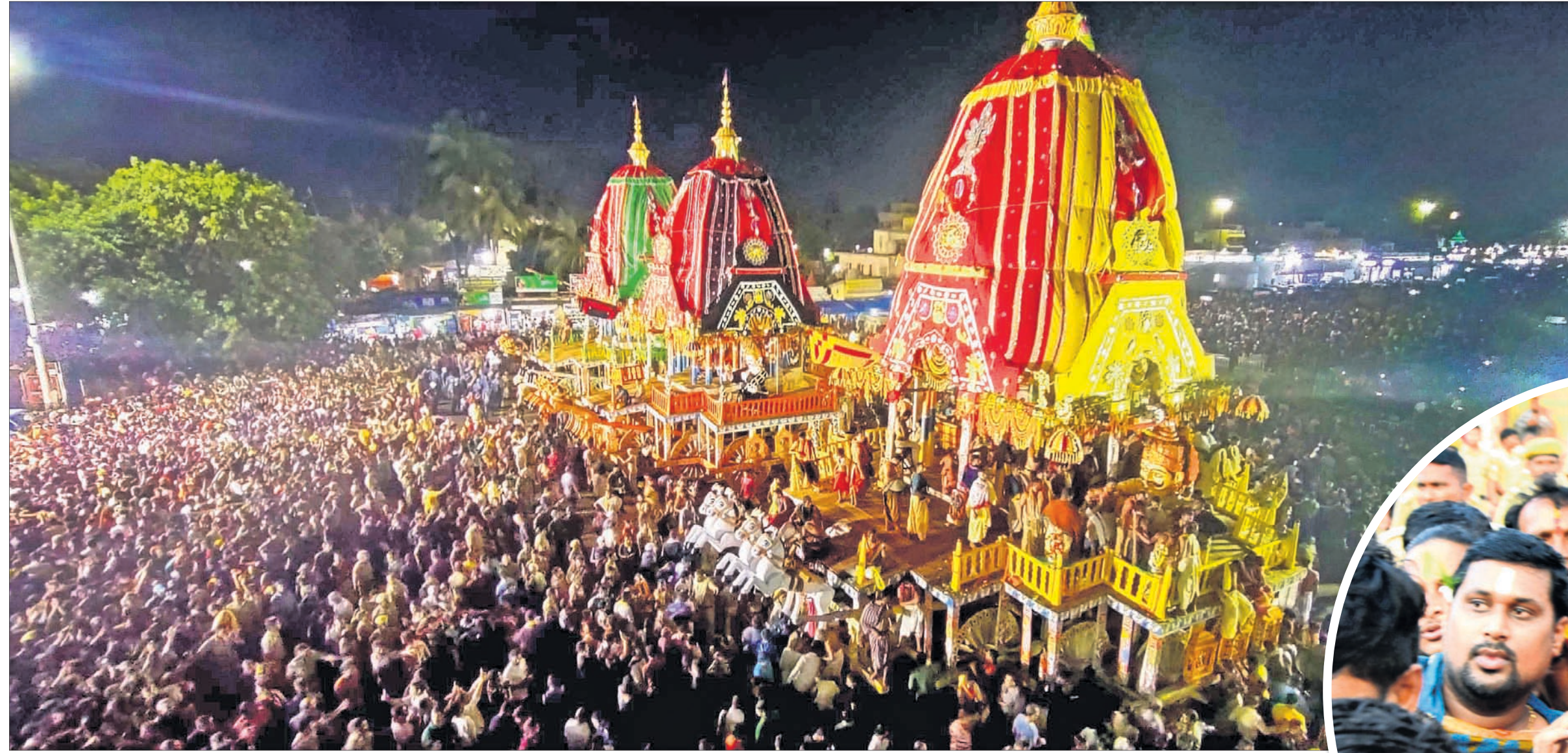
ଶରଧାବାରିରେ ଭକ୍ତ ସମୁଦ୍ରରେ ଚଳି ରଥ ।