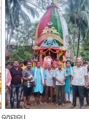
ବାଙ୍କୀ ଚର୍ଚ୍ଚକାଳ ପୀଠ, ତିରିଆ ଶୁଣ୍ଠିପାଳସ୍ଥିତ ବଧୂବାନନ ଜାଉଳ ସମେତ ସାଲେପୁର ଓ ମହାଙ୍ଗାରେ ଆୟୋଜିତ ରଥଯାତ୍ରା।

ଆଜି କ'ଣ କେଉଁଠି କଟକ • ଭାଗବତ ଗାଦିକ ପ୍ରଥମ ବାର୍ଷିକ ଉତ୍ସବ, ଭାଗବତ ଗାଦି ବଡ଼ମାଞ୍ଚ, ଧବଳେଶ୍ୱରଗଡ଼ା, ସକାଳ ୯ଟା ୧୫। • ସିଏମ୍‌ସି ପକ୍ଷରୁ ବନ ମହୋତ୍ସବ, ରେଭେନ୍‌ସା କଲିଜିଏଟ ସ୍କୁଲ ପରିସର, ପୂର୍ବାହ୍ଣ ୧୧ଟା। • ଏଇ ଆମ ସହର ପକ୍ଷରୁ ପ୍ରମାଣିକ ପୁସ୍ତକ 'ବାଗୁଣ ଅନୁଭୂତି'ର ଲୋକାର୍ପଣ ଉତ୍ସବ, ପଞ୍ଚା ମେଡିକାଲ ସେଣ୍ଟର, କେଶରୀପୁର, ସନ୍ଧ୍ୟା ୬ଟା।