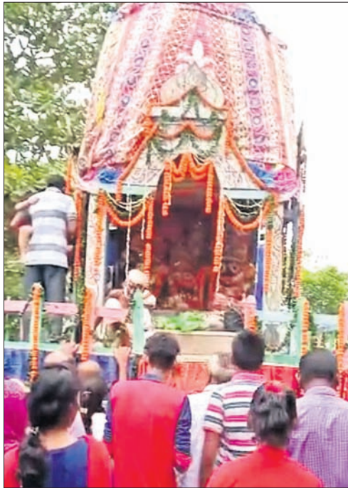
ଅସ୍ତରଙ୍ଗର ବରଡିହାଠାରେ ଶ୍ରୀକ୍ଷୀମାନେ ଠାକୁରଙ୍କୁ ଦର୍ଶନ କରୁଛନ୍ତି ।

ହରିବୋଲ ଛୁଇଁହୋଇ ଧୂନରେ ପ୍ରକାଶିତ ହୋଇଉଠିଥିଲା। କୋଣାର୍କ(ଡି.ଏନ୍.ଏ.)- କୋଣାର୍କସ୍ଥିତ ହୋଇଛି। ବିଶେଷକରି କୁନି ପିଲାମାନେ ରଥଚୋରଣର କାର୍ଯ୍ୟରେ ରଥ ନିର୍ମାଣ କରି ସେଥି ମଧ୍ୟରେ ଶ୍ରୀକବୀର, ବଳଭଦ୍ର, ସୁଭଦ୍ରାଙ୍କ ପଟୋଟିରୁ ରଥ ପୁଷ୍ପାୟା ଓ ଗ୍ରାମରେ ଚାଣିଥିଲେ। ସେହିପରି ଦୋକନା ଜଗନ୍ନାଥ ମନ୍ଦିରକୁ ମହାପ୍ରଭୁ ଜଗନ୍ନାଥଙ୍କ ରଥ ବାହାରି ୬କି.ମି. ଅତିକ୍ରମ କରି କଘାର ଛକରେ ଥିବା ମାଉସୀ ମା ମନ୍ଦିରରେ ପହଞ୍ଚିଥିଲେ। ରଥଟଣା ସମୟରେ ରାତ୍ରୀର ଭଉଁସ ପାର୍ଶ୍ୱରେ ଶହଶହ ଭକ୍ତ ଠିଆହୋଇ