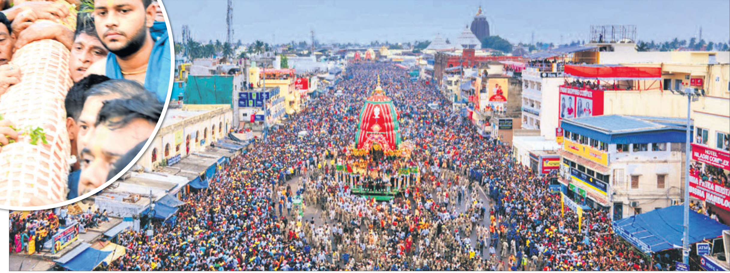
ପୁରୀ ବଡ଼ବାଣରେ ବନସମୁଦ୍ର ନ୍ୟରେ ରଥବଣା ।