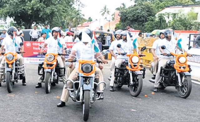
ଅନୁତ ମହୋତ୍ସବ ପାଳନ ପରିପ୍ରେକ୍ଷାରେ ଶୁକ୍ରବାର ଖୋର୍ଦ୍ଧାରୋଡ଼ ରେଳ ସୁରକ୍ଷା ବଳ ପକ୍ଷରୁ ବାହାରିଥିବା ବାଇକ୍ ଶୋଭାଯାତ୍ରା।