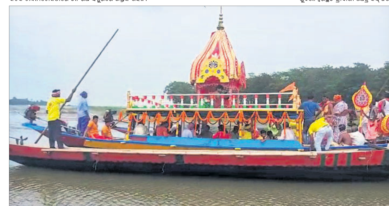
ମହାପ୍ରଭୁଙ୍କ ଅନ୍ୟତମ ଛାମାକ୍ଷେତ୍ର ବାଳଶରଣାପାଣ୍ଡିତ କରାଯାଇ ମନ୍ଦିର ଗୁମ୍ଫା ପକ୍ଷରୁ ଚିଲିକାରେ ବନ୍ଦାରେ ଅନୁଷ୍ଠିତ ରଥଯାତ୍ରା ।