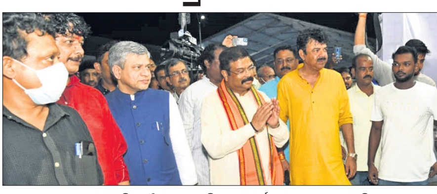
ରେଳମନ୍ତ୍ରୀ ଅଶ୍ୱିନୀ ବୈଷ୍ଣବ ଓ କେନ୍ଦ୍ର ଶିକ୍ଷାମନ୍ତ୍ରୀ ଧର୍ମେନ୍ଦ୍ର ପ୍ରଧାନ ସମୀକ୍ଷା କରୁଛନ୍ତି ।

ଭୁବନେଶ୍ୱର, ୧୬: ବିଶ୍ୱ ପ୍ରସିଦ୍ଧ ରଥଯାତ୍ରା ଅବସରରେ ବୁଲି ଦିଆ ଓଡ଼ିଶା ଗସ୍ତରେ ଆସିଥିବା କେନ୍ଦ୍ର ମନ୍ତ୍ରୀ ଧର୍ମେନ୍ଦ୍ର ପ୍ରଧାନ ଏବଂ ଅଶ୍ୱିନୀ ବୈଷ୍ଣବ ରଥଯାତ୍ରାରେ ସାମିଲ ହୋଇଥିଲେ । ଏହି ପରିପ୍ରେକ୍ଷାରେ ଉଭୟ କେନ୍ଦ୍ର ମନ୍ତ୍ରୀ ପୁରୀ ରେଳଷ୍ଟେଶନଠାରେ ପୂର୍ବତଟ ରେଳପଥ ପକ୍ଷରୁ ଚାର୍ଯ୍ୟଯାତ୍ରାମାନଙ୍କ ପାଇଁ ଆୟୋଜିତ ବିସ୍ତୃତ ରଥଯାତ୍ରା ପ୍ରସ୍ତୁତିକୁ ନିରୀକ୍ଷଣ କରିବା ସହ ରଥଯାତ୍ରା ସମୟରେ ଚାର୍ଯ୍ୟଯାତ୍ରାଙ୍କ ସୁବିଧାର ସମ୍ବୁଧିଯୋଗ କରିବାକୁ ରେଳ ଅଧିକାରୀମାନଙ୍କୁ ପରାମର୍ଶ ଦେଇଛନ୍ତି । ସେହିଭଳି ବୈଷ୍ଣବ ମଧ୍ୟ ସାଧାରଣ ଜନତା ତଥା ଚାର୍ଯ୍ୟଯାତ୍ରା ଏବଂ ସେମାନଙ୍କ ପରିବାରବର୍ଗଙ୍କୁ ଶୁଭେଚ୍ଛା ଜଣାଇବା ସହ ବହୁତ ଧୂସି ଏବଂ ସ୍ମରଣାୟ ରଥଯାତ୍ରାର