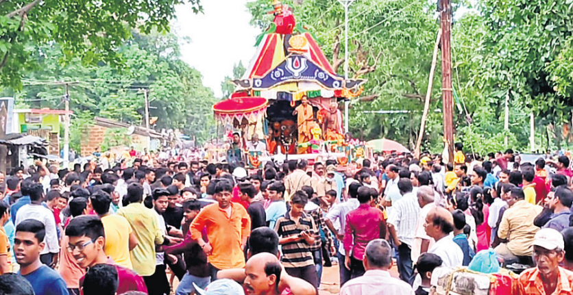
ବୋଲଗଡ଼ ତୃତୀୟାଦେବଙ୍କ ରଥକୁ ଶ୍ରଦ୍ଧାଳୁମାନେ ଚାଣୁଛନ୍ତି।