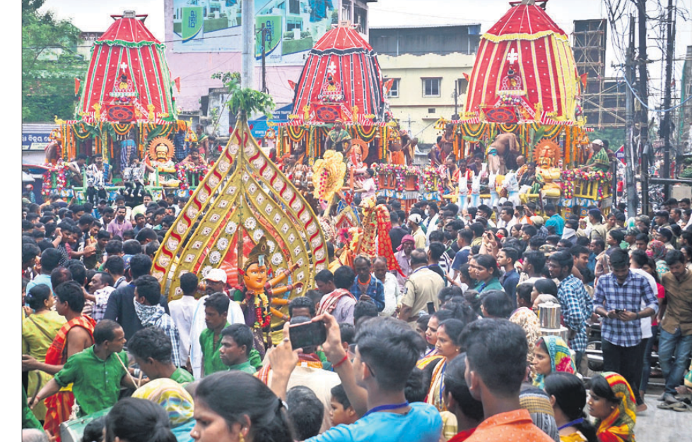
କଟକ ଚାଣିଲେ ଚାଣିଲେ ରଥ ସମ୍ମୁଖରେ ଭକ୍ତ ଗହଳି ।