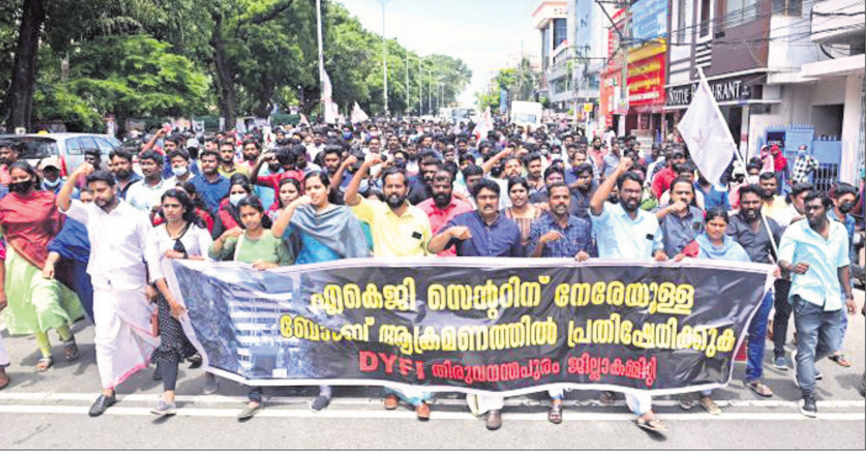
ଧୂଳିଆନଗରପୁରସ୍ଥିତ ସିପିଆଇ(ଏମ୍) ରାଜ୍ୟ ମୁଖ୍ୟମନ୍ତ୍ରୀ ଉପରେ ଆକ୍ରମଣ ଘଟଣାକୁ ବିରୋଧ କରି ଡିଏମ୍‌କେଏଫ୍‌ଆଇ ପକ୍ଷରୁ ଶୁକ୍ରବାର ବିରୋଧ ପ୍ରଦର୍ଶନ।