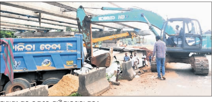
ଅସ୍ଥାୟୀ ଘର ଭଗ୍ନରେ ମାଡ଼ିଯାଇଥିବା ଟ୍ରକ୍।