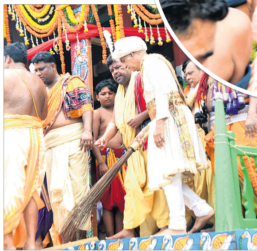
ଚାଳାଧିକ ରଥରେ ପୁରୀ ଗଡ଼ଜାତ ମହାରାଜା ଦିବ୍ୟସିଂହ ଦେବ ଛେରାପର୍ଯ୍ୟନ୍ତ କରୁଛନ୍ତି ।