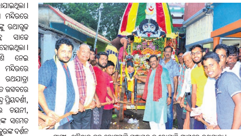
ଚାନ୍ଦିନୀ-ଚୌଦ୍ୱାର ବୁକ କୋଟସାହି ପଞ୍ଚାୟତ କର୍ମଚାରୀ ଗ୍ରାମରେ ରଥଯାତ୍ରା।