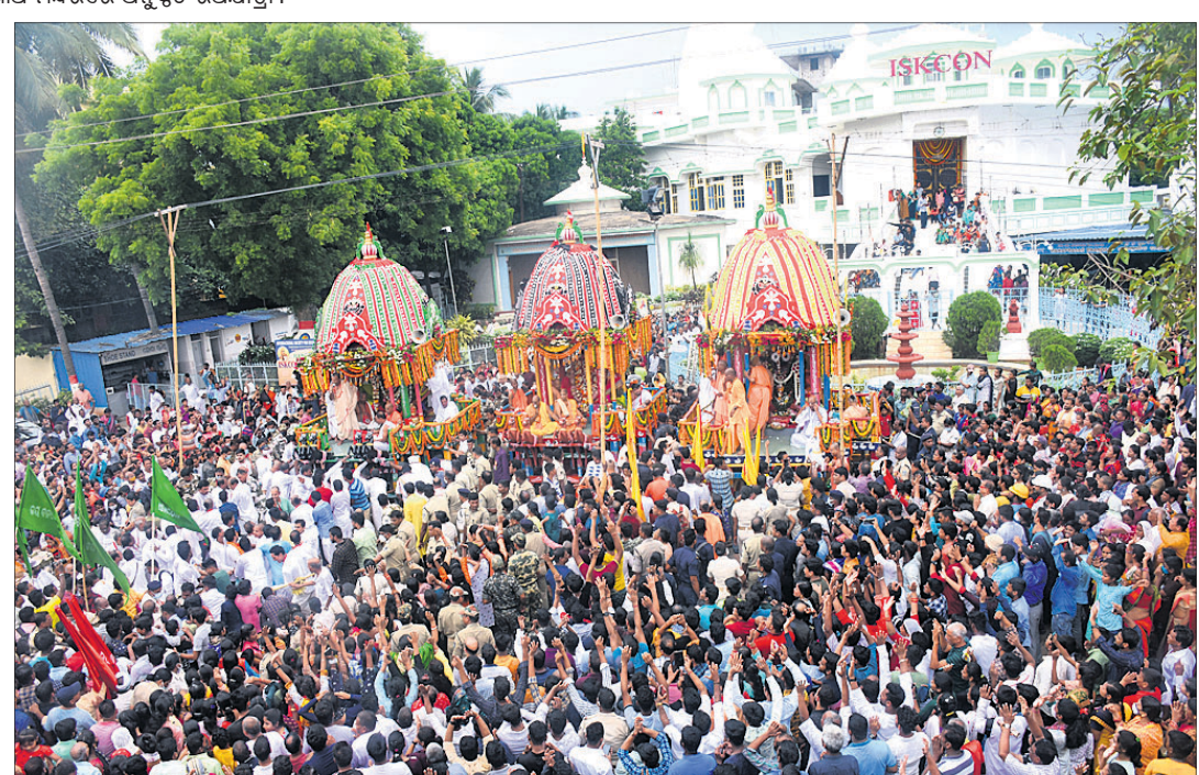
ଭୁବନେଶ୍ୱର ଭବନ ମନ୍ଦିର ସମ୍ମୁଖରୁ ବାହାରିଥିବା ଯା ରଥ ।