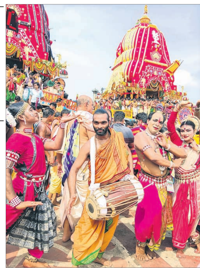
ରଥ ସମ୍ମୁଖରେ ଶିଳ୍ପୀମାନେ ନୃତ୍ୟ ପରିବେଷଣ କରୁଛନ୍ତି ।