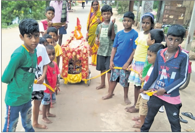
କଣାସଠାରେ ପିଲାମାନେ କୁନିରଥ ବାଣ୍ଟିଛନ୍ତି ।