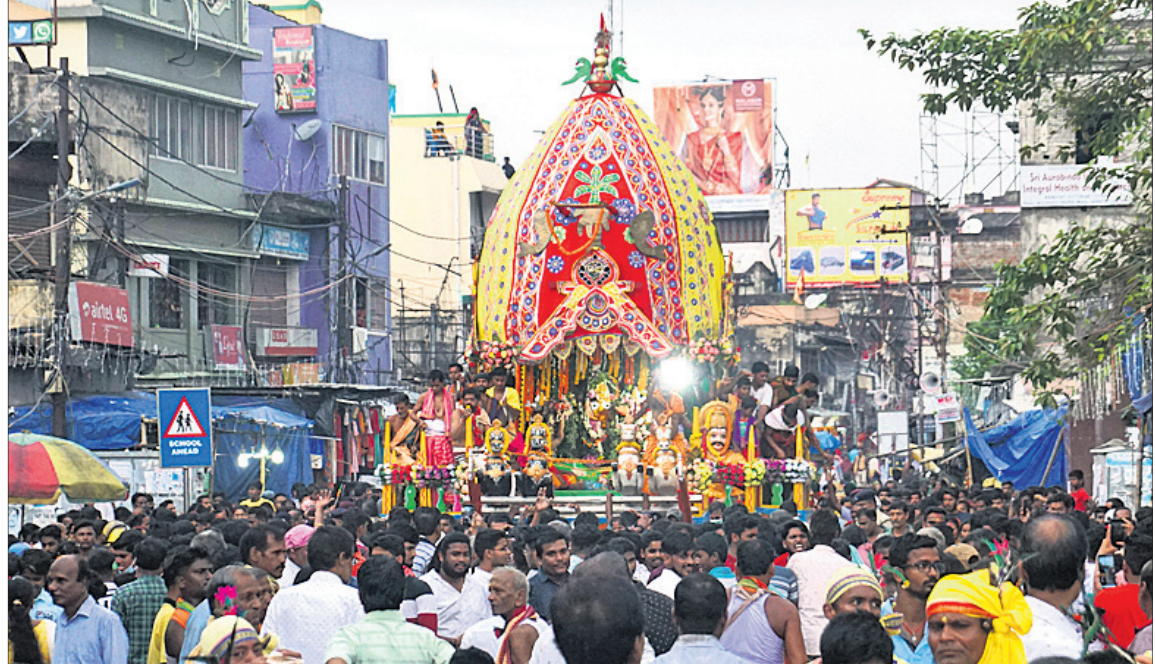
କଟକ ବୋକପୁଣ୍ୟାଳୟରେ ଦେବୀ ସୁଭଦ୍ରାଙ୍କ ରଥକୁ ମହିଳାମାନେ ଚାଣୁଛନ୍ତି।