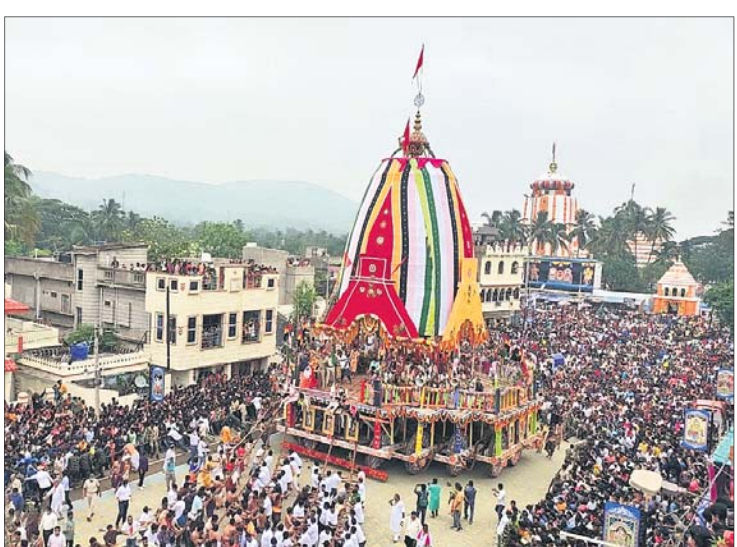
କେନ୍ଦୁଝର ବନଦେବଜୀଉଙ୍କ ରଥକୁ ଚାଣୁଛନ୍ତି ଭକ୍ତ ।