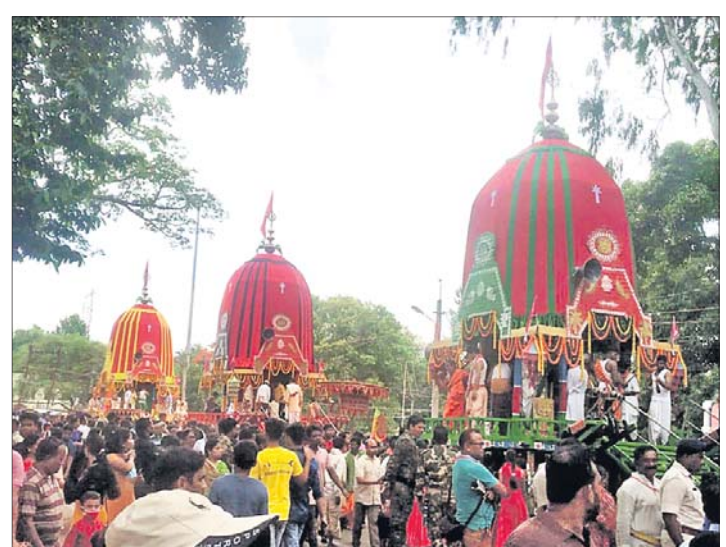
କୋରାପୁଟ ଶାବର ଶ୍ରୀକ୍ଷେତ୍ରରେ ରଥଯାତ୍ରା ।