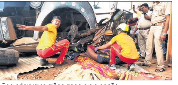
ଅଗ୍ନିଶମ କର୍ମଚାରୀମାନେ ଗାଡ଼ିତଳୁ ମୃତକଙ୍କୁ ବାହାର କରୁଛନ୍ତି।