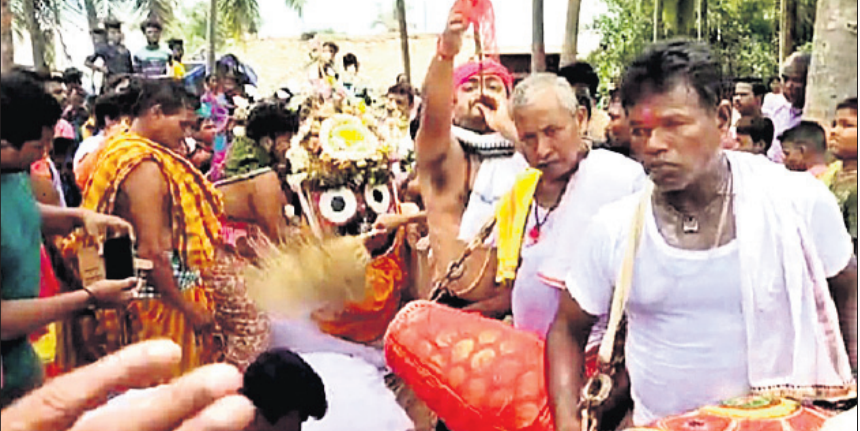
ନିବାକାରପୁର: ଠାକୁରଙ୍କୁ ପହଞ୍ଚିବେ ରଥକୁ ନିଆଯାଇଛି।