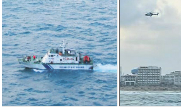
ପାଟ୍ଟୋଲିଂ ଜାହାଜ ଓ ତୋନିୟର ଏୟାରକ୍ରାଫ୍ଟ ଯୋଗେ ପୁରୀରୁ ବ୍ୟବସ୍ଥା ଯାଞ୍ଚ କରାଯାଇଛି ।

ପାଟ୍ଟୋଲିଂ ଜାହାଜ ଓ ତୋନିୟର ଏୟାରକ୍ରାଫ୍ଟ ଯୋଗେ ପୁରୀରୁ ବ୍ୟବସ୍ଥା ଯାଞ୍ଚ କରାଯାଇଛି । ପାଟ୍ଟୋଲିଂ ଜାହାଜ, ୧୬(ସ.ପ୍ର.) ଓଡ଼ିଶାର ପ୍ରସିଦ୍ଧ ରଥଯାତ୍ରା ମହୋତ୍ସବ ପୂରୀ ପାଇଁ ଓଡ଼ିଶା କୋଷ୍ଟଗାର୍ଡ ମୁଖ୍ୟାଳୟ ପାରାଦୀପ ପକ୍ଷରୁ ସ୍ୱତନ୍ତ୍ର ସୁରକ୍ଷା ବ୍ୟବସ୍ଥା କରାଯାଇଛି । ଏନେଇ ଜୁଲାଇ ୧୧ ତାରିଖ ପର୍ଯ୍ୟନ୍ତ ପୂରୀ ସମୁଦ୍ର ଉପକୂଳରେ ଏକ ପାଟ୍ଟୋଲିଂ ଜାହାଜ ଓ ତୋନିୟର ଏୟାରକ୍ରାଫ୍ଟ ମୁତୟନ କରାଯାଇ ୨୪ ଘଣ୍ଟା ଯାଞ୍ଚ କରାଯାଉଛି ବୋଲି କୋଷ୍ଟଗାର୍ଡ ପକ୍ଷରୁ ପୂର୍ବନା ମିଳିଛି । ଏଥିପାଇଁ ରାଜ୍ୟ ପ୍ରଶାସନ ସହ ସମସ୍ତ ପ୍ରକାର ଯୋଗାଯୋଗ ରହିଛି । ରଥଯାତ୍ରା ସମୟରେ ପୂରୀ ଅତି ସମୟଦନଶୀଳ ଗ୍ଲାନ ହୋଇଥିବାରୁ କୋଷ୍ଟଗାର୍ଡ ପକ୍ଷରୁ ଉପକୂଳବର୍ତ୍ତୀ ଅଞ୍ଚଳ ପାଇଁ ସଚେତନତାକୁ ପଦକ୍ଷେପ ନିଆଯାଇଛି ।