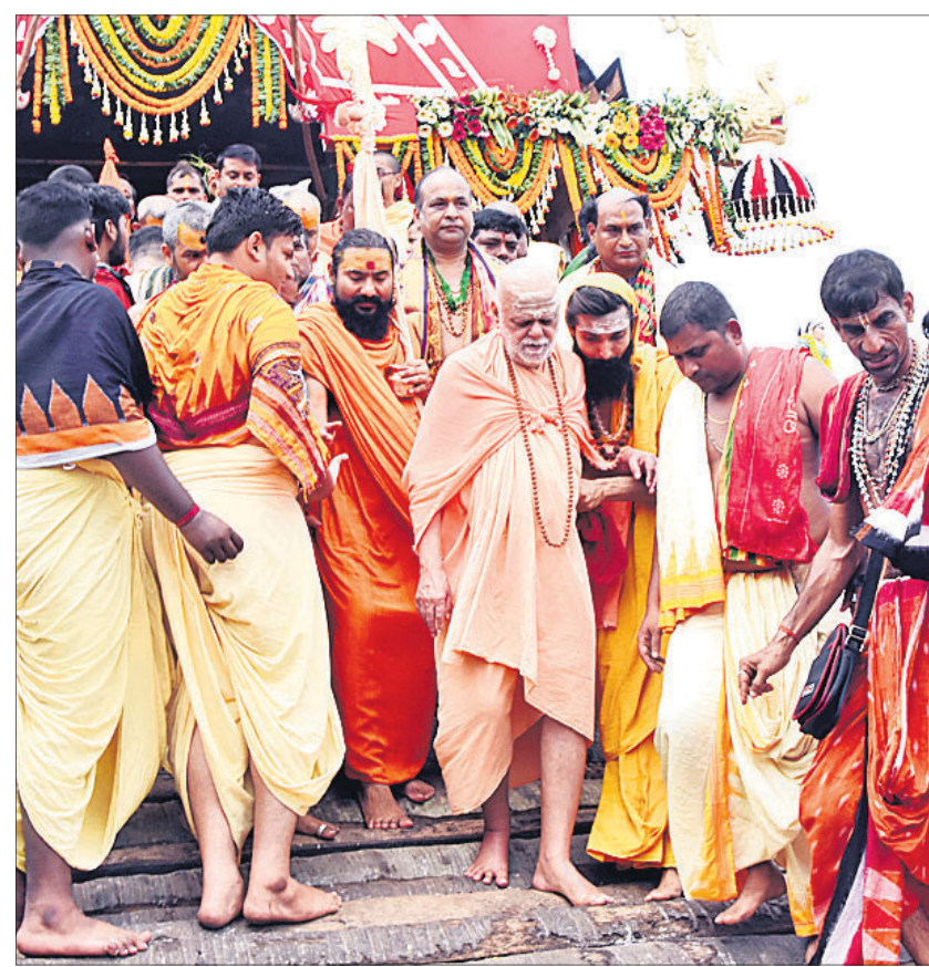
କରଦ୍ୱାରୁ ଶଙ୍କରାଚାର୍ଯ୍ୟ ସାମା ନିୟୋଜନ ସମ୍ପର୍କୀୟ ରଥାରୁ ଚାଲୁଥିବା ବର୍ଷକ ଜିମି ଫୋଟୁଛି ।