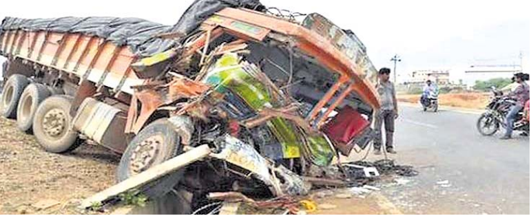
ଯାଜପୁର ଅଫିସ, ୩୩୭

ପ୍ରତିବର୍ଷ ମୋଟରଯାନ(ଏମ୍ଭି) ମାମଲାରେ ଆବାୟ ହେଉଥିବା ଜରିମାନାକୁ ୨୦% ଅର୍ଥ ବିଭିନ୍ନ ସଡ଼କ ସୁରକ୍ଷା କାର୍ଯ୍ୟକ୍ରମରେ ବିନିଯୋଗ କରାଯାଇଛି। ଏହି କ୍ରମରେ ୨୦୨୧ ସେପ୍ଟେମ୍ବର ୧୧ ୨୦୨୨ ମେ ୩୧ ପର୍ଯ୍ୟନ୍ତ ୧୧ କୋଟି ୪ ଲକ୍ଷ ୬୨ ହଜାର ୧୩୯ ଟଙ୍କା ଖର୍ଚ୍ଚ କରାଯାଇଛି। ଏହି ବିନିଯୋଗ ଅର୍ଥକୁ ଫଣ୍ଡ ମ୍ୟାନେଜମେଣ୍ଟ କମିଟି ପକ୍ଷରୁ ମଞ୍ଜୁର କରାଯାଇଛି। ହେଲେ ଓଡ଼ିଶାର ସିଆଇଟି ଓ ଜାଲମଗାଣିର ରିପୋର୍ଟ ଅନୁଯାୟୀ ରାଜ୍ୟରେ ୨୦୨୦ ଅପ୍ରେଲ ୨୦୨୧ରେ ଦୁର୍ଘଟଣା ଜନିତ ମୃତ୍ୟୁହାର ୭.୨୪% ବୃଦ୍ଧି ପାଇଛି। ୨୦୨୦ରେ ଦୁର୍ଘଟଣାଜନିତ ମୃତ୍ୟୁସଂଖ୍ୟା ୪୭୩୮ ରହିଥିଲାବେଳେ ୨୦୨୧ରେ ତାହା ୫୦୮୧ରେ ପହଞ୍ଚିଛି। ଚେଣୁ ବାଣିଜ୍ୟ ଓ ପରିବହନ ବିଭାଗ ପକ୍ଷରୁ ସମସ୍ତ ଜିଲାପାଳଙ୍କୁ କାର୍ଯ୍ୟକ ଦୁର୍ଘଟଣାଜନିତ ମୃତ୍ୟୁ ସଂଖ୍ୟା ବୃଦ୍ଧି ପାଇଛି ସେ ନେଇ ଗତ ଏପ୍ରିଲରେ ଜବାବ ଡିଲିଭର ହୋଇଥିଲା। ସୁପ୍ରିମକୋର୍ଟ ସଡ଼କ ସୁରକ୍ଷା କମିଟି ଓଡ଼ିଶାରେ ୨୦୨୦ ସୁଦ୍ଧା ସଡ଼କ ସୁରକ୍ଷା ମୁଦ୍ଦାହାରକୁ ୫୦ପ୍ରତିଶତ ହ୍ରାସ କରିବାକୁ ନିର୍ଦ୍ଦେଶ ଦେଇଥିଲେ। କିନ୍ତୁ ଦୁର୍ଘଟଣାଜନିତ ମୃତ୍ୟୁ ସଂଖ୍ୟା ୨୯% ବୃଦ୍ଧି ପାଇଛି। ଏଥିରୁ ଉପରୋକ୍ତ ବିପ୍ଳବ ଅର୍ଥର ଠିକ ବିନିଯୋଗ