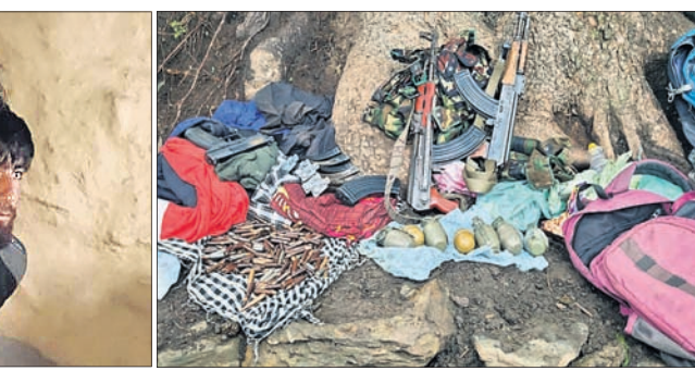
ଆତଙ୍କବାଦୀ ଅଲିଦ୍ ହୁସେନ୍ ଶାହ ଓ ତାଙ୍କ ସହଯୋଗୀ। ଆତଙ୍କବାଦୀଙ୍କଠାରୁ ଜବତ ଅସ୍ତ୍ରଶସ୍ତ୍ର।