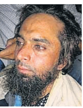
ଗିରଫ ୨ ଅଭିଯୁକ୍ତ।