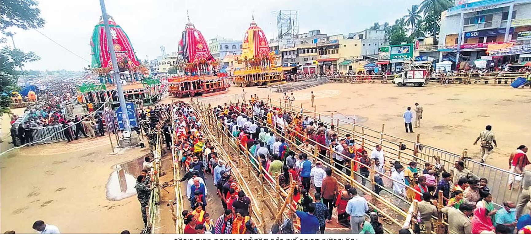
ରବିବାର ଆଡ଼ପ ମଞ୍ଚପରେ ବହୁଖାମୁରିକ ଦର୍ଶନ ପାଇଁ ଶ୍ରଦ୍ଧାଳୁଙ୍କ ଲାଗିଥିବା ଭିଡ଼।