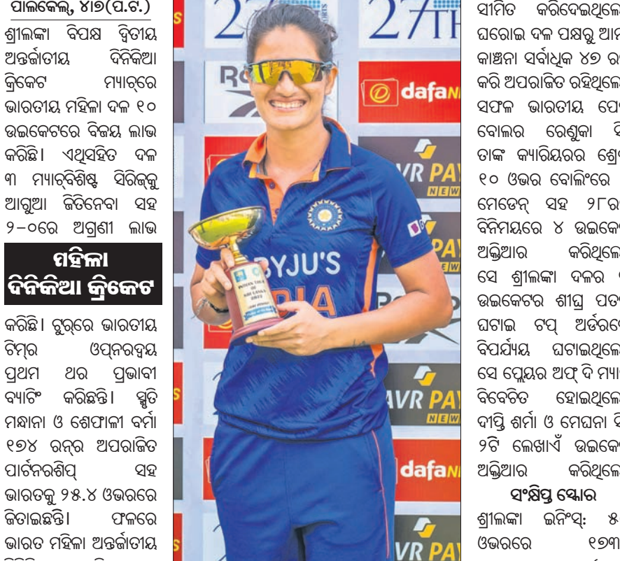
ସୁନୀଲ ଅର୍ଦ୍ଧ ମ୍ୟାଚ୍ ରେଣୁକା ସିଂ

ଫାମିଟ୍ କରିଦେଇଥିଲେ। ଯଦେଇ ଦଳ ପକ୍ଷରୁ ଆମା କାଞ୍ଚନା ସର୍ବାଧିକ ୪୬ ରନ୍ କରି ଅପରାଜିତ ରହିଥିଲେ। ସଫଳ ଭାରତୀୟ ପେସ୍ ବୋଲର ରେଣୁକା ସିଂ ଚାକ୍ କ୍ୟାରିୟରର ଶ୍ରେଷ୍ଠ ୧୦ ଓଭର ବୋଲିଂରେ ୧୧ ରେଟ୍ରେ ସହ ୨୮ରନ୍ ବିନାୟରେ ୪ ରଜକେଟ ଅଭିଆର କରିଥିଲେ। ସେ ଶ୍ରୀଲଙ୍କା ଦଳର ୩ ରଜକେଟର ଶ୍ରୀମୁଖ ପତନ ଘଟାଇ ଚପ୍ ଅର୍ଦ୍ଧରେ ବିପର୍ଯ୍ୟୟ ଘଟାଇଥିଲେ। ସେ ଫ୍ଲୋଇଡ୍ ଅର୍ଦ୍ଧ ମ୍ୟାଚ୍ ବିବେଚିତ ହୋଇଥିଲେ। ଦାସ୍ତ୍ରୀ ଶର୍ମା ଓ ମେଘନା ସିଂ ୨ଟି ଲେଖାଏଁ ଉଇକେଟ ଅଭିଆର କରିଥିଲେ।