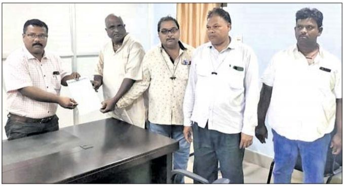
ସଂଘ ପକ୍ଷରୁ ଦାବିପତ୍ର ପ୍ରଦାନ। ଛାତ୍ରାଛାତ୍ରୀଙ୍କୁ ମଧ୍ୟାହ୍ନ ଭୋଜନ ବନ୍ଧନର ଆକମ୍ପନ ଖାଦ୍ୟସାମଗ୍ରୀ ପ୍ରେରଣ, ଆକମ୍ପନ ମୂଲ୍ୟବରଣ କରିଥିବା

ବ୍ରହ୍ମପୁର ସରକାରୀ ସୁଲଭ ମୂଲ୍ୟ ବିକ୍ରେତା ସଂଘ ପକ୍ଷରୁ ସୋମବାର ୭ ଦିନୀ ସମ୍ବଳିତ ଏକ ଦାବିପତ୍ର ଖାଦ୍ୟ ଯୋଗାଣ ମନ୍ତ୍ରୀଙ୍କ ଉଦ୍ଦେଶ୍ୟରେ ବ୍ରହ୍ମପୁର ମହାନଗର ନିଗମ(ବିଏମଏ) କମିଶନର ଓ ବ୍ରହ୍ମପୁର ଉପଜିଲ୍ଲାପାଳଙ୍କୁ ପ୍ରଦାନ କରାଯାଇଛି। ଦାବିପତ୍ରର ମଧ୍ୟରେ ପ୍ରଧାନମନ୍ତ୍ରୀ ଗରିବ କଲ୍ୟାଣ ଅନ ଯୋଜନାରେ ବନ୍ଧନ ବାଦେ ପାରିଶ୍ରମିକ ଅର୍ଥ ପ୍ରଦାନ, ଇ-ପିଓଏସ୍ ମେଶିନ ବ୍ୟବହାରିକ ଖର୍ଚ୍ଚ ବଦଳାଇ ବର୍ଷ ଅର୍ଥ ପ୍ରଦାନ, କରୋନା ସମୟରେ