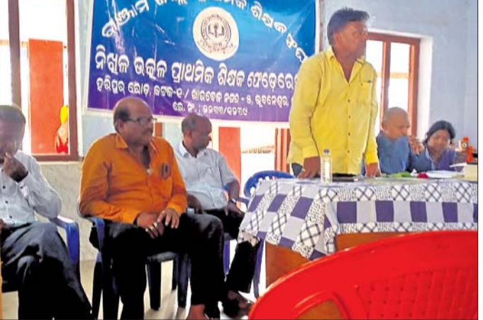
ବୈଠକରେ ଉପସ୍ଥିତ ସଂଘର ସଦସ୍ୟ ବୃନ୍ଦ।