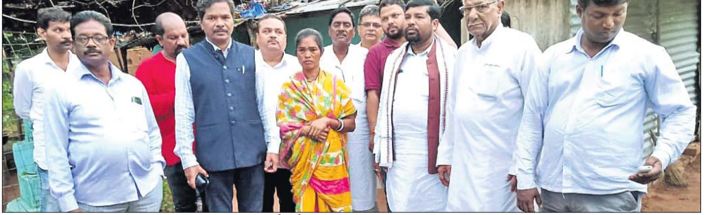
ମୃତ ଛାତ୍ରୀଙ୍କ ମା'ଙ୍କ ସହ କଂଗ୍ରେସ ବିଧାୟକ ଏବଂ ଜନକର୍ତ୍ତା।