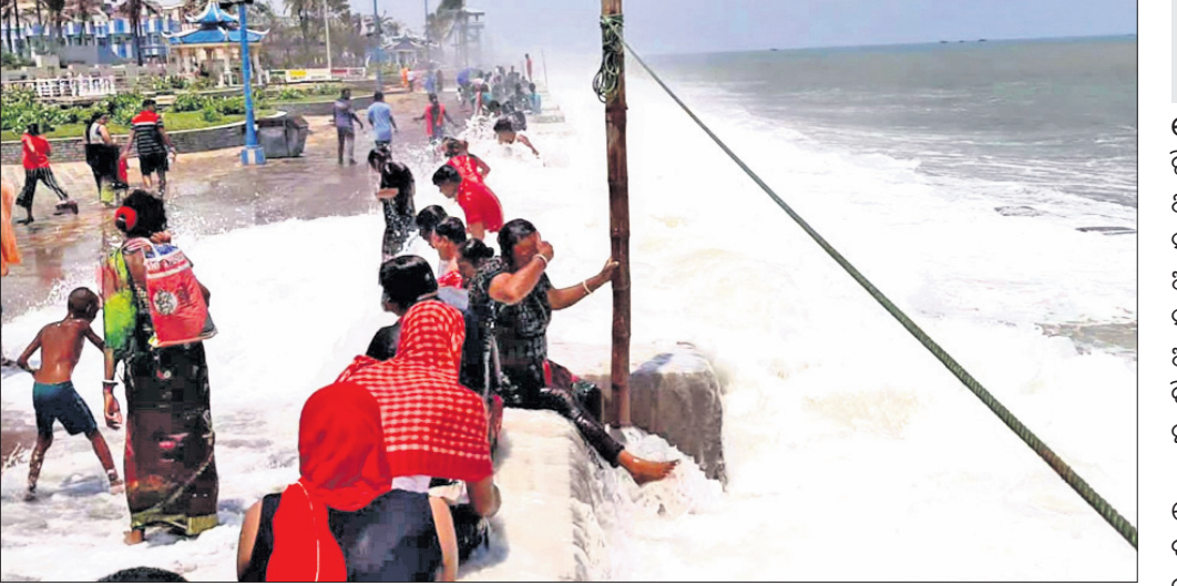
ଦାଘା ସମୁଦ୍ରକୂଳ ରାସ୍ତାରେ ପର୍ଯ୍ୟଟକମାନେ ସ୍ଥାନର ମଜା ନେଉଛନ୍ତି।

ଭୋଗରାଇ, ୪୧୬(ଡି.ଏନ.ଏ.) ରାସ୍ତାରେ ସମୁଦ୍ରକୂଳ। ସୋମବାର ଏଭଳି ଦୁର୍ଘଟଣା ଦେଖିବାକୁ ମିଳିଛି ଓଡ଼ିଶା ସାମାଜିକ ପବ୍ଲିକ୍‌ସର୍ଭିସ୍ ଦାଘା ସେକ୍ଟର ସହରରେ। ବଙ୍ଗୋପସାଗରରେ ଲାଗୁତାପ ବନ୍ଦ୍ୟ ସୃଷ୍ଟି ହୋଇଥିବା ବେଳେ ସମୁଦ୍ର ଅଣାନ୍ତ ହୋଇଛି। ଅମାବାସ୍ୟା ପରେ ଘୂର୍ଣ୍ଣିବଳୟ ଓ ଲାଗୁତାପ ସୃଷ୍ଟି ହେବା ସହ ସମୁଦ୍ରର ବଡ଼ବଡ଼ ଢେଉ କୂଳ ଆଡ଼କୁ ମାଡ଼ି ଆସି ପୁରୁଷା ପଥରବନ୍ଧରେ ମାଡ଼ କରୁଛି। ଏପରିକି ଦାଘା ସି-ବିଏ ପଥରବନ୍ଧ ତେଇଁ ସମୁଦ୍ରର ଉତ୍ତଳ ତେର ସହର