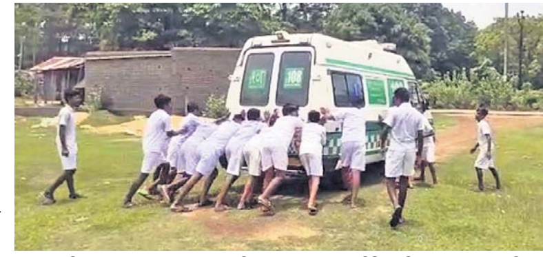
ମୟୂରଭଞ୍ଜ ଜିଲ୍ଲା ବେତନଟା ବ୍ଲକ୍ ସତ୍ୟବାଇ ଉଚ୍ଚ ବିଦ୍ୟାଳୟରେ ଯୋଗାଣ ବିନା ଦାବି ନେଇ ଧାରଣାରେ ବସିଥିବା ୧୦୮ ଆୟୁର୍ଲାଭ ଗାଡ଼ି ସ୍ୱର୍ଗ ନ ହେବାକୁ ପିଲାମାନେ ଠେଲୁଛନ୍ତି।

ମୟୂରଭଞ୍ଜ ଜିଲ୍ଲା ବେତନଟା ବ୍ଲକ୍ ଅଧୀନ ସତ୍ୟବାଇ ସରକାରୀ ଉଚ୍ଚ ବିଦ୍ୟାଳୟ, ୫-୧୨ ଅଧୀନରେ ରୂପାଚରଣ ହୋଇଛି।