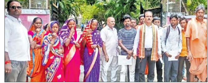
ଆରତିସିଙ୍କ କାର୍ଯ୍ୟକ୍ରମ ସମ୍ପର୍କରେ ଅଞ୍ଚଳ ବାସିନ୍ଦା।