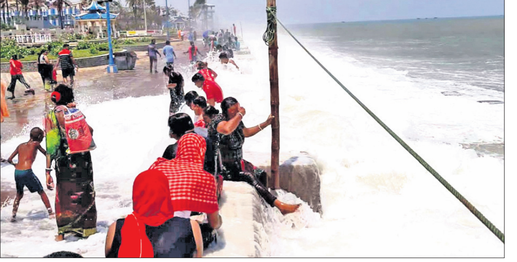
ଦାଘା ସମୁଦ୍ରକୂଳ ରାସ୍ତାରେ ପର୍ଯ୍ୟଟକମାନେ ସ୍ନାନ ନକା ନେଉଛନ୍ତି।

ଭୋଗରାଇ, ୪୧୨(ଡି.ଏନ.ଏ.) ରାସ୍ତାରେ ସମୁଦ୍ରସ୍ନାନ। ସୋମବାର ଏଭଳି ଦୁର୍ଘଟଣା ଦେଖିବାକୁ ମିଳିଛି ଓଡ଼ିଶା ସାମାଜିକ ପତ୍ରିକାରେ ଦାଘା ସେକ୍ଟର ସହରରେ। ବଙ୍ଗୋପସାଗରରେ ଲାଗୁତାପ ବନ୍ଦ୍ୟ ସୃଷ୍ଟି ହୋଇଥିବା ବେଳେ ସମୁଦ୍ର ଅଣାନ୍ତ ହୋଇଛି। ଅମାବାସ୍ୟା ପରେ ଘୂର୍ଣ୍ଣିବଳୟ ଓ ଲାଗୁତାପ ସୃଷ୍ଟି ହେବା ସହ ସମୁଦ୍ରର ବଡ଼ବଡ଼ ଢେଉ କୁଳ ଆଡ଼କୁ ମାଡ଼ି ଆସି ପୁରୁଣା ପଥରବନ୍ଧରେ ମାଡ଼ କରୁଛି। ଏପରିକି ଦାଘା ସି-ବିଏ ପଥରବନ୍ଧ ତେଇଁ ସମୁଦ୍ରର ଉତ୍ତଳ ତେର ସହର