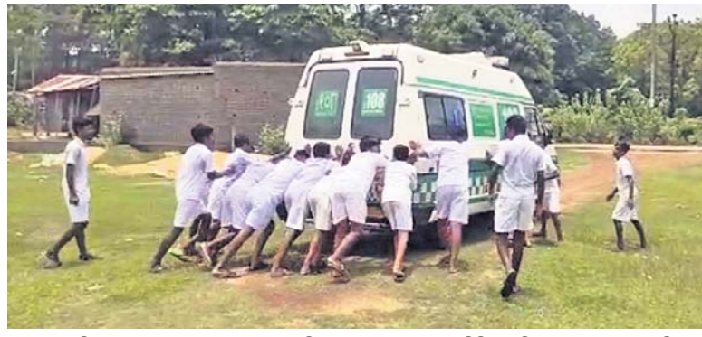
ମୟୂରଭଞ୍ଜ ଜିଲ୍ଲା ବେତନଟା ବ୍ଲକ୍ ସତ୍ୟସାଲ ଉଚ୍ଚ ବିଦ୍ୟାଳୟରେ ଯୋଗାଣ ବିନିମୟ ନେଇ ଧାରଣାରେ ରହିଥିବା ଏହି ଅସୁସ୍ଥ ଛାତ୍ରୀଙ୍କୁ ନେବାକୁ ଆସିଥିବା ୧୦୮ ଆୟୁର୍ଲାଭୁ ଗାଡ଼ି ସ୍ୱାର୍ଗ ନ ହେବାକୁ ପିଲାମାନେ ଠେଲୁଛନ୍ତି।

ମୟୂରଭଞ୍ଜ ଜିଲ୍ଲା ବେତନଟା ବ୍ଲକ୍ ଅଧୀନ ସତ୍ୟସାଲ ସରକାରୀ ଉଚ୍ଚ ବିଦ୍ୟାଳୟ, ୫-୧୧ ଅଧୀନରେ ଉପାଚାରଣ ହୋଇଛି।