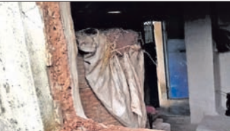
ବନବିଭାଗ ପକ୍ଷରୁ ହାତୀ ଘରତାଯାଇ ନ ଥିବାରୁ ହାତୀପଲ ଗ୍ରାମାଭିଯୁକ୍ତ ହେଉଥିବା ଗ୍ରାମବାସୀ ଅଭିଯୋଗ କରିଛନ୍ତି । ତୁରନ୍ତ ଏଥିପ୍ରତି ବନବିଭାଗ ଦୃଷ୍ଟି ଦେଇ ପଦକ୍ଷେପ ନେବାକୁ ଗ୍ରାମବାସୀ ଦାବି କରିଛନ୍ତି ।

କିଶୋରନଗର ବ୍ଲକ୍ ହଣ୍ଡପା ରେଞ୍ଜରେ କିଛିଦିନ ହେବ ହାତୀ ଉପଦ୍ରବ ଲାଗି ରହିଛି । ହାତୀପଲ ବିଜିଲ ଗ୍ରାମରେ ପଶି ବ୍ୟାପକ ଫସଲ ନଷ୍ଟ କରୁଛନ୍ତି ।