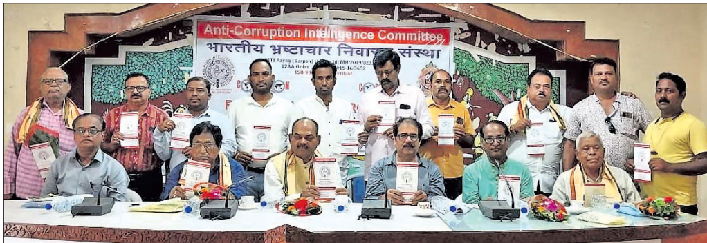
କାର୍ଯ୍ୟକ୍ରମରେ ମଞ୍ଚାସୀନ କର୍ମକର୍ତ୍ତାମାନେ ।