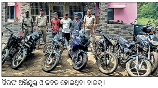
ଗିରଫ ଅଭିଯୁକ୍ତ ଓ ଜବତ ହୋଇଥିବା ବାଇକ୍ ।