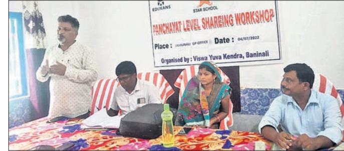
କାର୍ଯ୍ୟକ୍ରମରେ ଉପସ୍ଥିତ ଅତିଥିମାନେ ।