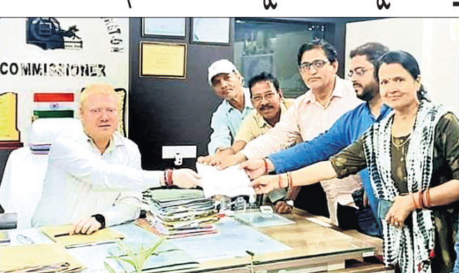
ଫୋରମ ପକ୍ଷରୁ ଦାବି ପତ୍ର ପ୍ରଦାନ କରାଯାଇଛି।