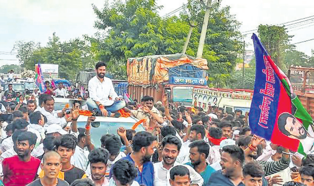
ପୂର୍ବତନ କେନ୍ଦ୍ରମନ୍ତ୍ରୀ ରାମଦିବାସ ପାଣିଗ୍ରାହୀଙ୍କୁ ଅନରେବଲ ଲୋକ ଜନଶକ୍ତି ପାର୍ଟି (ରାମଦିବାସ) ସଭାପତି ତିରାଣ ପାଣିଗ୍ରାହୀ ଦିହାର ହାଜିପୁରଠାରେ ଏକ ରୋଡ଼ ଶୋ' କରୁଛନ୍ତି।

ଭୁବନେଶ୍ୱର, ୫୬(ବୁଧବାର) ଭିଲ୍ଲା ମୁଖ୍ୟମନ୍ତ୍ରୀ ଅରବିନ୍ଦ କେକ୍ରିଶାଲ ସାକ୍ଷାତକାରୀ ସତ୍ୟେନ୍ଦ୍ର ଜେନ ରିପଟ ଓ ଏମସିଟି ନିର୍ବାଚନକୁ ନେଇ ଭାଜପାକୁ ଚାଲେନ୍ଜ କରିଛନ୍ତି। ମଙ୍ଗଳବାର କେକ୍ରିଶାଲ ବିଧାନସଭାରେ କହିଛନ୍ତି ଏମାନେ ଫକ୍ସର କାନ୍ଦ କାହୁଁଛନ୍ତି। ଆମର ସମସ୍ତ ଫକ୍ସ ନେଇଗଲେ। ହେଲେ ଏବେ କେନ୍ଦ୍ରର ଅଧୀନକୁ ଆସିବାରୁ ଏମସିଟି, ଏବେ ସେଠାରେ ଲୋ ଫକ୍ସ ଏମାନେ କର୍ମଚାରୀଙ୍କୁ ଡାକି ସମ୍ପୂର୍ଣ୍ଣ ଦରଦା ଦେଉନାହାନ୍ତି। କେକ୍ରିଶାଲ କହିଛନ୍ତି, ଅମିତାଭ ବନନଙ୍କର ଗୋଟିଏ ପିଲା ଆସିଥିଲା ଦିଶା। ସେଥିରେ ଅମିତାଭ କହୁଥିଲେ, ମୋ ପାଖରେ ଧନ ଅଛି, ବୌଦ୍ଧ ଅଛି, ବଜ୍ରାଲ ଅଛି.. ଆଉ ଏକ ବିଜେଡି ବେଳେ ଶଶି କହୁଥିଲେ ମୋ ପାଖରେ ମା' ଅଛି। କିପରି ଆଜି ଭାଜପା କହୁଛି ମୋ ପାଖରେ ଭିଡି ଅଛି, ଭିଡି ଅଛି ଗାନ୍ଧୀ, ସିଦ୍ଧିଆଲ ଅଛି। ହେଲେ ଦିଲ୍ଲୀର ଜନତା କହୁଛନ୍ତି ଆମ ପାଖରେ ଆମ ପୁଅ କେକ୍ରିଶାଲ ଅଛି।