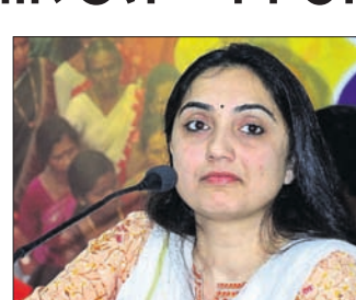
ଲେଖାଯାଇଥିବା ଖୋଲା ଚିଠିରେ ୧୧୭ ଜଣଙ୍କ ସ୍ଵାକ୍ଷର ରହିଛି। ସୁପ୍ରିମକୋର୍ଟ ନୂପୁରଙ୍କ ବିରୋଧରେ କରିଥିବା ଚିନ୍ତାଶୀଳ ଓ ଅନୁଧ୍ୟାନ ଉପରେ ପୂର୍ବତନ ବିଚାରପତି ଏହି ଗୋଷ୍ଠୀ ଦାବି କରିଛି।

ଅଲିଭା ଦାଗ ଲଗାଇଛନ୍ତି ବୋଲି ଏହି ବିଚାରପତି ଗୋଷ୍ଠୀ କହିଛନ୍ତି। ଏହି ଗ୍ରୁପ୍‌ରେ ୧୫ ଜଣ ହାଇକୋର୍ଟ ବିଚାରପତି, ୭୭ ଜଣ ପୂର୍ବତନ-ଅଲ୍ ଇଣ୍ଡିଆ ସର୍ଭିସ୍ ଅଧିକାରୀ, ୨୫ ଜଣ ବରିଷ୍ଠ ଅଧିକାରୀ ରହିଛନ୍ତି। ସର୍ବୋଚ୍ଚ ଅଦାଲତଙ୍କ ଏହି ମତବ୍ୟ ଭାରତ ସମେତ ଦେଶ ବାହାରେ ଥିବା ଲୋକଙ୍କୁ ମଧ୍ୟ ବିକୃତ କରିଛି ବୋଲି ଉକ୍ତ ଗୋଷ୍ଠୀ ମତବ୍ୟକୁ କହିଛନ୍ତି। ଏ ସଂକ୍ରାନ୍ତରେ