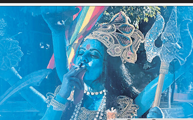
ବିବାଦୀୟ ଫିଲ୍ମ ପୋଷ୍ଟର