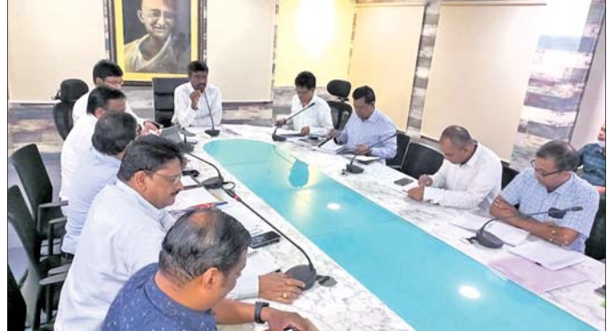
ବୈଠକରେ ଉପସ୍ଥିତ ଜିଲ୍ଲାପାଳ ଓ ଅନ୍ୟମାନେ।