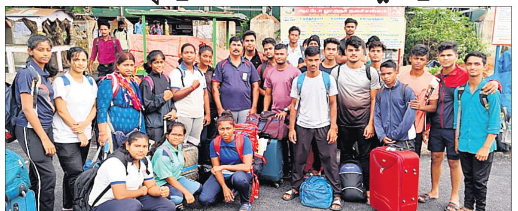
ରାଜ୍ୟ ଚିମ୍ପରେ ଗଞ୍ଜାମ ପ୍ରତିଯୋଗୀ।