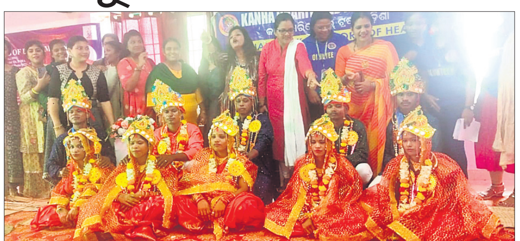
ବ୍ରହ୍ମପୁର ସାମୁହିକ ବିବାହ ଉତ୍ସବ।