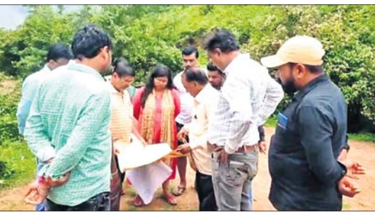
ଅଧିକାରୀମାନେ ସର୍ତ୍ତେ କରୁଛନ୍ତି।