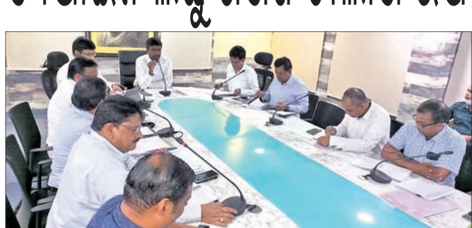
ବୈଠକରେ ଉପସ୍ଥିତ ଜିଲାପାଳ ଓ ଅନ୍ୟମାନେ।