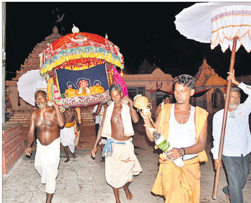
ହେରାପଞ୍ଚମୀ ତିଥିରେ ମା' ଲକ୍ଷ୍ମୀ ବ୍ରହ୍ମ ଚାଳଧିକ ରଥକୁ ଭାଙ୍ଗିବାକୁ ଯାଉଛନ୍ତି ।