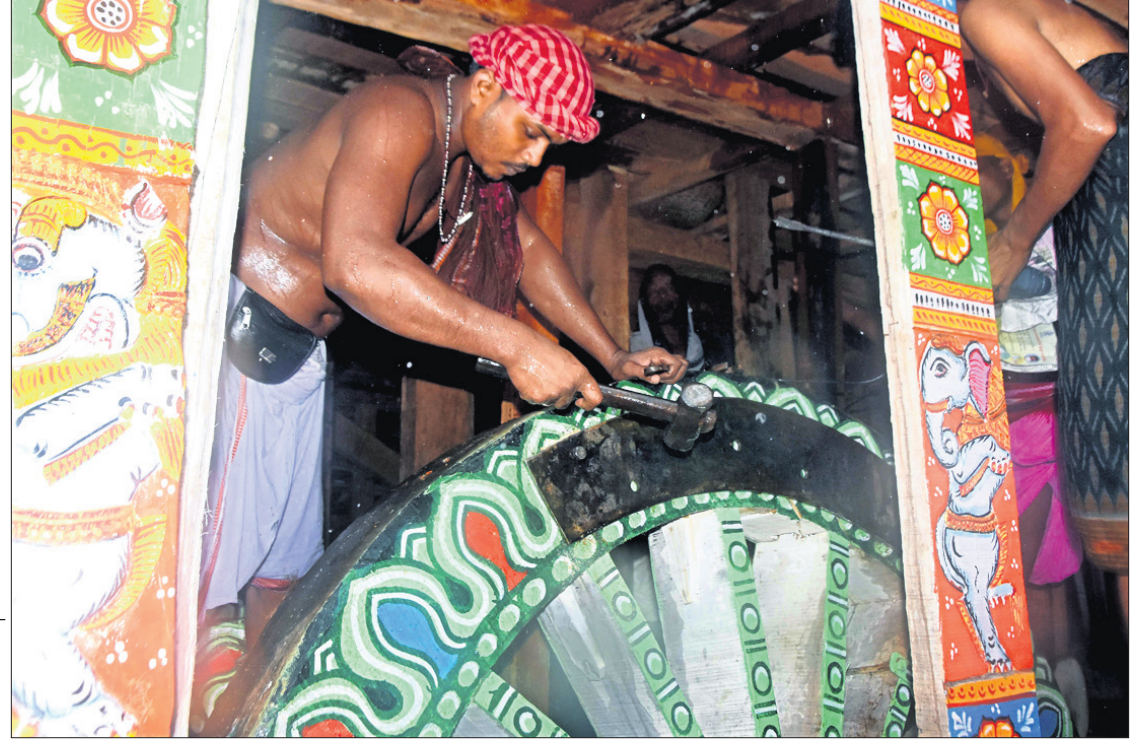
ପୁରୀ: ତାଳଧୁଳି ରଥର ପଡ଼ିନାହାକା ଚକରେ ହୋଇଥିବା ପାଟକୁ ମଙ୍ଗଳବାର ମରାମତି କରାଯାଇଛି।

ଏନେଇ ସେ ଭୁବନେଶ୍ୱର ମାଲିକ ବ୍ରହ୍ମଚର୍ଯ୍ୟଙ୍କୁ ଜଣାଇଥିଲେ। ପରେ ଶହାଦନଗର ଥାନା ପୋଲିସ୍‌କୁ ଖବର ଦେଇଥିଲେ। ଖବର ପାଇ ପୋଲିସ୍ ଆସି ମୃତଦେହ ଉଦ୍ଧାର କରି ବ୍ୟବହୃତ ନିମନ୍ତେ କ୍ୟାମିରା ଛାନ୍ଦିବା ପାଇଁ ପଠାଇବା ସହ ଉଦ୍ଧାର କରିଥିଲେ। ବ୍ୟବହୃତ ପରେ ମୃତଦେହକୁ ପରିବାର ଲୋକଙ୍କୁ ହସ୍ତାନ୍ତର କରାଯାଇଛି। ପରିବାର ଲୋକ ଅନ୍ତ୍ୟେଷ୍ଟିକ୍ରମ ସାରିବା ପରେ ତାଙ୍କ ଉପସ୍ଥିତିରେ ଏବଂ ସାଲଭିଫିଙ୍ଗ୍ ଚିମ୍ବି ସହାୟତାରେ ଘର ଭିତର ଯାଞ୍ଚ କରାଯାଇ ମିଳିଥିବା ନୋଟକୁ ଅନୁଧ୍ୟାନ କରାଯିବ ବୋଲି ଶହାଦନଗର ଥାନା ଆଇଆଇସି ହିଂମାଣ୍ଡ ଶେଖର ସାହି କହିଛନ୍ତି। ପରିବାରୀଙ୍କ ସ୍ଥିତିକୁ ଆଶ୍ରମୀ ସେନାପତି ରାତିରୁ ଆତ୍ମହତ୍ୟା କରିଥିବା ପୋଲିସ୍ ଅନୁମାନ କରୁଛି। ଘରୁ ମିଳିଥିବା ନୋଟରେ କ'ଣ ଲେଖାହୋଇଛି ଜଣାପଡ଼ିବା ପରେ ମୃତ୍ୟୁର କାରଣ କୁହାଯାଇପାରିବ ବୋଲି ଆଇଆଇସି ସାହି କହିଛନ୍ତି।