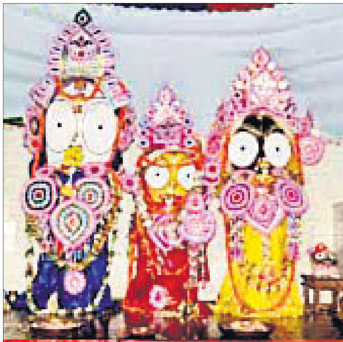
ଆଡ଼େ ମଞ୍ଚପରେ ଶ୍ରୀବଳଦେବଜୀଉ, ମା' ସୁଭଦ୍ରା ଓ ଶ୍ରୀଜଗନ୍ନାଥଜୀଉ ।

କେନ୍ଦ୍ରାପଡ଼ା ଜିଲାର ଭୁବନେଶ୍ୱର ମହାପ୍ରଭୁ ଶ୍ରୀବଳଦେବଜୀଉଙ୍କ ହେରାପଞ୍ଚମୀ ନୀତି ପାରମ୍ପରିକ ଭାବେ ମଙ୍ଗଳବାର ସନ୍ଧ୍ୟାରେ ସମ୍ପୂର୍ଣ୍ଣ ହୋଇଯାଇଛି । ମାଉସୀ ମା' ମନ୍ଦିରର ଆଡ଼େ ମଞ୍ଚପରେ ବିରାଜିତ ଶ୍ରୀଜୀଉଙ୍କ ରାତିନାତି ପରେ ମୁଖ୍ୟ ଦେଉଳରୁ ମା' ମହାଲକ୍ଷ୍ମୀଙ୍କ ଚକ୍ରି ପ୍ରତିମାକୁ ଏକ ସ୍ୱତନ୍ତ୍ର ବିମାନରେ ବ୍ରହ୍ମ ଚାଳଧିକ ରଥ ନିକଟକୁ ନିଆଯାଇଥିଲା । ଏହି ସମୟରେ ଦେବୋତ୍ତର କାର୍ଯ୍ୟାଳୟ ପକ୍ଷରୁ ମା'ଙ୍କୁ ପଂକ୍ତି ଭୋଗ ଅର୍ପଣ କରାଯାଇଥିଲା । ପରେ ମା'ଙ୍କ ବିମାନ ମାଉସୀ ମା' ମନ୍ଦିରକୁ ଗମନ କରିଥିଲା । ପରେ ଆଡ଼େ ମଞ୍ଚପରେ ସେବାୟତଙ୍କ ଦ୍ୱାରା ଶ୍ରୀଜୀଉ ଓ ମା'ଙ୍କ ମଧ୍ୟରେ ବାଦାହୁଦି ହୋଇଥିଲା । ନବଦିନ ଯାତ୍ରା ପରେ ଶ୍ରୀଜୀଉ ମନ୍ଦିରକୁ ଫେରିବେ ବୋଲି ଜାଣିବା ପରେ ମା' ରାଗି ମାଉସୀ ମା' ମନ୍ଦିରକୁ ବାହାରି ରଥ ନିକଟରେ ପହଞ୍ଚି ରାତିନାତି ଅନୁଯାୟୀ ରଥ କାଠ ଭଙ୍ଗା ହୋଇଥିଲା । ପରେ ମା' ଲକ୍ଷ୍ମୀଙ୍କ ବିକେ ପ୍ରତିମା ମୁଖ୍ୟ ଦେଉଳକୁ ପ୍ରତ୍ୟାବର୍ତ୍ତନ କରିଥିଲେ । ସେହିପରି ତମାଳଶାସନ କେନ୍ଦ୍ରାପଡ଼ା ଶ୍ରୀ ବ୍ୟୁତ୍ପାଦନକାରୀଙ୍କର ହେରା ପଞ୍ଚମୀ ନୀତି ସମ୍ପୂର୍ଣ୍ଣ ହୋଇଛି । ଏହି ନୀତିକୁ ଶ୍ରୀବ୍ୟୁତ୍ପାଦନକାରୀଙ୍କ ସେବାୟତମାନେ ସମ୍ପୂର୍ଣ୍ଣ କରିଥିଲେ ।