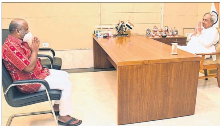
ନବୀନ ନିବାସରେ ମୁଖ୍ୟମନ୍ତ୍ରୀଙ୍କୁ ସାକ୍ଷାତ କରୁଥିବା ରାଜ୍ୟର ବିଧାୟକମାନଙ୍କ ସହିତ ମୁଖ୍ୟମନ୍ତ୍ରୀଙ୍କ ସମ୍ମାନ କର୍ମ ସମୟରେ