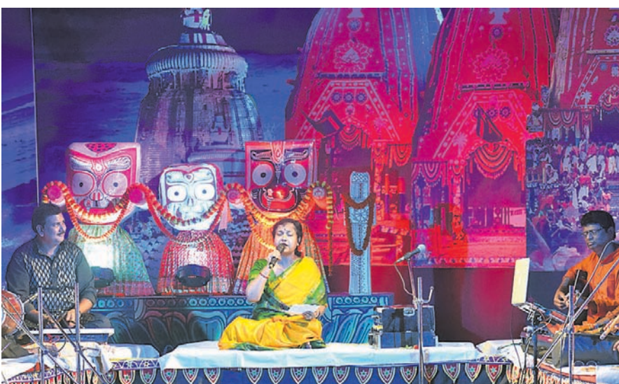
ଭୁବନେଶ୍ୱରସ୍ଥିତ ଭଞ୍ଜକଳା ମଣ୍ଡପଠାରେ ଚାଲିଥିବା ଶ୍ରୀଜଗନ୍ନାଥ ଭକ୍ତି ସଙ୍ଗୀତ ସମାରୋହ 'ଗୁହାରି'ର ମଙ୍ଗଳକାରୀ ବ୍ରତୀୟ ସନ୍ଧ୍ୟାରେ ଜଣେ କୃଷଣଶିଳ୍ପୀ ପ୍ରତିନିଧୀ ରାଉତରାୟ ସଙ୍ଗୀତ ପରିବେଷଣ କରୁଛନ୍ତି ।