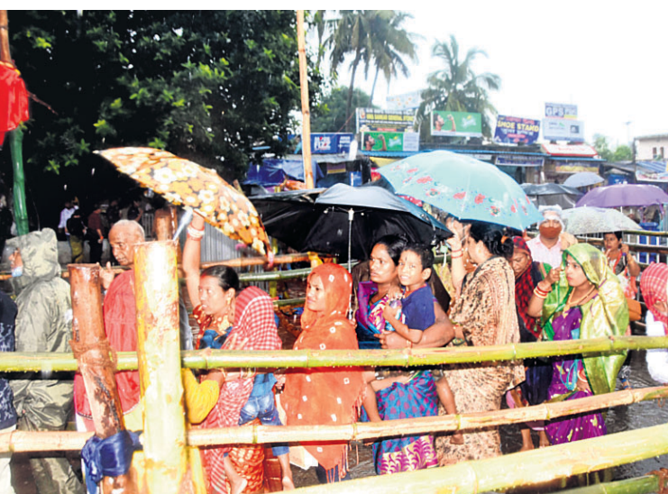
ଆଡ଼ପ ମଣ୍ଡପରେ ଦାରୁଦିଆଁକ ଦର୍ଶନ ପାଇଁ ମଙ୍ଗଳକାରୀ ପ୍ରବଳ ବର୍ଷାରେ ଭିଜି ଶ୍ରୀକାଳୀମାନେ ଧାଡ଼ିରେ ଠିଆ ହୋଇଛନ୍ତି ।