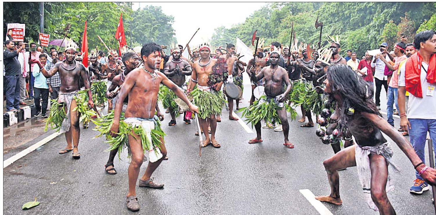
ସ୍ୱତନ୍ତ୍ର କୋଶଳ ରାଜ୍ୟ ଦାବି: କୋଶଳ ରାଜ୍ୟ ପୁତ୍ର ମୋର୍ଚ୍ଚା ଏବଂ ଓଡ଼ିଶାର ସମସ୍ତ କୋଶଳବାସୀ ସଂଗଠନ ସମ୍ମୁଖରେ ଭୁବନେଶ୍ୱର ଲୋକସଭା ପିଏମ୍‌ଜିରେ ବିରୋଧ ପ୍ରଦର୍ଶନ।

ଜନସ୍ୱାର୍ଥ ମାମଲାରେ ବନ୍ୟଜନ୍ତୁ(ପୁରୁଣା) (ଆସାମ ଆନେକ୍ସେନ୍ସ) ଆକ୍ଟ ୨୦୦୯ ଆଧାରରେ ଓଡ଼ିଶାରେ ବନ୍ୟ ଜନ୍ତୁ ଶିକାର ରୋକିବା ନେଇ ରାଜ୍ୟସ୍ତରରେ ସଂଶୋଧନ ଆଣିବାକୁ ନିବେଦନ କରିଥିଲେ। ଏହି ମାମଲାର ପରବର୍ତ୍ତୀ ଶୁଣାଣି ଜୁଲାଇ ୨୫ରେ ହେବ। ସରକାରୀ ପରିସଂଖ୍ୟାନ ଅନୁଯାୟୀ ୨୦୧୨-୧୩ରୁ ୨୦୨୧-୨୨ ମଧ୍ୟରେ ରାଜ୍ୟରେ ୭୮୪ ହାତୀଙ୍କ ମୃତ୍ୟୁ ଘଟିଛି। ଏକାଧିକ ମଧ୍ୟରୁ ଶିକାରୀଙ୍କ ଦ୍ୱାରା ୩୫ଟି ହାତୀଙ୍କ ମୃତ୍ୟୁ ଘଟିଥିବାବେଳେ ବିଭିନ୍ନ ପୁରୁଣାରେ ୩୨ ହାତୀଙ୍କ ପ୍ରାଣ ଯାଇଛି। ଅପରପକ୍ଷରେ ରାଜ୍ୟ ସରକାରଙ୍କ କହିବାନୁସାରେ ୨୦୧୭ରେ କରାଯାଇଥିବା ହାତୀଗଣନା ଅନୁସାରେ ହାତୀଙ୍କ ସଂଖ୍ୟା ବୃଦ୍ଧି ଘଟିଛି। ୨୦୧୭ ଜନଗଣନା ଅନୁସାରେ ହାତୀଙ୍କ ସଂଖ୍ୟା ୧୯୭୭ ରହିଥିଲା, ଯାହାକି ୨୦୦୨ରେ କରାଯାଇଥିବା ଗଣନାଠାରୁ ୧୩୫ ଅଧିକ।