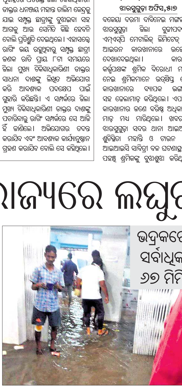
ଭଦ୍ରକରେ ସର୍ବାଧିକ ୬୭ ମିମି

ଉତ୍ତର ଓଡ଼ିଶା ପାର୍ଶ୍ୱବର୍ତ୍ତୀ ଦକ୍ଷିଣ ଓଡ଼ିଶା ଏବଂ ଗାଙ୍ଗେୟ ପଶ୍ଚିମବଙ୍ଗ ଉପତ୍ୟକା ଅଞ୍ଚଳରେ ସୂକ୍ଷ୍ମ ଲଘୁଚାପ ପ୍ରଭାବରେ ସାରା ଓଡ଼ିଶାରେ ବର୍ଷା କାରି ରହିଛି।