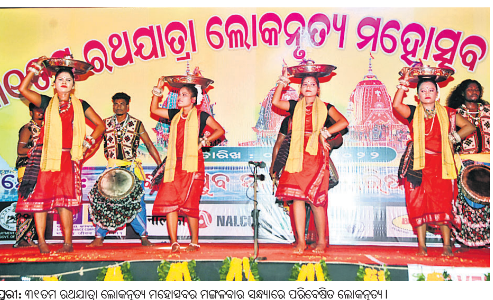
ପୁରୀ: ୩୧ତମ ରଥଯାତ୍ରା ଲୋକନୃତ୍ୟ ମହୋତ୍ସବର ମଙ୍ଗଳକାରୀ ସନ୍ଧ୍ୟାରେ ପରିବେଷିତ ଲୋକନୃତ୍ୟ ।