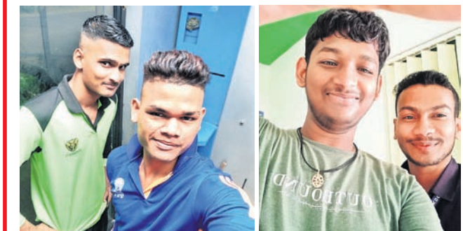
@ ଅନିଲ @ ଆୟାନ୍