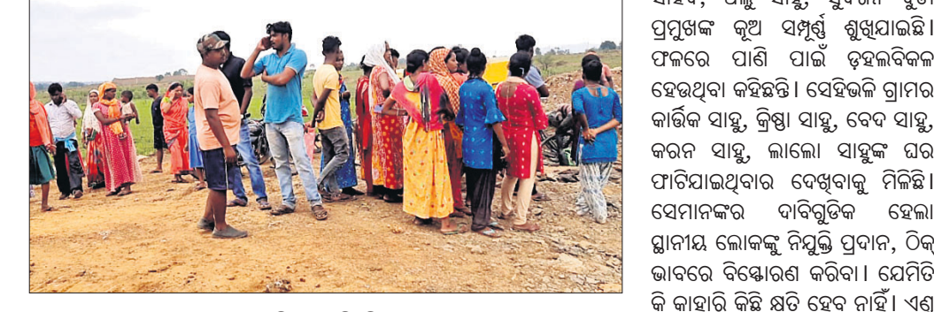
ଖତକୁରବାହାଲ ଠାରେ ଗ୍ରାମବାସୀ ଖଣି ବନ୍ଦ କରିଛନ୍ତି।

ସୁନ୍ଦରଗଡ଼ ଜିଲା କୁନ୍ତା ବ୍ଲକ ଅନ୍ତର୍ଗତ କନ୍ଦେଇପୁଣ୍ଡା ପଞ୍ଚାୟତ ତେଲିଘନାଠାରେ ଖଣି ରହିଛି ଖତକୁରବାହାଲ ଠାରେ। ତେବେ ଏହି ଖଣିକୁ ଗ୍ରାମବାସୀଙ୍କ ପକ୍ଷରୁ ଶନିବାର ବନ୍ଦ କରାଯାଇଛି। ଗ୍ରାମବାସୀଙ୍କ କହିବା ଅନୁଯାୟୀ କମ୍ପାନୀ ପକ୍ଷରୁ ସେମାନଙ୍କୁ କୌଣସି ସୁବିଧା ସୁଯୋଗ ମିଳୁନାହିଁ। ସ୍ଥାନୀୟ ଲୋକଙ୍କୁ ନିୟୁତ ଦେବା ତ ଦୂରେ ଆଉ ସେମାନଙ୍କ କଥାକୁ ମଧ୍ୟ କର୍ଣ୍ଣପାତ କରାଯାଉ ନାହିଁ। ଗ୍ରାମର ନିର୍ଦ୍ଦିଷ୍ଟ ୪ ରୁ ୫ ଜଣଙ୍କୁ କେବଳ କମ୍ପାନୀ ଦେଖୁଛି ଏବଂ କାହାକୁ ପଚାରୁ ନ ଥିବା କହିଛନ୍ତି।