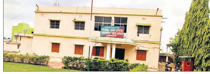
ସୁବର୍ଣ୍ଣପୁର ଡିଏଫଓଙ୍କ କାର୍ଯ୍ୟାଳୟ ।

ସୁବର୍ଣ୍ଣପୁର ଜିଲ୍ଲାରେ କମ୍ ପରିମାଣର ଜଙ୍ଗଲ ରହିଛି । ଆୟତନ ଅନୁସାରେ ସର୍ବନିମ୍ନ ୩୩ ପ୍ରତିଶତ ଜଙ୍ଗଲ ରହିବା ସ୍ଥାନରେ ଅଧିକ ମାତ୍ର ୧୮ ପ୍ରତିଶତ। ତେଣୁ କଳବାୟ ସବୁଜନ ଉପରେ ଏହାର ଗଭୀର ପ୍ରଭାବ ପଡୁଛି । ଏଭଳି ସ୍ଥିତିରେ ଗତ ୬ ମାସ ହେଲା ସୁବର୍ଣ୍ଣପୁର ବନଖଣ୍ଡ ଅଧିକାରୀ ପଦ ଖାଲି ପଡିଛି । ସେହିପରି ବର୍ଷାଧିକ କାଳ ବୁଲିତ ସହକାରୀ ବନ ସଂରକ୍ଷକ ପଦବୀ ପୂରଣ ହେଉନା ଲାଗି ସହକାରୀ ବନ ସଂରକ୍ଷକଙ୍କ ଦାୟିତ୍ୱରେ ସମସ୍ତ କାର୍ଯ୍ୟ ଚାଲିଛି । ସରକାର ଜିଲ୍ଲାରେ ଖାଲି ପଡିଥିବା ଏହି ଗୁରୁତ୍ୱପୂର୍ଣ୍ଣ ପଦବିରେ କାର୍ଯ୍ୟରୁ ନିରାସିତ ହେଉନାହାନ୍ତି । ବନାଞ୍ଚଳରେ ଏହାର ପ୍ରଭାବ ପରିଲକ୍ଷିତ ହେଉଛି । ନୂତନ ଜଙ୍ଗଲ ସୃଷ୍ଟି ହେବା ବଦଳରେ ପୁରାତନ ଜଙ୍ଗଲ କ୍ଷୟ ହେବାରେ ଲାଗିଛି । ବନଖଣ୍ଡ ଅଧିକାରୀ ନ ଥିବାରୁ ଅଧିକାଂଶ ବନପାଳ ଓ ବନରକ୍ଷାମାନେ ନିଜ ହେତୁକାର୍ତ୍ତବ୍ୟରେ ନ ରହି ଜିଲ୍ଲା ସଦର ମହକୁମାରେ ରହୁଛନ୍ତି । ତେଣୁ ବନ ବିଭାଗ କର୍ମଚାରୀଙ୍କ ଅନୁପସ୍ଥିତିରେ ଜଙ୍ଗଲରେ କାଠ ଚୋର ଓ ଜଳୁ ଶିକାରୀଙ୍କ ପ୍ରାପ୍ତ ହେବା ଦୃଶ୍ୟ ପାଆଯାଉଛି । ଉଲ୍ଲୁଖ, ବିନିକା, ବାରପାହାଡ, ଲକ୍ଷ୍ମପୁର, ତରଣା ଓ ସୁବଳୟା