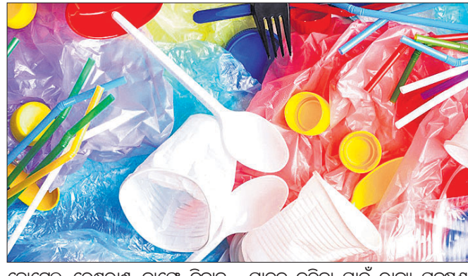
ହୋଟେଲ, ରେଷ୍ଟୁରାଣ୍ଟ, କାଫି, ବିବାହ ଉପରେ ସମ୍ପୂର୍ଣ୍ଣ କଟକଣା ରହିବ। ପ୍ଲାଷ୍ଟିକ ଆଦିରେ ମଧ୍ୟ ସେଭଲି ସାମଗ୍ରୀ ବ୍ୟବହାର ଉପରେ ସମ୍ପୂର୍ଣ୍ଣ କଟକଣା ରହିବ। ଏ ନେଇ କେନ୍ଦ୍ର ପ୍ରଦୁଷଣ ନିୟନ୍ତ୍ରଣ ବୋର୍ଡ (ସିପିସିପି) ପକ୍ଷରୁ ଗାଇଡ୍‌ଲାଇନ ଜାରି କରାଯାଇଛି। ଏହି ଗାଇଡ୍‌ଲାଇନକୁ କଡ଼ାକଡ଼ି ପାଳନ କରିବା ପାଇଁ ରାଜ୍ୟ ପ୍ରଦୁଷଣ ନିୟନ୍ତ୍ରଣ ବୋର୍ଡ (ଏସ୍‌ସିପିସିପି)କୁ ନିର୍ଦ୍ଦେଶ ଦିଆଯାଇଛି।

ଭୁବନେଶ୍ୱର, ୨୫।୬(ବୁଧବେଳା) ଆସନ୍ତା ଝୁଲାଇ ୧ରୁ ସମଗ୍ର ଦେଶରେ ଥରେ ବ୍ୟବହୃତ (ସିଙ୍ଗଲ ୟୁଜ) ପ୍ଲାଷ୍ଟିକ ସାମଗ୍ରୀର ବ୍ୟବହାରକୁ ନିଷେଧ କରାଯିବ। ରାଜ୍ୟରେ ଏହାକୁ ଲାଗୁ କରିବା ନେଇ କେନ୍ଦ୍ର ପରିବେଶ, ଜଙ୍ଗଲ ଓ ଜଳବାୟୁ ପରିବର୍ତ୍ତନ ମନ୍ତ୍ରାଳୟ ପକ୍ଷରୁ ରାଜ୍ୟ ସରକାରଙ୍କୁ ଅବଗତ କରାଯାଇଛି। ପରିବେଶକୁ କ୍ଷତି ପହଞ୍ଚାଉଥିବା ପଲିଥିନ ବିକ୍ରି, ବ୍ୟବସାୟ, ଉତ୍ପାଦନ, ଆମଦାନୀ, ପରିବହନ, ଗଚ୍ଛିତ, ବ୍ୟବହାର କିମ୍ବା ବ୍ୟବହାର ପରେ ଉପରେ ସମ୍ପୂର୍ଣ୍ଣ କଟକଣା ରହିବ। ପ୍ଲାଷ୍ଟିକ ଗାମଚ, କପ୍, ପ୍ଲେଟ୍, ଗ୍ଲାସ୍, ଥାଲିଆ, ପାଣି ପାଉର, ପ୍ଲାଷ୍ଟିକ ପତାଳା, ଛୁରି, ସ୍ତ୍ରୀ, ନିମନ୍ତଣ ପତ୍ର, ୧୦୦ ମାଇକ୍ରନରୁ କମ୍ ମୋଟେଇ ପିଭିସି ବ୍ୟାନର, ମିଠା ପ୍ୟାକେଟ ଆଦି ସାମଗ୍ରୀକୁ ନିଷେଧ କରାଯିବ। ସେହିପରି ପୂଜାସ୍ଥଳ, ହୋଟେଲ, ରେଷ୍ଟୁରାଣ୍ଟ, କାଫି, ବିବାହ ଉପରେ ସମ୍ପୂର୍ଣ୍ଣ କଟକଣା ରହିବ। ପ୍ଲାଷ୍ଟିକ ଆଦିରେ ମଧ୍ୟ ସେଭଲି ସାମଗ୍ରୀ ବ୍ୟବହାର ଉପରେ ସମ୍ପୂର୍ଣ୍ଣ କଟକଣା ରହିବ। ଏ ନେଇ କେନ୍ଦ୍ର ପ୍ରଦୁଷଣ ନିୟନ୍ତ୍ରଣ ବୋର୍ଡ (ସିପିସିପି) ପକ୍ଷରୁ ଗାଇଡ୍‌ଲାଇନ ଜାରି କରାଯାଇଛି। ଏହି ଗାଇଡ୍‌ଲାଇନକୁ କଡ଼ାକଡ଼ି ପାଳନ କରିବା ପାଇଁ ରାଜ୍ୟ ପ୍ରଦୁଷଣ ନିୟନ୍ତ୍ରଣ ବୋର୍ଡ (ଏସ୍‌ସିପିସିପି)କୁ ନିର୍ଦ୍ଦେଶ ଦିଆଯାଇଛି। ପ୍ଲାଷ୍ଟିକ ବଦଳରେ ପରିବେଶକୁ ଖାପ ଖୁଆଇବା ଏବଂ ନଷ୍ଟ ହୋଇପାରୁଥିବା ସାମଗ୍ରୀ ବ୍ୟବହାର କରିବାକୁ ଜନସାଧାରଣଙ୍କୁ ସିପିସିପି ପକ୍ଷରୁ ଅନୁରୋଧ କରାଯାଇଛି। ନିଷେଧ ହୋଇଥିବା ସାମଗ୍ରୀକୁ