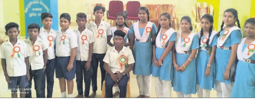
ସ୍କୁଲ କ୍ୟାମ୍ପରେ ପ୍ରତିନିଧିତ୍ୱ ।

ବରଗଡ଼ ଅପିଏ, ୨୫.୬.୨୨ ଛାତ୍ରୀଛାତ୍ରୀଙ୍କ ମଧ୍ୟରେ ନେତୃତ୍ୱ, କର୍ତ୍ତବ୍ୟ ପ୍ରତି ସଚେତନ ହେବା ସହିତ ସ୍କୁଲରେ ଶୁଖିଲା ଋକ୍ଷା କରିବା ଲକ୍ଷ୍ୟ ନେଇ ଶନିବାର ବରଗଡ଼ ରାଣାପ୍ରତାପ ସରକାରୀ ସ୍କୁଲରେ ସ୍କୁଲ କ୍ୟାମ୍ପରେ ଗଠନ କରାଯାଇଛି । ଏହାସହିତ ଛାତ୍ରୀଛାତ୍ରୀଙ୍କୁ ବିଭିନ୍ନ ବିଭାଗ ବନ୍ଧନ କରାଯାଇଛି ।