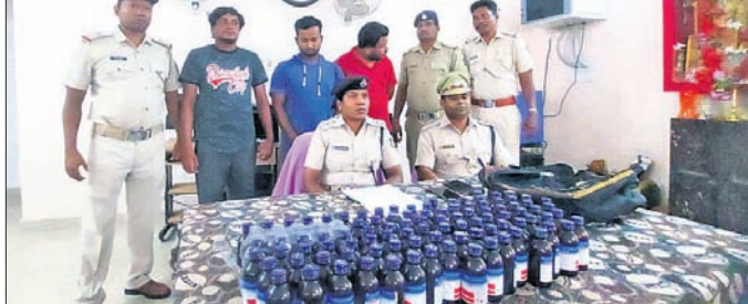
ସୋନପୁର ଏସ୍‌ପିଓ ଖବରବାତୀ ସମ୍ମିଳନୀରେ ସୂଚନା ଦେଖିଛନ୍ତି।

ନେତୃତ୍ୱରେ ପୋଲିସ୍ ଟିମ୍ ପାଟ୍ରୋଲିଂ କରୁଥିବା ସମୟରେ ସଖାକେନ୍ଦ୍ର ନିକଟରେ କଫ ସିରପ୍ ବିକ୍ରି କରାଯିବା ସମ୍ପର୍କରେ ସୂଚନା ପାଇ ଚଢ଼ାଇ କରୁଥିଲେ।