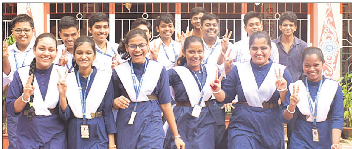
ମାଟ୍ରିକ ପରୀକ୍ଷା ପ୍ରକାଶ ପରେ ଖୁସି ମନାଉଛନ୍ତି ଭୁବନେଶ୍ଵର ଯୁନିଟ୍-୩ ସରକାରୀ ଶିଶୁ ବିଦ୍ୟାଳୟର ଛାତ୍ରଛାତ୍ରୀମାନେ ।