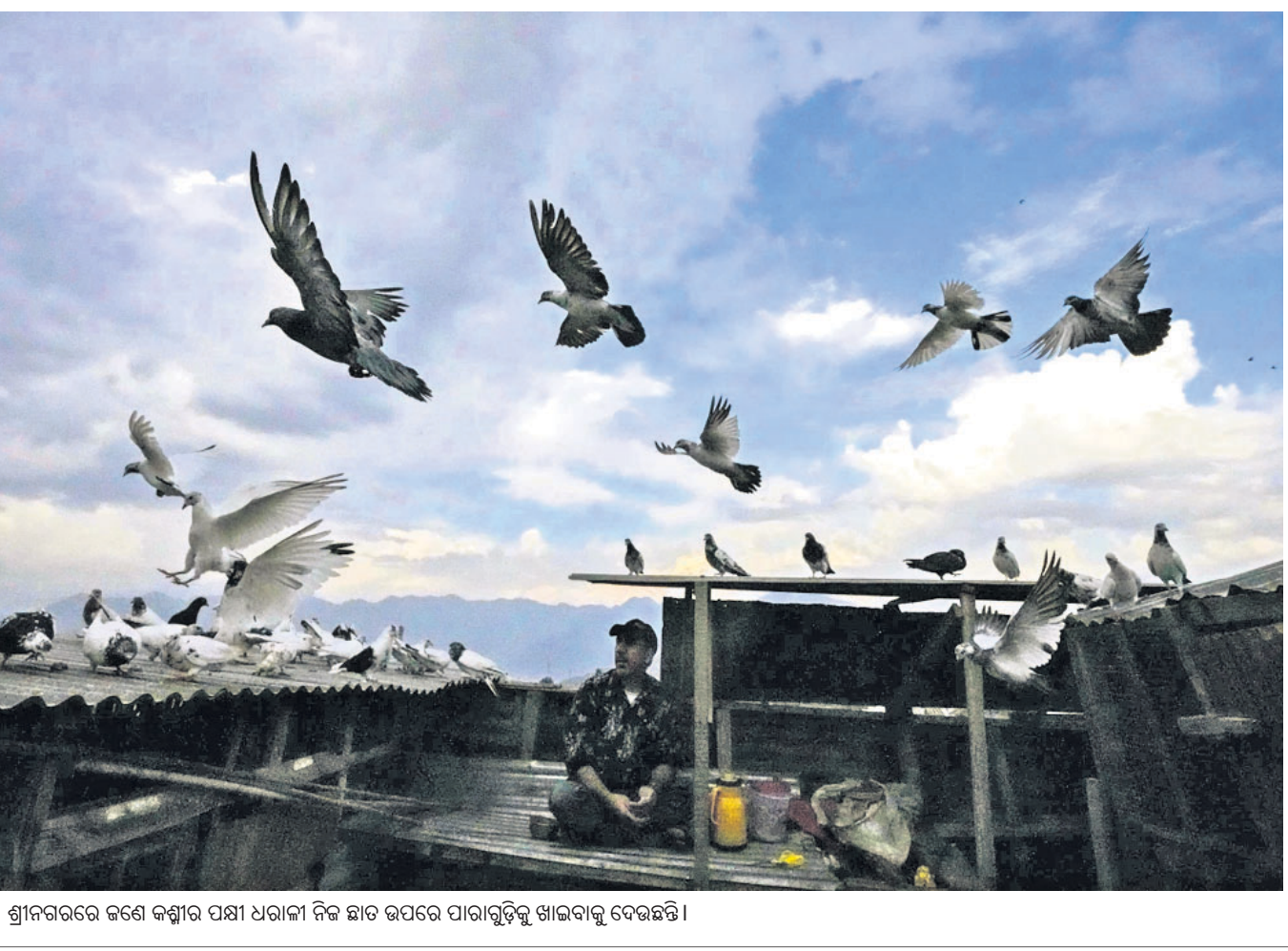
ଶ୍ରୀନଗରରେ ଜଣେ କମ୍ପାନୀ ନିଜ ଛାତ ଉପରେ ପାରାଗୁଡ଼ିକୁ ଖାଇବାକୁ ଦେଉଛନ୍ତି।

ନୂଆଦିଲ୍ଲୀ, ୨୭: ସାଇକ୍ସଜେଟ ବିମାନରେ ଲଗାତର ୧୮ ଦିନ ମଧ୍ୟରେ ଯାକ୍ସିକ ବୁଟି ନେଇ ୮ଟି ଘଟଣା ସାମ୍ନାକୁ ଆସିବା ପରେ କମିଶନରୀ କର୍ତ୍ତବ୍ୟକୁ ତୁରନ୍ତ ସମାପନ କରି ବିମାନ ଚଳାଚଳ ମହାବିନିର୍ଦ୍ଦେଶାଳୟ (ଡିଏସିଏ) ପକ୍ଷରୁ କାରଣ ଦର୍ଶାଅ ନୋଟିସ୍ ଜାରି କରାଯାଇଛି। ବିମାନରେ ସୁରକ୍ଷା ନିୟମକୁ ବ୍ୟବସ୍ଥା ପୁରାପୁରାଣେ ପାଳନ କରାଯାଉ ନ ଥିବା ତିନିଟି ସତ୍ୟ ହେଲା: ଘଟଣା ନେଇ ସାଇକ୍ସଜେଟ ପରିଚାଳନା ନିର୍ଦ୍ଦେଶାଳୟ ଅଧ୍ୟକ୍ଷ ସିଏ ନିଜକୁ ବାଧ୍ୟ କରିବା ସହ ଏସିଆଲାଇଡ଼ରେ ଶତପ୍ରତିଶତ ସୁରକ୍ଷା ବ୍ୟବସ୍ଥା ଥିବା ସେ କହିଛନ୍ତି।