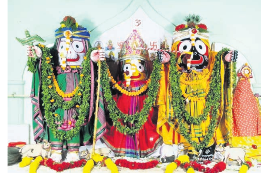
ସୁନାବେଡ଼ାରେ ଠାକୁରଙ୍କ କୃଷ୍ଣ ବଳରାମ ବେଶ।