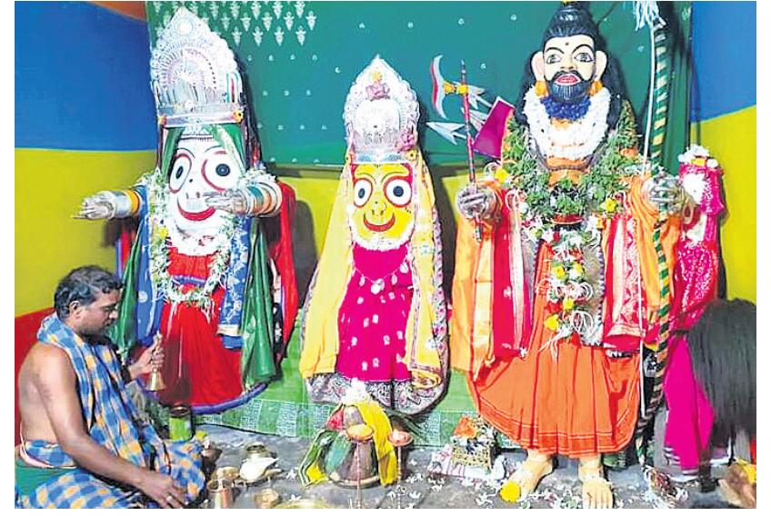
କୋପୋଡ଼ାରେ ପର୍ତ୍ତୁରାମ ବେଶ।