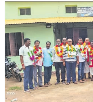
କୋଷାଗୁମୁଡ଼ା, ୨୬ (ବି.ଏନ୍.ଏ.)