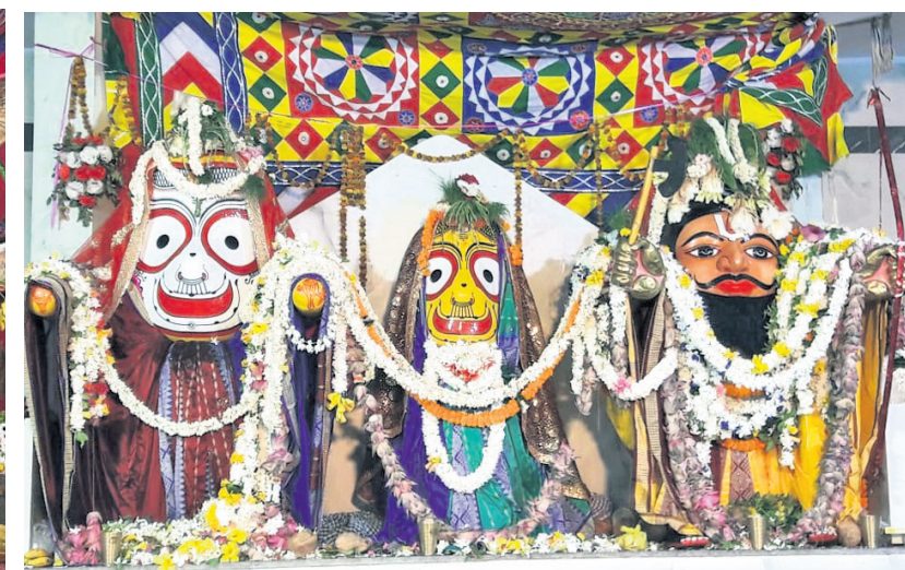
ଗୁଣପୁର ଓ ବିଷମକଟକରେ ଜଗନ୍ନାଥଙ୍କ ପର୍ବୋତ୍ସବ।