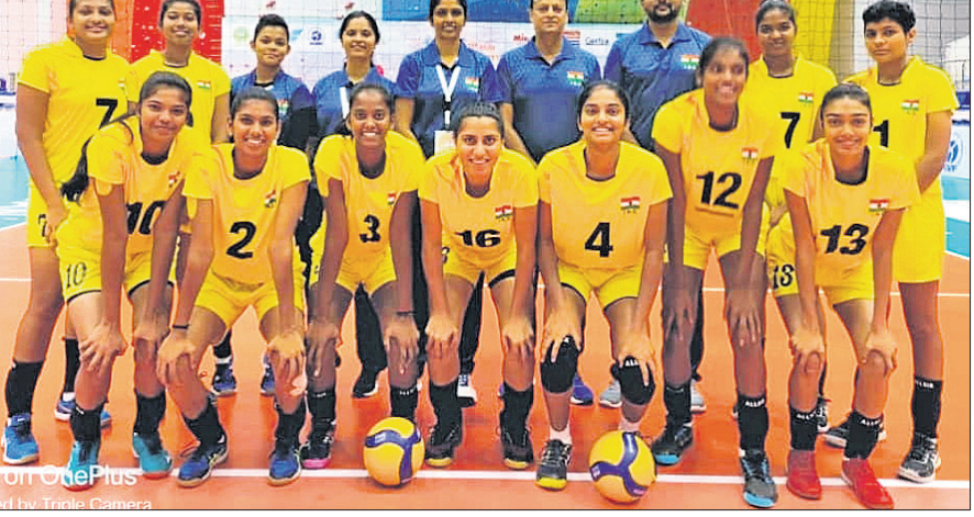
ଭାରତୀୟ ୨୦ ବର୍ଷରୁ କମ୍ ମହିଳା ଭଲିବଲ୍ ଦଳ।

ଭୁବନେଶ୍ୱର, ୬/୭ (କ୍ରୀଡ଼ା ପ୍ରତିନିଧି): କାନାଡା ପ୍ରଦେଶର ସୁଲତାନପୁର ଆରମ୍ଭ ହୋଇଛି ୨୧ତମ ଏସିଆନ ମହିଳା ୨୦ ବର୍ଷରୁ କମ୍ ଭଲିବଲ୍ ଚାମ୍ପିୟନସିପ। ବୁଧବାର ଅନୁଷ୍ଠିତ ପୁଲ୍-ଟିର ଏକ ମ୍ୟାଚରେ ଭାରତ ୩-୦ (୨୫- ୨୧, ୨୫-୧୧, ୨୫-୧୪) ସେଟ୍‌ରେ ଉତ୍କଳବିଦ୍ୟାଳୟକୁ ହରାଇ ଏସିଆନ ମହିଳା ଭଲିବଲ୍ ପ୍ରଥମ ବିଜୟ ହାସଲ କରିଛି। ପୁଲ୍ ଟିରେ ଭାରତ ଓ ଉତ୍କଳବିଦ୍ୟାଳୟ ବ୍ୟତୀତ ଡିଫେଣ୍ଡିଂ ଚାମ୍ପିୟନ ଚାଇନା, ଜାପାନ ଓ ଟାଇପେଲ ଦାସିଦା ଗାଲନିଜ୍ ଟାଇପେଲ ସ୍ଥାନ ପାଇଛି। ଭାରତୀୟ ଦଳରେ ଓଡ଼ିଶାର ୨ ଜଣ ଖେଳାଳି ସ୍ଥାନ ପାଇଛନ୍ତି। ସେମାନେ