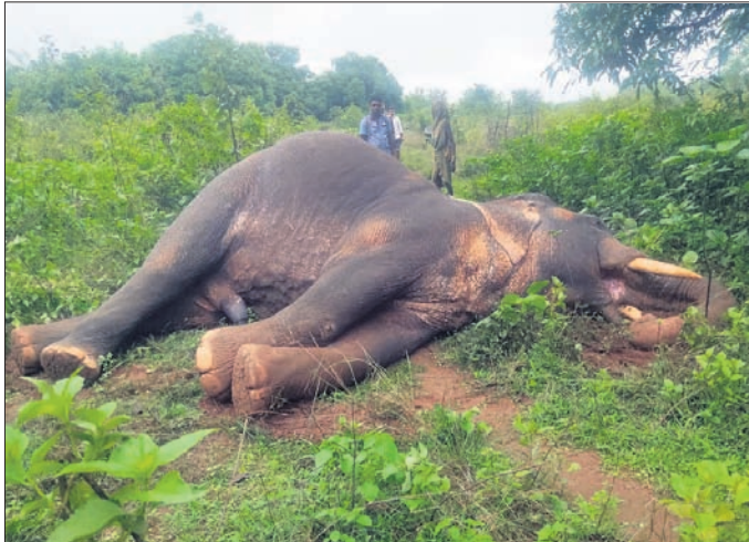
ବିଦ୍ୟୁତ୍ ଫାଶରେ ଲାଗି ମୃତ୍ୟୁ ଘଟିଥିବା ଦନ୍ତା।

ବାରହା ଶିକାର ପାଇଁ ଶିକାରୀ ବିଚାରଣାରେ ଉଚ୍ଚଶ୍ରମି ସମ୍ପର୍କ ବିଦ୍ୟୁତ୍ ଫାଶ। ଏଥିରେ ଛଦି ହୋଇ ଚାଲିଯାଇଛି ଆନୁମାନିକ ୩୦ ବର୍ଷ ବୟସର ଏକ ଦନ୍ତାହାତୀର ଜୀବନ।