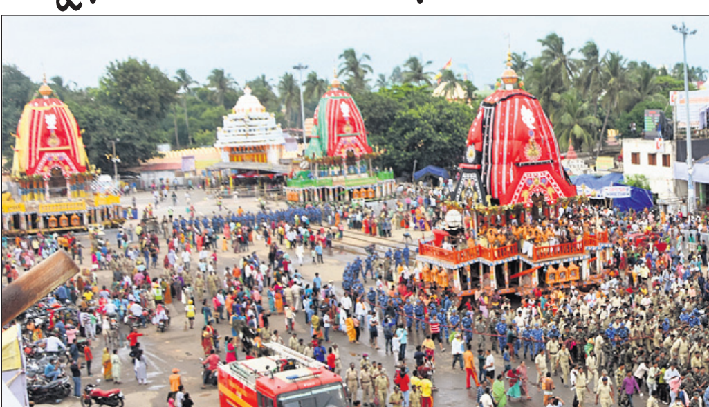
ପୁରୀ ଅର୍ଚ୍ଚ୍ୟ, ୬/୭