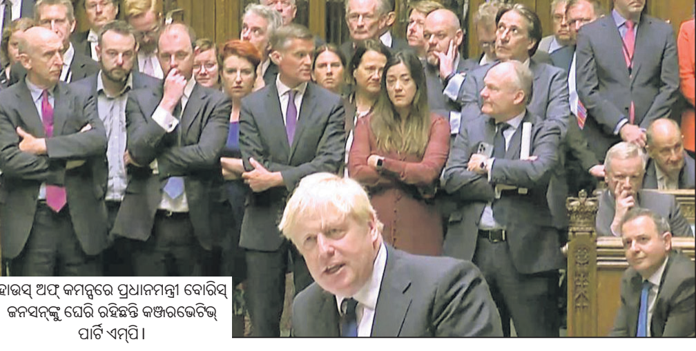
ହାଉସ୍ ଅଫ୍ କମନ୍ସରେ ପ୍ରଧାନମନ୍ତ୍ରୀ ବୋରିସ୍ ଜନ୍ସନଙ୍କୁ ଘେରି ରହିଛନ୍ତି କଞ୍ଚିଭେଟିଭ୍ ପାର୍ଟି ଏମ୍ପି।