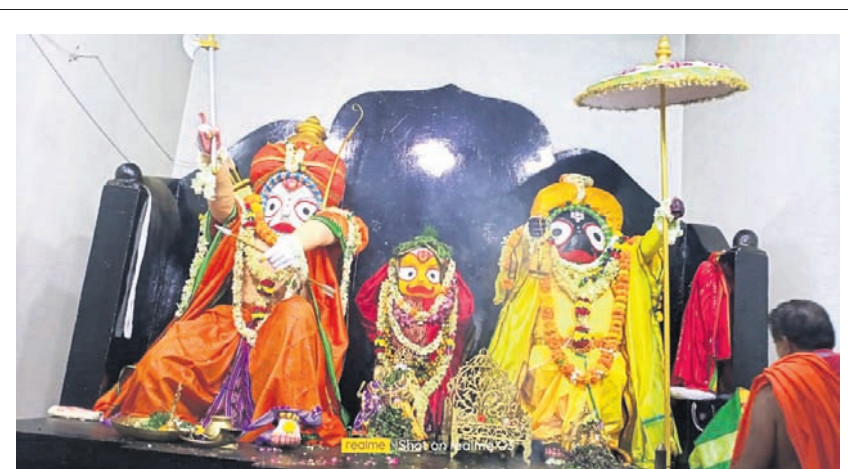
କୋରାପୁଟରେ ଶ୍ରୀଜୀଉଙ୍କ ବାମନ, ପର୍ତ୍ତୁରାମ ବେଶ।