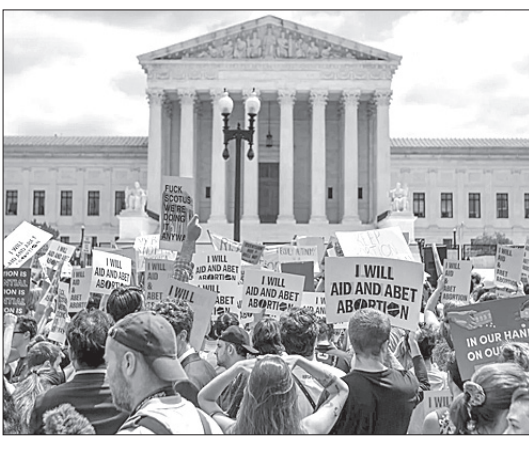
କଟକଶା ଲଗାଇଥିବା ଏକ ଚାକିର ନିର୍ଦ୍ଦାୟୀ ମୁହଁ ଧରି କିମ୍ବା ନ୍ୟାଶନାଲ୍ ରାଇଡ଼ିଂ ଆସୋସିଏସନର କ୍ଷତିପୂରଣ କରିବାର ସମ୍ଭାବନା ହେଲେ। ଆମେରିକାରେ ସବୁଠୁ ସମ୍ପନ୍ନ ଅନୁଷ୍ଠାନଗୁଡ଼ିକ ମଧ୍ୟରେ ପୁଞ୍ଜିକୌର୍ତ୍ତ ଅନ୍ୟତମ। ଏବେକାର ରାୟରେ ଏଂଖ୍ୟାୟକ ଚରମପନ୍ଥୀକ ଗ୍ରହଣାତ୍ମକ ହାର ସବୁଠୁ କମ୍ ରହିଛି ଓ କୋର୍ଟର ଏକ ରାୟକୁ ରୋକିବା ହାରରେ ନାପସନ୍ଦ କରାଯାଇଛି। ଏହି ରାୟ ଯାହା ଗର୍ଭଧାରଣ ଅଧିକାରକୁ ସ୍ପଷ୍ଟ କଲା ସେଥିରୁ ଜଣା ପଡ଼ିଲା ଯେ, ଏଂଖ୍ୟାୟକ ଗଣତନ୍ତ୍ର ବିଚାରପତିଙ୍କ ରାୟ କୋର୍ଟର ବିଧାନିକତାକୁ ଅଣଦେଖା କରିଛି। ଦୁର୍ଭାଗ୍ୟବଶତଃ ଏହି ଏଂଖ୍ୟାୟକ ଦାୟିତ୍ଵ ପାଇଁ ଏଂଖ୍ୟାୟକ ଭାବେ ରହିବାର ସମ୍ଭାବନା ରହିଛି। କାରଣ, ଏଂଖ୍ୟାୟକ ଚରମପନ୍ଥୀମାନେ