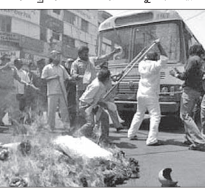
ସେଇ ଦେଶ ଯେଉଁଠି ବନ୍ଦେ ମାତରମ୍ପର ଗୋଟିଏ ସ୍ଵରରେ ଶକ୍ତିଶାଳୀ ବ୍ରଜଶା ପ୍ରାୟାଣ ପାଖରେ ଭଗତ ସିଂ, ରାଜଗୁରୁ, ସାଉରଜର, ଜୟ ରାଜଗୁରୁ, ବାଜି ରାଉଡ଼ଙ୍କ ଭଳି ଅନେକ ମୁତପ୍ରାଣୀ ଆହୁତିଦେଇଥିଲେ। ତେବେ ସାଧାରଣତା ଚାଳିଷ ବର୍ଷ ହେଲା ବେଳକୁ ମୁତବର୍ତ୍ତୀ ଏତେ ପଥଶୁଷ୍ଟ କାଣ୍ଡ ପାଇଁ? ଭାରତ ପୃଥିବୀର ଏକ ମୁତ ଦେଶ ଯେଉଁଠି ୬୦ ପ୍ରତିଶତରୁ ଅଧିକ ୩୫ ବର୍ଷରୁ କମ୍ ବୟସ୍କ ରହିଛନ୍ତି। ତେଣୁ ଏମାନଙ୍କ ଭିତରେ ଦେଶ ପ୍ରତି ସମ୍ମାନ, ଦେଶପ୍ରେମ ଓ ଦରକାର ପଡ଼ିଲେ ଦେଶ ପାଇଁ ବଳିଦାନ ଦେଇପାରୁଥିବା ମୁତ ସମାଜ ତିଆରି କରିବା ଆମର କର୍ତ୍ତବ୍ୟ। ଏହି ଲକ୍ଷ୍ୟକୁ ଆଖି ଆଗରେ ରଖି ଦେଶ ହିତରେ ସରକାର ଅଗ୍ରାଧିକାର ସିଦ୍ଧି ଲାଗୁ କରିବାକୁ ଯାଉଛନ୍ତି। ଏହାଦ୍ଵାରା ଜୀବନର ଏକ ସ୍ଵପ୍ନ ସମାଜ ଜଣେ ମୁତ ଦେଶର ସେନା ସହିତ ରହି ନିଜକୁ ଏକ ଚରିତ୍ରବାନ, ଶୁଣିକିତ ଦେଶପ୍ରେମୀ ନାଗରିକ ରୂପେ ଗଢ଼ିତୋଳିବ ଓ ଦେଶର ସେବା କରିବାରେ ସହଭାଗିତା ଦେବ। ଶେଷରେ ଏକ ମୋଗା ଅଙ୍କର ଅବସରକାଳୀନ ଅର୍ଥ ପାଲ ଭବିଷ୍ୟତ ଆର୍ଥିକବିଶାଳ ହୋଇ ସମ୍ମାନର ସହ ଜୀବନ ବିତେଇବା ତା' ଛଡ଼ା ସେନାରେ ଲାସ ଅଧିକାରୀ

ଆମେରିକାରେ ବ୍ୟାପିଥିଲା କୌଣସି ଜାତୀୟ ସମ୍ପତ୍ତି ନଷ୍ଟ ହୋଇ ନ ଥିଲା। ହିଂସାର ତାରଣା ବିରୋଧୀ ଆନ୍ଦୋଳନରେ ହଜାର ହଜାର ଆନ୍ଦୋଳନକାରୀ ଅନେକ ଦିନ ଧରି ବିରୋଧ ପ୍ରଦର୍ଶନ କରିଥିଲେ ମଧ୍ୟ ଜାତୀୟ ସମ୍ପତ୍ତି ନଷ୍ଟ ହୋଇ ନ ଥିଲା। ଏହାର କାରଣ ହେଲା ସେମାନେ ଦେଶର ସମ୍ପତ୍ତି ନିକଟ ସମ୍ପତ୍ତି ଭାବିଲେ। କିନ୍ତୁ ଆମ ଦେଶରେ ସରକାରୀ ସମ୍ପତ୍ତିକୁ ନଷ୍ଟ କରିବାର ଆମକୁ ଆନନ୍ଦ ମିଳିଥାଏ। ଅର୍ଥାତ୍ ଆମ ମୁତଶକ୍ତି ଭିତରେ ପ୍ରଖର ରାଷ୍ଟ୍ର ଭକ୍ତିର ଅଭାବ ପରିଲକ୍ଷିତ ହୁଏ, ଯାହା ବିଦେଶରେ ନ ଥାଏ। ତେଣୁ ଆମମାନଙ୍କୁ ମୁତଶକ୍ତି ଭିତରେ ଛାଡ଼ି ଅବଦ୍ଧାୟ ଦେଶ ପ୍ରେମର ଭାବନା ଭରି ଦେବାକୁ ହେବ। ଇଏ