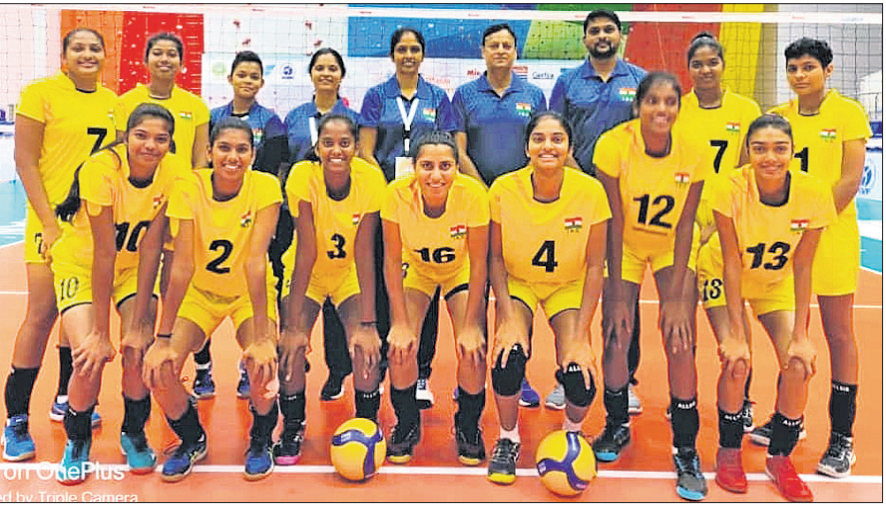
ଭାରତୀୟ ୨୦ ବର୍ଷରୁ କମ୍ ମହିଳା ଭଲିବଲ୍ ଦଳ।