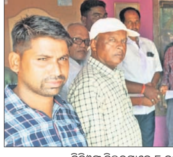
ବିତ୍ତକୁ ଡିଲିଭରମାନେ ୮ ଦମ୍ପା ସମ୍ବଳିତ ଦାବିପତ୍ର ପ୍ରଦାନ କରୁଛନ୍ତି।

ପଟ୍ଟାମୁଣ୍ଡାଇ, ୨୭ (ସ.ପ୍ର.) ସର୍ବଭାରତୀୟ ଡିଲିଭରୀ ଫେଡ଼ରେଶନ ନିଷ୍ପତ୍ତିକ୍ରମେ ଓଡ଼ିଶା ରିଟେଲର ମହାସଂଘ ପକ୍ଷରୁ ରାଜ୍ୟର ସମସ୍ତ ବିତ୍ତ କାର୍ଯ୍ୟାଳୟ ଆଗରେ ରୁପସାର ଶାନ୍ତିପୂର୍ଣ୍ଣ ଶୋଭାଯାତ୍ରା ଓ ବିକ୍ଷୋଭ ପ୍ରଦର୍ଶନ କରାଯାଇଛି। ଏହିକ୍ରମରେ ପଟ୍ଟାମୁଣ୍ଡାଇ ବିତ୍ତକ କାର୍ଯ୍ୟାଳୟ ଆଗରେ ବିକ୍ଷୋଭ ପ୍ରଦର୍ଶନ କରାଯାଇଛି। ୮ଟି ମୁଖ୍ୟ ଦାବି ନେଇ ରାଜ୍ୟ ଖାସ୍ ଯୋଗାଣ ଓ ଖାଉଟି କଲ୍ୟାଣ, ସମବାୟ ମନ୍ତ୍ରୀଙ୍କ ଉଦ୍ଦେଶ୍ୟରେ ବିତ୍ତ ଉତ୍ତର ଚକ୍ର ପ୍ରତିତାକୁ ଦାବିପତ୍ର ପ୍ରଦାନ କରାଯାଇଛି। ବିକ୍ଷୋଭରେ ରୁକ୍ତ ସମସ୍ତ ଡିଲିଭରୀ ସାମିଲ ହୋଇଥିଲେ। ସେମାନଙ୍କ ମୁଖ୍ୟ ଦାବି ରୁକ୍ତ ମଧ୍ୟରେ କେଉଁମାନେ ମହାମାରୀ ସମୟରେ ଡିଲିଭରୀ ନିଜ ଜୀବନକୁ ବଢ଼ି ଲଗାଇ ରାଶିନ ସାମଗ୍ରୀ ବନ୍ଧନ କରିଥିବାବେଳେ ସେମାନଙ୍କୁ ସରକାରୀ ପାରିଶ୍ରମିକ ଯୋଗାଇ ଦେବା, ପ୍ରଧାନମନ୍ତ୍ରୀ ଗରିବ