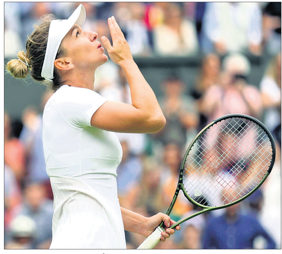
ମହିଳା ସିମିଟି କ୍ୱାର୍ଟର ଫାଇନାଲ ମ୍ୟାଟ ଚିତ୍ରଟା ପରେ ସିମୋନା ହାଲେପ।

ସେହିପରି ଅନ୍ୟ ଏକ କ୍ୱାର୍ଟର ଫାଇନାଲରେ ୧୭ତମ ସିଡ୍‌ରାବ୍‌କିନା ନମ୍ବର-୧ କୋର୍ଟରେ ଆଇଲ୍ୟା ଗୋମେଜାଲୋନୋଭିକୁ ୪-୬, ୬-୨, ୬-୩ ସେଟ୍‌ରେ ହରାଇଛନ୍ତି। ୩ ବର୍ଷ ପୂର୍ବେ ଫ୍ରେମ୍‌ଲଡନ ଚାଲିଥିବା ହାଲେପଙ୍କ ପ୍ରଦର୍ଶନ ଏଥର ପ୍ରଭାବୀ ରହିଛି। ଆଇଲ୍ୟା ଗୋମେଜାଲୋନୋଭି ୧୭ତମ ସିଡ୍ ରୋମାନିଆର ଚେମ୍ପିୟନ ଚାରୋଲ୍‌କା ମ୍ୟାଟ ବିଜୟ ସଂଖ୍ୟା ୧୨ରେ ପହଞ୍ଚିଛନ୍ତି। ହାଲେପ ୨ ଥର ନିଜ ଚାଲିଥିବା ଡିଫେଣ୍ଡ କରିବାର ସୁଯୋଗ ମିଳି କରିଥିଲେ। ୨୦୨୦ରେ କରୋନା ଭାଇରସ