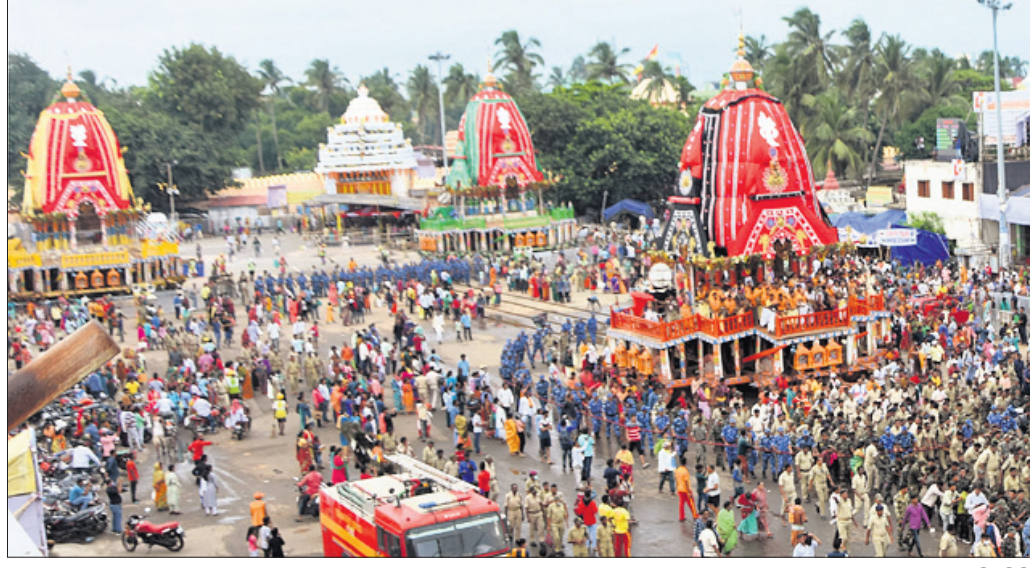
ପୁରୀ ଅର୍ପିସ, ୨୨