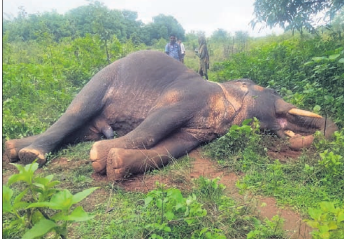
ବିଦ୍ୟୁତ୍ ଫାଶରେ ଲାଗି ମୃତ୍ୟୁ ଘଟିଥିବା ଦନ୍ତା।