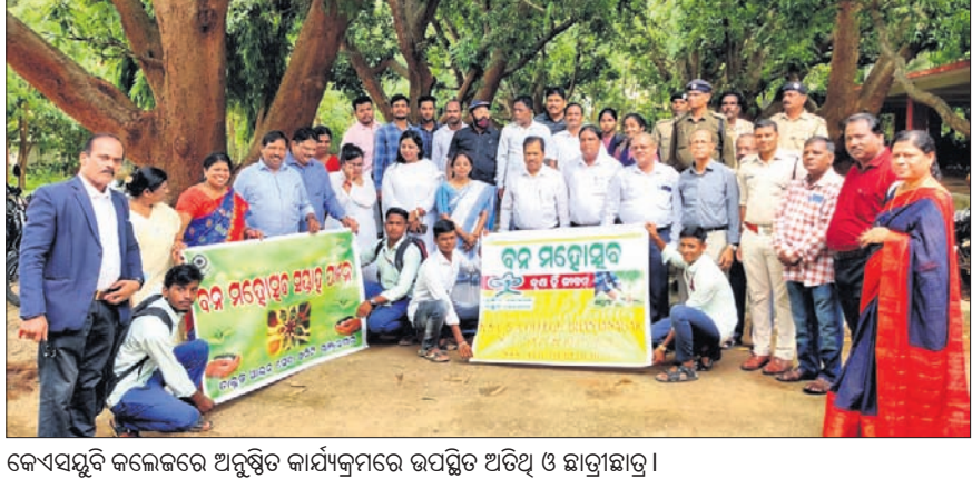
କେଏସ୍‌ୟୁବି କଲେଜରେ ଅନୁଷ୍ଠିତ କାର୍ଯ୍ୟକ୍ରମରେ ଉପସ୍ଥିତ ଅତିଥି ଓ ଛାତ୍ରାଛାତ୍ରୀ।

ଭଞ୍ଜନଗର, ୬୭(ଡି.ଏନ.ଏ.) ଭଞ୍ଜନଗର କବି ସମ୍ରାଟ ଉପେନ୍ଦ୍ର ଭଞ୍ଜ (କେଏସ୍‌ୟୁବି) ମହାବିଦ୍ୟାଳୟ ପରିସରରେ ବୁଧବାର ଭଞ୍ଜନଗର ଚାଲୁ ଆଇନ ସେବା କମିଟି ପକ୍ଷରୁ ବନ ମହୋତ୍ସବ ସପ୍ତାହ ପାଳିତ ହୋଇଯାଇଛି।