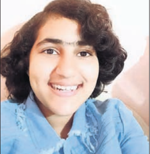
ଚନ୍ଦ୍ର ଚନ୍ଦ୍ରଶ୍ରୀ ଚନ୍ଦ୍ରଶାଳ ସଫଳତାକୁ ଭଗବାନ ଓ ଗୁରୁଜୀ ଗୁରୁମା' ମାନଙ୍କ ଆଶୀର୍ବାଦ ବୋଲି କହିଛନ୍ତି।

ମାଟ୍ରିକ ପରୀକ୍ଷା ଫଳ ବୁଧବାର ପ୍ରକାଶ ପାଇଛି। କନ୍ୟାମାଳ ଜିଲ୍ଲାରେ ପାଞ୍ଚ ହାର ୮୯.୯୪ ପ୍ରତିଶତ ରହିଛି।