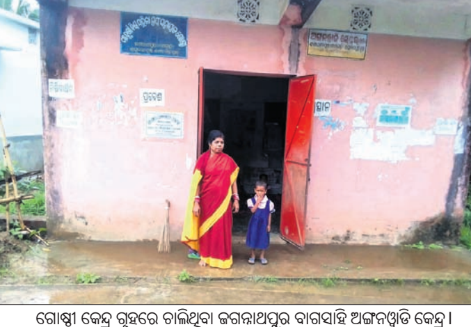
ଗୋଷ୍ଠୀ କେନ୍ଦ୍ର ଗୃହରେ ଚାଲିଥିବା କରନାଥପୁର ବାଗସାହି ଅଙ୍ଗନଘାଟି କେନ୍ଦ୍ର।