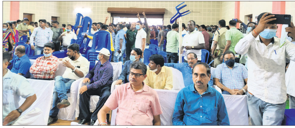
ଜନଶୁଣାଣିରେ ଭାଗ ନେଇଥିବା ଲୋକେ ହୋଇଛନ୍ତି।

ଯାଜପୁର ଜିଲ୍ଲା ପୁଲିକା ଚନ୍ଦ୍ରସିଂହ ଥାନା କାଳିଆପାଣି ଗ୍ରାମରେ ଥିବା ଇମ୍ପା ମହାଗିରି ଭୂତଳ ଖଣିର ଉତ୍ପାଦନ କ୍ଷମତା ବୃଦ୍ଧି ପାଇଁ ଗୁଣ୍ଡିଚା ଏକ ପରିବେଶ ଜନଶୁଣାଣି ଅନୁଷ୍ଠିତ ହୋଇଥିଲା। ତେବେ ଉକ୍ତ ଜନଶୁଣାଣିକୁ ସାଧାରଣ ଜନତା ଓ ଶ୍ରମିକ ସଂଘ ବିରୋଧ କରିବାକୁ ଜନଶୁଣାଣି ବିଫଳ ହୋଇଛି। ଏପରି କି ଜନଶୁଣାଣିକୁ ବାତିଲ କରି ଦିଆଯାଇଛି। ଆଗାମୀ ଦିନରେ ପୁଣି ଜନଶୁଣାଣି ହେବ ବୋଲି ସୂଚନା ମିଳିଛି। ରାଜ୍ୟ ପ୍ରତ୍ୟକ୍ଷ ନିୟନ୍ତ୍ରଣ ବୋର୍ଡ ନବରଙ୍ଗପୁର ୨, ରାୟଗଡ଼ ୧୫, ନୂଆପଡ଼ା ୨, ପୁରୀ ୩୬, ରାୟଗଡ଼ା ୧୭, ସୋନପୁର ୧୯ ଓ ସୁନ୍ଦରଗଡ଼ରେ ୨୬ଟି ପଦବୀ ଖାଲି ପଡ଼ିଥିବା ମନ୍ତ୍ରୀ ବିଧାନସଭାରେ ତଥ୍ୟ ପ୍ରଦାନ କରିଛନ୍ତି।