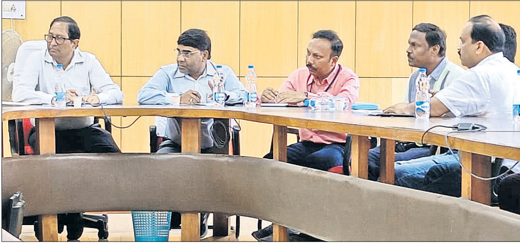
ଦାବି ସମ୍ପର୍କରେ ବୈଠକରେ ଆଲୋଚନା ହୋଇଛି।

ନାଲକୋ ସ୍ନେହଲତର ପ୍ଲାନିଂ ଅନୁଯାୟୀ ଶ୍ରମିକ ସଂଗଠନ ନେତ୍ର ପକ୍ଷରୁ ବିଭିନ୍ନ ଦାବିରେ ଗୁରୁବାର ସକାଳେ ନାଲକୋ ଜିଲ୍ଲା କାର୍ଯ୍ୟାଳୟ ସମ୍ମୁଖରେ ବିରୋଧ କରାଯାଇଥିଲା। ନେତ୍ର ପକ୍ଷରୁ ସମାଧାନ ନିର୍ଦ୍ଦେଶ ଦେଇ ନାଲକୋ ପଦାଧିକାରୀ ଓ କର୍ମଚାରୀମାନେ କାର୍ଯ୍ୟାଳୟ ସମ୍ମୁଖରେ ବିରୋଧ କରିଥିଲେ। ଦାବିଦିନରୁ ଉପରୋକ୍ତ ଦାବି ଗ୍ରହଣ କରିବା ପାଇଁ ନେତ୍ର ପକ୍ଷରୁ ପ୍ରତ୍ୟାବେଦନା କରାଯାଇଛି।