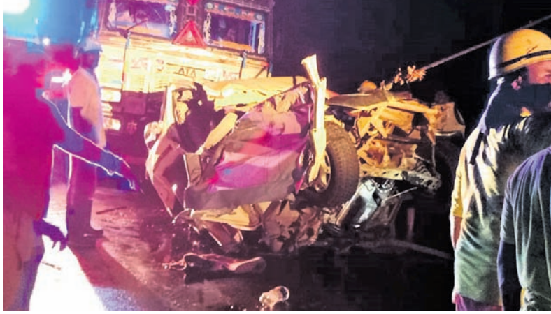
ଦୁର୍ଘଟଣା ସ୍ଥଳରେ ଉଦ୍ଧାର କର୍ମଚାରୀଙ୍କୁ ଦେଖାଯାଉଛି।

ଦ୍ୱାରଶୁଣୀ ଘାଟିରେ ଦୁର୍ଘଟଣା ହୋଇଛି। ୪ ମୃତ ହୋଇଛନ୍ତି। ଏହା ଏକ ସାମାଜିକ ସମସ୍ୟା ଯାହାକୁ ନିର୍ମୂଳକ ଭାବରେ ଦୂର କରିବା ପାଇଁ ପ୍ରଶାସନିକ ପଦକ୍ଷେପ ଗ୍ରହଣ କରିବାକୁ ପଡ଼ିଛି।