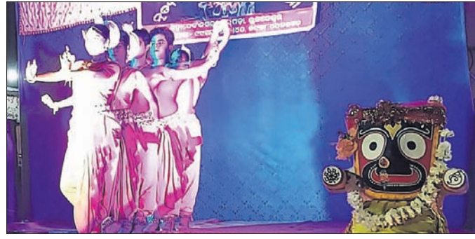
କଳାକାରମାନେ ନୂତନ ପରିବେଷଣ କରୁଛନ୍ତି।