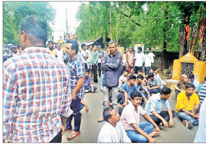
ଅଞ୍ଚଳବାସୀ ରାସ୍ତା ଅବରୋଧ କରିଛନ୍ତି।