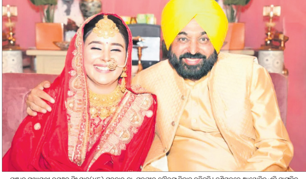
ପଞ୍ଜାବ ମୁଖ୍ୟମନ୍ତ୍ରୀ ଭଗତ ସିଂହ ମାନ୍ (ଧର୍ମ) ଗୁରୁବାର ତା. ଗୁରୁପ୍ରୀତ ଭୌରକୁ ବିବାହ କରିଛନ୍ତି।