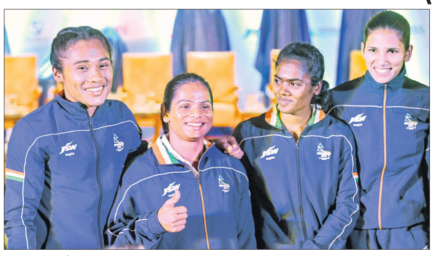
ବର୍ଦ୍ଧିତ ରାଜ୍ୟଗୋଷ୍ଠୀ କ୍ରୀଡ଼ା ୨୦୨୨ ବିଦ୍ୟା ଓ କିର୍ ଉନ୍ନତର ଉତ୍ସବ ଅବସରରେ ଭାରତୀୟ ଆଥଲେଟ୍ ହିମା ଦାସ, ଦୂତା ଚାନ୍ଦ ଓ ଅନ୍ୟମାନେ।

ଭାରତୀୟ ଦଳ ୨୮ ଚାରିଶରେ ବର୍ଦ୍ଧିତ ହୋଇଥିବା ବେଳେ ଆରମ୍ଭ ହେବାକୁ ଯାଉଥିବା ରାଜ୍ୟଗୋଷ୍ଠୀ କ୍ରୀଡ଼ା ପାଇଁ ଗୁରୁବାର ୨୧୫ ଜଣ ଆଥଲେଟ୍ ଦଳ ଦଳ ଯୋଗଣ କରାଯାଇଛି।