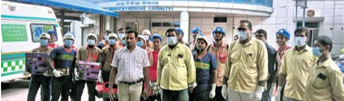
ଆଇଟିଆଇର ୨୦ ଜଣିଆ ଟିମ୍ ।