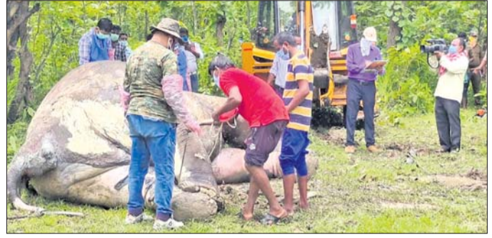
ଘଟଣାସ୍ଥଳରେ ତଦନ୍ତ ଚାଲିଛି । ଏହି ଘଟଣାକୁ ଗୁରୁତର ସହ ନେଇଛନ୍ତି । ହାତୀ ହାତୀଟିର ମୃତ୍ୟୁ ଘଟିଥିବା ତଦନ୍ତକୁ ଯଦି କୌଣସି କର୍ମଚାରୀଙ୍କ ଅବହେଳାକୁ ଜଣାପଡ଼ିବ ତେବେ ତାଙ୍କ ବିରୋଧରେ

ବୃତ୍ତ କାର୍ଯ୍ୟାନୁଷ୍ଠାନ ନିଆଯିବ ବୋଲି କହିଛନ୍ତି । ହାତୀ ଶରୀରର ଶତ ଚିହ୍ନ ଦୁଇଟି କେଉଁଠି ପରିସ୍ଥିତିରେ ହୋଇଛି ସେ ନେଇ ଅଧିକ ପରୀକ୍ଷା ପାଇଁ ନମୁନା ପଠାଯିବ । ବ୍ୟବହୃତ ରିପୋର୍ଟ ଆସିବା ପରେ ଠିକ୍ କାରଣ ଜଣାପଡ଼ିବ ବୋଲି ଡିଏଫଓ ବେହେରା କହିଛନ୍ତି । ଅପରପକ୍ଷେ ଶିକାରୀମାନଙ୍କୁ ଧରିବା ଲାଗି ବନ ବିଭାଗ ପକ୍ଷରୁ ଚେଷ୍ଟା ଚାଲିଛି । କର୍ମଚାରୀଙ୍କ ଅବହେଳା ଯୋଗୁ ଏହି ବନଖଣ୍ଡରେ ବିଗତ ଦିନରେ ଅନେକ ହାତୀ ଓ ଅନ୍ୟ ବନ୍ୟପ୍ରାଣୀଙ୍କ ବିରୁଦ୍ଧ ଆଘାତରେ ମୃତ୍ୟୁ ଘଟିଛି । ୧୯୯୫ ଏବଂ ୨୦୧୫ରେ ବାଘ ଶିକାର ହୋଇଥିଲା । ବର୍ତ୍ତମାନ ଏହି ବନଖଣ୍ଡ ଉପରେ ହାତୀ