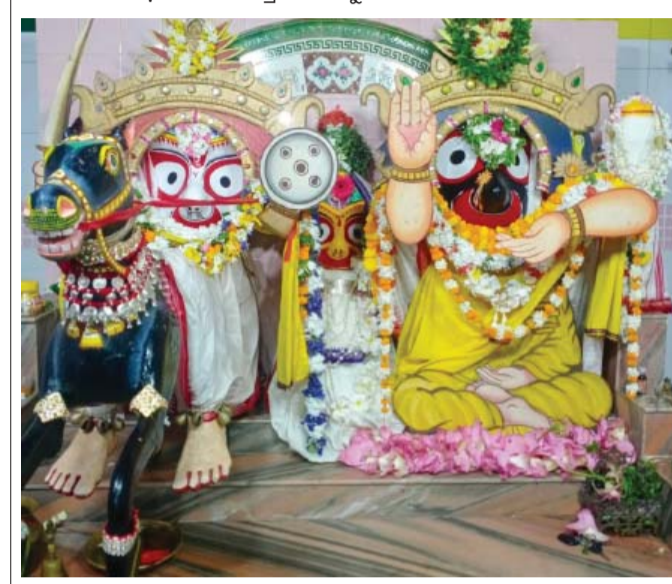
ଗୋଷାଣୀ ନୂଆଗାଁ ଆଡ଼ପ ମଠପରେ ଶ୍ରୀକାନ୍ତଙ୍କୁ ବୁଦ୍ଧ ଓ ବଳଭଦ୍ରଙ୍କ କଳକା ଅବତାର।