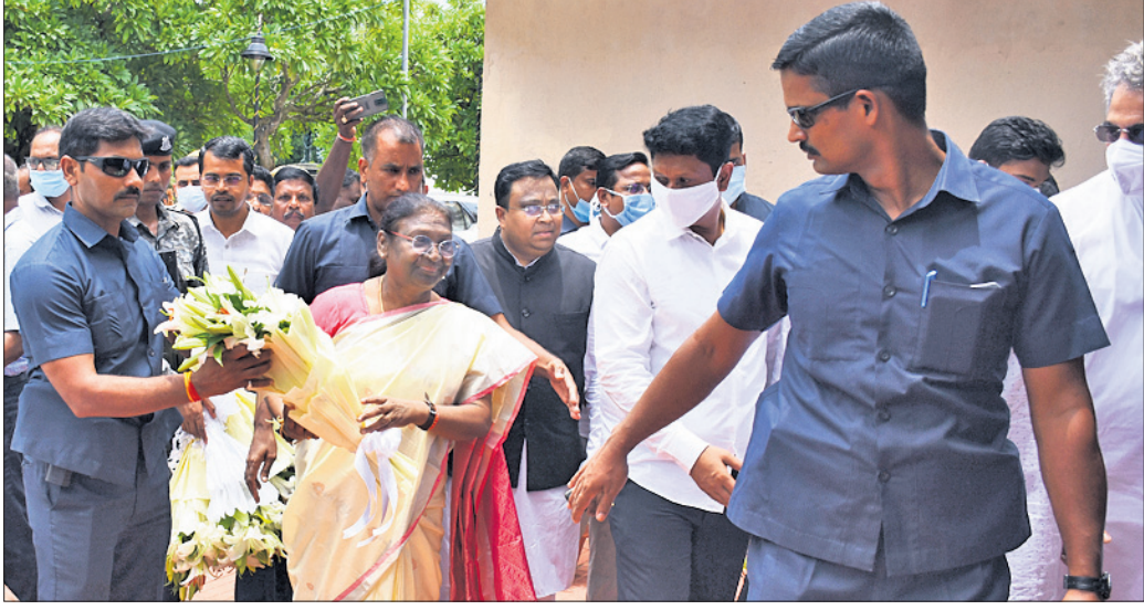
ଶୁକ୍ରବାର ଓଡ଼ିଶା ଗସ୍ତରେ ଆସିଥିବା ଏନ୍ଡିଏ ରାଷ୍ଟ୍ରପତି ପ୍ରାର୍ଥୀ ଦ୍ରୌପଦୀ ମୁର୍ମୁଙ୍କୁ ବିଜେଡି ପକ୍ଷରୁ ବିଧାନସଭା ସମ୍ମିଳନୀ କକ୍ଷ ସମ୍ମୁଖରେ ସ୍ୱାଗତ କରାଯାଇଛି ।