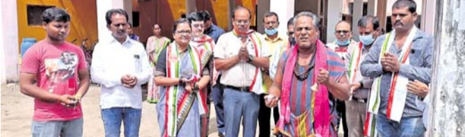
ଉପସ୍ଥିତ କଲେଜ କର୍ତ୍ତୃପକ୍ଷ, ବିଏମସି ମେୟର ଓ ଯତ୍ନ।