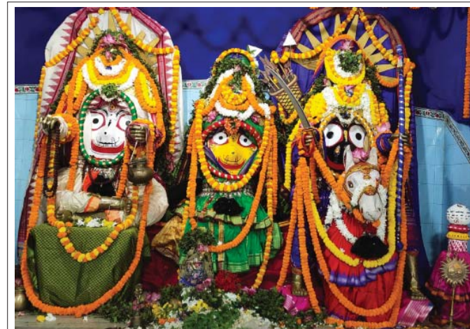
କୋର୍ଟପେଟା ଆଡ଼ପ ମଠପରେ ଶ୍ରୀକାନ୍ତଙ୍କୁ ବୁଦ୍ଧ ଓ ଜଗନ୍ନାଥଙ୍କ କଳକା ଅବତାର ଦେଖା।

ପଢ଼ାଯାଉଥିବା ସେ କହିଛନ୍ତି। ଏଥିସହ ଛାତ୍ରାଛାତ୍ରୀମାନେ ମଧ୍ୟାହ୍ନ ଭୋଜନ ନିମନ୍ତେ ସ୍ଥାନ ଅଭାବ କାରଣରୁ ବିଦ୍ୟାଳୟ ପରିସର ବାହାରେ ବସୁଛନ୍ତି। ବିଦ୍ୟାଳୟ ପ୍ରଧାନ ଶିକ୍ଷୟିତ୍ରୀ କହିଛନ୍ତି ଯେ, ସ୍ମାର୍ଟ ସ୍କୁଲରେ ଠିକ ଭାବେ ବିଦ୍ୟୁତ୍ ସଂଯୋଗକରଣ ହୋଇନି। ସ୍କୁଲ ପରିସରରେ ରହିଥିବା ଏକ ଲାଇଟି ତିଳି ଚୁଡ଼ିକ ଲାଗିବା ସମୟରେ ବିଦ୍ୟୁତ୍ ଆଘାତ ଲାଗି ରହୁଛି। ଶୈଳାକନ୍ୟ ନିର୍ମାଣ ହୋଇଛି କିନ୍ତୁ ଡ୍ରେସିଂ ଅଟକାବନ୍ଧା ମଧ୍ୟରେ ରହିଛି। ସ୍କୁଲରେ ରହିଥିବା ସମସ୍ୟା ରୁଡିକୁ ନେଇ ବିଏମସି ଜେଲଜଙ୍କୁ ବାରମ୍ବାର ଅବଗତ କରାଯାଇଛି, କିନ୍ତୁ କୌଣସି ପଦକ୍ଷେପ ଗ୍ରହଣ କରାଯାଇ ନାହିଁ। କିନ୍ତୁ ଆସନ୍ତା ସୋମବାରଠାରୁ ସ୍ମାର୍ଟ ସ୍କୁଲରେ ପାଠ ପଢ଼ା ହେବ ବୋଲି ସେ କହିଛନ୍ତି।