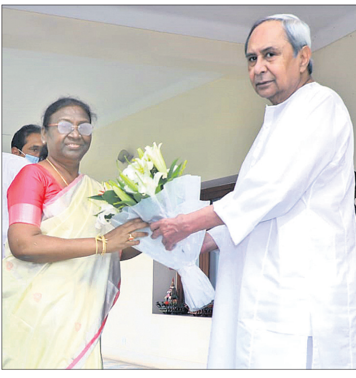
ନବୀନ ନିବାସରେ ରାଷ୍ଟ୍ରପତି ପ୍ରାର୍ଥୀ ଦ୍ରୌପଦୀ ମୁର୍ମୁଙ୍କୁ ମୁଖ୍ୟମନ୍ତ୍ରୀ ନବୀନ ପଟ୍ଟନାୟକ ସ୍ୱାଗତ କରୁଛନ୍ତି।

ପୁରୀ ଅଫିସ, ୮।୭ ମହାପ୍ରଭୁଙ୍କ ନବଦିନାତ୍ମକ ଯାତ୍ରା ଶେଷ ହୋଇଛି। ଶ୍ରୀଗୁଣ୍ଡିଚା ମନ୍ଦିରରେ ଲୀଳାଖେଳା ସରିବା ପରେ ଶନିବାର ବାହୁଡ଼ି ଯାତ୍ରାରେ ଶ୍ରୀମନ୍ଦିରକୁ ବାହୁଡ଼ିବେ ଚତୁର୍ଥା ବିଗ୍ରହ। ଏଥିପାଇଁ ରଥ-ପଥ ସବୁ ପ୍ରସ୍ତୁତ। ଚିନ୍ତାଧାରା ଦକ୍ଷିଣମୋଡ଼ ହୋଇ ନାକଡ଼ଣା ଦ୍ୱାର ସମ୍ମୁଖରେ ଦଣ୍ଡାୟମାନ। ଗୋଟିଏ ପଟେ ବୈଷୟିକ ଚିନ୍ତାଧାରା ଯାତ୍ରା କାର୍ଯ୍ୟ ଶେଷ କରିଥିବା ଫୁଣ୍ଡା-୪ ଅମରନାଥରେ ବାଦଲଫଟା ବର୍ଷା: ୧୫ମୃତ