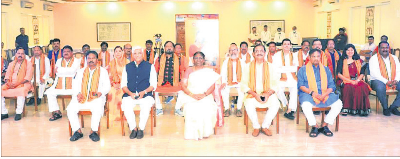
ରାଜ୍ୟ ଅତିଥି ଭବନରେ ଭାଜପା ଏମ୍ପି ଓ ବିଧାୟକଙ୍କ ଗହଣରେ ଦ୍ରୌପଦୀ ମୁର୍ମୁ ।