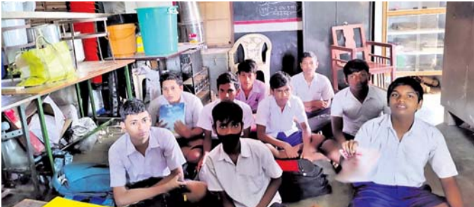
ପ୍ରାଥମିକ ବିଦ୍ୟାଳୟ ଗୃହରେ ପାଠ ପଢ଼ା।

ଗଞ୍ଜାମ ଜିଲ୍ଲାରେ ଛାତ୍ରାଛାତ୍ରୀଙ୍କୁ ଉଚ୍ଚତ ପ୍ରଶାଳନାରେ ଶିକ୍ଷାଦାନ ପାଇଁ ବିତାଣ ପର୍ଯ୍ୟାୟରେ ୨୩୦ଟି ହାଇସ୍କୁଲକୁ ରୁପାନ୍ତରିତ କରାଯାଇଛି। ଗତ ଜୁନ ୩ ତାରିଖରେ ପୁଞ୍ଜାମନ୍ତ୍ରାଙ୍କ ଦ୍ୱାରା ଭର୍ତ୍ତିଆଲ ମାଧ୍ୟମରେ ଏସବୁ ସ୍ମାର୍ଟ ସ୍କୁଲର ଉଦଘାଟନ କରାଯାଇଥିଲା। ଏଥିମଧ୍ୟରେ ବ୍ରହ୍ମପୁରରେ ୭ଟି ହାଇସ୍କୁଲ ରହିଛି। ଏହାପୂର୍ବରୁ ଗତ ନଭେମ୍ବର ୧୬ ତାରିଖରେ ବ୍ରହ୍ମପୁରରେ ୪୮ଟି ସ୍ମାର୍ଟ ସ୍କୁଲ ଉଦଘାଟନ ହୋଇଥିଲା। ତେବେ ସ୍ମାର୍ଟ ସ୍କୁଲ ଉଦଘାଟନ ପରେ ସେଠାରେ ପାଠ ପଢ଼ାଯାଉ ନ ଥିବା ଅଭିଯୋଗ ହେଉଛି। ବ୍ରହ୍ମପୁର ସହରର ଲାଞ୍ଜିପଲ୍ଲୀ ସରକାରୀ ପୌର ଉଚ୍ଚ ବିଦ୍ୟାଳୟରେ ଏଭଳି ଦେଖାଯାଇଛି। ଏହି ବିଦ୍ୟାଳୟଟି ସ୍ମାର୍ଟ ସ୍କୁଲରେ ରୁପାନ୍ତରିତ ହେବା ପରଠାରୁ ଦିନଟିଏ ବି ପାଠପଢ଼ା