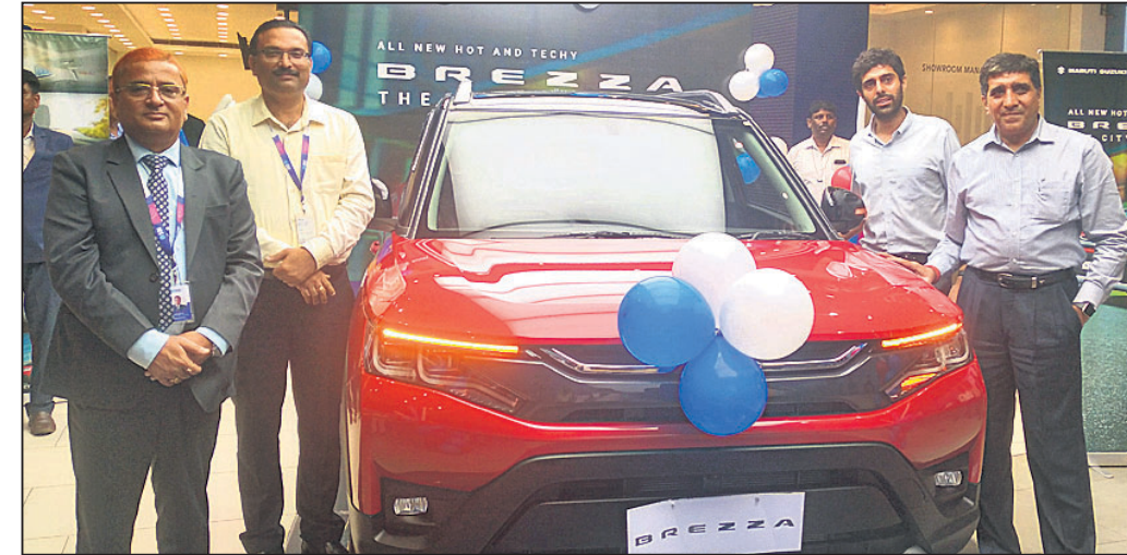
ଶୁକ୍ରବାର ପ୍ଲାନୀୟ ରଘୁଲଗଡ଼ିଆ 'ନାରାୟଣ ମୋଟର୍ସ' ପରିସରରେ ଅଲ୍‌ନୁ 'ବ୍ରିଜା'ର ଅନାବରଣ ଉତ୍ସବ ଆୟୋଜିତ ହୋଇଯାଇଛି ।