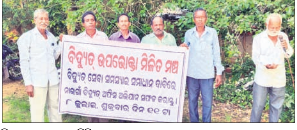
ବିଦ୍ୟୁତ୍ ଉପଭୋକ୍ତା ମିଳିତ ମାଧ୍ୟମ ସମ୍ମାନ ଦାବିପତ୍ର ପ୍ରଦାନ କରାଯାଇଛି।

ନାଉରୀ କ୍ଷେତ୍ର ବିଦ୍ୟୁତ୍ ଉପଭୋକ୍ତା ମିଳିତ ମାଧ୍ୟମ ପକ୍ଷରୁ ୧୦ ଦର୍ପା ଦାବି ସମ୍ମଳିତ ଦାବିପତ୍ର ବିଦ୍ୟୁତ୍ ବିଭାଗର କାର୍ଯ୍ୟନିର୍ବାହୀ ଅଧିକାରୀଙ୍କ ଉଦ୍ଦେଶ୍ୟରେ ଶୁକ୍ରବାର କନିଷ୍ଠ ସମ୍ମାନ ଦାବିପତ୍ର ପ୍ରଦାନ କରାଯାଇଛି। ସେମାନଙ୍କ ଦାବିପତ୍ର ମଧ୍ୟରେ ବିଦ୍ୟୁତ୍ ଶୁଳ୍କ ହ୍ରାସ, ଅସ୍ୱାଭାବିକ ବିଦ୍ୟୁତ୍ କାଟ ବନ୍ଦ କରିବା, ମାସର ଏକ ନିର୍ଦ୍ଦିଷ୍ଟ ତାରିଖରେ ବିଲ୍ ପ୍ରଦାନ ଓ ବିଲକୁ ସରଳୀକରଣ କରିବା, ସବୁ ଗାଁକୁ ବିଦ୍ୟୁତ୍ ଡାକ ସଂଯୋଗ,