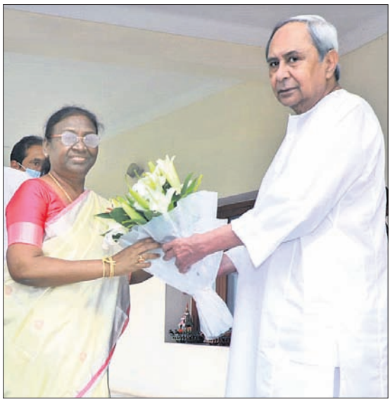
ନବୀନ ନିବାସରେ ରାଷ୍ଟ୍ରପତି ପ୍ରାର୍ଥୀ ଦ୍ରୌପଦୀ ମୁର୍ତ୍ତିଙ୍କୁ ପୁଷ୍ୟମନ୍ତ୍ରୀ ନବୀନ ପଟ୍ଟନାୟକ ସାଙ୍ଗେ କରୁଛନ୍ତି।

ଏନ୍ତୁସିଆ ରାଷ୍ଟ୍ରପତି ପ୍ରାର୍ଥୀ ଦ୍ରୌପଦୀ ମୁର୍ତ୍ତି ଶୁକ୍ରବାର ନିଜ ସପକ୍ଷରେ ଭୋଗ ନାରିବା ପାଇଁ ବନିକିଆ ଓଡ଼ିଶା ଗସ୍ତରେ ଆସିଛନ୍ତି। ସେ ପୁଷ୍ୟମନ୍ତ୍ରୀ ନବୀନ ପଟ୍ଟନାୟକଙ୍କ ସମେତ ରାଜ୍ୟର ଏମ୍ପି ଓ ବିଧାୟକମାନଙ୍କୁ ଭେଟି ଆଲୋଚନା କରିଛନ୍ତି। ବିଧାନସଭା ସମ୍ମିଳନୀ କକ୍ଷରେ ବିଜେଡି ବିଧାୟକ ଓ ଏମ୍ପିଙ୍କ ସହ ଆଲୋଚନା କଲାବେଳେ ସେ ଭାବବିହୀନ ହୋଇପଡ଼ିଥିଲେ। ପୁଷ୍ୟମନ୍ତ୍ରୀ ନବୀନ ପଟ୍ଟନାୟକଙ୍କୁ ଭାଇ ଏହାକୁ ଚୋପୁଷା-୪