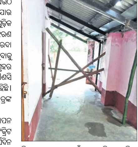
ବିଦ୍ୟାଳୟ କାନ୍ଥରେ ବାଉଁଶ ତେରା ଦିଆଯାଇଛି।

ପାଇଁ ବାଉଁଶ ଖୁଣ୍ଟ ସଂଯୋଗ ଦିଆଯାଇଛି। ବିଦ୍ୟାଳୟରେ ପର୍ଯ୍ୟାପ୍ତ କଂକ୍ରିଟ୍ ଛାତ ଘର ନ ଥିବାରୁ ପିଲାମାନେ ବାଉଁଶର ପୁରୁଣା ଭଙ୍ଗା ଆକୃଷ୍ଟ ସ୍ତମ୍ଭ ଘର ବସି ପାଠ ପଢୁଛନ୍ତି। ଏହା ବିପଦପୂର୍ଣ୍ଣ ଭାବେ ଚଳୁଛି ଓ ଛାତ୍ରଛାତ୍ରୀଙ୍କୁ ସୁରକ୍ଷା ଦେବା ପାଇଁ ପିଲାଙ୍କୁ ପୁରୁଣା ପୃଷ୍ଠରେ ଚଳୁଥିବା ବିଦ୍ୟାଳୟ ପରିଚାଳନା କମିଟି ପକ୍ଷରୁ ଉଚ୍ଚ ମାଗଣା ପାର୍ଶୁ ଦେଇ ଛାତ୍ରଛାତ୍ରୀଙ୍କୁ ଯାତାଯାତକୁ ବାରଣ କରାଯାଇଛି। ଏଥିସହ ଉଚ୍ଚ ମାଗଣାରେ ବାଉଁଶ ବାନ୍ଧି ବନ୍ଦ କରିଦିଆଯାଇଛି। ଉଚ୍ଚ ଭଗ୍ନ କାନ୍ଥ ଉପରେ ଥିବା ଆକୃଷ୍ଟ ସ୍ତମ୍ଭ ଧରି ରଖିବା