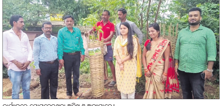
କାର୍ଯ୍ୟକ୍ରମରେ ଯୋଗଦେଇଥିବା ଅତିଥି ଓ ଅନ୍ୟମାନେ ।