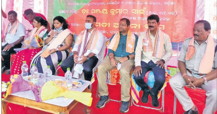
ବନ ମହୋତ୍ସବ କାର୍ଯ୍ୟକ୍ରମରେ ଯୋଗ ଦେଇଥିବା ଅତିଥି।