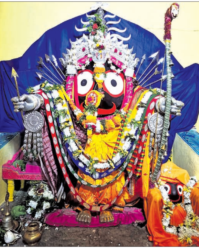
ସନ୍ଧ୍ୟା ଦର୍ଶନରେ ଶ୍ରୀଜୀଉମାନଙ୍କ ଶ୍ରୀରାମ ଅବତାର।

ପରିସରରେ ଚାରାଗୋପଣର ଆୟୋଜନ କରିଥିଲେ। ସେହିପରି ବିଦ୍ୟାଳୟର ଛାତ୍ରଛାତ୍ରୀଙ୍କୁ ବିଭିନ୍ନ ଉପାୟରେ ଏମ୍‌କେସିଡିରେ ବିଭିନ୍ନ ପାଠ୍ୟ ସମ୍ପର୍କ ପ୍ରଶ୍ନ ପଚାରିବା ସହ ସେମାନଙ୍କ ମଧ୍ୟାହ୍ନ ଭୋଜନ, ବିଦ୍ୟାଳୟରେ କିଭଳି ଶିକ୍ଷାଦାନ ଚାଲିଛି ସେ ନେଇ ପିଲାଙ୍କଠାରୁ ପଚାରି ବୁଝିଥିଲେ। ସେହିପରି ବିଦ୍ୟାଳୟ କମିଟି ପକ୍ଷରୁ ତହସିଲଦାର ପ୍ରଧାନ ଶିକ୍ଷକଙ୍କୁ ପ୍ରଦାନ କରିଛନ୍ତି। ପ୍ରକାଶ ଯେ, ଉଚ୍ଚ ବିଦ୍ୟାଳୟ ସମେତ ବ୍ଲକର ଏକାଧିକ ବିଦ୍ୟାଳୟକୁ ରୂପାନ୍ତରଣ କରି ସ୍ମାର୍ଟସ୍କୁଲ କରାଯିବା ପାଇଁ ପ୍ରସ୍ତାବ ରହିଛି, ହେଲେ ଏଯାବତ୍ ତାହା ଅନୁମୋଦନ ହୋଇ ନ ଥିବା ବାରିଙ୍ଗବାଡ଼ି ବିଦେଶୀ ନାୟକ ସମସ୍ତ ପ୍ରଶ୍ନାବଳୀକୁ ନିର୍ବାହୀ ସମ୍ପ୍ରଦାୟ ଶିଶୁର ପାତ୍ର କହିଛନ୍ତି।