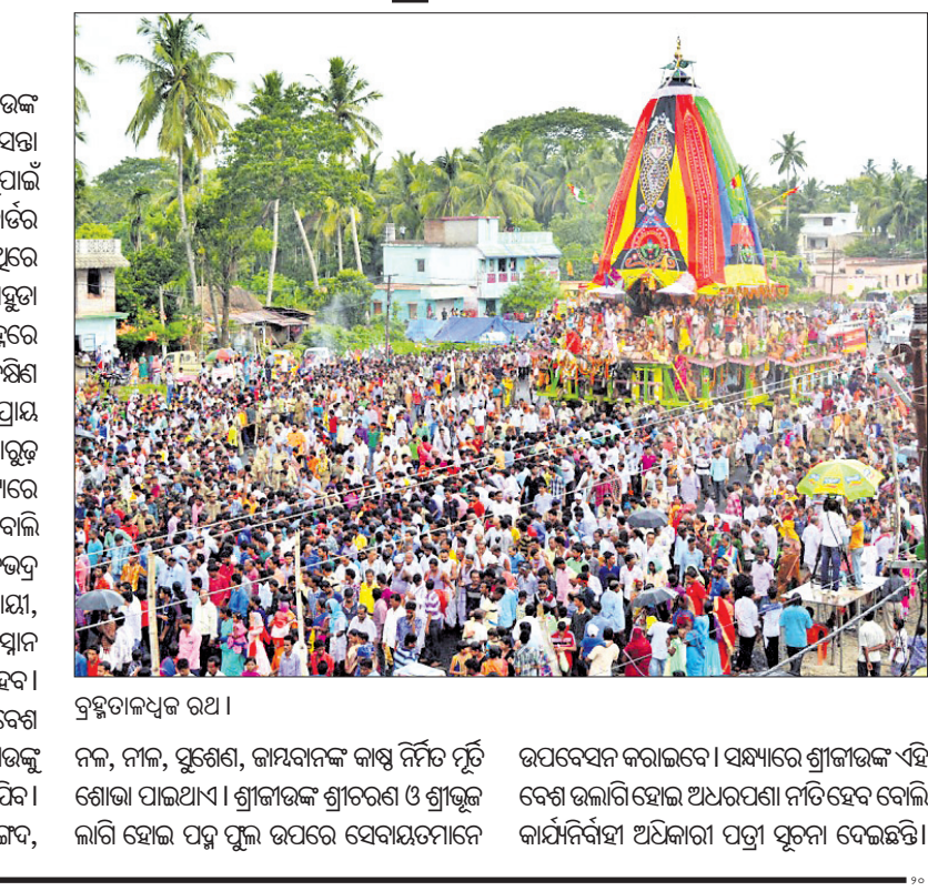
ବ୍ରହ୍ମତାଳଧ୍ୱଜ ରଥ ।