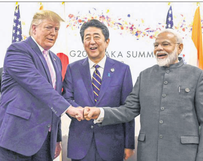
୨୦୧୯ ଜୁନ ୨୮ରେ ନୂଆଦିଲ୍ଲୀରେ ପ୍ରଧାନମନ୍ତ୍ରୀ ମୋଦିଙ୍କ ସହ ତତ୍କାଳୀନ ଜାପାନ ପ୍ରତିପକ୍ଷ ଶିଞ୍ଜୋ ଆବେ ଏବଂ ଆମେରିକା ରାଷ୍ଟ୍ରପତି ଡୋନାଲ୍ଡ ଟ୍ରମ୍ପ।