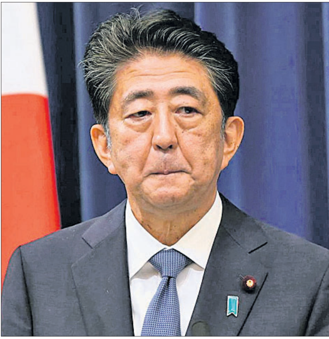
ଜାପାନର ପୂର୍ବତନ ପ୍ରଧାନମନ୍ତ୍ରୀ ଶିଞ୍ଜୋ ଆବେ।