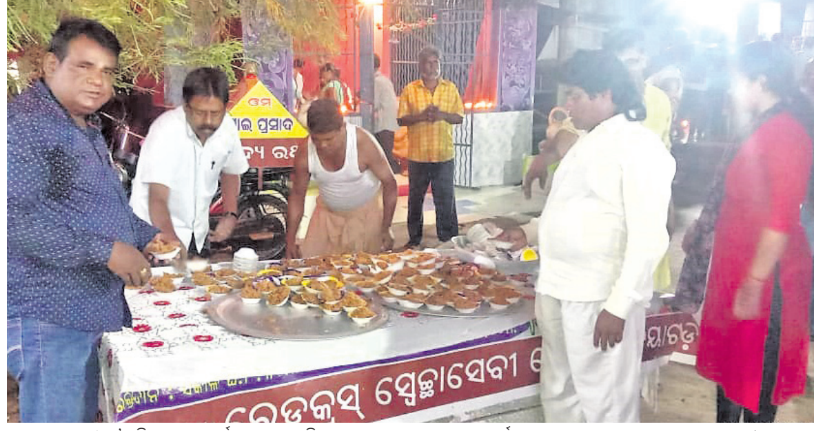
ନୟାଗଡ଼ ମାଉସୀ ମା' ମନ୍ଦିରରେ ୫୦ ବର୍ଷ ହେଲା ବନ୍ଦ ରହିଥିବା ଅନଭୋଗ କାଗାରେ ସନ୍ଧ୍ୟା ଦର୍ଶନ ଅବସରରେ ଆରମ୍ଭ ହୋଇଥିବା ଚରୁ ଭୋଗ।