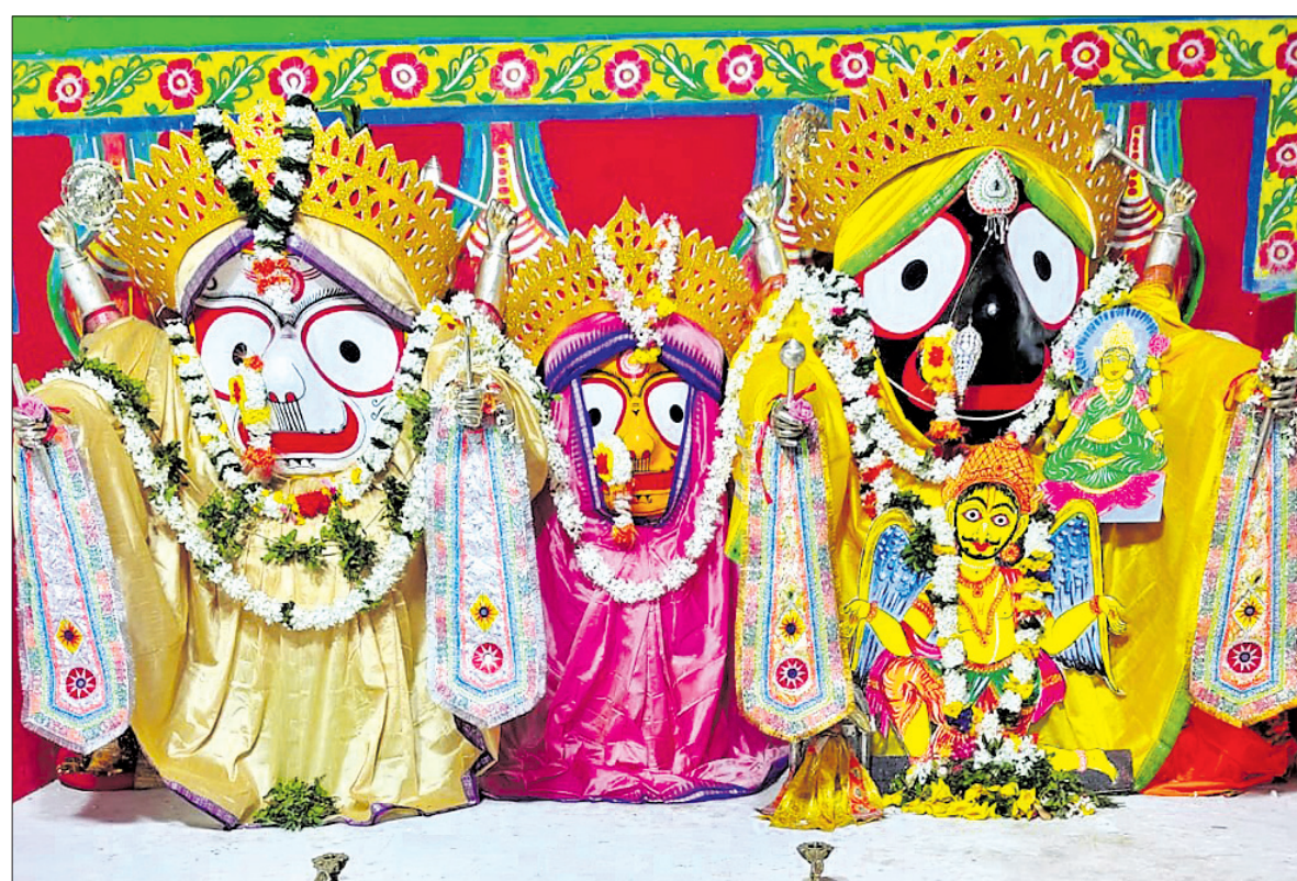
ନୟାଗଡ଼ ମାଉସୀ ମା' ମନ୍ଦିରରେ ସନ୍ଧ୍ୟା ଦର୍ଶନ ଅବସରରେ ଶ୍ରୀଜୀଉମାନଙ୍କ ଗଭୁଡ଼ ଗୋବିନ୍ଦ ବେଶ।

ସଡ଼କ ଯୋଜନାରେ ଅନ୍ତର୍ଭୁକ୍ତ କରି ରାସ୍ତା ସମ୍ପ୍ରସାରଣ କରାଯିବ ଜରୁରୀ। ଏବେ ଗ୍ରାମକୁ ଆନ୍ତୁଲାନୁ ପହଞ୍ଚିପାରୁ ନ ଥିବାରୁ ଗର୍ଭବତୀ ଏବଂ ରୋଗୀଙ୍କୁ ଚିକିତ୍ସା ପାଇଁ ଖଟିଆ ଭରସା ହେଉଥିବା ଗ୍ରାମବାସୀ କହିଛନ୍ତି। ସେହିପରି ବିଦ୍ୟାଳୟ ବନ୍ଦ ରହୁଥିବାରୁ ପାଠ ନ ପଢ଼ି ଛାତ୍ରାଛାତ୍ରୀ ଘରେ ରହୁଛନ୍ତି। ଏହି ସବୁର ସମସ୍ୟା ଶୀଘ୍ର ସମାଧାନ କରିବାକୁ ଗ୍ରାମବାସୀ ନିବେଦନ କରିଛନ୍ତି।