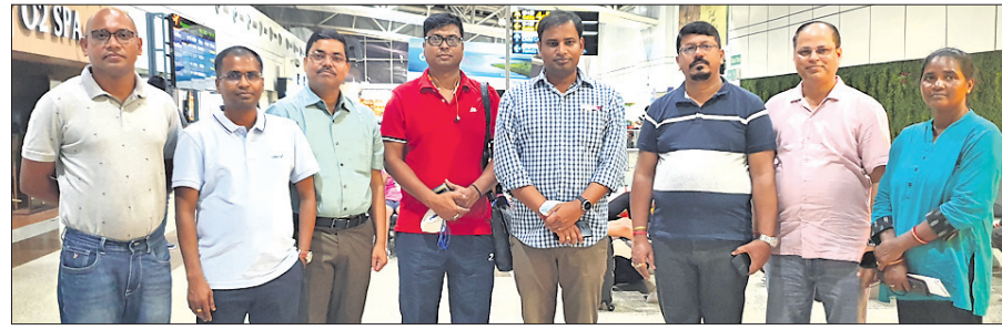
କ୍ରୀଡ଼ାମନ୍ତ୍ରୀ ତୁଷାରକାନ୍ତି ବେହେରାଙ୍କ ନେତୃତ୍ୱରେ ମୁରୋପ ଗସ୍ତରେ ଯାଇଥିବା ପ୍ରତିନିଧି ମଣ୍ଡଳୀ ।

ଭୁବନେଶ୍ୱର, ୮୭ (କ୍ରୀଡ଼ା ପ୍ରତିନିଧି): ୨୦୨୩ ପୁରୁଷ ହକି ବିଶ୍ୱକପ ଭୁବନେଶ୍ୱର ଏବଂ ରାଉରକେଲାରେ କାର୍ଯ୍ୟକ୍ରମ ଆରମ୍ଭ କରିଛନ୍ତି । ଆୟୋଜକ ଏମ୍.ଆଇ.ଏ.ଏ.ର ନିମନ୍ତ୍ରଣକ୍ରମେ କ୍ରୀଡ଼ା ଓ ମୁଦ୍ରା ସେବା ବିଭାଗର ୧୧ ଜଣିଆ ପ୍ରତିନିଧିମଣ୍ଡଳୀ କ୍ରୀଡ଼ା ଓ ମୁଦ୍ରା ସେବା ମନ୍ତ୍ରାଳୟ ନେତୃତ୍ୱରେ ଭୁବନେଶ୍ୱର ବିମାନବନ୍ଦରରୁ ନୂଆଦିଲ୍ଲୀ ବାଟଦେଇ ଆମେସନ୍‌ଡାମ ଅଭିଯୁକ୍ତ ଯାତ୍ରା କରିଛନ୍ତି । ସେଠାରେ ୧୦ ଦିନ ରହିବା କାଳରେ ପ୍ରତିନିଧିମଣ୍ଡଳୀ ଭାରତ ସମେତ ବିଭିନ୍ନ ମ୍ୟାଚ ପରିଦର୍ଶନ କରିବା ସହ ମେଗା ଇଭେଣ୍ଟ ଆୟୋଜନ, ଆତିଥ୍ୟ ଶୈଳୀ, ଗଣମାଧ୍ୟମ ଓ ସାମାଜିକ