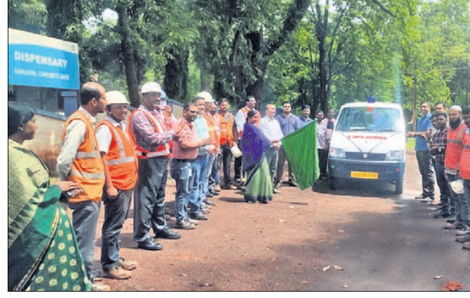
ଆୟୁକ୍ତାୟୁ ସେବାର ଶୁଭାରମ୍ଭ କରାଯାଇଛି। କାଳିଆପାଣି, ୮୭ (ଡି.ଏନ.ଏ.)