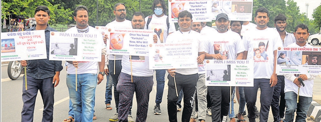
ଏସ୍.ଆଇ.ଏସ୍.ଏସ୍. ପକ୍ଷରୁ ଶୁକ୍ରବାର ଭୁବନେଶ୍ୱର ମାଷ୍ଟରକ୍ୟାଣ୍ଟିନଠାରେ ବାହାରିଥିବା 'ହୋପ୍ ଥାକ୍ ଫର୍ ପୁରୀ' ପଦଯାତ୍ରା।