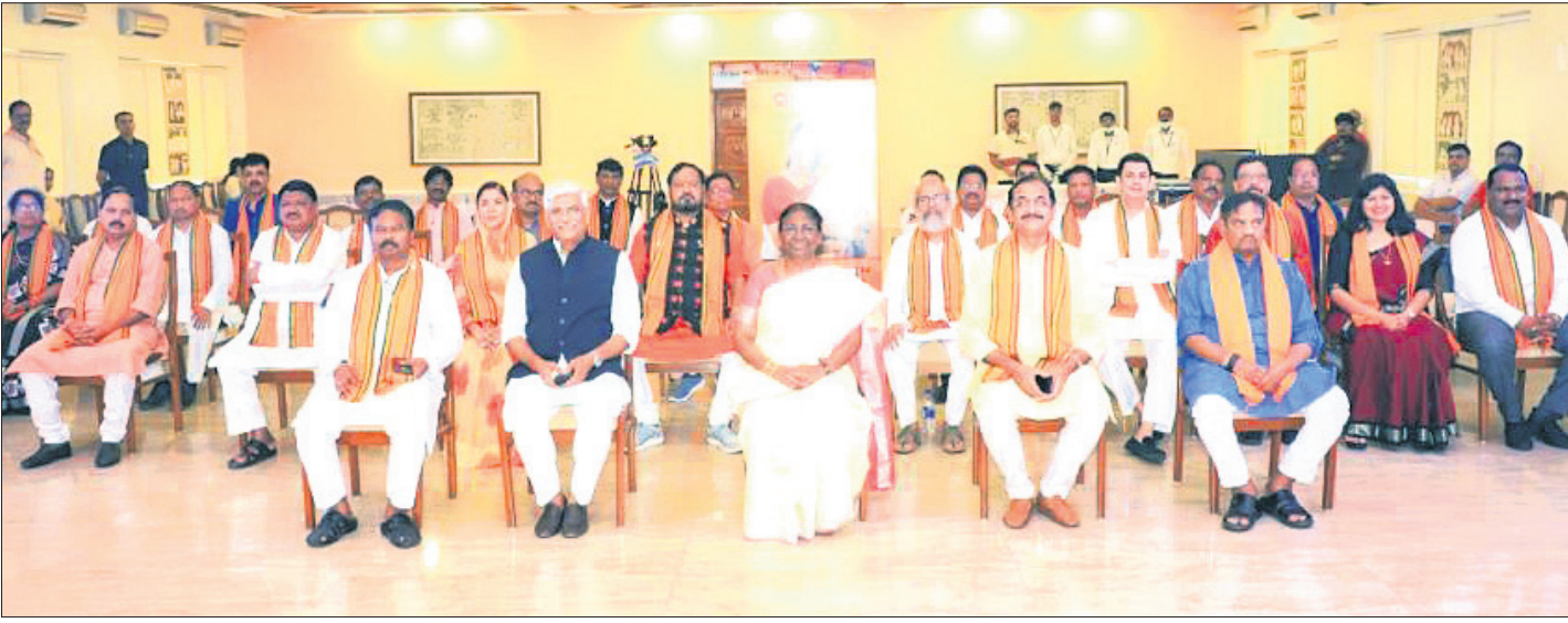
ରାଜ୍ୟ ଅତିଥି ଭବନରେ ଭାଜପା ଏମ୍ପି ଓ ବିଧାୟକଙ୍କ ଗହଣରେ ଡ୍ରୌପଦୀ ମୁର୍ମୁ।