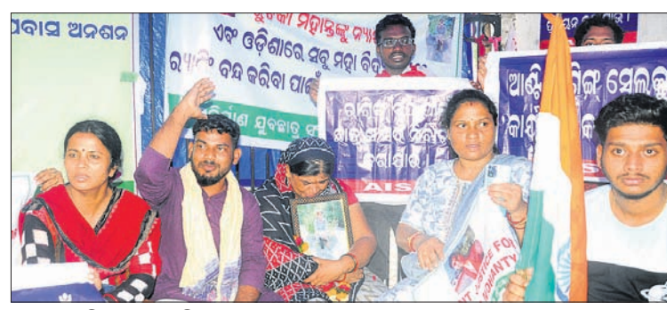
ଧାରଣା ଭାଙ୍ଗି ରଖୁଥିବା ତୁଚ୍ଚିକାଙ୍କ ମା' ଓ ଅନ୍ୟମାନେ।

କିପରି ଏହି ମାମଲାରେ ଆମେ କାହାକୁ ଚିରପ କରୁଛୁ? ତୁଚ୍ଚିକାଙ୍କ ମା'ଙ୍କ ଭାବାବେଗକୁ ପୋଲିସ୍ ଚାହୁଁଛନ୍ତି। ବିଚ୍ଛିନ୍ନ ଦିଗକୁ ନେଇ ତଦନ୍ତ କରାଯାଇଥିବା ପାଲ କହିଛନ୍ତି। ସୁନାଯୋଗ୍ୟ, ଗୁରୁବାର ମଧ୍ୟାହ୍ନ ପ୍ରାୟ ୧୨ଟା ୩୦ରେ ଏନଏସ୍‌ଆଇଏସ୍‌ଏଫ୍ ସଦସ୍ୟମାନେ ତୁଚ୍ଚିକାଙ୍କ ମା'ଙ୍କୁ ଧରି ବିଚ୍ଛିନ୍ନ କଲେଜ ନିକଟରେ ରାସ୍ତାବୋକୋ କରିଥିଲେ।