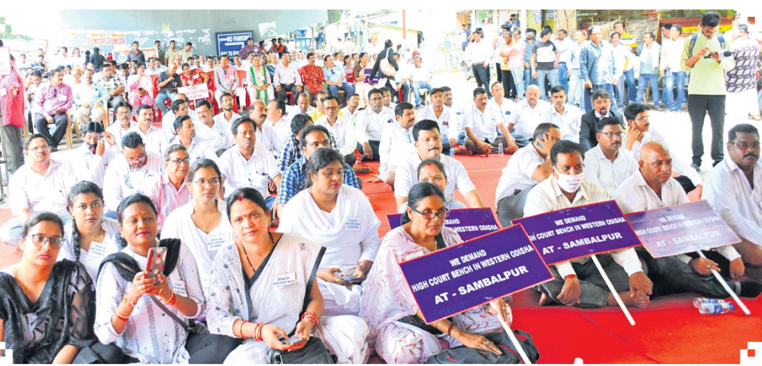
ଚେତାବନୀ ସମାବେଶରେ ସାମିଲ ହୋଇଥିବା କର୍ମକର୍ତ୍ତା ।

ସମ୍ବଲପୁର, ୮୧୭(ବୁଧବେ) ପ୍ରାୟ ୪୫ବର୍ଷ ଧରି ହାଜରକୋର୍ଟ ସ୍ଥାୟୀ ବେଢ଼ା ଦାବି ନେଇ ପଶ୍ଚିମ ଓଡ଼ିଶାବାସୀ ଆନ୍ଦୋଳନ କରିଆସୁଛନ୍ତି । ଟ୍ରେନ୍ ରୋକୋ, ବନ୍ଦ ପାଳନ, କୋର୍ଟ ଅଟକ କରିବା, ଜିଲ୍ଲାପାଳଙ୍କ ଅଫିସ ଆଗରେ ବିକ୍ଷୋଭ କରିବା ଭଳି ଉପାୟ ଆପଣାଯାଇଛି । ହେଲେ କେନ୍ଦ୍ର ଓ ରାଜ୍ୟ ସରକାରଙ୍କ ଏ ଦିଗରେ ଆଗ୍ରହ କରୁ ନାହିଁ । ରାଜ୍ୟ ସରକାର ବଜେଟ, ଜମି, ସ୍ଥାନ ନେଇ କେନ୍ଦ୍ରକୁ ରିପୋର୍ଟ ଦେଇଥିବା ବେଳେ କେନ୍ଦ୍ର ପୁଣି ପୂର୍ଣ୍ଣାଙ୍ଗ ରିପୋର୍ଟ ପାଇଁ ରାଜ୍ୟକୁ ଚିଠି କରୁଛନ୍ତି । ଏଭଳି ଭାବେ ୪ ଦଶନ୍ଧିରୁ ଉର୍ଦ୍ଧ୍ୱ ସମୟ ବିତିଯାଇଛି । ଯଦି ଏଭଳି ଅବହେଳା କରାଯାଏ ତାହେଲେ ରାଜ୍ୟ ବିଭାଜନ ପାଇଁ ଏହା ଏକ କାରଣ ହେବ । ତେଣୁ ସରକାର ବୁଦ୍ଧତର ସ୍ୱାର୍ଥ ଦୃଷ୍ଟିରୁ ଶୀଘ୍ର ପଦକ୍ଷେପ ଗ୍ରହଣ କରିବାକୁ ଶୁକ୍ରବାର ଜିଲ୍ଲାପାଳଙ୍କ ଅଫିସ ସମ୍ମୁଖରେ ଆନ୍ଦୋଳିତ ଚେତାବନୀ ସମାବେଶରେ ମତପ୍ରକାଶ ପାଇଥିଲା । କେନ୍ଦ୍ରୀୟ କ୍ରିୟାକାରୀ କମିଟି ଆହ୍ୱାନକ୍ରମେ