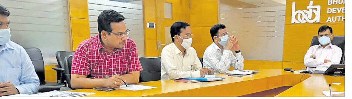
ଜଳବାୟୁ ସମ୍ବନ୍ଧୀୟ ଆଲୋଚନା ଚକ୍ରରେ ବିଏମ୍‌ସି, ବିଏସ୍‌ସିଏଲ୍ ଏବଂ ଜିଆଇଜେଡ୍‌ର ଅଧିକାରୀମାନେ।