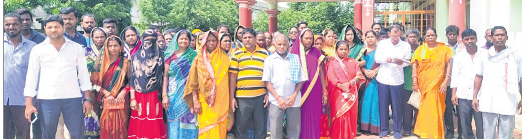
ଭୂମିହୀନଙ୍କୁ ଗ୍ରାମର ଏକାଧିକ ଭୂମିହୀନ ଗ୍ରାମବାସୀ ସ୍ଥାୟୀ ବାସସ୍ଥାନ ଦାବି ନେଇ ଚିଲିକାପାଳଙ୍କୁ ଦାବିପତ୍ର ଦେବାକୁ ଆସିଛନ୍ତି।

ଖୋର୍ଦ୍ଧା ଅଫିସ, ୮୭ : ଭୁବନେଶ୍ୱର ବ୍ଲକ୍ ମେଘାଶାଳ ପଞ୍ଚାୟତର ଭୂମିହୀନଙ୍କୁ ଗ୍ରାମର ଏକାଧିକ ଭୂମିହୀନ ଗ୍ରାମବାସୀ ସ୍ଥାୟୀ ବାସସ୍ଥାନ ଯୋଗାଇଦେବା ଦାବିରେ ଚିଲିକାପାଳଙ୍କୁ ଶୁକ୍ରବାର ଭେଟି ଦାବିପତ୍ର ପ୍ରଦାନ କରିଛନ୍ତି। ଦାବିପତ୍ରରେ ଉଲ୍ଲେଖ ରହିଛି ଯେ, ଏହି ଗ୍ରାମର ଖାତା ନଂ ୨୨୮ ଓ ୨୩୦ ଅନାବାଦୀ ଜମିରେ ଶହେରୁ ଊର୍ଦ୍ଧ୍ୱ ପରିବାର ଦୀର୍ଘବର୍ଷ ଧରି ପରିବାର ସହ ରହି ଆସୁଛନ୍ତି। ରାଜ୍ୟ ସରକାରଙ୍କ ପକ୍ଷରୁ ଆବାସ, ବିଦ୍ୟୁତ, ପାନୀୟଜଳ, ପାଇଖାନା ପ୍ରଭୃତି ଯୋଗାଇ ଦିଆଯାଇଛି। ଏଠାରେ ରହୁଥିବା ଅଧିକାଂଶ ପରିବାର ଖତିଭୂଆ ଓ ଦିନ ମଜୁରିଆ ଶ୍ରେଣୀର। ତେବେ ନିକଟରେ ସ୍ଥାନୀୟ ପ୍ରଶାସନ ପକ୍ଷରୁ ଉପରୋକ୍ତ ପୁରରେ ମାପପତ୍ର ଚାଲିଛି। ସେଠାରେ ରହୁଥିବା ପରିବାରଙ୍କୁ ଉଲ୍ଲେଖ କରାଯିବା ଲାଗି ଜଣାପଡ଼ିବା ପରେ ଅନ୍ଧେବାସୀ ଭୟଭୀତ ହୋଇପଡ଼ିଛନ୍ତି। ଏହି ପରିବାରଙ୍କୁ ସ୍ଥାୟୀ ଜମିପତ୍ର ପ୍ରଦାନ ଲାଗି ଦାବି କରିଛନ୍ତି।