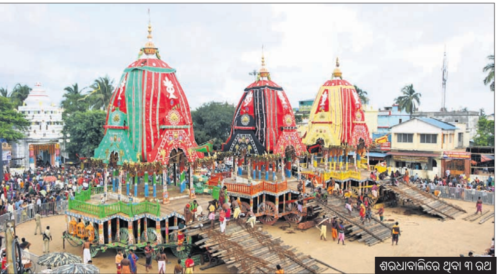
ଶରଧାବାଲିରେ ଥିବା ୩ ରଥ

ମହାପ୍ରଭୁ ରଥକୁ ଓହ୍ଲାଇ ଶ୍ରୀଗୁଣ୍ଡିଚା ମନ୍ଦିରକୁ ପ୍ରବେଶ କରିବା ପରେ ଫିଙ୍ଗୁଆର ସମ୍ପୃକ୍ଷରେ ତିନି ରଥ ଦଣ୍ଡାୟମାନ ହୋଇ ରୁହେ। ଅନେକ ଭକ୍ତ ମହାପ୍ରଭୁଙ୍କୁ ରଥକୁ ଘର୍ଷ କରିବାର ଚାହୁଁ ନେଇ ଶ୍ରୀକ୍ଷେତ୍ର ଆସନ୍ତି। ସେହିଭଳି ମହାପ୍ରଭୁ ରଥରେ ବିରାଜମାନ ନ ଥିବା ବେଳେ ରଥକୁ ଘର୍ଷ ନ କରିବା କଟକଣା ମଧ୍ୟ ନାହିଁ। ମାତ୍ର ପ୍ରଶାସନ ଚଳିତ ବର୍ଷ କାହାରିକୁ ରଥ ଘର୍ଷ କରାଇବାକୁ ଦେଇନାହିଁ। ଭକ୍ତ ଓ ରଥ ମଧ୍ୟରେ ପ୍ରଶାସନ ବାଧକ ସାଜିଛି। ସୂଚନାଯୋଗ୍ୟ, ଚଳିତ ରଥଯାତ୍ରା ପରିଚାଳନା କମିଟିରେ ଏହି ପ୍ରସଙ୍ଗରେ ଆଲୋଚନା ହୋଇଥିଲା। ମହାପ୍ରଭୁ ରଥାବୃତ୍ତ ହୋଇ ନ ଥିବା ବେଳେ ଭକ୍ତ ରଥକୁ ଛୁଇଁପାରିବେ ବୋଲି ନିଷ୍ପତ୍ତି ନିଆଯାଇଥିଲା। ମାତ୍ର ପ୍ରଶାସନ ଏହି ନିଷ୍ପତ୍ତିକୁ କାର୍ଯ୍ୟକାରୀ କରିନାହିଁ।