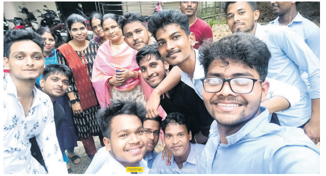
@ ବିଶ୍ୱ ଭୂଷଣ