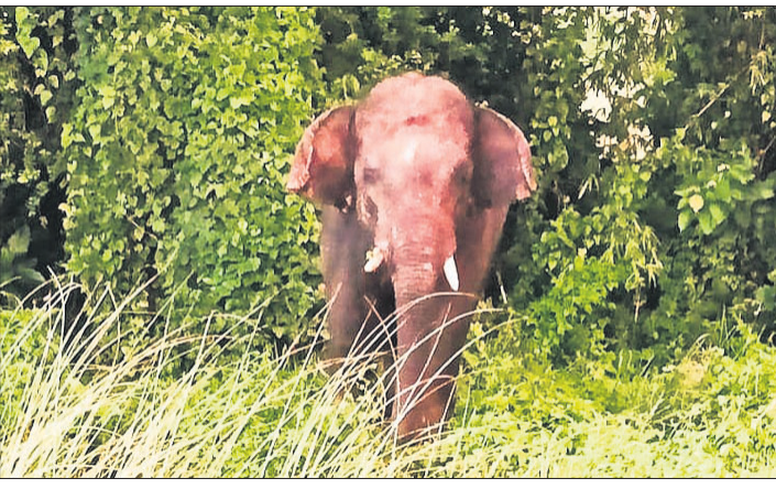
ଭାଙ୍ଗିବା ସହିତ ଚାକୁ ଘରେ ଥିବା ଧାନ ଚାଉଳ ଓ ପିପିରିଆ ଖାଇ ନଷ୍ଟ କରିଥିଲା। ପ୍ରାଣ ବିକଳରେ କରିବା ବିଷୁ ଅନ୍ୟ ଘରେ ଆଶ୍ରୟ ନେଇଥିବା ବେଳେ ହାତୀ ଭୋଗ ସାମଗ୍ରୀରେ ଚାକୁ ଟେକିନେଇ ନଷ୍ଟ କରିଥିଲା।

ମଦିନ ଧରି ଏକ ଗୋଠାଖଣ୍ଡିଆ ହାତୀ ରାଇବନିଆର ବିଭିନ୍ନ ସ୍ଥାନରେ ବ୍ୟାପକ କ୍ଷତି ଘଟାଇ ଚାଲିଥିବା ବେଳେ ଶନିବାର ଅପରାହ୍ନରେ ସୁବର୍ଣ୍ଣରେଖା ନଦୀ ପାରି ହୋଇ ଜଳେଶ୍ଵର ସହର ଅଭିଯୁକ୍ତେ ଚାଲିଛି। ବନ କର୍ମଚାରୀମାନେ ହାତୀକୁ ଘରଭାଙ୍ଗିବା ଲାଗି ଉଦ୍ୟମ କରି ରହିଛନ୍ତି। ଜଳେଶ୍ଵର ସହରରେ ହାତୀ ପଶିଲେ ବ୍ୟାପକ କ୍ଷତି ଘଟାଇବା ଆଶଙ୍କାରେ ବନବିଭାଗ ପକ୍ଷରୁ ପୋଲିସ୍ ସହାୟତା ଲୋଡ଼ାଯାଇଛି। ଗୁରୁବାର ବିକଳ ରାତିରେ ଏକ ଗୋଠାଖଣ୍ଡିଆ ହାତୀ ବରତିହାସିତ ଜଙ୍ଗଲରେ ପହଞ୍ଚିଥିଲା। ଲୁହାପତା ଜଙ୍ଗଲରେ ଗତ ଶୁକ୍ରବାର ହାତୀକୁ ଦେଖିବାକୁ ମିଳିଥିଲା। ନାରାୟଣପୁର ଗାଁର ଜଣେ ବ୍ୟକ୍ତିର ଘର ପ୍ରାୟ ୨୫ ଫୁଟ ଧରି ଧାଳି ଘର ଥିବା ଧାନ ଚାଉଳ ଓ ପିପିରିଆ ଖାଇ ନଷ୍ଟ କରିଥିଲା। ପ୍ରାଣ ବିକଳରେ କରିବା ବିଷୁ ଅନ୍ୟ ଘରେ ଆଶ୍ରୟ ନେଇଥିବା ବେଳେ ହାତୀ ଭୋଗ ସାମଗ୍ରୀରେ ଚାକୁ ଟେକିନେଇ ନଷ୍ଟ କରିଥିଲା।