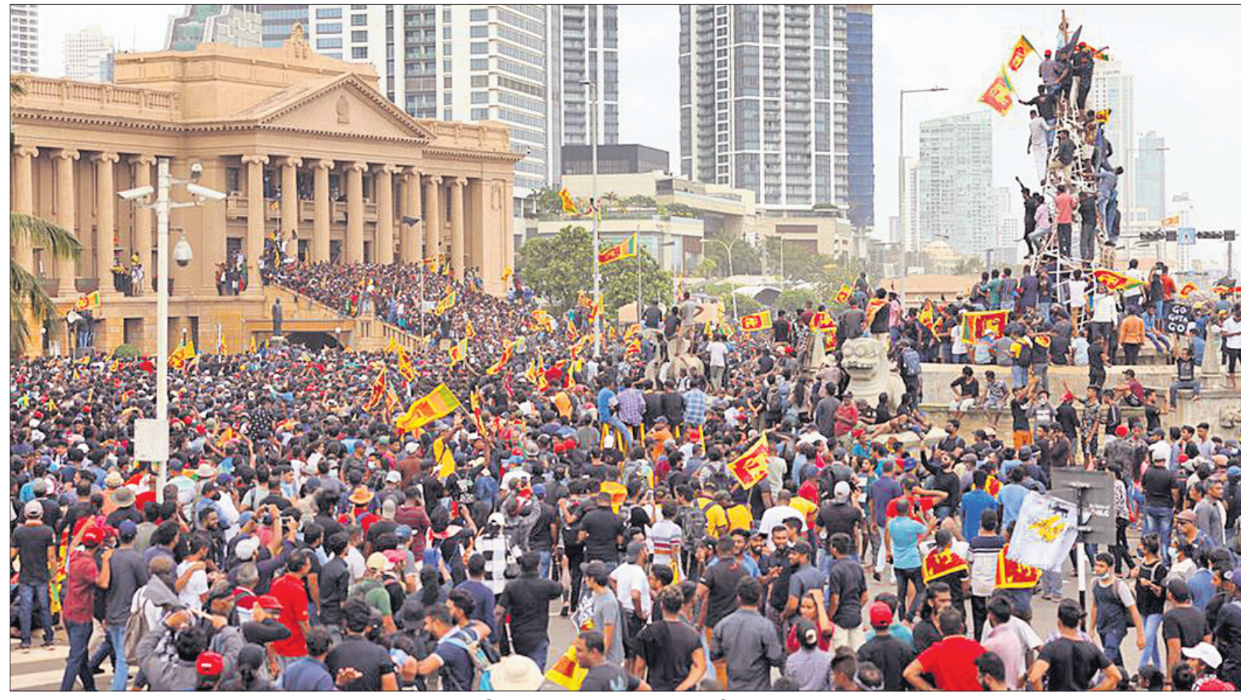
ବିକ୍ଷୋଭକାରୀଙ୍କ ଦଖଲରେ ଶ୍ରୀଲଙ୍କା ରାଷ୍ଟ୍ରପତି ଭବନ।

■ ବିକ୍ଷୋଭକାରୀଙ୍କ ଦଖଲରେ ରାଷ୍ଟ୍ରପତି ଭବନ ■ ଦେଶ ଛାଡ଼ି ପଳାଇଲେ ଗୋଟାବାୟା ରାଜପାଣ୍ଡେ ■ ଇସ୍ତଫା ଦେଲେ ପ୍ରଧାନମନ୍ତ୍ରୀ ରାନିଲ ପ୍ରେମଦାସ