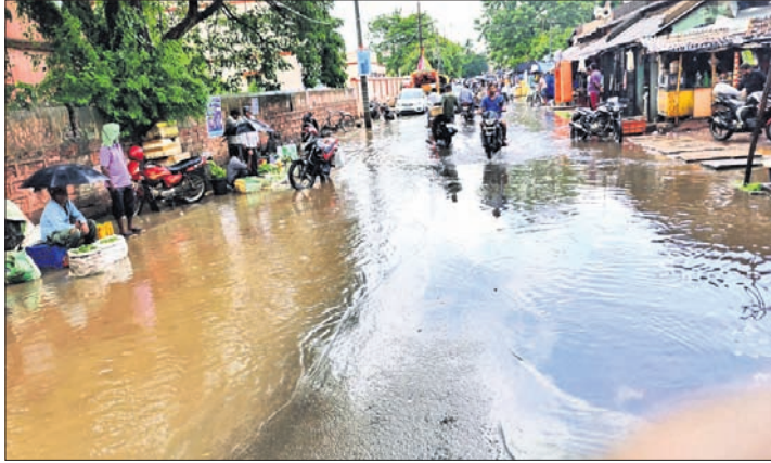
ବ୍ୟାସନର ମ୍ୟୁନିସିପାଲିଟି ତାକବଜଳା ଛକକୁ ଗଣେଶବଜାର ମେନ୍ଦୋଇଁ କଳମଗ୍ନ।