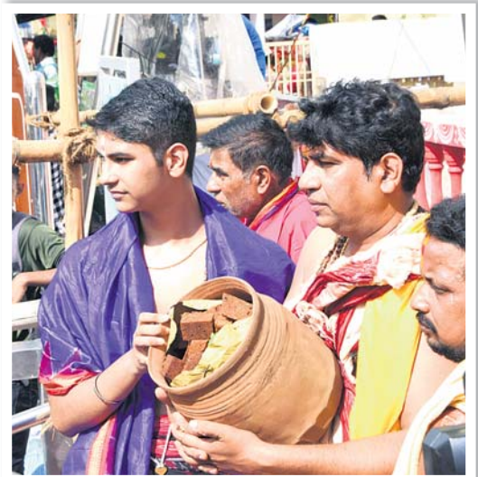
ମହାପ୍ରଭୁଙ୍କ ଉଦ୍ଦେଶ୍ୟରେ ପ୍ରସ୍ତୁତ ଯୋଡ଼ିପିଠା ।