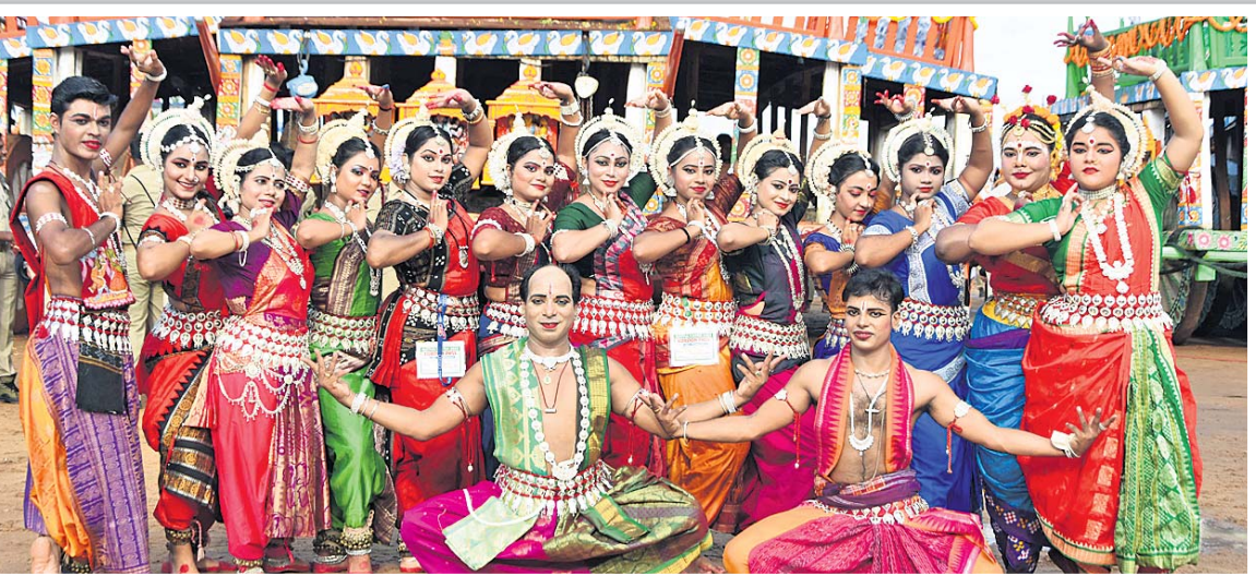
ରଥ ନିକଟରେ ଓଡ଼ିଶୀ ନୃତ୍ୟଶିଳ୍ପୀ ।