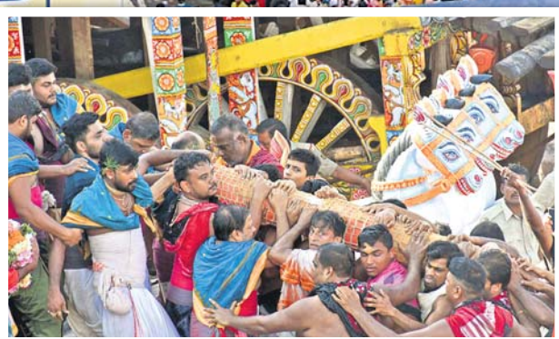
ଶ୍ରୀମୁଦର୍ଶନକୁ ପହଞ୍ଚି ବିଜେ କରାଯାଉଛି ।