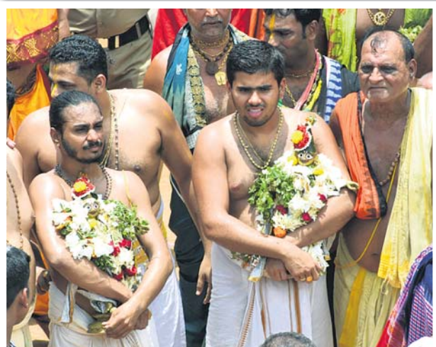
ଶ୍ରୀମଦନମୋହନ, ଶ୍ରୀରାମ, ବଳରାମଙ୍କୁ ରଥକୁ ନିଆଯାଉଛି ।