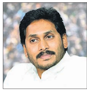
ଓଲ. ଏସ୍. ଜଗନ ମୋହନ ରେଡ୍ଡୀ

ଅନରାଜ୍ୟ, ୯୨ ଖବରରେ ପକାଇଛି। ବର୍ତ୍ତମାନ ଏସବୁ ବନ୍ଦ କର। ଏବେ ଆଉ ଆଗକୁ ଯାଅ ନାହିଁ, ବୋଲି ରାହୁଲ କେନ୍ଦ୍ର ସରକାରଙ୍କ ଉଦ୍ଦେଶ୍ୟରେ କହିଛନ୍ତି। ତୁଳନାତ୍ମକ ଭାବେ ୨୦୧୪ ପୂର୍ବରୁ ରାହୁଲ ବିଦୁଳ ପାଇଁ ପ୍ରଧାନମନ୍ତ୍ରୀ ନରେନ୍ଦ୍ର ମୋଦିଙ୍କୁ ଚାର୍ଜେଟ କରିଥିଲେ। ସର୍ବମୁଖ୍ୟ ଶିବିରରେ ୪ ବର୍ଷ ପୂର୍ବରୁ ହେବା ଅବସରରେ ମଧ୍ୟ ରାହୁଲ ସରକାରଙ୍କୁ ଚାର୍ଜେଟ କରିଥିଲେ। ଶିବିରରେ ରାହୁଲ ଏହାକୁ ଗବର ଦିଏ ବୋଲି କହିଥିଲେ। ଏହାପୂର୍ବରୁ ଲୋକ ୬ ରେ ରାହୁଲ ଚଳାଉଛନ୍ତି କିନ୍ତୁ ପୂର୍ବରୁ ହେବା ଏକ ଚୁକ୍ତି ନୁହେଁ।