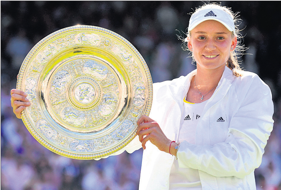
ଫ୍ରେମ୍‌ଲଡନ ଗ୍ରାଣ୍ଡସ୍ଲାମ ମହିଳା ସିଙ୍ଗଲ୍ସ ଟ୍ରଫି ସହ ଏଲିନା ରିବାଜିନା।

ଫ୍ରେମ୍‌ଲଡନ, ୯୬ କାକାଖଣ୍ଡାନର ପ୍ରଥମ ଖେଳାଳି ଭାବେ ଏଲିନା ରିବାଜିନା ଏକ ଗ୍ରାଣ୍ଡସ୍ଲାମ ଗାଳଚଳ ହାସଲ କରିବାର ଚୈତ୍ର ଅର୍ଦ୍ଧଶତକ ଶନିବାର ଫ୍ରେମ୍‌ଲଡନ ଓପନ ଚେନିସ ମହିଳା ସିଙ୍ଗଲ୍ସ ଫାଇନାଲରେ ସେ ଲୁକ୍‌ସା ପ୍ରୋବାବର୍ଡନ ସହ ଟୁଟାୟ ସିଡ୍ ସୁନିସିଆର ଓପ୍ ଲାବେରଙ୍କୁ ହରାଇ ଦେଇଛନ୍ତି। ୨୩ ବର୍ଷୀୟା ରିବାଜିନା ୨୦୧୧ ପରଠାରୁ ସର୍ବନିମ୍ନ ଖେଳାଳି ହିସାବରେ ଫ୍ରେମ୍‌ଲଡନ ସିଙ୍ଗଲ୍ସ ଗାଳଚଳ ହାସଲ କରିଛନ୍ତି। ମ୍ୟାଚ୍‌ରେ ତାଙ୍କ ଆରମ୍ଭ ଉତ୍ସାହଜନକ ନ ଥିଲା। ପ୍ରଥମ ସେଟ୍‌ରେ ହାରିଯିବା ପରେ ସେ ତାଙ୍କ ପ୍ରଦର୍ଶନରେ ଉନ୍ନତି ଆଣି ଲାବେରଙ୍କ ଉପରେ ଚାପ ଦୃଷ୍ଟି କରିଥିଲେ। ଫଳରେ ସୁନିସିଆ ଖେଳାଳି ବାରମ୍ବାର ଫୁଟି କରି ବିସିଥିଲେ। ରିବାଜିନାଙ୍କ କନ୍ସିସ୍ତାନ ହେଉଛି ରୁଷିଆରେ, କିନ୍ତୁ ସେ ୨୦୧୮ରୁ କାକାଖଣ୍ଡାନରୁ ପ୍ରତିନିଧିତ୍ୱ କରିଆସୁଛନ୍ତି। ସ୍ଟୁକନ୍ ଉପରେ ଆକ୍ରମଣ ଯୋଗୁ ତଳିତବର୍ଷ ଅଲ୍ ଇଲ୍‌ଲୁଙ୍କ କ୍ଲବ୍‌ରେ ଉଭୟ ରୁଷିଆ ଓ ବେଲାରୁଷିଆନ ଖେଳାଳିଙ୍କୁ ଏକତ୍ର ହେବାକୁ ବଞ୍ଚିତ କରାଯାଇଥିବା ବେଳେ ସେ ଏହି ସଫଳତା ହାସଲ କରିଛନ୍ତି। ଏଠାରେ ୧୭ତମ