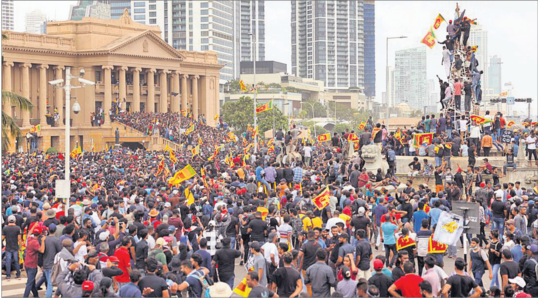
ବିକ୍ଷୋଭକାରୀଙ୍କ ଦଖଲରେ ଶ୍ରୀଲଙ୍କା ରାଷ୍ଟ୍ରପତି ଭବନ ।

ବିକ୍ଷୋଭକାରୀଙ୍କ ଦଖଲରେ ରାଷ୍ଟ୍ରପତି ଭବନ ଦେଶ ଛାଡ଼ି ପଳାଇଲେ ଗୋଟାବାୟା ରାଜପାକ୍ଷେ ଇସ୍ତଫା ଦେଲେ ପ୍ରଧାନମନ୍ତ୍ରୀ ରାନିଲ ପ୍ରେମଦାସ