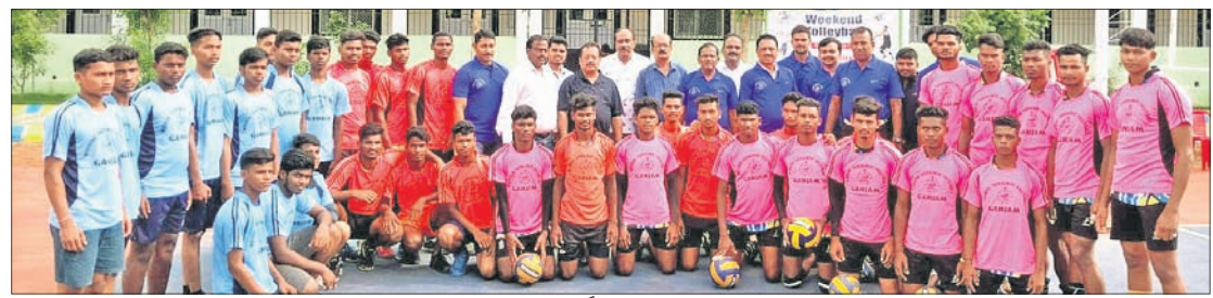
ସପ୍ତାହାନ୍ତ ଭଲିବଲ ଉଦ୍‌ଘାଟନା କାର୍ଯ୍ୟକ୍ରମରେ ଅତିଥିଙ୍କୁ ଗହଣରେ ଖେଳାଳି।