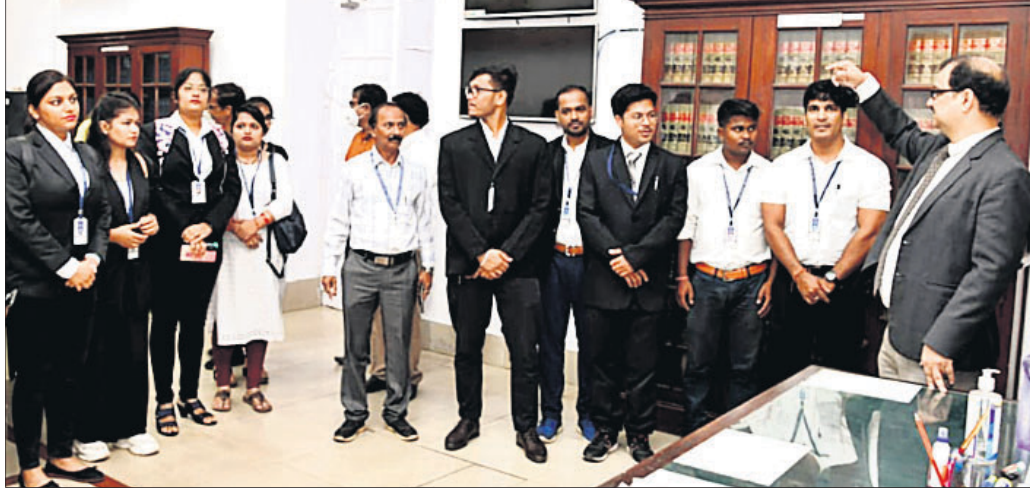
ହାଇକୋର୍ଟ ପରିଦର୍ଶନରେ ଆସିଥିବା ଡେକାନାଲ ଆଇନ ମହାବିଦ୍ୟାଳୟର ଛାତ୍ରୀଛାତ୍ର ଓ ଅଧ୍ୟାପକ

ପ୍ରବଚନ ପରିବେଷଣ କରାଯାଇଥିଲା। ଶ୍ରୀ ଶନିବାର କାଳିଆ ଆଞ୍ଚଳିକ ବାହୁଡ଼ା ଉକ୍ତିମୟ ହୋଇଉଠିଥିଲା। ଠାକୁର ଓ ଭକ୍ତ ଏକାକାର ହୋଇଯାଇଥିଲେ। ଘଣ୍ଟ, କରତାଳି, ମୁଦଙ୍ଗ ଆଦି ବାଦ୍ୟର ଠାକେଟାକେ ଭକ୍ତମାନେ ପାଦକୁ ପାଦ ମିଳାଇ ରଥ ଚାଣିବାର ସୁଯୋଗ ପାଇଥିଲେ। କହିବାକୁ ଗଲେ ନାନା ଉତ୍ସାହ ଓ ଭାବମୟ ପରିବେଶ ମଧ୍ୟରେ ବାହୁଡ଼ା ଯାତ୍ରା ଶେଷ ହୋଇଛି। ଲକ୍ଷ୍ମୀ, ଶ୍ରୀବାଣୀକ୍ଷେତ୍ର, ଆର୍ତ୍ତସିଦ୍ଧ, ବାଣୀବିହାର, ଭିଷ୍ମସ୍ୱୟଂ ନଗର ଆଦି ବିଭିନ୍ନ ସ୍ଥାନରେ ହଜାର ହଜାର ଭକ୍ତଙ୍କ ସମାଗମ ହୋଇଥିଲା। ରବିବାର ରଥ ଉପରେ ମହାପ୍ରଭୁଙ୍କ ସୁନାବେଶ ଦେଖିବେ ଭକ୍ତ। କିମ୍ବ ଶ୍ରୀବାଣୀକ୍ଷେତ୍ରରେ ମହାପ୍ରଭୁଙ୍କ ବାହୁଡ଼ାଯାତ୍ରା ଆଡ଼ମ୍ବରପୁର୍ଣ୍ଣ ଭାବେ ଶେଷ ହୋଇଛି। ପୂର୍ବାହ୍ନରେ ମଙ୍ଗଳ ଆରତି, ମଙ୍ଗଳମ, ଚତୁର୍ପାଲି, ରୋଷ ହୋମ, ଅବକାଶ, ସୂର୍ଯ୍ୟପୂଜା, ରଥପୂଜା ଓ ପହଣ୍ଡି ଶ୍ରୀ ଜଗନ୍ନାଥ ମନ୍ଦିରରେ ଅରବିନ୍ଦ ପ୍ରେସ ହୋଇଥିଲା। ମାର୍ଚ୍ଚେଟ ପର୍ଯ୍ୟନ୍ତ ରଥଚଳୁ ଚଣାଯାଇ ପୁଣି ସନ୍ଧ୍ୟା ସୁଦ୍ଧା ମନ୍ଦିର ବେଢ଼ା ନିକଟକୁ ଫେରାଇ ଆଣାଯାଇଥିଲା। ରାତି ପ୍ରାୟ ୧୦ଟାରେ ରୋଶଣି କରାଯାଇ ଚତୁର୍ଦ୍ଧା ମୂର୍ତ୍ତିଙ୍କୁ ରଥରୁ ନିଆଯାଇ ନାଟ ପଣ୍ଡାଠାରେ ଆଦାନ କରାଯାଇଥିଲା। ମହାପ୍ରଭୁ ସେଠାରେ ନାଳାଦ୍ରିବିଜେ ପର୍ଯ୍ୟନ୍ତ ଅବସ୍ଥାନ କରିବେ ବୋଲି ମନ୍ଦିର ପରିଚାଳନା କମିଟି ପକ୍ଷରୁ ସୂଚନା ଦିଆଯାଇଛି।