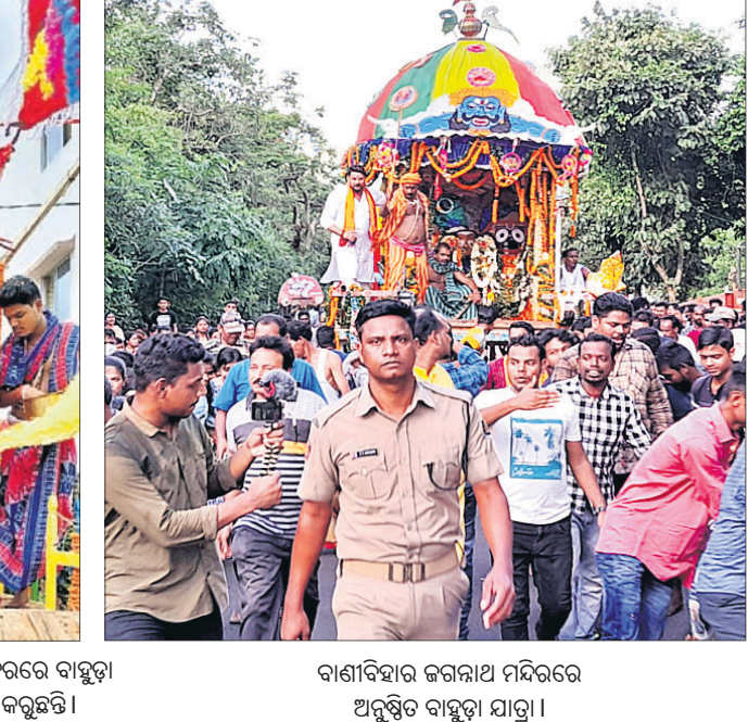
ବାଣୀବିହାର ଜଗନ୍ନାଥ ମନ୍ଦିରରେ ଅନୁଷ୍ଠିତ ବାହୁଡ଼ା ଯାତ୍ରା।