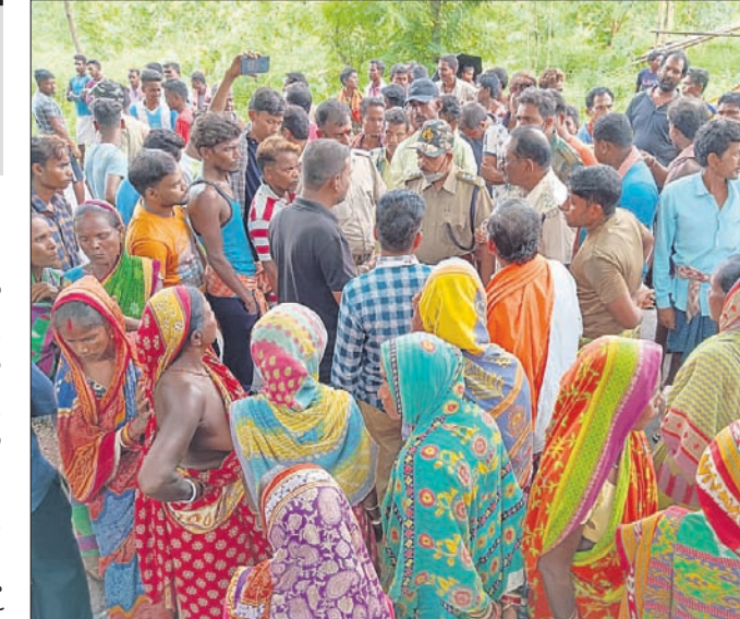
ରେଞ୍ଜରଙ୍କୁ ଲୋକେ ଘେରାଇ କରି ରହିଛନ୍ତି।

ମୟୂରଭଞ୍ଜ ଜିଲ୍ଲା ଉଦ୍ୟାନ ବନାଞ୍ଚଳ ଅଧୀନ ନାବରା ତିରିକିଟି ଜଙ୍ଗଲରୁ ଶୁକ୍ରବାର ରାତିରେ କଟାଯାଇଛି ୬୦ରୁ ଊର୍ଦ୍ଧ୍ୱ ଶାଗୁଆନ ଗଛ।