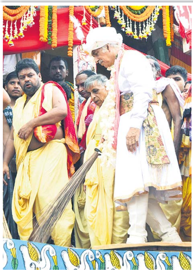
ଗଜପତି ମହାରାଜା ଦିବ୍ୟସିଂହ ଦେବ ନିନ୍ଦିତ୍ୟୋଷ ରଥରେ ଛେରାପହରା କରୁଛନ୍ତି ।