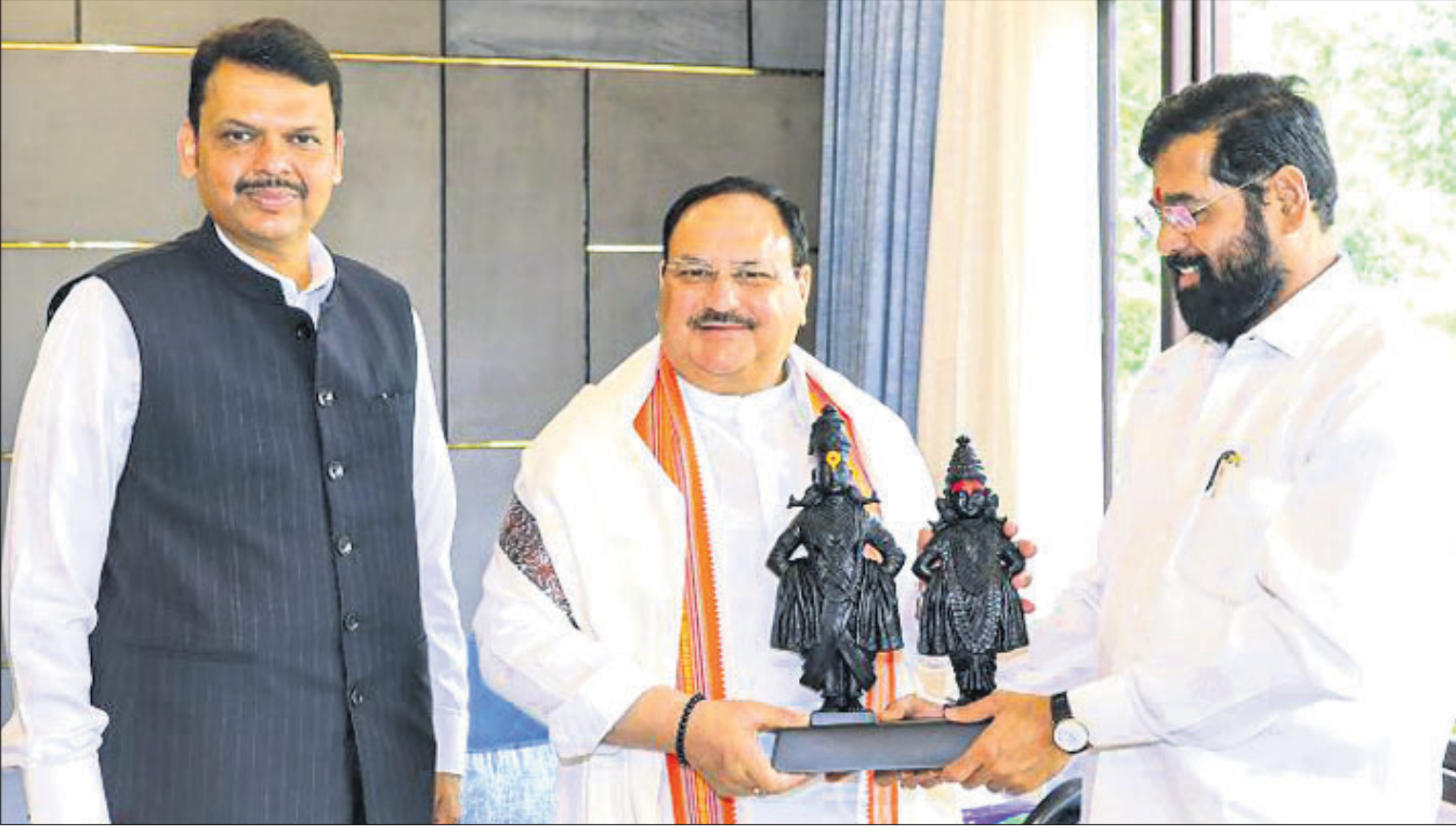
ନୂଆଦିଲ୍ଲୀଠାରେ ଶନିବାର ଭାଜପା ରାଷ୍ଟ୍ରୀୟ ଅଧ୍ୟକ୍ଷ ଜେ.ପି. ନିଖାଙ୍କୁ ଭେଟି ମହାରାଷ୍ଟ୍ର ମୁଖ୍ୟମନ୍ତ୍ରୀ ଏକନାଥ ଶିନ୍ଦେ ମୂର୍ତ୍ତି ଉପହାର ଦେଇଛନ୍ତି। ନିକଟରେ ଅଛନ୍ତି ଉପମୁଖ୍ୟମନ୍ତ୍ରୀ ଦେବେନ୍ଦ୍ର ଫାଡନକିରା।