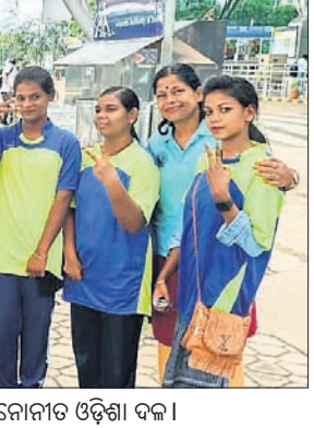
ସ୍ୱତନ୍ତ୍ର ଅଲିମ୍ପିକ୍ ଭାରତ ରୋଲର ସ୍କେଟିଂ ଜାତୀୟ କ୍ୟାମ୍ପ ପାଇଁ ମନୋନୀତ ଓଡ଼ିଶା ଦଳ

ଜାତୀୟ ପ୍ରଶିକ୍ଷଣ ଓ ଅନ୍ତର୍ଜାତୀୟ ପ୍ରତିଯୋଗିତା ନିମନ୍ତେ ଚୟନ କିରିରେ ଭାଗନେବାକୁ ଓଡ଼ିଶାର ୧୧ ଜଣିଆ ଦଳ ଯାତ୍ରା କରିଛି।