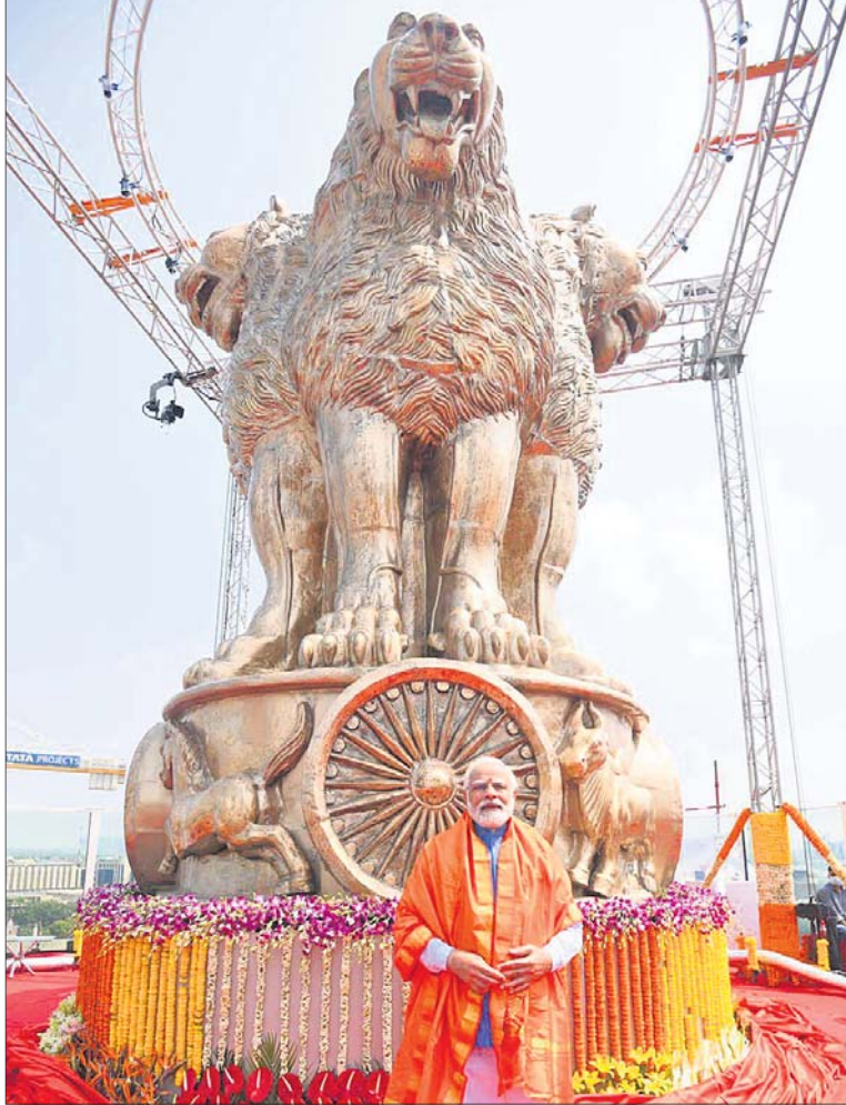
ନୂଆ ପାଲ୍ଲୀମେଣ୍ଟ ଭବନର ଛାତ ଉପରେ ୬.୫ ମିଟର ଉଚ୍ଚତା ବିଶିଷ୍ଟ କାର୍ତ୍ତୀୟ ପ୍ରତୀକର ପ୍ରୋଞ୍ଜ ପ୍ରତିଷ୍ଠା କରାଯାଇଛି।