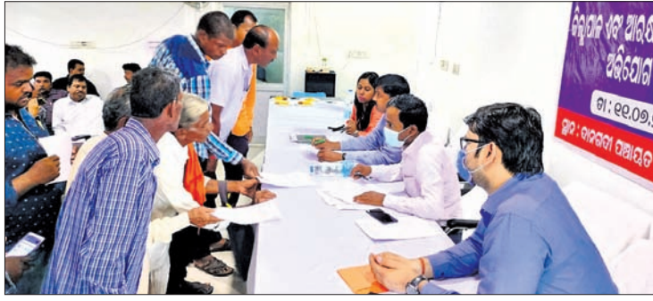
କନଶୁଣାଣି ଶିବିରରେ ପ୍ରଶାସନିକ ଅଧିକାରୀ ଓ ଅଭିଯୋଗକାରୀ।