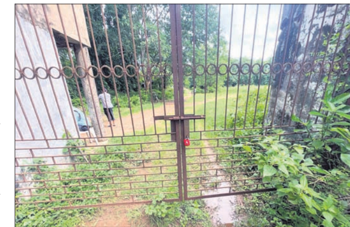
ସୂତାକଳ ମୁଖ୍ୟ ପାଟକରେ ତାଲା ପଡ଼ିଛି।

ଡିଭିଜନ ବ୍ଲକ୍ ନାଉଗାଁଠାରେ ଥିବା ଶାରଳା ସମବାୟ ସୂତାକଳକୁ ଷ୍ଟେଟ ବ୍ୟାଙ୍କ ଅଫ ଇଣ୍ଡିଆ, ମହେଶ୍ୱର ଇଣ୍ଡଷ୍ଟ୍ରିଆଲ ଶାଖା ପକ୍ଷରୁ ସୋମବାର ସିଲ୍ କରାଯାଇଛି। ବ୍ୟାଙ୍କ ପକ୍ଷରୁ ଏହାର ମୁଖ୍ୟ ପାଟକରେ ତାଲା ପକାଇ ଦିଆଯାଇଛି। ବ୍ୟାଙ୍କର ୪ କୋଟି ୬୪ ଲକ୍ଷ ୩୭ ହଜାର ୮୬୫ ଟଙ୍କା ରଖି ଅନାଦାର ଯୋଗୁ ଏହି ସୂତାକଳକୁ କୋରକ ଘୋଷଣା କରାଯାଇଛି। ୨୨ଜୁନରୁ ଭାରତୀୟ ଷ୍ଟେଟ ବ୍ୟାଙ୍କ ପକ୍ଷରୁ ଉକ୍ତ ସୂତାକଳ ଫାଟକରେ ନୋଟିସ ଲଗାଯାଇଥିଲା। ଭାରତୀୟ ଷ୍ଟେଟ ବ୍ୟାଙ୍କ କର୍ତ୍ତୃପକ୍ଷ ପୋଲିସ୍ ସହାୟତାରେ ସୂତାକଳ ପରିସରରେ ପଶି ସୂତାକଳରେ ଥିବା ତିର୍ତ୍ତୋଳ ତହସିଲ ନାଉଗାଁରା ମୌଜାର ଖାତା ନମ୍ବର, ୨୧୪-୮୦୪-୯୦୯, ୯୧୦, ୯୧୧, ୯୧୨, ୯୧୩, ୯୧୪, ୯୧୫, ୯୧୬, ୯୧୭, ୯୧୮, ୯୧୯ ଓ ୯୨୦/୧୫୩୫ ରେ ଥିବା ସମସ୍ତ ଜମି ଓ ଏହା ଉପରେ ଥିବା ସମସ୍ତ କୋଠାବାଡି ଯନ୍ତ୍ରପାତିକୁ ନିଜ କବ୍ଜାକୁ ନେଇଯାଇଛି। ବ୍ୟାଙ୍କ କର୍ତ୍ତୃପକ୍ଷ ଡାକବାଳି ଯନ୍ତ୍ର ମାଧ୍ୟମରେ ଏବିସିୟରେ ସର୍ବସାଧାରଣଙ୍କୁ ଅବଗତ କରିଛନ୍ତି। ସିଲ୍ କରାଯାଇଥିବା ସୂତାକଳ ପରିସରକୁ ସିଲ୍ କରିବା ପାଇଁ ସ୍ୱତନ୍ତ୍ର ସିକ୍ୟୁରିଟି ସଂସ୍ଥାକୁ ନିଯୋଜିତ କରାଯାଇଛି। ଏଥିସହ