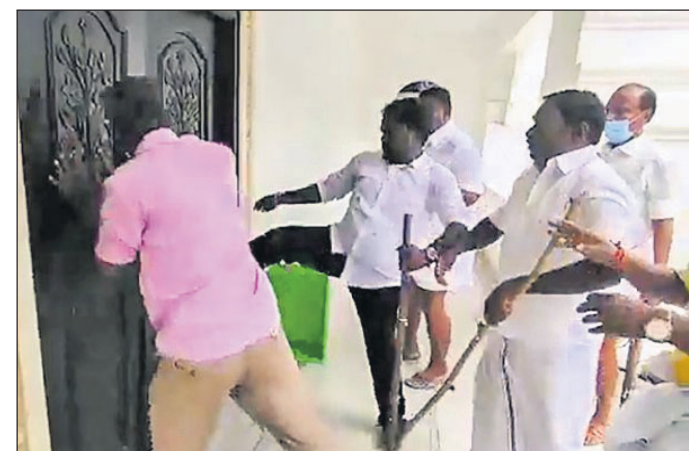
ଓପିଏସ୍‌କ ସମର୍ଥକମାନେ ଦଳୀୟ କାର୍ଯ୍ୟାଳୟ କବାଟ ଭାଙ୍ଗି ଦେଇଛନ୍ତି।