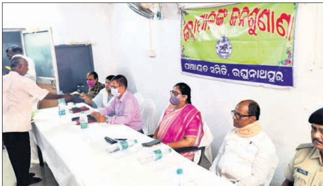
ଜିଲାପାଳ ଓ ଅନ୍ୟ ଅଧିକାରୀମାନେ ଅଭିଯୋଗ ଶୁଣୁଛନ୍ତି।