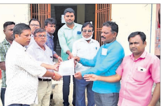
ରୁକ୍ଷ ଶିକ୍ଷାଧିକାରୀଙ୍କୁ ପକାପୁଣ୍ଡାଲ ପ୍ରେସ କ୍ଲବ ପକ୍ଷରୁ ଦାବିପତ୍ର ଦିଆଯାଇଛି।