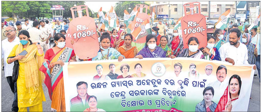
ରଞ୍ଜନ ଗନ୍ଧାସର ଅହେତୁକ ଦର ବୃଦ୍ଧି ପାଇଁ କେନ୍ଦ୍ର ସରକାରଙ୍କ ଏହି ନିର୍ଦ୍ଦେଶ ନୀତି ପ୍ରତିବାଦରେ ସୋମବାର ମାଷ୍ଟରକ୍ୟାଣ୍ଟିନଠାରେ ଭୁବନେଶ୍ୱର ଜିଲ୍ଲା ମହିଳା କଂଗ୍ରେସ କମିଟି ପକ୍ଷରୁ ବିକ୍ଷୋଭ ପ୍ରଦର୍ଶନ କରାଯାଇଛି।