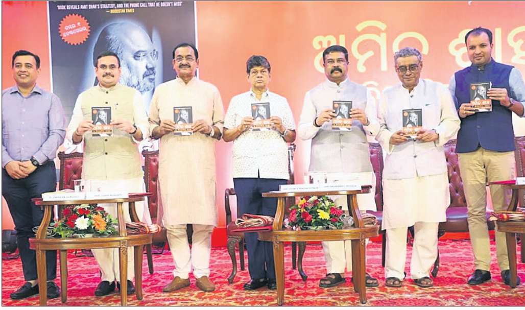
ଭୁବନେଶ୍ୱର ଏକ ହୋଟେଲରେ ସୋମବାର 'ଅମିତ ଶାହା ଓ ଭାଇପାର ଯାତ୍ରା' ପ୍ରସ୍ତୁତ କରୁଥିବା ଧର୍ମେନ୍ଦ୍ର ପ୍ରଧାନଙ୍କ ସମେତ ଅନ୍ୟ ଅତିଥିମାନଙ୍କର ଉଦ୍ଘାଟନ କରୁଛନ୍ତି।