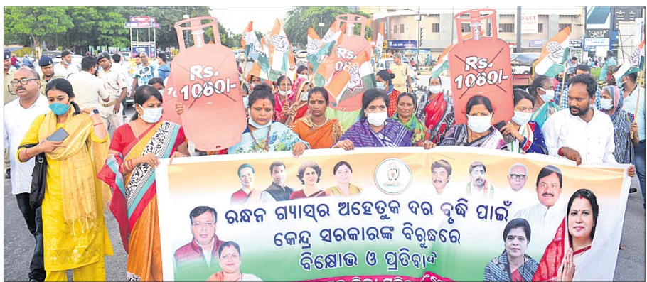
ରଞ୍ଜନ ଗନ୍ଧାସର ଅହେତୁକ ଦର ବୃଦ୍ଧି ପାଇଁ କେନ୍ଦ୍ର ସରକାରଙ୍କ ଏହି ଜନନୀରଣ ନୀତି ପ୍ରତିବାଦରେ ସୋମବାର ମାଷ୍ଟରକ୍ୟାଣ୍ଟିନଠାରେ ଭୁବନେଶ୍ୱର ଜିଲ୍ଲା ମହିଳା କଂଗ୍ରେସ କମିଟି ପକ୍ଷରୁ ବିକ୍ଷୋଭ ପ୍ରଦର୍ଶନ କରାଯାଇଛି।