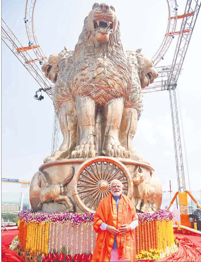
ଦୁଆ ପାଲ୍ଲୀମେଣ୍ଟ ଭବନର ଛାତ ଉପରେ ୬.୫ ମିଟର ଉଚ୍ଚତାବିଶିଷ୍ଟ କାର୍ତ୍ତୀୟ ପ୍ରତୀକର ଗ୍ରୋଊପ୍ରତିଷ୍ଠା ସୋମବାର ଅନାବରଣ କରିବା ଅବସରରେ ପ୍ରଧାନମନ୍ତ୍ରୀ ନରେନ୍ଦ୍ର ମୋଦି।