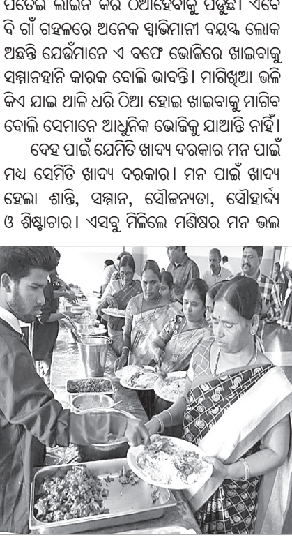
ଋଷ୍ଟିଆନଙ୍କ ପରି ଅନ୍ୟ ସଂଖ୍ୟାଲଘୁ ନିଜର ଲକ୍ଷ୍ୟବସ୍ତୁ କରିଛି।

ଅଳ୍ପମୟ ପ୍ରାଣ। ବିନା ଖାଦ୍ୟରେ ଦେହ ଧାରଣ କରି ରହିବା ଅସମ୍ଭବ। ତେଣୁ ମଣିଷ ହେଉ ବା ପ୍ରାଣୀ ତାକୁ ବଞ୍ଚିବାକୁ ହେଲେ ଖାଦ୍ୟ ଗ୍ରହଣ କରିବାକୁ ପଡ଼େ। ମାତ୍ର ଯିଏ ଯେତେ ସମ୍ପୂର୍ଣ୍ଣ ଭାବରେ ଖାଦ୍ୟ ଗ୍ରହଣ କରେ ସେ ସେତେ ସକ୍ଷମ ଓ ଶିଖିତ ରୂପେ ପରିଗଣିତ ହୁଏ। ଆଦିମ ମଣିଷ କଞ୍ଚାମାଂସ ଖାଉଥିଲା। ବାଘ, ସିଂହ ଓ ଆରମ୍ଭକରି ଶୁଗାଳ, କୁକୁର, କଟାଶ ଯାଏ ସମସ୍ତେ ଅନ୍ୟକୁ ମାରି ମାଂସ ଖାଇଥାଆନ୍ତି। ତେଣୁ ସେମାନଙ୍କ ପଶୁରୂପ ବ୍ୟବହାର ପାଇଁ ସେମାନେ ଭୃଣ ବିବେଚିତ ହୁଅନ୍ତି। ଯେଉଁ ମଣିଷ ଏମାନଙ୍କ ଭଳି ଅଚରଣ କରେ ସେ ବି ଦୁଶା ବିବେଚିତ ହୁଅନ୍ତି। ରଖିକର ଖାଦ୍ୟ ଦରକାର, ପଶୁର ବି ଖାଦ୍ୟ ଦରକାର। ମାତ୍ର ରଖି ଗଛକୁ ମାରି ଫଳ ଖାଆନ୍ତିନାହିଁ। ଅତି ଯତ୍ନରେ ଫଳ ତୋଳି ଖାଆନ୍ତି। ଗଛକୁ ବଞ୍ଚେଇ ରଖିବାକୁ ସେଥିରେ ଖତ, ସାର, ମାଟି, ପାଣି ସବୁ ଦିଅନ୍ତି। ତେଣୁ ଗଛ ତାଙ୍କ ପାଇଁ ଶ୍ରଦ୍ଧାରେ ଆହୁରି ଆହୁରି ଫଳ ଫଳାଏ। ମାତ୍ର ହିଂସ୍ର ପଶୁଟିଏ ଅନ୍ୟ ଏକ ପଶୁକୁ ମାରି ଖାଇଯାଏ। ଖାଦ୍ୟ ଗ୍ରହଣ ପ୍ରକ୍ରିୟାରେ ତା'ର ଶ୍ରଦ୍ଧା, ସମବେଦନା ବା ସମ୍ମତା ନ ଥାଏ। ତେଣୁ ସେ କେବେ ଆଦରଣୀୟ ହୁଏନା। ଘରେ ସେମିତି ଯିଏ ହାତ ପୁରେଇ ହାଣ୍ଡିକୁ ଖାଏ ସେ ତୋର ଭଳି ବିଚାର୍ଯ୍ୟ ହୁଏ। ତାକୁ ସମସ୍ତେ ଛେଇଛେଇ କରନ୍ତି। ମାତ୍ର ଯେଉଁ ଅତିଥି ନାହିଁ ନାହିଁ କରୁଥାଏ ଆମେ ତାକୁ ବଳେଇ ବଳେଇ ଖୁଆଉ। କଣେ ନାହିଁ ନାହିଁ କରୁଥିବ, ତାକୁ ବଳେଇ ବଳେଇ ଖୁଆଉଥିବ ସେଥିରେ ଯେଉଁ ମଜା, ମାଗି ଖାଇବାରେ, ଛଡ଼େଇ ଖାଇବାରେ ସେ ମଜା ନ ଥାଏ। ଆମେ ଗାଁଗହଳରେ ଭୋଜିରେ ସମସ୍ତେ ଧାଡ଼ିକରି ପକ୍ଷରେ ବସୁଥିଲେ। ଖାଦ୍ୟ ସମ୍ପାଦନ ସହ ବାଡ଼ି ଦିଆହେଉଥିଲା। ଅନେକ ଲୋକଙ୍କୁ ଭୋଜିରେ ନିଜ ପାଇଁ ମାଗିବାକୁ ଲାଜ ଲାଗିଥାଏ ବା ଭଲ ଲାଗି ନ ଥାଏ। ତାଙ୍କ ପାଇଁ ପାଖଲୋକ କେହି ମାଗି ଦେଉଥିଲା। ମାତ୍ର ଭୋଜି ଭାଗରେ ବଞ୍ଚେ ସମ୍ପୂର୍ଣ୍ଣ ଆରମ୍ଭ ହେଲା। ଦିନୁ ଠୁ ସେ ମୁଖଲଜା ଆମେ ଛାଡ଼ି ସାରିଲେ। ଖାଇବା ପାଇଁ ଥାଳି