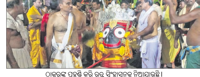
ଠାକୁରଙ୍କୁ ପହଞ୍ଚି କରି ରତ୍ନ ବାହାଣୀକୁ ନିଆଯାଇଛି।

ଅଧରପଣା ନାତି ଅନୁଷ୍ଠିତ ହୋଇଥିଲା। ଏହାପରେ ଠାକୁରଙ୍କୁ ପହଞ୍ଚି କରି ଅଣାଯାଇଥିଲା। ଘଣ୍ଟ, ଶଙ୍ଖ ନାଦରେ ପରିବେଶ ମୁଗ୍ଧିତ ହୋଇଉଠିଥିଲା। ଏହି ଉପଲକ୍ଷେ ପରମ୍ପରା ଅନୁଯାୟୀ ରଥାରୁତ୍ତ ମହାପ୍ରଭୁ ଶ୍ରୀଜୀଉଙ୍କୁ ଶ୍ରୀକରାମ ମନ୍ଦିର ପରିସରରେ ରତ୍ନବେଦୀକୁ ବିଜେ କରିଛନ୍ତି। ସେହିପରି ସାନ ରଥରେ ବିରାଜମାନ କରିଥିବା ଠାକୁରମାନେ ରାଜବାଟୀକୁ ଯିବା ପାଇଁ ମଙ୍ଗଳା ପାଳିଥିଲେ। ଏହାପରେ ରତ୍ନବେଦୀକୁ ଶ୍ରୀଜୀଉ ଏକାକୀ ରଥ ଉପରେ ଶ୍ରୀଜୀଉଙ୍କ ପରମ୍ପରା ମାନବିକ ଭାବେ ପରିବେଶକୁ ମୁଗ୍ଧ କରିଥିଲେ। ଏକାକୀ ରଥ ଉପରେ ଶ୍ରୀଜୀଉଙ୍କ ପରମ୍ପରା ମାନବିକ ଭାବେ ପରିବେଶକୁ ମୁଗ୍ଧ କରିଥିଲେ।