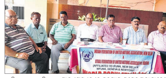
ବିଶ୍ୱ ଜନସଂଖ୍ୟା ଦିବସରେ ଆଇଏଫୟୁଏନ୍ଏର ସଦସ୍ୟଙ୍କ ସମେତ ଅନ୍ୟମାନେ।

ଜଣିଆନ ଫେଡେରେଶନ ଅଫ୍ ଯୁନାଇଟେଡ୍ ନେଶନ୍ସ ଅସୋସିଏସନ୍ (ଆଇଏଫୟୁଏନ୍ଏ) ପକ୍ଷରୁ ତେଜନାଳ ରଥାରୁତ୍ତ କାର୍ଯ୍ୟାଳୟରେ ବିଶ୍ୱ ଜନସଂଖ୍ୟା ଦିବସ ସୋମବାର ପାଳିତ ହୋଇଯାଇଛି। ମୁଖ୍ୟ ଅତିଥି ଭାବେ ପୂର୍ବତନ କେନ୍ଦ୍ରମନ୍ତ୍ରୀ ପକ୍ଷରୁ ଆଇଏଫୟୁଏନ୍ଏ ପକ୍ଷରୁ ତେଜନାଳ ରଥାରୁତ୍ତ କାର୍ଯ୍ୟାଳୟରେ ବିଶ୍ୱ ଜନସଂଖ୍ୟା ଦିବସ ସୋମବାର ପାଳିତ ହୋଇଯାଇଛି। ମୁଖ୍ୟ ଅତିଥି ଭାବେ ପୂର୍ବତନ କେନ୍ଦ୍ରମନ୍ତ୍ରୀ ପକ୍ଷରୁ ଆଇଏଫୟୁଏନ୍ଏ ପକ୍ଷରୁ ତେଜନାଳ ରଥାରୁତ୍ତ କାର୍ଯ୍ୟାଳୟରେ ବିଶ୍ୱ ଜନସଂଖ୍ୟା ଦିବସ ସୋମବାର ପାଳିତ ହୋଇଯାଇଛି।