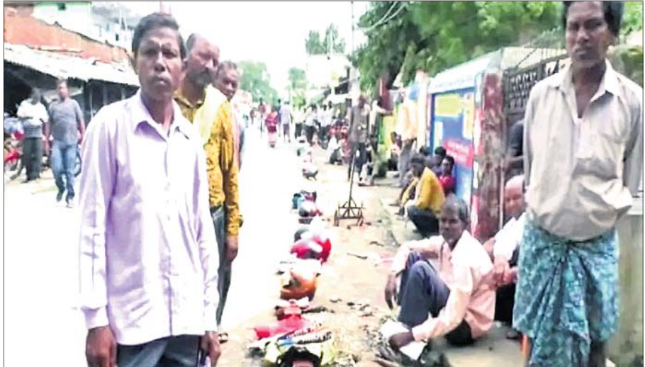
ଝାରସୁଗୁଡ଼ା ଜିଲ୍ଲା ଲଇକେରାରେ ଥିବା ସମ୍ବଲପୁର ଜିଲ୍ଲା କେନ୍ଦ୍ରୀୟ ସମବାୟ ବ୍ୟାଙ୍କ ଶାଖା ସମ୍ମୁଖରେ ଚାଷୀମାନେ ପ୍ରଦର୍ଶନୀ ଭାବେ ଉଠାଇବା ପାଇଁ ରାତି ଗାତାରୁ ଧାଡ଼ିରେ ନିଜ ହେଲ୍ମେଟ୍ ଏବଂ ବ୍ୟାଗ୍ ରଖି ଅପେକ୍ଷା କରି ରହିଛନ୍ତି।