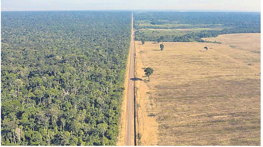
ମାନାଉସ୍ (ବ୍ରାଜିଲ), ୧୧୧୭

କଳିତବର୍ଷ ପ୍ରଥମ ୬ ମାସରେ ବ୍ରାଜିଲର ଆମାଜନ ଜଙ୍ଗଲର ରେକର୍ଡ ଧ୍ୱଂସ କଳିତବର୍ଷ ପ୍ରଥମ ୬ ମାସରେ ବ୍ରାଜିଲର ଆମାଜନ ଜଙ୍ଗଲର ରେକର୍ଡ ଧ୍ୱଂସ ଘଟିଛି। ମ୍ୟାୟଙ୍କ ସହରର ୪ ଗୁଣ ଏବଂ ଦିଲ୍ଲୀର ଅଡ଼େଲ ଗୁଣ ଆକାରର ଜଙ୍ଗଲ ଅଞ୍ଚଳ ନଷ୍ଟ ହୋଇଥିବା ସରକାରୀ ପ୍ରାଥମିକ ରିପୋର୍ଟରୁ ଜଣାପଡ଼ିଛି। ବ୍ରାଜିଲର ନ୍ୟାଶନାଲ ସ୍ପେସ୍ ରିସର୍ଚ୍ଚ ଏଜେନ୍ସି 'ଇନ୍ସପି' ଦ୍ୱାରା ଉଦ୍ଭୋଜିତ ସାଟେଲାଇଟ୍ ଚିତ୍ରରୁ ଜଣାପଡ଼ିଛି ଯେ, ଗତ ଜାନୁୟାରୀରୁ ଜୁନ ମଧ୍ୟରେ ୩,୯୮୮ ବର୍ଗ କିଲୋମିଟର ଆମାଜନ ଜଙ୍ଗଲ ପତା ହୋଇଛି, ଯାହାକି ଗତ ବର୍ଷ ସମାନ ସମୟ ମଧ୍ୟରେ ୧୦.୬% ଅଧିକ ଏବଂ ୨୦୧୫ରୁ ସର୍ବାଧିକ। ଏଭଳି ତଥ୍ୟ ପରିବେଶବିତ୍ଙ୍କ ମଧ୍ୟରେ ଗଭୀର ଚିନ୍ତା ବଢ଼ାଇଛି। କାରଣ ପୃଥିବୀର ଅନୁଜ୍ଞାନ ଏବଂ ଅନ୍ତରାଳୀନ ଚକ୍ରକୁ ବଜାୟ ରଖିବାରେ ଏହି ଗ୍ରୀଷ୍ମମଣ୍ଡଳୀୟ ବୃଦ୍ଧିରୁ ଅଧିକ ଭୂମିକା ନିଭାଇଥାଏ। ତେଣୁ ଆମାଜନ ଜଙ୍ଗଲରେ ହେଉଥିବା କ୍ଷତି ମାନବଜାତିକୁ ବହୁମୁଖ୍ୟ ଦେବାକୁ ପଡ଼ିବ।