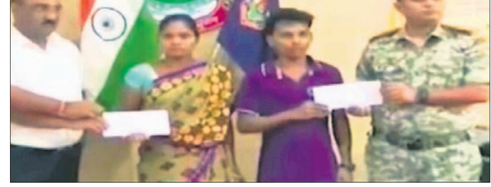
ଆତ୍ମସମର୍ପଣ କରିଥିବା ମାଓବାଦୀ ଦମ୍ପତି।