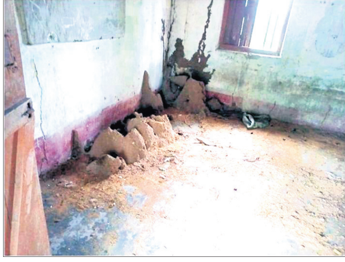
ଶ୍ରେଣୀ ଗୃହରେ ହୋଇଥିବା ଭଲହୁଙ୍କା।

ମାଲକାନଗିରି ଜିଲ୍ଲାରେ ଏପରି ଏକ ବିଦ୍ୟାଳୟ ରହିଛି ଯେଉଁ ବିଦ୍ୟାଳୟର ଶ୍ରେଣୀ ଗୃହ ମଧ୍ୟରେ ଭଲ ହୁଙ୍କା ସହ ପାଣି ଓ ଅଳ୍ପ ଆବଶ୍ୟକତାରେ ଭର୍ତ୍ତି ହୋଇ ରହିଛି।