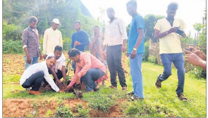
ଗ୍ରାମବାସୀଙ୍କ ସହାୟତାରେ ଚାରାରୋପଣ କରାଯାଇଛି।

ବିଶେଷ କରି ଜୁଲାଇ ୧୨ ଏବଂ ୧୩ ପ୍ରବଳ ବର୍ଷା ସମ୍ଭାବନାକୁ ଦୃଷ୍ଟିରେ ରଖି ପ୍ରାକୃତିକ ବିପର୍ଯ୍ୟୟ ସମୟରେ ଲୋକଙ୍କ ଧନ ଜୀବନ ବିଭିନ୍ନ ସୁରକ୍ଷା ଦିଆଯିବ, ନଦୀକୂଳିଆ ଓ ତ୍ୟାମ୍ ତତ୍ତ୍ୱରୁ ଅଞ୍ଚଳବାସୀ ନଦୀ ମଧ୍ୟକୁ ନ ଯିବା, ସଂକ୍ରାମକ ରୋଗ ଯେଭଳି ନ ବ୍ୟାପିବ ସେଥିପାଇଁ ସ୍ୱାସ୍ଥ୍ୟ ବିଭାଗ ସତର୍କ ରହି ଆବଶ୍ୟକୀୟ ଔଷଧ ସଂଗ୍ରହ କରିବାକୁ ନିର୍ଦ୍ଦେଶ ଦେଇଛନ୍ତି। ସେହିପରି ଶୁଖିଲା ଖାଦ୍ୟ ମହକୁବ ରଖିବାକୁ ନିର୍ଦ୍ଦେଶ ଦେଇଛନ୍ତି। ଅନ୍ୟପକ୍ଷରେ ଦମକ ବାହିନୀ ଓ ଆତ୍ମଲୀଳା ଡାକ୍ତରୀ ସମ୍ପାଦକ ବାହିନୀ ଓ ଆତ୍ମଲୀଳା ଡାକ୍ତରୀ ୨୮ ରେ ହେବାକୁ ଥିବା ବୃକ୍ଷ ଯତ୍ନ