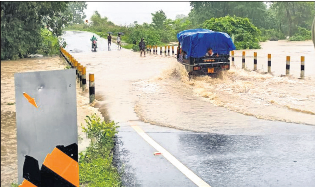
ପୋଲ ଉପରେ ପ୍ରବାହିତ ହେଉଥିବା ବର୍ଷାଜଳ।

ମାଲକାନଗିରି ଜିଲ୍ଲାରେ ଲଗୁତାପଜନିତ ବର୍ଷା ଜାରି ରହିଛି। ଏହାର ପ୍ରଭାବରେ କାଲିମେଳା ବୁକ ଅନ୍ତର୍ଗତ ଏମ୍.ଭି-୯୬ ଗ୍ରାମ ନିକଟରୁ ୩୨୬ ନମ୍ବର ଜାତୀୟ ରାଜପଥର ପୋଲ ଉପରେ ପାଣି ଜମିରହିଛି। ପୋଲ ଉପରେ ଏକ ଫୁଟ ପାଣି ଚାଲୁଥିବା ଦେଖିବାକୁ ମିଳିଛି। ଲଗୁତାପଜନିତ ବର୍ଷା ଯୋଗୁ ଜିଲ୍ଲାରେ ସାଧାରଣ ଜୀବନଯାତ୍ରା ବ୍ୟାହତ ହୋଇଛି। ସୋମବାର ଏହାର ପ୍ରଭାବ ଅଧିକ ରହିଛି। ଏଥିଯୋଗୁ କାଲିମେଳାଠାରୁ ମୋଟୁ ଏବଂ ପଡୋଶୀ ଆନ୍ଧ୍ର ପ୍ରଦେଶକୁ