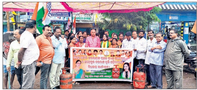
କଂଗ୍ରେସ କର୍ମକର୍ମୀମାନେ ଗ୍ୟାସ ବିଲିଖର ଧରି ବିରୋଧ ପ୍ରଦର୍ଶନ କରୁଛନ୍ତି।