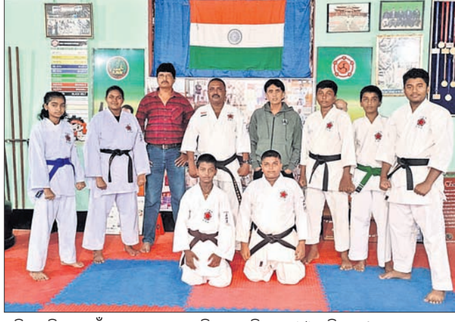
ପ୍ରତିଯୋଗୀ ପାଇଁ ଚୟନ ହୋଇଥିବା ଜିଲାର ପ୍ରତିଯୋଗୀ ଓ ପ୍ରଶିକ୍ଷକ।

ସେପ୍ଟେମ୍ବର ୧୫ ଏବଂ ୧୬ ରୁ ହରିଶମ୍ଭର ଅଲମ୍ପିକ ସଂଘ ଓ କରାଟେ ସଂଘର ମିଳିତ ଆୟୁର୍ବିଦ୍ୟାଳୟରେ ବିଳାସପୁରର ରାଜ୍ୟ କ୍ରୀଡ଼ା ପ୍ରତିଯୋଗୀ ଉପରେ ଖୁବ୍ ଉତ୍ସାହ ଦେଖାଯାଇଛି। ସେ ବନ ବିଭାଗକୁ ଖବର ଦେବା ପରେ ଗଛ କାଟିବା ଲାଗି ଅନୁମତି ଦେଇଥିଲେ। କିନ୍ତୁ ଗଛ କାଟିବା ପାଇଁ ୪୦ ହଜାର ଟଙ୍କା ନ ଥିବାରୁ ଗଛ କଟାଯାଇ ପାରୁ ନ ଥିଲା। ପାପଡ଼ାହାଣ୍ଡି ଅଧିକାରୀ ତିନି ପହଞ୍ଚି ସ୍କୁଲ ଛାତ୍ରକୁ ଗଛତାଳ କାଟି ସଫା କରିଥିଲେ।