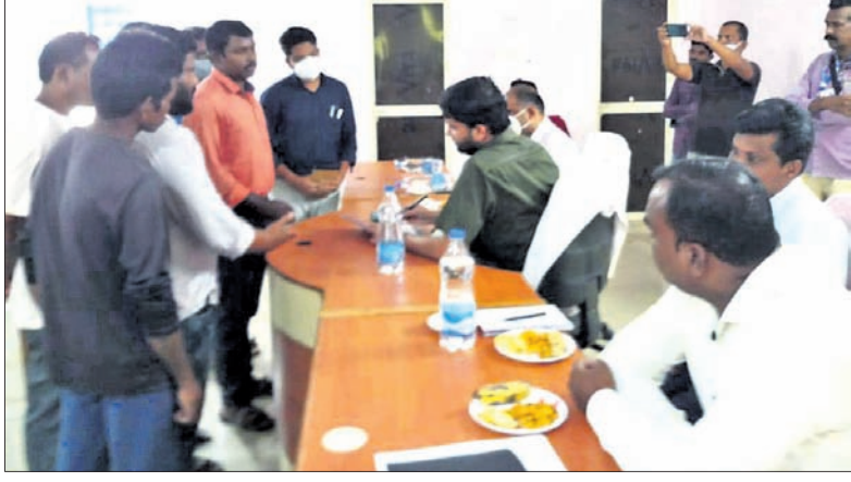
ଶିବିରରେ ଜିଲ୍ଲାପାଳ ଅଭିଯୋଗ ଶୁଣୁଛନ୍ତି ।