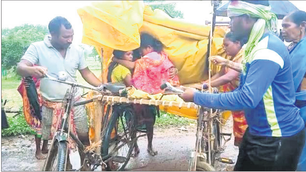
ଗର୍ଭବତୀକୁ ବୋହି ନିଆଯାଇଛି।

ଗାଁକୁ ପକାଇଥିବା ନାହିଁ। ବର୍ଷାରେ ରାସ୍ତା କାନ୍ଥପୂର୍ଣ୍ଣ ଥିବାରୁ ଆତ୍ମଲୀଳା ଗାଁକୁ ଆସିପାରିଲାନି। ଫଳରେ ପରିବାର ଲୋକେ ଏବଂ ଗ୍ରାମବାସୀ ସାଇକେଲରେ ଖାଦିଆ ବାନ୍ଧି ପଲିଥିନ୍ ଘୋଡ଼ାକୁ ଗର୍ଭବତୀକୁ ଆତ୍ମଲୀଳା ପର୍ଯ୍ୟନ୍ତ ନେଇଛନ୍ତି। ନବରଙ୍ଗପୁର ଜିଲ୍ଲା ଝରିଗାଁ ବ୍ଲକ୍ ପାଲିଆ ପଞ୍ଚାୟତ ବେଳଝରି ଗ୍ରାମର ଦିଉଡୁଗୁଡ଼ା ଅଞ୍ଚଳରେ ଏଭଳି ଅଭାବନୀୟ ଘଟଣା ଦେଖିବାକୁ ମିଳିଛି।