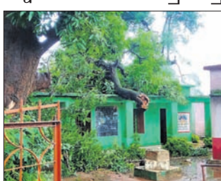
ପାପଡ଼ାହାଣ୍ଡି, ୧୧୭(ଡି.ଏନ୍.ଏ.)- ପାପଡ଼ାହାଣ୍ଡି ବ୍ଲକ୍ ମୁଖ୍ୟକୋଟ ପଞ୍ଚାୟତ ପିଆରିଗୁଡ଼ା ଯୁ.ପି. ସ୍କୁଲରେ ବିପଦପୂର୍ଣ୍ଣ ଅବସ୍ଥାରେ ଥିବା ଆମ୍ବଗଛ ତାଳ ଚୋପାରେ ଖୁଲି ଶ୍ରେଣୀଗୃହ ଛାତ୍ର ଉପରେ ପଡ଼ିଥିଲା। ତେବେ ଛାତ୍ରାଛାତ୍ର ଏଥିରୁ ଅଳ୍ପକେ ବର୍ତ୍ତିଯାଇଛନ୍ତି। ବିପଦସମ୍ମୁଖ ଅବସ୍ଥାରେ ଥିବା ଗଛଟିକୁ କାଟିବାକୁ ବାରମ୍ବାର ଦାବି ହେଉଥିଲା। ଶେଷରେ ଯୋଗଦାନ ଗଛତାଳ ଶ୍ରେଣୀଗୃହ ଛାତ୍ର ଉପରେ ପଡ଼ିଥିଲା। ସୂଚନା ଅନୁଯାୟୀ, ମଧ୍ୟାହ୍ନ ଭୋଜନ ସାରି ଅପରାହ୍ନରେ ଛାତ୍ରାଛାତ୍ର ମାନେ ଶ୍ରେଣୀଗୃହରେ ବସିଥିଲେ। ଏହି ସମୟରେ ଲଗାଣ ବର୍ଷା ଯୋଗୁ ଗଛତାଳ ଛାତ୍ର ଉପରେ ପଡ଼ିଥିଲା। ଭୟରେ ପିଲାମାନେ ବାହାରେକୁ ଚାଲିଯାଇଥିଲେ। ଫଳରେ ୨୦ ଛାତ୍ରାଛାତ୍ର ବର୍ତ୍ତିଯାଇଛନ୍ତି। ଗଛଟିକୁ କାଟିବାକୁ ଗ୍ରାମବାସୀ ଭିତରୁ ଲୋକ ଉଦ୍ଧାର କରିଥିଲେ। ସେ ବନ ବିଭାଗକୁ ଖବର ଦେବା ପରେ ଗଛ କାଟିବା ଲାଗି ଅନୁମତି ଦେଇଥିଲେ। କିନ୍ତୁ ଗଛ କାଟିବା ପାଇଁ ୪୦ ହଜାର ଟଙ୍କା ନ ଥିବାରୁ ଗଛ କଟାଯାଇ ପାରୁ ନ ଥିଲା। ପାପଡ଼ାହାଣ୍ଡି ଅଧିକାରୀ ତିନି ପହଞ୍ଚି ସ୍କୁଲ ଛାତ୍ରକୁ ଗଛତାଳ କାଟି ସଫା କରିଥିଲେ।