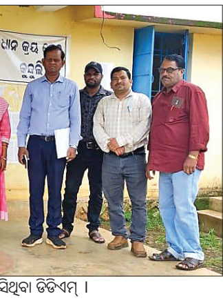
କର୍ମଚାରୀଙ୍କ ଗହଣରେ ଲାମ୍ପୁ ପରିଦର୍ଶନରେ ଆସିଥିବା ଡିଡିଏମ୍ ।

କୋରାପୁଟ/ଜୟପୁର, ୧୧୭ (ସ.ପ୍ର./ନି.ପ୍ର.)- କୋରାପୁଟ ଜିଲ୍ଲାରେ ସୋମବାର ୪ ଜଣ କରୋନା ଆକ୍ରାନ୍ତ ରିକର୍ଡ ହୋଇଛି। ଜୟପୁର ମୁନିସିପାଲିଟି ଅଞ୍ଚଳରୁ ୨ ଜଣ କରୋନା ଆକ୍ରାନ୍ତ ରିକର୍ଡ ହୋଇଥିବାବେଳେ ଡେପୁଟିମାଗିଷ୍ଟ୍ରେଟ୍ ଅଞ୍ଚଳରୁ ଜଣେ ଓ କୋରାପୁଟ ବୁକ ଅଞ୍ଚଳରୁ ଜଣେ ରହିଥିବା ପ୍ରଶାସନ ପକ୍ଷରୁ ଜଣାଯାଇଛି। ଜୟପୁରର ରିକର୍ଡ ଆକ୍ରାନ୍ତଙ୍କ ମଧ୍ୟରେ ଚିରଶେଖର କଲୋନୀର ଜଣେ ଓ ପ୍ରସାଦରାଓ ପେଟା ଅଞ୍ଚଳର ଜଣେ ବୋଲି ଜଣାପଡ଼ିଛି। ସୋମବାର ଏହି ସଂଖ୍ୟାକୁ ମିଶାଇ ଜିଲ୍ଲାରେ କରୋନା ଆକ୍ରାନ୍ତଙ୍କ ସଂଖ୍ୟା ୮ରେ ପହଞ୍ଚିଛି।