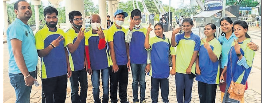
ଓଡ଼ିଶା ଚେଷ୍ଟା ଅଲିମ୍ପିଆଡ୍‌ରେ ଭାଗ ନେବାରୁ ଓଡ଼ିଶାରୁ ୧୧ ଜଣଙ୍କୁ ଚୟନ କରାଯାଇଛି।

ଜାତୀୟ ପ୍ରଶିକ୍ଷଣ ଓ ଅନ୍ତର୍ଜାତୀୟ ପ୍ରତିଯୋଗିତା ନିମନ୍ତେ ଚୟନ କିରିରେ ଭାଗନେବାକୁ ଓଡ଼ିଶାର ୧୧ ଜଣିଆ ଦଳ ଯାତ୍ରା କରିଛି।