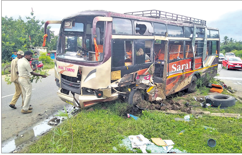
ଦୁର୍ଘଟଣାଗ୍ରସ୍ତ ବସ୍ ନିକଟରେ ପୋଲିସ୍ ଚକଟ କରୁଛି ।

ପୁରୀରୁ ଭୁବନେଶ୍ୱର ଆଡ଼ି ଯାଉଥିବା ସାଧାରଣ ନାମକ ଏକ ଯାତ୍ରୀବାହୀ ବସ୍ ସୋମବାର ସାତଶଙ୍ଖ ବଜାର ନିକଟ ମହାଆପୁର ଛକଠାରେ ଡିଭାଇଡରରେ ପିଟି ହୋଇ ଓଲଟି ପଡ଼ିଥିଲା। ଦୁର୍ଘଟଣାରେ ୨୦ଜଣ ଯାତ୍ରୀ ଆହତ ହୋଇଥିବା ବେଳେ ୪ଜଣଙ୍କ ଅବସ୍ଥା ଗୁରୁତର ହୋଇଛି। ଖବରପାଇ ଗୁମାସ୍ତା ପୋଲିସ୍ ଓ ଜାତୀୟ ରାଜପଥର ପାଟ୍ରୋଲିଂ ଗାଡ଼ି ପହଞ୍ଚି ଆହତଙ୍କୁ ଉଦ୍ଧାର କରି ଚିକିତ୍ସା ପାଇଁ ନିକଟସ୍ଥ ସ୍ୱାସ୍ଥ୍ୟକେନ୍ଦ୍ରକୁ ପଠାଇଥିଲେ। ସୂଚନା ମୁତାବକ, ଉକ୍ତ ଯାତ୍ରୀବାହୀ ବସ୍ ୨୦ରୁ ଅଧିକ ଯାତ୍ରୀଙ୍କୁ ନେଇ ଭୁବନେଶ୍ୱର ଫେରୁଥିଲା। ତେବେ ମାଧ୍ୟାହ୍ନ ୧୨ଟା ସମୟରେ ଯାତ୍ରୀପୁର ଛକ ନିକଟରେ ହଠାତ୍ ଡିଭାଇଡର ଭାରସାମ୍ୟ ହରାଇବାକୁ ବସ୍ ଡିଭାଇଡରରେ ପିଟି ହୋଇ ତଳେ ଓଲଟି ପଡ଼ିଥିଲା। ଗୁମାସ୍ତା ଲୋକେ ଦେଖି ପୋଲିସ୍‌କୁ ଜଣାଇବା ସହ ଗାଡ଼ି ନିକଟକୁ ଆସି ଯାତ୍ରୀଙ୍କୁ ଉଦ୍ଧାର କରିବାରେ ଲାଗିଥିଲେ। ପରେ ଗୁମାସ୍ତା ଗ୍ରାମବାସୀ ଏକାଠି ହୋଇ