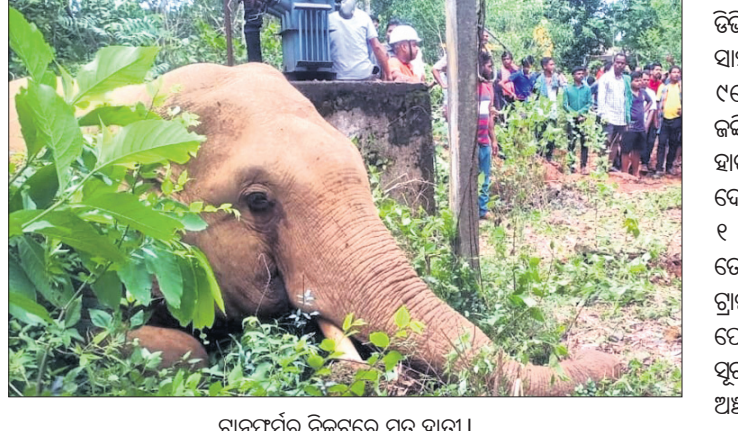
ଗ୍ରାମପଞ୍ଚାୟତ ନିକଟରେ ମୃତ ହାତୀ।