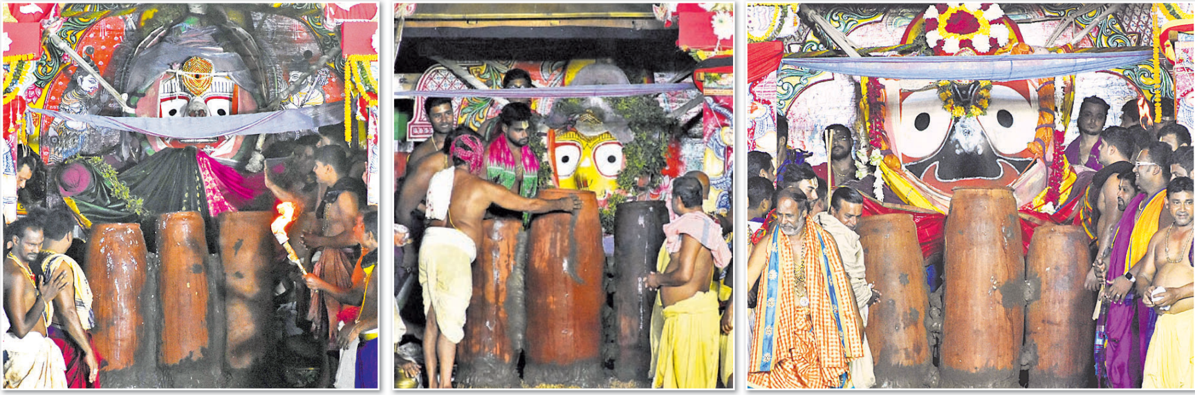
ପୁରୀ ଶ୍ରୀମନ୍ଦିର ସିଂହଦ୍ୱାର ସମ୍ମୁଖରେ ରଥ ଉପରେ ଯୋଗଦାନ ପ୍ରଭୃତି ଶ୍ରୀବଳଭଦ୍ର, ଦେବୀ ସୁଭଦ୍ରା ଏବଂ ମହାପ୍ରଭୁ ଶ୍ରୀ ଜଗନ୍ନାଥଙ୍କ ନିକଟରେ ଅଧରପଣା ନାଚି ସମ୍ପନ୍ନ କରାଯାଇଛି।