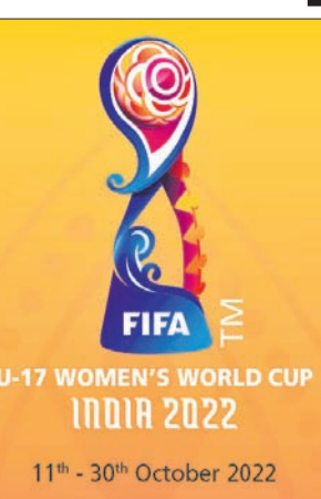
ଅକ୍ଟୋବର ୧୧ରୁ ୩୦ ପର୍ଯ୍ୟନ୍ତ ହେବ। ମ୍ୟାଟ୍ରିଗୁଡ଼ିକ ଭୁବନେଶ୍ୱର ବ୍ୟତୀତ ଗୋଆ ଓ ନଜି ପୁରୀରେ ଖେଳାଯିବ। ୧୭ ବର୍ଷରୁ କମ୍ ଫିଫା

ଭୁବନେଶ୍ୱର, ୧୧.୧୨ ଯେକୋଶିବି ରୁନାମେଷ୍ଟ ପାଇଁ ଭଲ୍ୟୁଣ୍ଡିୟରଙ୍କ ଭୂମିକା ରୁହେବୁଣ୍ଡି।