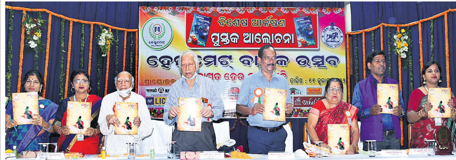
ଭୁବନେଶ୍ୱର ସୂଚନାଉପକ୍ରମରେ ଯୋଗଦାନ ଅନୁଷ୍ଠିତ ହେଲୁମେଟ୍ରୋ ବାର୍ଷିକ ଉତ୍ସବ ଓ ପୁସ୍ତକ ଆଲୋଚନା କାର୍ଯ୍ୟକ୍ରମରେ ଅତିଥିମାନେ ପୁସ୍ତକ 'ବହୁତା'କୁ ଉନ୍ମୋଚନ କରୁଛନ୍ତି।