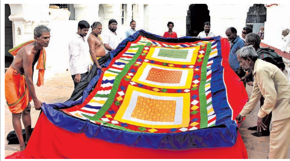
ଶ୍ରୀମନ୍ଦିର ରତ୍ନ ବିଂହାସନ ଉପରେ ଲାଗିବାକୁ ଥିବା କନକମୁକ୍ତି ଚାନ୍ଦୁଆ ବଡ଼ ଓଡ଼ିଆ ମଠ ପରିସରରେ ପ୍ରସ୍ତୁତ କରାଯାଇଛି।