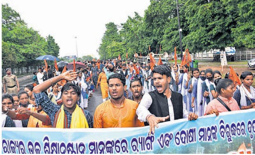
ରାଜ୍ୟ ବନ୍ଦ ଓ ଦୋଷୀଙ୍କ ବିରୋଧରେ ଦୃଢ଼ କାର୍ଯ୍ୟାନୁଷ୍ଠାନ ଦାବିରେ ଏକିଭିଦି ପକ୍ଷରୁ ଲୋକସଭା ପିଏମ୍‌ଜିରେ ବିରୋଧ ଶୋଭାଯାତ୍ରା । ବାରିକେଡ୍ ତେଜ୍ ବିଧାନସଭା ଆଡ଼କୁ ଯିବାବେଳେ ପୋଲିସ୍ କାନ୍ଦୁ କରିନେଉଛି ।