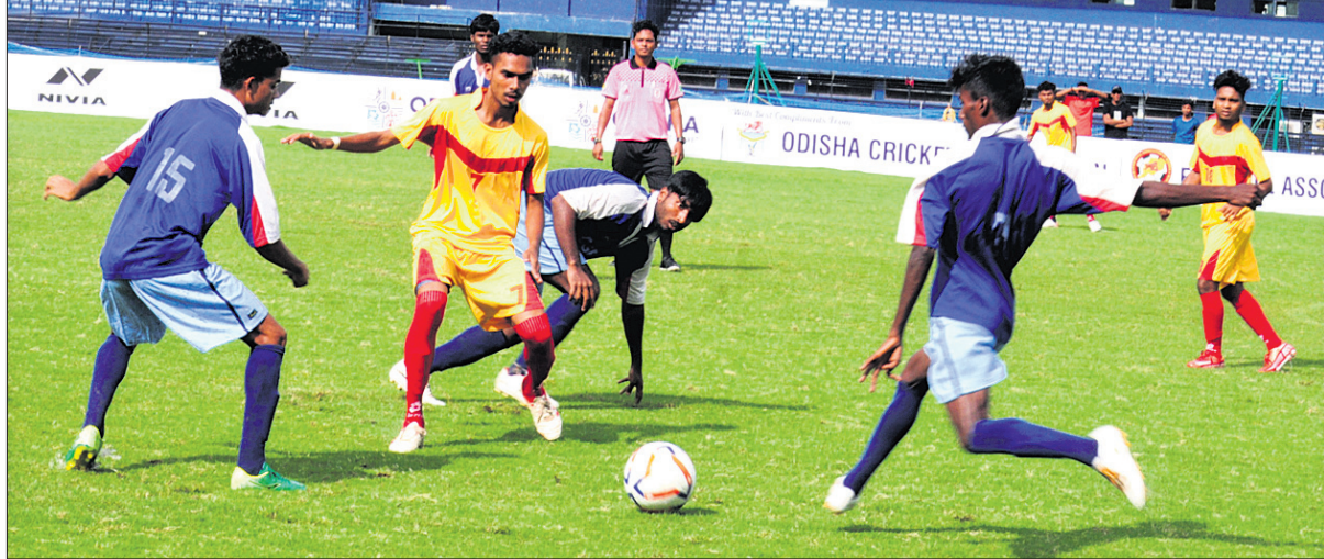
କଟକ ବାରବାଟୀ ଷ୍ଟାଡିୟମରେ ଚାଲିଥିବା ପୁରୁଷ ଲିଗ୍‌ରେ ଯୋଗଦାନ ରୟାଲ କ୍ଲବ୍ ଓ ଓଡ଼ିଶା ସରକାରୀ ପ୍ରେସ୍ କ୍ଲବ୍ ମଧ୍ୟରେ ଅନୁଷ୍ଠିତ ମ୍ୟାଚ।

ଭୁବନେଶ୍ୱର, ୧୧.୧୨ (କ୍ରୀଡା ପ୍ରତିନିଧି): ପୁରୁଷ ଆସୋସିଏଶନ ଅଫ ଓଡ଼ିଶା (ଫାଓ) ଆନୁକୂଲ୍ୟରେ କଟକ ବାରବାଟୀ ଷ୍ଟାଡିୟମରେ ଚାଲିଥିବା ପୁରୁଷ ଲିଗ୍‌ରେ ଯୋଗଦାନ ଅନୁଷ୍ଠିତ ମ୍ୟାଚରେ ରୟାଲ କ୍ଲବ୍ ୨-୦ ଗୋଲରେ ଓଡ଼ିଶା ସରକାରୀ ପ୍ରେସ୍ କ୍ଲବ୍ ଦଳକୁ ପରାସ୍ତ କରିଛି।