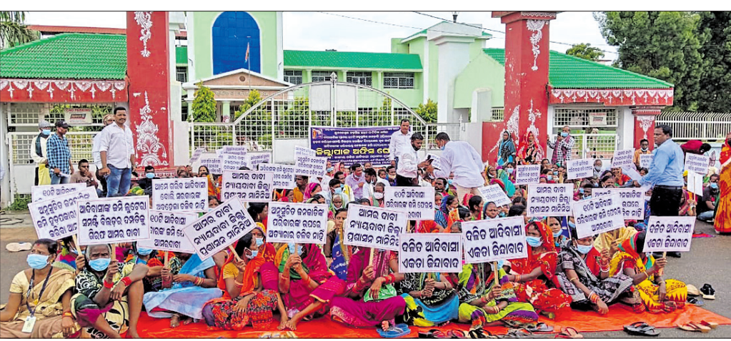
ଜିଲ୍ଲାପାଳଙ୍କ କାର୍ଯ୍ୟାଳୟ ଆଗରେ ଧାରଣା ଦେବା ସହ ପ୍ରତିବାଦ କରୁଛନ୍ତି।

ଜାତୀୟ ଦଳିତ ଆଦିବାସୀ ମହାସଂଘ ଓଡ଼ିଶା ଶାଖା ଆନୁକୁଲ୍ୟରେ ଭୁବନେଶ୍ୱର ତହସିଲ ଅନ୍ତର୍ଗତ ଘାଟିକିଆ ଅନୁସୂଚିତ ଜାତି ଓ ଜନଜାତି ଲୋକଙ୍କ ନ୍ୟାୟ ଦାବିରେ ଯୋଗଦାନ ନୂଆ ବସ୍ତୁଖଣ୍ଡଠାରୁ ଶୋଭାଯାତ୍ରାରେ ବାହାରି ଜିଲ୍ଲାପାଳଙ୍କ କାର୍ଯ୍ୟାଳୟ ଆଗରେ ଧାରଣା ଓ ପ୍ରତିବାଦ କରିଥିଲେ। ଏଥିସହ ୩ ଦମ୍ପା ଦାବିରେ ଏକ ସ୍ମାରକପତ୍ର ଜିଲ୍ଲାପାଳଙ୍କୁ ପ୍ରଦାନ କରିଥିଲେ। ଏଥିରେ ଦର୍ଶାଯାଇଛି ଯେ, ରାଜ୍ୟର ବିଭିନ୍ନ ବ୍ଲକ୍, ତହସିଲ ଅଞ୍ଚଳରେ ରହୁଥିବା ଅନୁସୂଚିତ ଜାତି ଓ ଜନଜାତିଙ୍କ ପ୍ରତି ସରକାର ଅବହେଳା କରୁଛନ୍ତି। ଅବହେଳିତ ଅବସ୍ଥାରେ ସମସ୍ୟା ସମାଧାନ ପାଇଁ ଏମାନେ ସଂଗ୍ରହ କରୁଛନ୍ତି। ଘାଟିକିଆ ମୌଜା ବାରମାଣିଆ ଗ୍ରାମରେ ୧୦ଟି ଆଦିବାସୀ ପରିବାର ୧ ଏକର ୨୦ ଡିସିମିଲ ଜାଗାରେ ଦୀର୍ଘବର୍ଷ ଧରି ରହିଆସୁଛନ୍ତି। ୧୯୬୨ ମସିହାରୁ ସ୍ଥିତିବାଦ