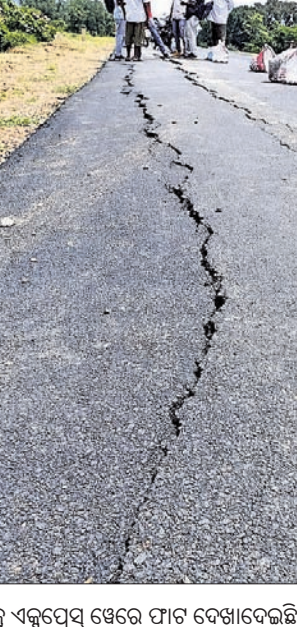
ବିଜୁ ଏକ୍ସପ୍ରେସ୍ ଝେରେ ଫାଟ ଦେଖାଦେଇଛି।

ବିଜୁ ଏକ୍ସପ୍ରେସ୍ ଝେ ନିର୍ମାଣ ସମ୍ପୂର୍ଣ୍ଣ ହୋଇନାହିଁ। ଦୁଇ ଆକିଆ ରାସ୍ତା ନିର୍ମାଣ କାମ ପ୍ରାୟ ଶେଷ ହୋଇଥିବା ବେଳେ ଚାରି ଆକିଆ ପାଇଁ ନିର୍ମାଣ କାମ ଚାଲିଛି। ଫେବୃୟାରୀ ଓ ମାର୍ଚ୍ଚ ମାସରେ ନିର୍ମାଣ