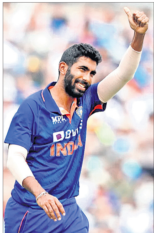
ପ୍ଲେୟର ଅଫ୍ ଦି ମ୍ୟାଚ ଯଶପ୍ରୀତ୍ ବୁମ୍‌ରା ।