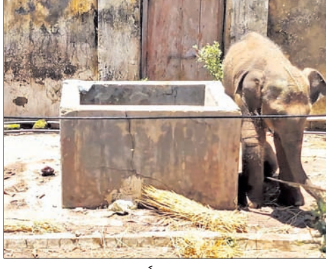
ବେତନଟୀ ରେଞ୍ଜ କାର୍ଯ୍ୟାଳୟରେ ଥିବା ହାତୀଛୁଆ।

ବାରିପଦା ଅଫିସ୍, ୧୨।୭ ମାଷ୍ଟରମାଲକ୍ଷ୍ ଜିଲ୍ଲା ବାରିପଦା ବନଖଣ୍ଡ ଅଧୀନ ବେତନଟୀ ରେଞ୍ଜରେ ବାଟବଣା ହୋଇ ଘୁରି ବୁଲୁଥିବା ଏକ ହାତୀଛୁଆକୁ ସୋମବାର ବିକସିତ ରାତିରେ ବନବିଭାଗ ଉଦ୍ଧାର କରିଛି। ବିଭାଗୀୟ କର୍ମଚାରୀମାନେ ତାକୁ ଆଣି ବେତନଟୀ ରେଞ୍ଜ କାର୍ଯ୍ୟାଳୟ ପରିସରରେ ରଖିଥିଲେ। ପରେ ଶିମିଳିପାଳ ବ୍ୟାପ୍ଟ୍ର ସଂରକ୍ଷଣ ପ୍ରକଳ୍ପର ପିଠାବଟା ରେଞ୍ଜ କାର୍ଯ୍ୟାଳୟକୁ ନିଆଯାଇଥିଲା। ପ୍ରାଣ ବିଶେଷଜ୍ଞ ହାତୀଛୁଆର ସ୍ୱାସ୍ଥ୍ୟ ପରୀକ୍ଷା କରିଛନ୍ତି। ଷ୍ଟାଡ଼ିଂଗ୍ ହାତୀପଲ ସହ ଏହି ଛୁଆଟି ଅସିଥିଲା। ତେବେ ବାଜ୍‌ରିପୋଷି ରେଞ୍ଜ ପୁନାସିଆଠାରେ ମା'ଠାରୁ ଅଲଗା ହୋଇ ଛୁଆଟି ବାଟବଣା ହୋଇଯାଇଥିଲା। ଲୋକେ ମା' ହାତୀକୁ ଘରଢାଳିବାକୁ ଛୁଆଟି ଅଲଗା ହୋଇ ବେଉଳି ରେଞ୍ଜ କୋଷ୍ଠା ଜଙ୍ଗଲରେ ପହଞ୍ଚିଥିଲା। ମା'କୁ ନ ପାଇ ଜନସଂସ୍ଥିତିରେ ପ୍ରବେଶ କରିଥିଲା। ୧୮ମ ଜାତୀୟ ରାଜପଥ, ରେଲଧାରଣା ପାର ହୋଇ ବିଭିନ୍ନ ଗାଁ ଗଣ୍ଡାକୁ ଯାଉଥିବା ବେଳେ ବନକର୍ମଚାରୀମାନେ ତା' ପ୍ରତି ନଜର ରଖୁଥିଲେ। ବାସ୍ ସମୟ ପର୍ଯ୍ୟନ୍ତ ମା'ହାତୀ ନ ଫେରିବାକୁ ଛୁଆକୁ ବନବିଭାଗ ଉଦ୍ଧାର କରିଛି। ବନ କର୍ମଚାରୀମାନେ ହାତୀଛୁଆକୁ ବେତନଟୀ