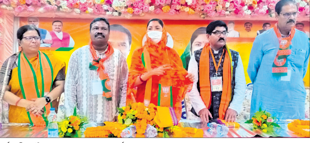
କାର୍ଯ୍ୟକାରୀଣୀ ବୈଠକରେ ମଞ୍ଚାସୀନ ଭାଜପା ନେତୃବର୍ଗ।