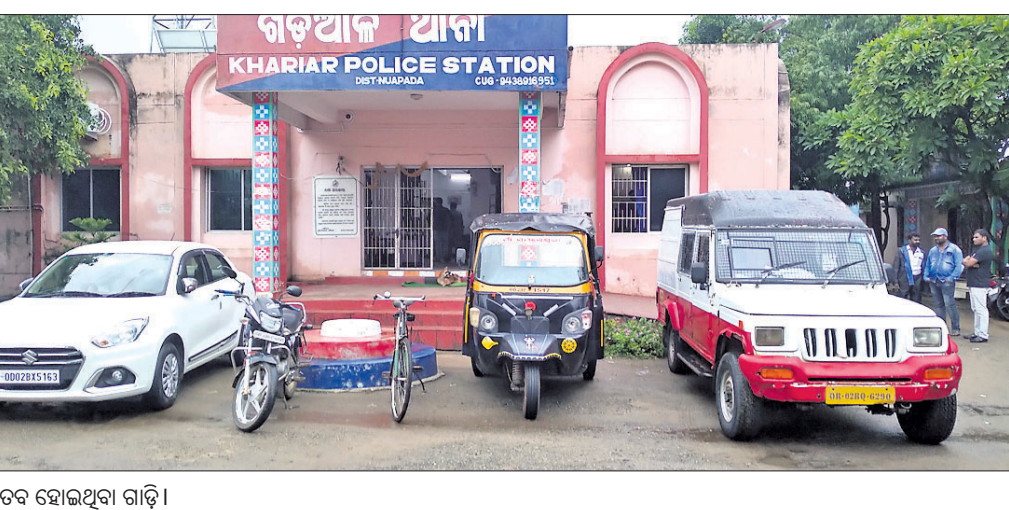
ଜବତ ହୋଇଥିବା ଗାଡ଼ି।