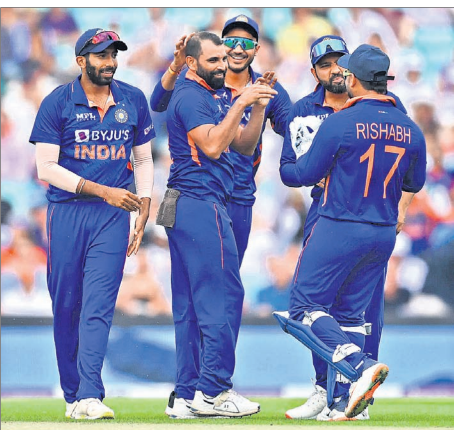
ଉଇକେଟ ନେବାପରେ ମହମ୍ମଦ ଶାମିଙ୍କୁ ସାଥୀ ଖେଳାଳିଙ୍କ ବଧୋଇ ।

ଇନିଂସକୁ ଚାପ ଘରଭଳି ଭୁଣ୍ଡିତା ଦେଇଥିଲେ । ବଟଲର ଦଳ ପକ୍ଷରୁ ସର୍ବାଧିକ ୩୦ (୩୨ ବଲ୍, ୬ ଚୋକା ) ରନ କରିଥିଲେ । ଷ୍ଟୋକ୍ସ ଖାତା ଖୋଲିପାରି ନ ଥିବାବେଳେ ଓଭର୍ଟନ ୮ ରନ କରିବାକୁ ସମର୍ଥ ହୋଇଥିଲେ । ଅବଶିଷ୍ଟ ଗୋଟିଏ ଉଇକେଟ ଭାବେ ମୋଇଜ୍ ଅଲୀ (୧୪)ଙ୍କୁ ଆଉଟ କରିଥିଲେ ଅନ୍ୟତମ ପେସର ପ୍ରସିଦ୍ଧ କ୍ରିଷ୍ଣା । ଅର୍ଥାତ୍ ଭାରତୀୟ ଦ୍ରୁତ ବୋଲରମାନେ ୧୦ଟି ଯାକ ଉଇକେଟ ନେବାର ଗୌରବ ପାଇଥିଲେ । ଘରୋଇ ଇଂଲଣ୍ଡର ୪ ଜଣ ଶୀର୍ଷସ୍ଥାନୀୟ ବ୍ୟାଟର ଗୋଲ୍ଡେନ୍ ଡକ୍(୦)ରେ ଆଉଟ ହୋଇଥିଲେ । ଇଂଲଣ୍ଡ ଇନିଂସ ୨୫.୨ ଓଭରରେ ୧୧୦ ରନରେ ଶେଷ ହୋଇ ଯାଇଥିଲା । ଶାମି ୩୧ ରନରେ ୩ଟି ଓ ପ୍ରସିଦ୍ଧ ୨୬ ରନରେ ଗୋଟିଏ ଉଇକେଟ ନେଇଥିଲେ । ଦିନିକିଆ କ୍ରିକେଟରେ ଭାରତ ବିପକ୍ଷରେ ଇଂଲଣ୍ଡର ଏହା ହେଉଛି ସର୍ବନିମ୍ନ ସ୍କୋର । ପୂର୍ବରୁ ୨୦୦୬ରେ କରୁଣପୁରରେ ଇଂଲଣ୍ଡ କରିଥିବା ୧୨୫ ରନ ସର୍ବନିମ୍ନ ଥିଲା । ସିନିନ ମୁକ୍ତବେସ୍ତ ଚହଲ ମାତ୍ର ୨ ଓଭର ଏବଂ ଅଲ୍‌ରାଉଣ୍ଡର ହାର୍ଡିକ ପାଖ୍ୟା ୪ ଓଭର ବୋଲିଂ କରିବା ସୁଯୋଗ ପାଇଥିଲେ । ସଂକ୍ଷିପ୍ତ ସ୍ୱାଧୀନ ୨୫.୨ ଓଭରରେ ୧୧୦/ଅଲ୍‌ଆଉଟ( କୋସ ବଟଲର-୩୦, ତାଜିତ ଫିଲ୍ଡିଂ-୨୧, ଯଶପ୍ରୀତ୍ ବୁମ୍‌ରା-୬/୧୯, ମହମ୍ମଦ ଶାମି-୩/୩୧, ପ୍ରସିଦ୍ଧ କ୍ରିଷ୍ଣା-୧/୨୬) । ଭାରତ ୧୮.୪ ଓଭରରେ ୧୧୪/୦ (ରୋହିତ ଶର୍ମା-୭୬, ଶିଖର ଧାଢ଼ନ-୩୧)* ।