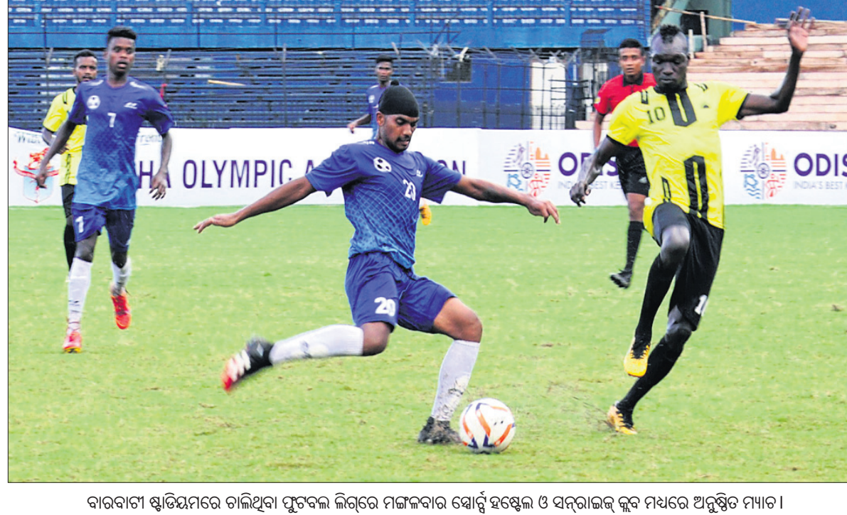
ବାରବାଟୀ ସ୍ତାଡ଼ିୟମରେ ଚାଲିଥିବା ଯୁବକ ଲିଗରେ ମଙ୍ଗଳବାର ସ୍କୋର୍ସ ହେଲେ ଓ ସନ୍ତୋଷକ କ୍ଲବ ମଧ୍ୟରେ ଅନୁଷ୍ଠିତ ମ୍ୟାଚ ।

ପ୍ୟାରିସ, ୧୨/୭ : ପୂର୍ବତନ ଫର୍ମୁଲା ଓଲ ରେସ୍ ନିର୍ଦ୍ଦେଶକ ମାଇକେଲ ମାସି ଅନୁଷ୍ଠାନିକ ଭାବେ ମୋଟର ସ୍କୋର୍ଟର ଗର୍ଭନିର୍ଦ୍ଦେଶକ ଅନ୍ତର୍ଜାତୀୟ ସେନାମୋବାଇଲ ମହାସଂଘ (ଏଫଆଇଏ)ରୁ ଆନୁଷ୍ଠାନିକ ଭାବେ ବିଦାୟ ନେଇଛନ୍ତି । ୨୦୨୧ ଗାଇଡଲ ନିର୍ଣ୍ଣୟକ ଆଧୁନିକ ଗ୍ରୀ ପ୍ରିରେ ସେ ନିୟମର ଭୁଲ ପ୍ରୟୋଗ କରିଥିବା ଅଭିଯୋଗ ହେବାପରେ ଏଫଆଇଏ ତରଫରୁ ତଦକ ଚଳାଯାଇଥିଲା । ଏହା ଏକ ମାନବ ତ୍ରୁଟି ବୋଲି ସହଜ କର୍ମିତ ଜଣାଇବାର ଧମକ ପରେ ମାସି ଏହି ପଦକ୍ଷେପ ନେଇଛନ୍ତି । ଆଧୁନିକ ବିଦାୟ ଉପରେ ସେ କୌଣସି ଟିପ୍ପଣୀ ଦେଇ ନାହାନ୍ତି ।