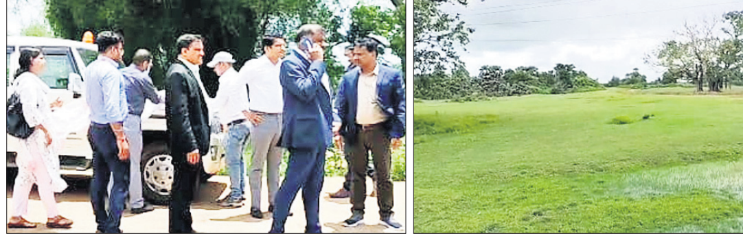
ପଦାବହୁଗାଁ ସ୍ଥିତ ଜମି ସର୍ବେକ୍ଷଣ କରୁଥିବା ଆରବିଆଇ ଟିଏଫ୍ ଓ ଜିଲା ପ୍ରଶାସନ ।