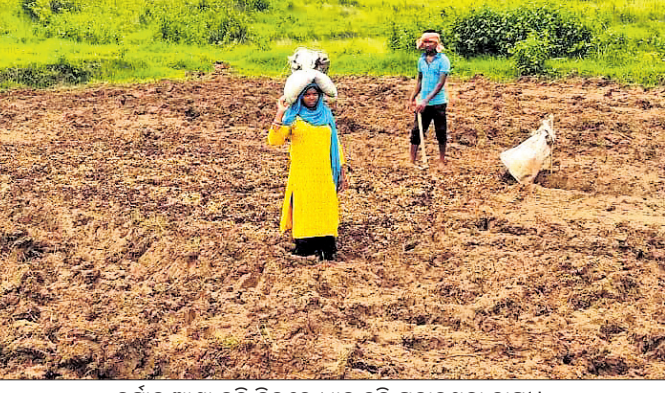
ବର୍ଷାକୁ ଆଶା କରି ବିଲରେ ଧାନ ଚଳି ପକାଉଥିବା ଚାଷୀ।

କେନ୍ଦୁଝର ଜିଲ୍ଲା ଚମ୍ପୁଆ କୃଷି ଜିଲ୍ଲାର ଚଳିତବର୍ଷ ସ୍ୱଳ୍ପ ବୃଷ୍ଟିପାତକୁ ନେଇ ଧାନ ଚାଷୀଙ୍କ ଚିନ୍ତା ବୃଦ୍ଧିପାଇଁ ଲାଗିଛି। ସ୍ୱାଭାବିକ ବର୍ଷାକୁ ଅପେକ୍ଷା କରି ବୁଣା ଜମି ଚୂଡ଼ିକ ପଡ଼ିଆ ପଡ଼ିଥିବା ବେଳେ ଚାଷୀ ଚଳିତ ମାସ ବର୍ଷାକୁ ଆଖି ଆଗରେ ରଖି ଧାନ ଚଳି ଦେଇ ରୁଆ ଉପରେ ଚୁରୁଆରୋପ କରୁଥିବା ଦେଖିବାକୁ ମିଳିଛି। କେଉଁଠି ଚାଷୀ ପାରମ୍ପାରିକ ବିହନ ବ୍ୟବହାର କରୁଛନ୍ତି ତ କେଉଁଠି ଚାଷୀ ଅଧିକ ଅମଳକ୍ଷମ ଧାନ ବିହନ ବ୍ୟବହାର କରୁଛନ୍ତି। ଜୁନ ମାସରେ ସାଧାରଣତଃ ୨୪୧.୪ ମିଲିମିଟର ବର୍ଷା ଜଳ ଚାଷ ପାଇଁ ଆବଶ୍ୟକ ରହିଥିବା ବେଳେ ଗତ ୨୦୨୧ ମସିହା ଜୁନ ମାସରେ ୧୭୮.୧ ମିଲିମିଟର ବର୍ଷା ହୋଇଥିଲା ବେଳେ ଚଳିତ ବର୍ଷ ୧୩୩.୬ ମିଲିମିଟର ବର୍ଷା ହୋଇଥିଲା। ସେହିପରି ଜୁଲାଇ ମାସରେ ୩୧୮ ମିଲିମିଟର ବର୍ଷାର ଆବଶ୍ୟକ ଥିବା ବେଳେ ୨୦୨୧ ମସିହା ଜୁଲାଇ ମାସରେ ୨୬୫.୮ ମିଲିମିଟର ବର୍ଷା ହୋଇଥିବା