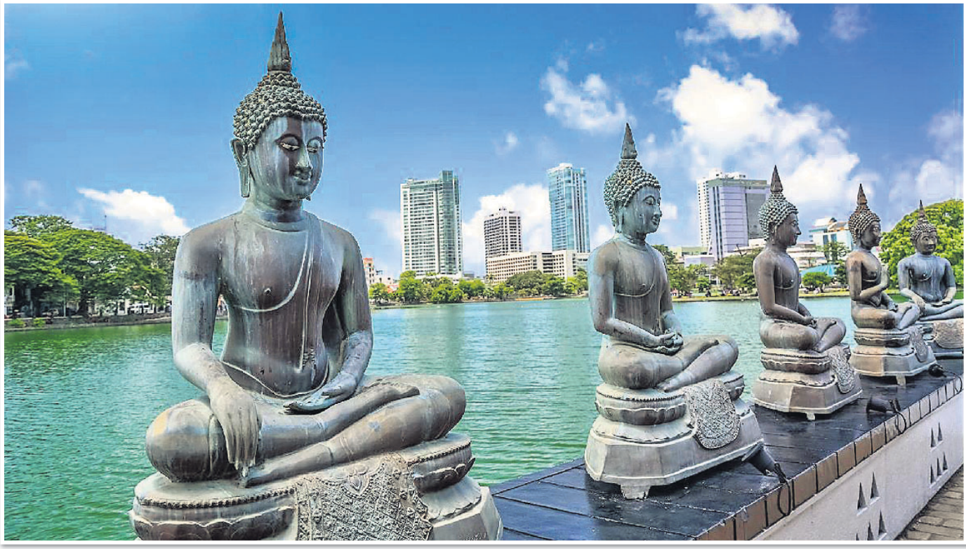
କଲମ୍ବୋରୁ ସାମା ମଲକା ବୌଦ୍ଧ ମନ୍ଦିର।

ହାଇଦ୍ରାବାଦ, ୧୨୨୭: ତେଲଙ୍ଗାନାର କାମାରଣ୍ଡା ଜିଲ୍ଲାରେ ବିଦ୍ୟୁତ୍ ସଂଘର୍ଷରେ ଆସି ମଙ୍ଗଳବାର ଗୋଟିଏ ପରିବାରର ୪ ଜଣଙ୍କ ମୃତ୍ୟୁ ଘଟିଛି। ମୃତକ ହେଲେ ସଂଖ୍ୟାରେ ଗ୍ୟାଲେକ୍ଟି ଏବଂ ରଜାନ ମହାକାଶୀୟ ବସ୍ତୁକୁ ଦେଖିବାକୁ ମିଳିଛି। ଏହି ଟେଲିସ୍କୋପ୍ ମାନବ ଦ୍ୱାରା ନିର୍ମିତ ଏକ ବଡ଼ ଇଞ୍ଜିନିୟରିଂ ସଫଟକ ବୋଲି ବାଲିଡେନ୍ କହିଛନ୍ତି।