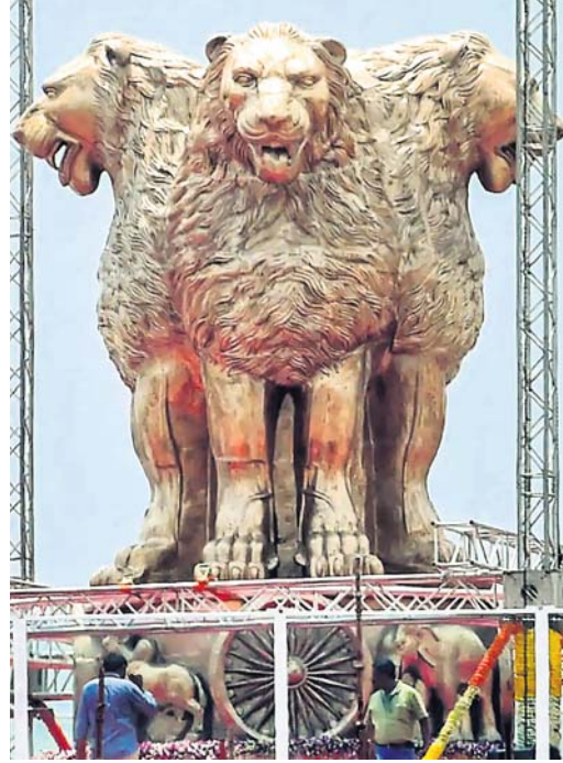
ଜାତୀୟ ପ୍ରତୀକ 'ଅଶୋକ ସ୍ତମ୍ଭ'ର ସିଂହ (ବାମ) ଏବଂ ନୂଆ ପାର୍ଲୀମେଣ୍ଟ ଭବନରେ ସୋମବାର ଲୋକାର୍ପିତ ସିଂହ ପ୍ରତିମା।

ଜାତୀୟ ପ୍ରତୀକକୁ ବିକୃତ କରିଛି କେନ୍ଦ୍ର: ବିରୋଧୀ