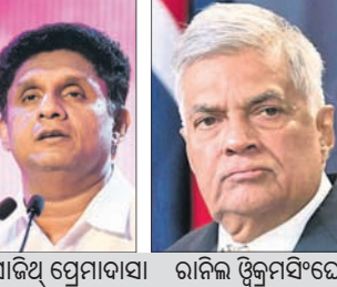
ସାଜିଥି ପ୍ରେମାଦାସୀ ରାଜିଲ ଓଁକମସିଂସେ