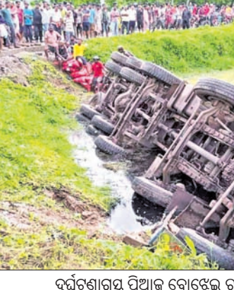
ଦୁର୍ଘଟଣାଗ୍ରସ୍ତ ପିଆଜ ବୋଝେଇ ଟ୍ରକ।

ବାଲେଶ୍ୱର ଜିଲ୍ଲା ବସ୍ତା ଥାନା ଅଧୀନ ବାଇତପଡ଼ା ଗ୍ରାମଠାରେ ଭାରସାମ୍ୟ ହରାଇ ଏକ ପିଆଜ ବୋଝେଇ ଟ୍ରକ ରାସ୍ତାକଡ଼କୁ ଓଲଟି ପଡ଼ିଛି। ସୌଭାଗ୍ୟବଶତଃ ଡ୍ରାଇଭର ଓ ହେଲପର ଅଳ୍ପକେ ବର୍ତ୍ତିଯାଇଛନ୍ତି। ସୋମବାର ବିଳମ୍ବିତ ରାତିରେ ୬୦ନମ୍ବର ଲାଡ଼ାୟ ରାଜପଥ ଭେଲରାଠାରୁ ପାର୍ଡିଶକୁଳକୁ ଯାଉଥିବା ଏକ ପିଆଜ ବୋଝେଇ ଟ୍ରକ (ନଂ. ଓଡ଼ିଶା-୧୮ଏମ୍-୨୫୭୭) ରାସ୍ତା କାଣି ନ ପାରି ଭୁଲରେ ବାଇତପଡ଼ାଠାରୁ କୁଣ୍ଡଳୀ-ସୋନପୁର ଗ୍ରାମ ରାସ୍ତାରେ ପଶିଯାଇଥିଲା। ଫଳରେ ଉକ୍ତ ଗ୍ରାମର ଏକ ପୋଖରୀ ମଧ୍ୟରେ ଟ୍ରକ ଭାରସାମ୍ୟ ହରାଇ ଓଲଟିପଡ଼ିଥିଲା। ରାତି ପ୍ରାୟ ଗୋଟାଏ ବେଳେ ଏହି ଦୁର୍ଘଟଣା ଘଟିଥିବା ବେଳେ କୌଶଳକ୍ରମେ ଡ୍ରାଇଭର ଗାଡ଼ିକୁ ବାହାରିବାକୁ ସମ୍ଭାବ ହୋଇଥିଲା। ହେଲପର ଜଣକ ଦୀର୍ଘ ୨୦ମିନିଟ୍ ଟ୍ରକ ତଳେ ଚାପି ହୋଇରହିଥିଲେ। ଗୁମାସ୍ତା ଲୋକେ ସେଠାରେ ପହଞ୍ଚି ସଙ୍ଗେ ସଙ୍ଗେ ଉଦ୍ଧାର କରି ଆହୁଲ୍ୟାସୁ ଯୋଗେ ଡାକ୍ତରଖାନାକୁ ପଠାଇଥିଲେ। ପୋଲିସ ପହଞ୍ଚି ଦୁର୍ଘଟଣାଗ୍ରସ୍ତ ଟ୍ରକକୁ ଜବତ କରି ତଦନ୍ତ ଜାରି ରଖିଛି। ଡ୍ରାଇଭର ଓ ହେଲପର ଉଭୟ ପୁସ୍ତ ଥିବା ଜଣାପଡ଼ିଛି।