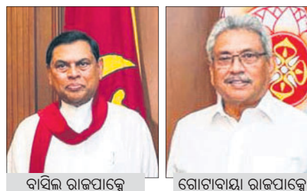
ବାସିଲ ରାଜପାକ୍ସେ ଗୋଟାବୀୟା ରାଜପାକ୍ସେ

ଶାନ୍ତିପୂର୍ଣ୍ଣ ଉପାୟରେ କ୍ଷମତା ହସ୍ତାନ୍ତର ବୋଲି ସୂଚନା ଜଣାପଡ଼ିଛି। ଗୋଟାବୀୟାଙ୍କ କିଛିବେଳେ ବୋଲି ପ୍ରତିଶ୍ରୁତି ଦେଇଥିବା ସାମଗ୍ରୀକ ତଥା ପୂର୍ବତନ ଅର୍ଥମନ୍ତ୍ରୀ ଶ୍ରୀଲଙ୍କାର ୬୩ ବର୍ଷୀୟ ରାଷ୍ଟ୍ରପତି ଗୋଟାବୀୟା ରାଜପାକ୍ସେ ମଙ୍ଗଳବାର ଦୁବାଇକୁ ପଳାୟନ ଉଦ୍ୟମ କରିଥିଲେ। କିନ୍ତୁ କଲମ୍ବୋ ଅନ୍ତର୍ଜାତୀୟ ବିମାନବନ୍ଦରେ ଅପ୍ରସାସନ ଅଧିକାରୀମାନେ ପାସ୍‌ପୋର୍ଟରେ ଷ୍ଟାମ୍ପ ଲଗାଇବା ପାଇଁ ତାଙ୍କୁ ଡିଆଇପି ଚର୍ମିନାଲରେ ଯିବାକୁ ଦେଇ ନ ଦେଖାଦେଇଥିବା ସମେତ କେତେକ ଏସାୟ ରାଷ୍ଟ୍ର ସ୍ୱଳ୍ପ ଆୟକାରୀ ପରିବାରଗୁଡ଼ିକୁ ପ୍ରତ୍ୟକ୍ଷ ନଗଦ ସହାୟତା ପ୍ରଦାନ କରି ସାମାଜିକ ଯୋଜନାର ଅଟକଣ ବଢ଼ାଇଛନ୍ତି। ଆକେଷିକା ଓ ଭେନିଜୁଏଲା ମଧ୍ୟ ଚାଇନାର ରଣ କାଳରେ ଛିଦି ହୋଇସାରିଛନ୍ତି।