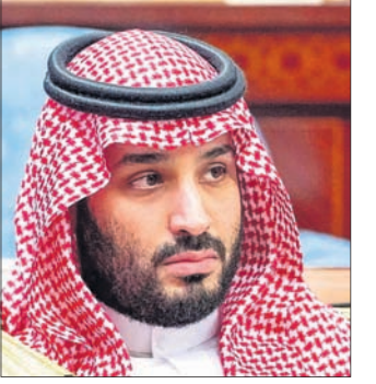
ହତ୍ୟାକାରୀ ବୋଲି ମଧ୍ୟ ସିବିଏସ୍‌ଲ୍‌ସ୍‌ଡି ଚ୍ୟାନେଲକୁ ଏକ ସାକ୍ଷାତକାର