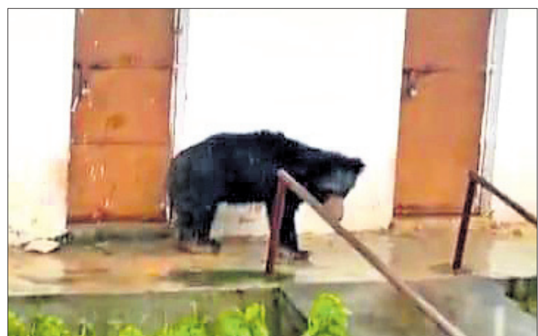
ସ୍କୁଲ ପରିସରରେ ଭାଲୁ ଆଶ୍ରୟ ନେଇଛି।