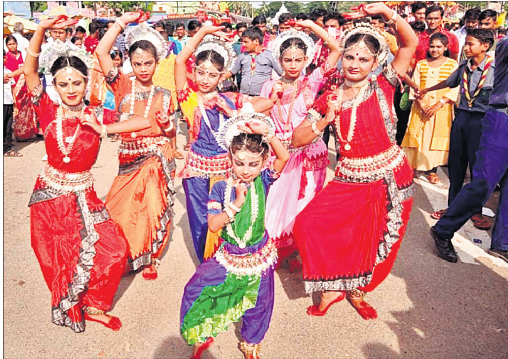
ବ୍ରହ୍ମ ଚାଳକଙ୍କୁ ସମ୍ମାନରେ କଳାକାରମାନଙ୍କ ଦ୍ୱାରା ଗୋଟିଏ ପରିବେଷଣ ।