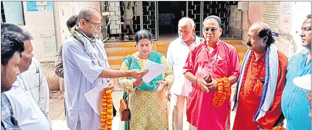
ଉପକୂଳ ଓଡ଼ିଶା ବିକାଶ ପରିଷଦ ପକ୍ଷରୁ ତହସିଲଦାରଙ୍କୁ ଦାବିପତ୍ର ଦିଆଯାଇଛି ।