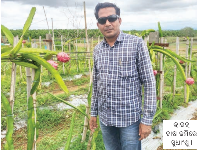
ଦ୍ରାଗନ ଚାଷ ଜମିରେ ଯୁକ୍ତ୍ୟବୁଲୁ

ଆର୍ବିଅକ୍ଟିଡାଏ ଭରି ରହିଛି । ତେଣୁ ବଜାରରେ ଏହାର ଦାମ ଅଧିକ । ଏକ ଏକର ଜମିରେ ଦ୍ରାଗନ୍ ଫଳ ଚାଷ ପାଇଁ ୩ ରୁ ୪ ଲକ୍ଷ ଟଙ୍କା ଖର୍ଚ୍ଚ ହୋଇଥାଏ । 'ଉତ୍ପାଦନ ଭଲ ହେଲେ ୩ ବର୍ଷ ପରେ ଏକର ପିଛା ବାର୍ଷିକ ୨ରୁ ୩ ଲକ୍ଷ ଟଙ୍କା ଆୟ ହୋଇପାରିବ । ଗ୍ରେଡ୍-୧ ଫଳ କିଲୋ ପିଛା ପ୍ରାୟ ୬ ଶହରୁ ୮ ଶହ ଟଙ୍କା ରହିଛି । ନବରଙ୍ଗପୁରରେ ଏହି ଫଳର ବ୍ୟବହାର ବିଷୟରେ କମ୍ ଲୋକ ଜାଣିଥିବାବେଳେ ପଡୋଶୀ ଛତିଶଗଡ଼ରେ ଏହାର ଚାହିଦା ଅଧିକ । ଜଗନ୍ନାଥପୁରରେ ଏହି ଫଳର ଚାହିଦା ଭଲ ଥିବାରୁ ବିକ୍ରିରେ ସମସ୍ୟା ହେବନାହିଁ ବୋଲି