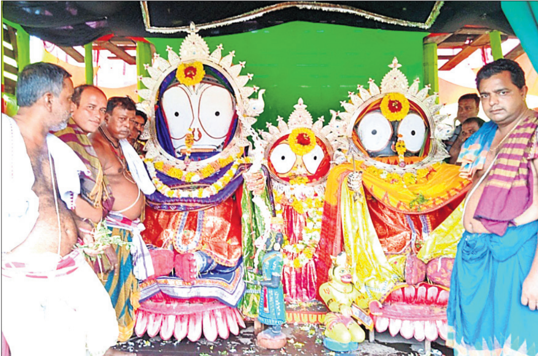
ରୂପା ଅଳଙ୍କାରରେ ସଜ୍ଜିତ ଶ୍ରୀକୃଷ୍ଣବେଦି ଶ୍ରୀକୃଷ୍ଣଭକ୍ତ ଉତ୍ସବରେ ଭାଗ ନେଉଛନ୍ତି ।