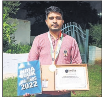
ଭୁବନେଶ୍ୱର, ୧୨/୭ (ସ.ପ୍ର.): ଇଣ୍ଡିଆ ବୁକ୍ ଅଫ୍ ଦେରରେ ପରିବେଷଣ କରାଯାଇଥିବା ପୁସ୍ତକର ପ୍ରକାଶନ କରାଯାଇଛି ।

ହସ୍ତରେ ତାର ଧରିଥିଲେ । ଅପରାଧରେ ବ୍ରହ୍ମ ଚାଳକଙ୍କୁ ରଥରୁ ଦୋହା ଅପସାରଣ କରାଯାଇ ତାରମାଳ ବନ୍ଦୀ ଯାଇଥିଲା ।