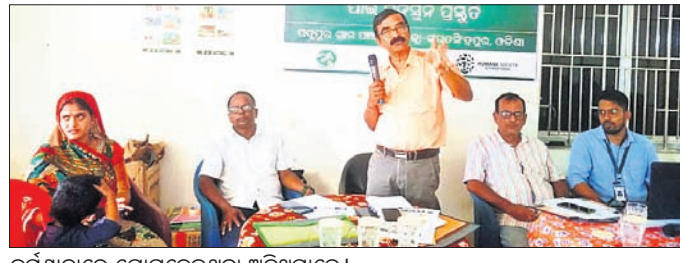
କର୍ମଶାଳାରେ ଯୋଗଦେଇଥିବା ଅତିଥିମାନେ ।

ଆଜ୍ଞାନୀ ଫର୍ ପ୍ରୋସେକ୍ୟୁଟ ଅଫ୍ ଖଳକୁ ଆନିମାଲ୍ (ଆପୋଷା) ପକ୍ଷରୁ ଏକ ସମାବେଶ ଯୋଜନା କରାଯାଇଥିଲା । ଏଥିରେ ଉପସ୍ଥିତ ଥିଲେ ଅନେକ ଜଣେ ସ୍ୱାମୀ ଓ ଶ୍ରୀମତୀ ।