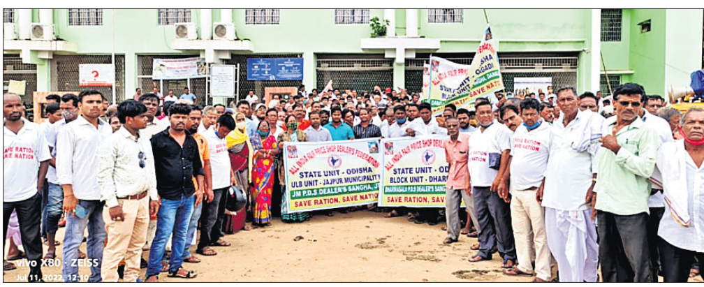
ଜିଲ୍ଲାପାଳଙ୍କ କାର୍ଯ୍ୟାଳୟ ସମ୍ମୁଖରେ ଡିଲରମାନେ ବିରୋଧ ପ୍ରଦର୍ଶନ କରୁଛନ୍ତି।

ଯାଜପୁର ଜିଲ୍ଲା ପିଡିଏସ୍ ଡିଲର ସଂଘ ପକ୍ଷରୁ ଜିଲ୍ଲାପାଳଙ୍କ କାର୍ଯ୍ୟାଳୟ ଘେରାଇ କରାଯାଇଛି। ଏଥିସହିତ ଏବଂ ସାମଲିତ ଏକ ଦାବିପତ୍ର ପ୍ରଧାନମନ୍ତ୍ରୀଙ୍କ ଉଦ୍ଦେଶ୍ୟରେ ଭାରପ୍ରାପ୍ତ ଜିଲ୍ଲାପାଳଙ୍କୁ ପ୍ରଦାନ କରାଯାଇଛି। ଜିଲ୍ଲା ଛତରେ ରୁକ୍ଷପ୍ରଦାୟ ବିରୋଧ କରାଯାଇଥିବା ବେଳେ ଯୋଗଦାନ ଜିଲ୍ଲାପ୍ରଦାୟ ବିରୋଧ ପ୍ରଦର୍ଶନ କରାଯାଇଥିଲା। ଅଗଷ୍ଟ ୨ରେ ଦିଲ୍ଲୀସ୍ଥିତ ସଂସଦ ଭବନ ଘେରାଇ କରାଯିବ ବୋଲି ସଂଘ ପକ୍ଷରୁ ସୂଚନା ପ୍ରଦାନ କରାଯାଇଛି। କେନ୍ଦ୍ର ସରକାରଙ୍କୁ ଦୀର୍ଘ ବର୍ଷ ହେବ ଖାଦ୍ୟ ଶସ୍ୟ ବିତରଣ ବାବଦକୁ ପ୍ରତି ଲକ୍ଷକୋଟି ଟଙ୍କା ବୃଦ୍ଧି କରିବା ପାଇଁ ଦାବି କରାଯାଇଥିଲା। କେନ୍ଦ୍ର ସରକାର କମିଟି ଗଠନ କରି କମିଟି ରିପୋର୍ଟ ଆଧାରରେ ବର୍ଦ୍ଧିତ ହାର ନିଷ୍ପତ୍ତି ନିଆଯିବ ବୋଲି ପ୍ରତିଶ୍ରୁତି ଦେଇଥିଲେ। ତେବେ କମିଟି ଫେବୃଆରୀ ୨୦୧୦ରେ କେନ୍ଦ୍ର ସରକାରଙ୍କୁ ରିପୋର୍ଟ ପ୍ରଦାନ କରିଥିଲା। କିନ୍ତୁ କେନ୍ଦ୍ର ସରକାର କୌଣସି ବିଷୟକୁ ଧ୍ୟାନ ନ ଦେଇ ଏପ୍ରକା