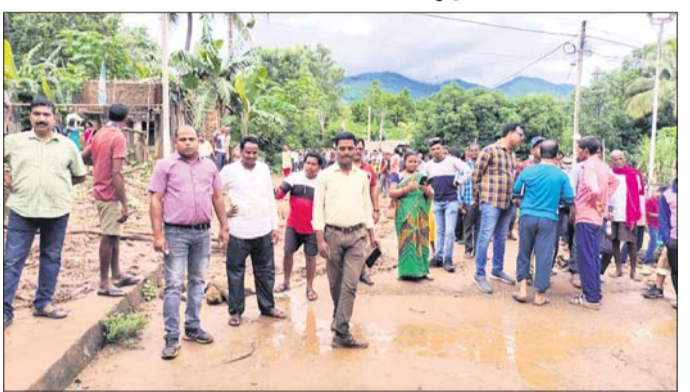
ପରିବାରଙ୍କୁ ସ୍ଥାନାନ୍ତର କରୁଛି ବ୍ଲକ ପ୍ରଶାସନ ।

ନୂଆଗଡ଼ ବ୍ଲକ ଅନ୍ତର୍ଗତ ପରିମଳ ପଞ୍ଚାୟତର ନୂଆପଲ୍ଲୀ ଗ୍ରାମ ନିକଟସ୍ଥ ପଞ୍ଚାୟତରେ ଲଗାଣ ବର୍ଷା ଯୋଗୁ ପଲ୍ଲୀମାନଙ୍କୁ ଭୁସ୍ଥଳନ ହୋଇଥିଲା। ଏଥିରେ ବହୁ ଘର ନଷ୍ଟ ହେବା ସହ ୫ ବାଲକ ମଧ୍ୟ ମାଟିରେ ପୋତି ହୋଇଯାଇଥିଲା। ଏଥିସହ ଆସନ୍ତା ୧୪ ଓ ୧୫ ତାରିଖ ବେଳକୁ ପୁଣି ଲଗାଣ ବର୍ଷା ହେବାର ସମ୍ଭାବନା ଥିବା ଯୋଗୁ ଏହାକୁ ଦୃଷ୍ଟିରେ ରଖି ବ୍ଲକ ପ୍ରଶାସନ ପକ୍ଷରୁ ସମ୍ପୂର୍ଣ୍ଣ ବିପନ୍ନ ନୂଆପଲ୍ଲୀ ଗ୍ରାମର ସମସ୍ତ ୩୯ ପରିବାରଙ୍କୁ ପରିମଳ ଛାଡ଼ି ପଞ୍ଚାୟତ କାର୍ଯ୍ୟାଳୟକୁ ସ୍ଥାନାନ୍ତର କରାଯାଇ ଅଣ୍ଡାଘା ଭାବେ ଅଧିକାର କରାଯାଇଛି। ସେହିଭଳି ଅଧିକାର ହୋଇଥିବା ସମସ୍ତ ପରିବାରଙ୍କୁ ପରିମଳ ପଞ୍ଚାୟତ ପକ୍ଷରୁ