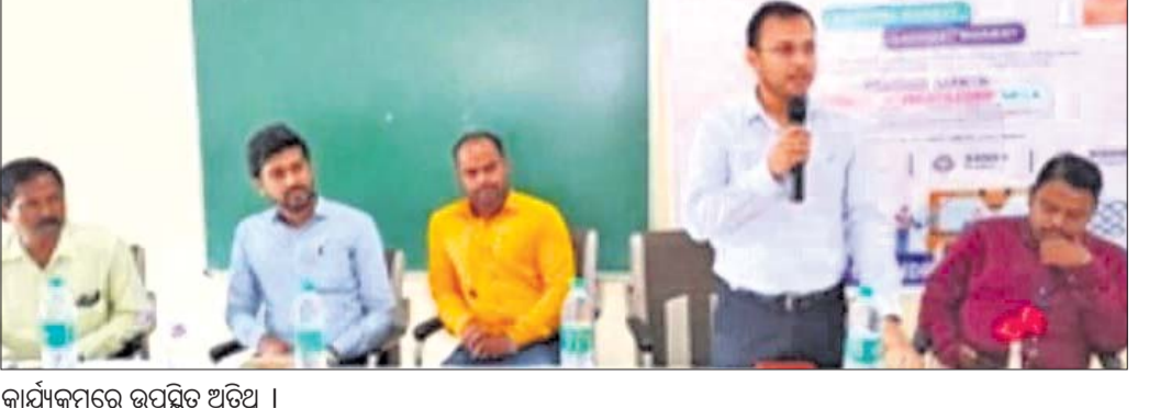
କାର୍ଯ୍ୟକ୍ରମରେ ଉପସ୍ଥିତ ଅତିଥି ।