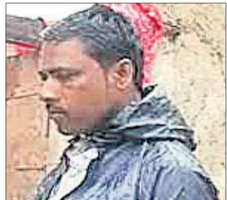
ଜବରଦସ୍ତ ଟଙ୍କା ଆଣୁଥିବାବେଳେ ଏ ନେଇ ଉଚ୍ଚ ରାଜ୍ୟ ବିରୋଧରେ ଆନାରେ

ଉତ୍ତର ପ୍ରଦେଶର ନାମଚରେ ଏକ ବିପ୍ରତ କଲ୍ୟାଣ ଘଟଣା ଘଟିଯାଇଛି । ସରପଞ୍ଚ ନିର୍ବାଚନରେ ହାରିବା ପରେ ଆଶାୟୀ ପ୍ରାର୍ଥୀ ଘର ଘର ବୁଲି କୁଳମ କରି ଟଙ୍କା କୁଳମ କରୁଛନ୍ତି । ଭୋଟ ଦେବା ପାଇଁ ପ୍ରାର୍ଥୀ ରାଜ୍ୟ ଚେନା ଭୋଟରମାନଙ୍କୁ ଯେଉଁ ଟଙ୍କା ଦେଇଥିଲେ ଏବେ ସେହି ଟଙ୍କାକୁ ଫେରାଇବା ପାଇଁ ସେ ଲୋକଙ୍କୁ କରୁଛନ୍ତି । ତେବେ କେତେକ ଘରୁ ସେ ଜୋର