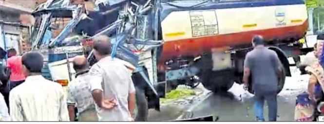
ଦୁର୍ଘଟଣାଗ୍ରସ୍ତ ଟ୍ୟାଙ୍କର ।