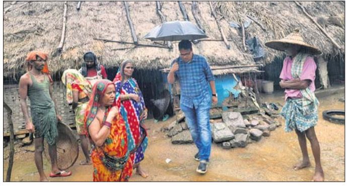
ଉପକଳାପାଳ ସ୍ଥିତି ଅନୁଧ୍ୟାନ କରୁଛନ୍ତି ।

ଭଞ୍ଜନଗର ଅଞ୍ଚଳରେ ବିଗତ ୩ଦିନ ହେବ ଲଗାଣ ବର୍ଷା ଲାଗି ରହିଛି । ଏହାର ପ୍ରଭାବରେ କେତେକ ଅଞ୍ଚଳରେ ବନ୍ୟା ପରିସ୍ଥିତି ସୃଷ୍ଟି ହୋଇଛି ।