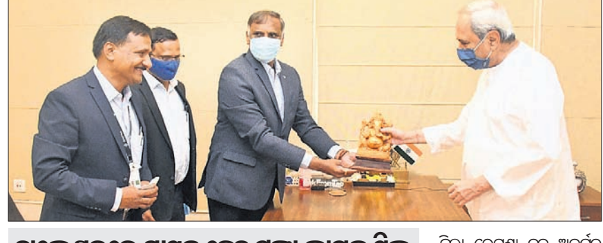
ବାଲେଶ୍ୱରରେ ସ୍ଥାପନ ହେବ ଟଙ୍କା କାଗଜ ମିଲ୍