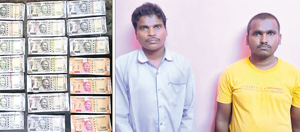
ଜବତ ହୋଇଥିବା ନକଲି ନୋଟ୍ ଏବଂ ଗିରଫ ୨ ଅଭିଯୁକ୍ତ।

ସମ୍ବଲପୁର/ଭୁବନେଶ୍ୱର, ୧୩୭(ସ୍ୱା.ରୋ.) ସମ୍ବଲପୁର ଜିଲ୍ଲା ମୁମୁମୁରା ଥାନାର ଦୁର୍ଗ ଅଞ୍ଚଳ ନୂଆ ଅଢ଼ାପଡ଼ା ଗ୍ରାମରେ ମଙ୍ଗଳବାର ରାତିରେ ଏସ୍‌ଟିଏସ୍ ଚଢ଼ାଉ କରି ୧୫ଲକ୍ଷ ୧୨ ହଜାର ୫୦୦ ଟଙ୍କାର ନକଲି ନୋଟ୍ ଜବତ କରାଗଲା।