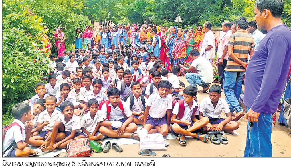
ବିଦ୍ୟାଳୟ ସମ୍ମୁଖରେ ଛାତ୍ରଛାତ୍ରୀ ଓ ଅଭିଭାବକମାନେ ଧାରଣା ଦେଇଛନ୍ତି।