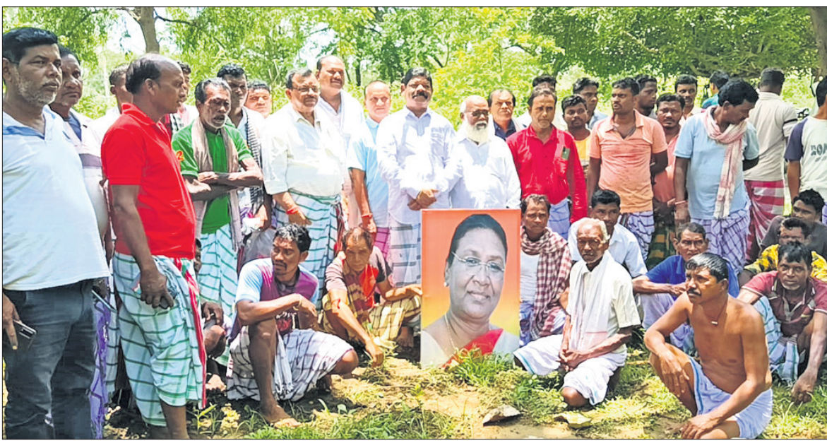
ବହୁକଦା ବୁକ ବଡ଼ପାଳିଆ ଗାଁରେ ସାତାଳ ସମ୍ପ୍ରଦାୟର ଲୋକେ ପୂଜାର୍ଚ୍ଚନା କରୁଛନ୍ତି।