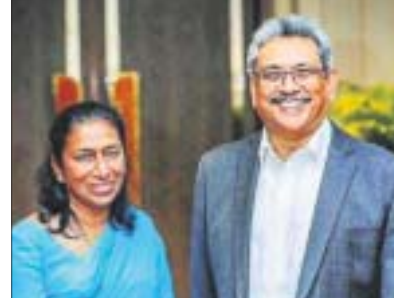
ସ୍ତ୍ରୀ ଲୋମାଙ୍କ ସହ ଗୋଟାବାରା ରାଜପାକ୍ସେ।