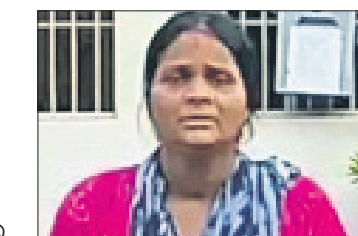
ପାଡ଼ିତା ମହିଳା ରାଜା ସାହୁ ଷଡ଼ି ହେବାକୁ ସେ ଲୋକଙ୍କ ଚକା ଫେରାଇବାରେ ନ ଥିଲେ। ଫଳରେ ଚକା ଦେଇଥିବା ଲୋକମାନେ ତାଙ୍କୁ ବିଭିନ୍ନ ସମୟରେ ଗାଳିଗୁଳାକ କରିବା ସହ ଧମକ ଦେଇ ଆସୁଥିଲେ। ରାଜ୍ୟ ସାମା ଭାରତ ଗରିବ ମହିଳାଙ୍କ ଜରିଆରେ ଲକ୍ଷାଧିକ ଚକା ରଖି ନେଇଥିଲେ। ଏପରି କି ଗ୍ଲାମାୟ ଲୋକଙ୍କଠାରୁ ହାତ ଉଧାରି କରି ବ୍ୟବସାୟ କରୁଥିଲେ। ଉକ୍ତ ରଖି ଚକାରେ ମଙ୍ଗଳାବଜାରରେ ଏକ ୩ମହଲା କୋଠା କରି ତାକୁ ଭଡ଼ାରେ ମଧ୍ୟ ଲଗାଇଛନ୍ତି। କରୋନା ସମୟରେ ବ୍ୟବସାୟରେ

ମହିଳା ଏବଂ ୨ଜଣ ପୁରୁଷଙ୍କ ବିରୋଧରେ ଲିଖିତ ଏତଲା କରିଛନ୍ତି। ଅଭିଯୋଗକୁ ଆଧାର କରି ତଦନ୍ତ ଜାରି ରହିଛି ବୋଲି ଥାନା ଅଧିକାରୀଙ୍କୁ ସୂଚିତା ଜେନା କହିଛନ୍ତି। ମିଳିଥିବା ସୂଚନାସୁଯାରେ ରାଜ୍ୟ ଗତ ୪ବର୍ଷ ହେଲା ଗ୍ଲାମାୟ ଅଞ୍ଚଳର ବିଭିନ୍ନ ଘରୋଇ ଅର୍ଥ ଲାଗଣ ସଂସ୍ଥାରୁ ବହୁ ଘରକୁ ଏସିଡ୍ ମାଡ଼ କରି ଫେରାଇ ହୋଇଯାଇଥିଲେ। ଏପରି କି ଘଟଣାସ୍ଥଳରେ ସହଜୁରାଣାକୁ ହସିଗାଳୁ ନେଇଥିଲା। ରାଜ୍ୟ ଘର ନିକଟରେ ଲାଗିଥିବା ସିସିଟିଭି ଫୁଟେଜ୍‌କୁ ଆଧାର କରି ପୋଲିସ ତଦନ୍ତ ଆରମ୍ଭ କରିଥିବାବେଳେ ତାଙ୍କ ସାମା ଏନେଇ ଆନାରେ ୨ଜଣ