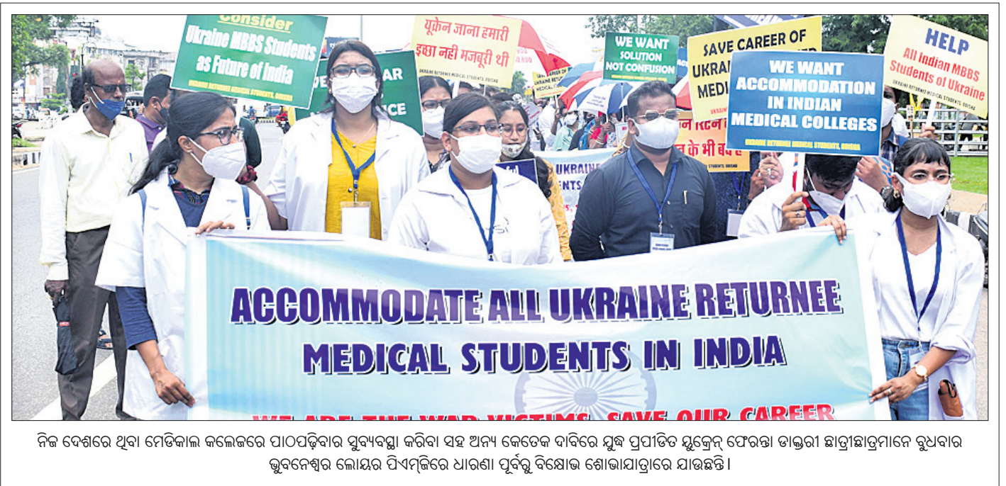
ନିଜ ଦେଶରେ ଥିବା ମେଡିକାଲ କଲେଜରେ ପାଠପଢ଼ିବାର ସୁବ୍ୟବସ୍ଥା କରିବା ସହ ଅନ୍ୟ କେତେକ ଦାବିରେ ଯୁଦ୍ଧ ପ୍ରସାରିତ ଯୁକ୍ତେନ୍ଦ୍ର ଫେରକା ତାହୁଡ଼ା ଛାତ୍ରଛାତ୍ରୀମାନେ ବୁଧବାର ଭୁବନେଶ୍ୱର ଲୋକସଭା ପିଏସ୍‌ସିରେ ଧାରଣା ପୂର୍ବକ ବିକ୍ଷୋଭ ଶୋଭାଯାତ୍ରାରେ ଯାଉଛନ୍ତି।