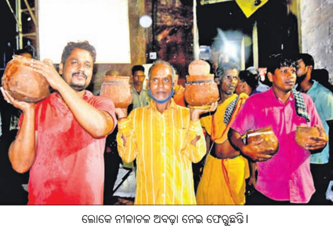
ଲୋକେ ନୀଳାଚଳ ଅବତ୍ତା ବେଳ ଫେରୁଛନ୍ତି।

ମହାପ୍ରଭୁଙ୍କ ନୀଳାଚଳ ବିକେ ପରେ ବୁଧବାର ନୀଳାଚଳ ଅବତ୍ତା ବାହାରିଛି। ନୀଳାଚଳ ଅବତ୍ତା ପାଇଁ ଆନନ୍ଦବଜାରରେ ଶ୍ରଦ୍ଧାଳୁଙ୍କ ଗହଳି ଦେଖିବାକୁ ମିଳିଛି। ମଙ୍ଗଳବାର ବିକସିତ ରାତ୍ରରେ ଶ୍ରୀମନ୍ଦିର ଉତ୍ସବସାଧନରେ ଶ୍ରଦ୍ଧା କାର୍ଯ୍ୟ ଶେଷ ହୋଇଥିଲା। ବୁଧବାର ଭୋରକୁ କୋଠ ସୁଆଁସିଆମାନେ ଚାରମାଳ ଖୋଲିବା ପରେ ମହାପ୍ରଭୁଙ୍କ ମଙ୍ଗଳ ଆକତି, ଅବକାଶ ଓ ଅନାମ୍ୟ ନାତି ସମ୍ପନ୍ନ ହୋଇ ଗୋପାଳବଲ୍ଲଭ ଭୋଗ କରାଯାଇଥିଲା। ଏହାପରେ ନୀଳାଚଳ ଅବତ୍ତା ବାହାରିଥିଲା। ନୀଳାଚଳ ଅବତ୍ତା ସେବନ କଲେ ମୋକ୍ଷପ୍ରାପ୍ତି ହେବାର ବିଶ୍ୱାସ ରହିଛି। ସେହିପରି ଗୁରୁପୂର୍ଣ୍ଣିମା ଅବସରରେ ମହାପ୍ରସାଦ ରୁଚୁପୂର୍ଣ୍ଣିମା ଅବସରରେ ମହାପ୍ରସାଦ ସାହିବାସିନ୍ଦା ନୀଳାଚଳ ଅବତ୍ତା ନେଇ ଘରେ ଖାଇଥାନ୍ତି। ଏଣୁ ଭୋଗ ବାହାରିବା ପରେ ସ୍ଥାନୀୟ ଲୋକେ ଅବତ୍ତା ଧରି