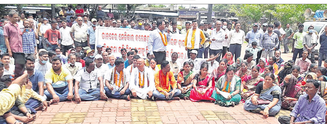
ପ୍ରତିବାଦ ସଭାରେ ସାମିଲ ହୋଇଥିବା ପଞ୍ଚାୟତବାସୀ।