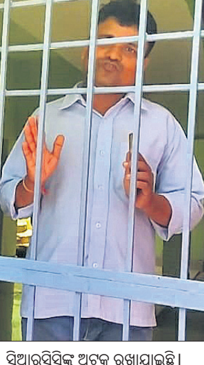
ସିଆରସିସିସ୍କୁ ଅଟକ ରଖାଯାଇଛି। ସିଆରସିସିସ୍କୁ ଅଟକ ରଖାଯାଇଛି। ସିଆରସିସିସ୍କୁ ଅଟକ ରଖାଯାଇଛି।