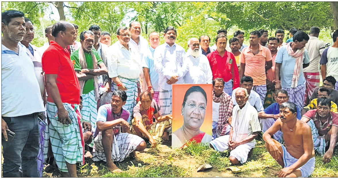
ବହୁଜନୀ ବୁକ୍ ବଡ଼ପାଳିଶା ଗାଁରେ ସାମାଜିକ ସମ୍ପ୍ରଦାୟର ଲୋକେ ପୂଜାର୍ଚ୍ଚନା କରୁଛନ୍ତି।