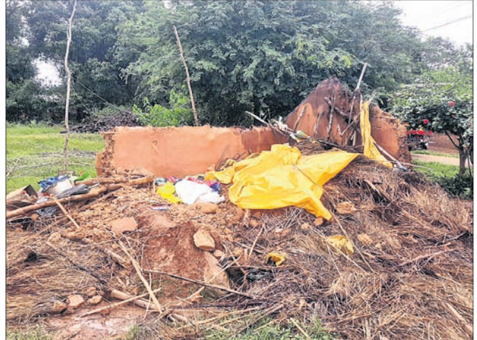
ବର୍ଷାରେ ନଷ୍ଟ ହୋଇଥିବା ଗଙ୍ଗାଙ୍କ କକାଘର।

ନବରଙ୍ଗପୁର ଜିଲ୍ଲା ନୟାହାଣ୍ଡି ବ୍ଲକ୍ ଧର୍ମପୁର ଗ୍ରାମରେ ଘଟିଯାଇଛି। ଲଗାଣ ବର୍ଷାରେ ଘରକାନ୍ଧ ଭୁଗୁଡ଼ି ମଙ୍ଗଳବାର ରାତିରେ ଜଣେ ବୃଦ୍ଧଙ୍କ ମୃତ୍ୟୁ ଘଟିଛି। ସେ ହେଲେ ଗ୍ରାମର ଗଙ୍ଗା ସୌରା(୬୫)।