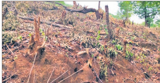
ଜଙ୍ଗଲରୁ ଗଛ କଟାଯାଇଛି।