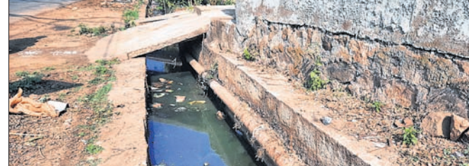
ସଫା ହୋଇ ନ ଥିବା ଡ୍ରେନ୍।

କୋରାପୁଟ ଜିଲ୍ଲାରେ ତେଜୁ ରୋଗ କୁ ନେଇ ଜିଲ୍ଲା ପ୍ରଶାସନ ର ତିନି ବଡ଼ା ବଡ଼ା ବେଲ ଥିବା ବେଳେ ଡ୍ରେନକୁ ଠିକ ଭାବେ ସଫାକରିବା ହେଉ ନ ଥିବା ଯୋଗୁଁ ଏପରି ସ୍ଥିତି ଦେଖାଦେଇଛି।