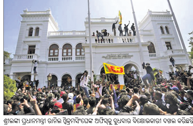
ଶ୍ରୀଲଙ୍କା ପ୍ରଧାନମନ୍ତ୍ରୀ ରାନିଲ୍ ପ୍ରେମଦାସ୍‌ଙ୍କ ଅତିଥିକୁ ବୁଧବାର ବିଶୋଭକାରୀ ବଖଳ କରିଛନ୍ତି।

ଶ୍ରୀଲଙ୍କାର ଭାଗ୍ୟ ଓ ଭବିଷ୍ୟତକୁ ଘୋର ଅନିଶ୍ଚିତତା ଭିତରକୁ ଠେଲିଦେଇ ବୁଧବାର ମାଳଦ୍ୱୀପକୁ ପକାଇନ କରିଛନ୍ତି ରାଷ୍ଟ୍ରପତି ଗୋଟାବୟା ରାଜପାକ୍ସେ। ଗୋଟାବୟାଙ୍କ ସହ ତାଙ୍କ ସ୍ତ୍ରୀ ଓ ପରିବାରର କେତେଜଣ ସଦସ୍ୟ ଏବଂ ପୁରୁଣା କର୍ମୀଙ୍କୁ ଭୋର ୩ଟାରେ ବାୟୁସେନାର ଏକ ବିମାନ ମାଲିରେ ଅବତରଣ କରିଛି। ନିଜ ପ୍ରତିଶ୍ରୁତି ଅନୁସାରେ ରାଷ୍ଟ୍ରପତି ପଦକୁ ଇସ୍ତଫା ଦେବା ପରିବର୍ତ୍ତେ ଗୋଟାବୟାଙ୍କ ଏହି ପକାଇନ