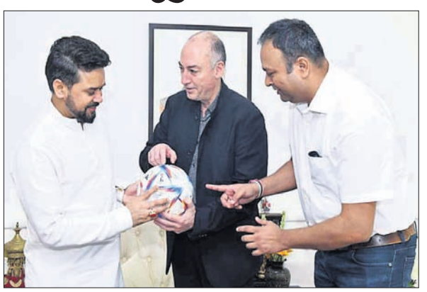
ଫିଫା ଅଧିକାରୀଙ୍କ ସହ ଅନୁରାଗ ଠାକୁର (ବାମ) ।