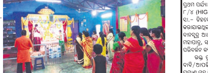
ମାଲକାନଗିରି, ୧୩୭୭ (ଡି.ଏନ.ଏ.)

ମାଲକାନଗିରି ସଦର ମହକୁମା ଶିରିଡ଼ି ସାଇ ମନ୍ଦିରରେ ରୁପବାର ଗୁରୁପର୍ଣ୍ଣିମା ପାଳିତ ହୋଇଯାଇଛି। ସକାଳୁ ସ୍ଵତନ୍ତ୍ର ରୀତିନୀତି ଅନୁଯାୟୀ ବାବାଙ୍କ ଆଜିକି ସହ କଳାକୃଷ୍ଣେକ, ଓ ଅନ୍ୟାନ୍ୟ ସ୍ଵତନ୍ତ୍ର ପୂଜାର୍ଚ୍ଚନା ହୋଇଥିଲା।