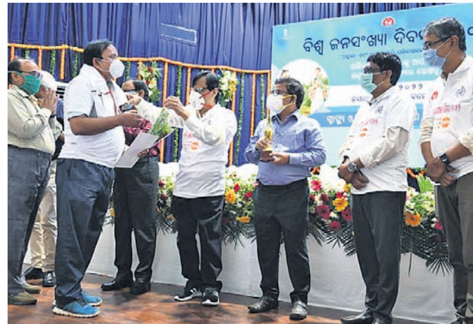
ଭୁବନେଶ୍ଵରରେ ଆୟୋଜିତ ରାଜ୍ୟସ୍ତରୀୟ ଉତ୍ସବରେ ମାଲକାନଗିରି ଜିଲ୍ଲା ଅଧିକାରୀଙ୍କୁ ପୁରସ୍କୃତ କରୁଛି।