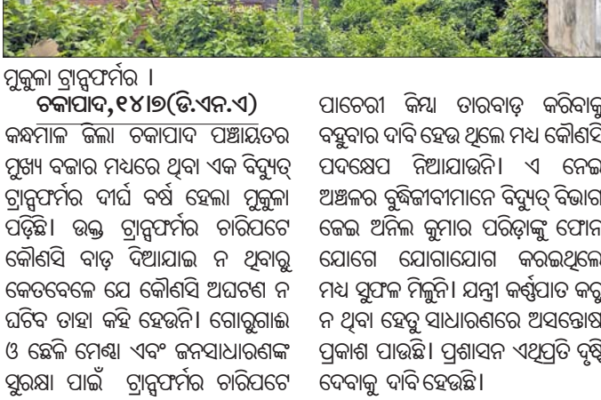
ମୁକୁଳା ଗ୍ରାହ୍ୟର୍ପଣ ।

କନ୍ଧାପାଦ, ୧୪୧୭(ଡି.ଏନ.ଏ.) ପାଚେରୀ କିମ୍ପା ତାରବାଡ଼ି କରିବାକୁ ବହୁବାର ଦାବି ହେଉ ଥିଲେ ମଧ୍ୟ କୌଣସି ମୁଖ୍ୟ ବଜାର ମଧ୍ୟରେ ଥିବା ଏକ ବିଦ୍ୟୁତ୍ ପ୍ରାନ୍ତର୍ପଣର ଦୀର୍ଘ ବର୍ଷ ହେଲା ପ୍ରକୃତା ପଡ଼ିଛି। ଉଚ୍ଚ ଗ୍ରାହ୍ୟର୍ପଣ ରାଜିପଟେ ଥିବା କୌଣସି ବାଡ଼ି ଦିଆଯାଇ ନ ଥିବାରୁ କେତେବେଳେ ଯେ କୌଣସି ଅପରାଧ ନ ଘଟିବ ତାହା କହି ହେଉନି। ଗୋରୁଗାଈ ଓ ଛେଳି ମେଣ୍ଟା ଏବଂ ଜନସାଧାରଣଙ୍କ ସୁରକ୍ଷା ପାଇଁ ଗ୍ରାହ୍ୟର୍ପଣ ରାଜିପଟେ