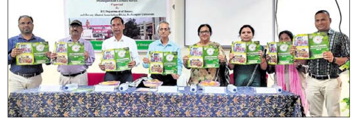
ଅତିଥି ବିଭାଗୀୟ ଅଧିକାରୀଙ୍କ ଦ୍ୱାରା ବାର୍ଷିକ ମୁଖପତ୍ର ଉନ୍ମୋଚନ କରାଯାଇଛି।