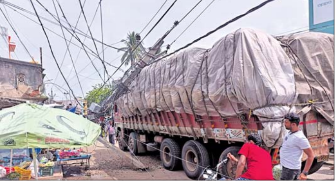
ବିଦ୍ୟୁତ୍ ଖୁଣ୍ଟରେ ଅଟକିଥିବା ଟ୍ରକ।

ବ୍ରହ୍ମପୁର ସହରରେ ବିପଦସଙ୍କୁଳ ବିଦ୍ୟୁତ୍ ଖୁଣ୍ଟ ପାଇଁ ଲୋକଙ୍କ ଚିନ୍ତନତା ବଢ଼ିଛି। ଯାହାକୁ ନେଇ ସହରବାସୀ ବିଦ୍ୟୁତ୍ ବିଭାଗ ନିକଟରେ ବାରମ୍ବାର ଅଭିଯୋଗ କରୁଥିଲେ ସୁଦ୍ଧା କୌଣସି ପଦକ୍ଷେପ ଗ୍ରହଣ କରାଯାଇ ନ ଥିବା ଅଭିଯୋଗ ହୋଇଛି। ଏଭଳି ଭାବେ ଗୁରୁବାର ସହରର ବାଲୁକେଶ୍ୱର ମନ୍ଦିର ନିକଟରେ ଏକ ବିଦ୍ୟୁତ୍ ଖୁଣ୍ଟ ବିପଦସଙ୍କୁଳ ଅବସ୍ଥାରେ ଥିବାବେଳେ ସମ୍ଭାବ୍ୟ ଦୁର୍ଘଟଣାରୁ ସ୍ଥାନୀୟ ବାସିନ୍ଦା ବଞ୍ଚି ଯାଇଛନ୍ତି। ଏହି ରାସ୍ତାଟି ଜାତୀୟ ରାଜପଥକୁ ସଂଯୋଗ କରୁଛି। ଏହି ରାସ୍ତାରେ ପ୍ରତିଦିନ ବହୁ ଭାରିଯାନ ଯାତାୟତ କରିଥାଏ। ଏହି ସ୍ଥାନରେ ପରିବା ବ୍ୟବସାୟୀ ମଧ୍ୟ ବେପାର କରିଥାନ୍ତି। ତେବେ ମୁଖ୍ୟ ଛକରେ ଦୀର୍ଘ ଦିନ ଧରି ଏକ ବିପଦସଙ୍କୁଳ ବିଦ୍ୟୁତ୍ ଖୁଣ୍ଟ ରହିଥିବାରୁ ଯାତାୟତରେ ସ୍ଥାନୀୟ ବାସିନ୍ଦା ଭୟଭୀତ ହେଉଥିଲେ। ଯାହାକୁ ନେଇ ଗୁରୁବାର ଏକ ଭାରିଯାନ