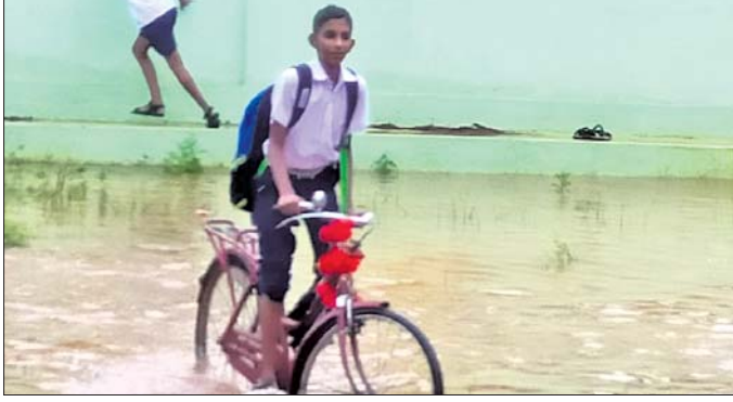
ଜଳାଶୁଷ୍କ ଶିକ୍ଷାନୁଷ୍ଠାନ ।