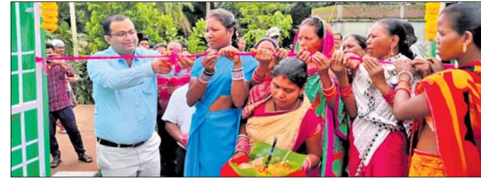
ସପ୍ତର ପ୍ରକ୍ରିୟାକରଣ କେନ୍ଦ୍ର ଉଦଘାଟନ କରୁଛନ୍ତି ଜିଲାପାଳ ।