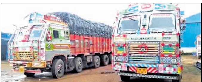
ଯୋଗାଣ ବିଭାଗ ପକ୍ଷରୁ ଜବତଯାଇଥିବା ଟ୍ରକ।

କେନ୍ଦୁଝର ଜିଲ୍ଲା କେଳିକୋଟ ପଞ୍ଚାୟତ ଜାତୀୟ ରାଜପଥ ୨୨୦ ନଂ ଚିକିରା ଗ୍ରାମ ଓ ପାଟଣା ବ୍ଲକ୍, ମଙ୍ଗଳପୁର ଗ୍ରାମ ନିକଟରେ ଗତ ଗୁରୁବାର ଜିଲ୍ଲା ଯୋଗାଣ ବିଭାଗର ଏକ ୭ ଜଣିଆ ଟିମ୍ ସେଆଇନ ଭାବେ ବୁଲି ଧାନ ବୋଝେଇ ଟ୍ରକକୁ ଅଟକାଇ ଜବତ କରି ପାଟଣା ବ୍ଲକ୍ ଗୁରୁଦାସିଣି ସ୍ଥିତ ବୈତରଣୀ ରାଜସ୍ୱ ମିଲରେ ରଖିଥିଲେ। ଘଟଣା ସମ୍ପର୍କରେ ଧାନ ବିକ୍ରି କରିଥିବା ଚାଷୀ ମାନେ ଜାଣିବା ପରେ ରାଜସ୍ୱ ମିଲ ସମ୍ପୃକ୍ଷରେ ପହଞ୍ଚି ଧାନ ବୋଝେଇ ଟ୍ରକକୁ କାର୍ଯ୍ୟକାରୀ ରଖିଛନ୍ତି ବୋଲି ହୋଇଥିଲା। ଏହି ଧାନ ଗୁଡ଼ିକୁ ପଶ୍ଚିମବଙ୍ଗର କେତେକ ବ୍ୟବସାୟୀ ଖୋଲା ବଜାରକୁ ବିକିଥିଲେ। ତେବେ