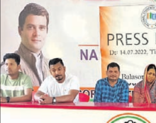
ଖବରଦାତା ସମ୍ମିଳନୀରେ ଜିଲ୍ଲା ଛାତ୍ର କଂଗ୍ରେସ କର୍ମକର୍ତ୍ତା।

ବାଲେଶ୍ୱର ସହର ଗୁରୁତ୍ୱପୂର୍ଣ୍ଣ ଜ୍ୟୋତି ସହିତାଳର ପ୍ରଥମବର୍ଷ ନିର୍ଦ୍ଦେଶ ଦାବି କରାଯାଇଛି। ଏହା ପ୍ରତିବାଦରେ ଗୁରୁତ୍ୱପୂର୍ଣ୍ଣ ନିର୍ଦ୍ଦେଶ ଦାବି କରିଛି। ଏନେଇ ଛାତ୍ର କଂଗ୍ରେସ ପକ୍ଷରୁ ଗୁରୁବାର ଏକ ଖବରଦାତା ସମ୍ମିଳନୀ ଆୟୋଜନ କରାଯାଇଥିଲା। ପୋଲିସ ଉଚ୍ଚ ମାମଲାକୁ ଗୁରୁତ୍ୱ ଦେଇ