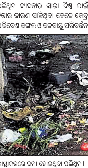
ରାସ୍ତାକଡ଼ରେ ଜମା ହୋଇଥିବା ପଲିଥିନ।

ମନ୍ତ୍ରାଳୟ ପକ୍ଷରୁ ଏକକ ପଲିଥିନ ବ୍ୟବହାର ଉପରେ ନିଷେଧାଦେଶ ଜାରି କରାଯାଇଛି। ଜୁଲାଇ ୧ ତାରିଖରୁ ଏହା ଉପରେ କଟକଣା ଲାଗୁ କରାଯାଇଥିଲେ ମଧ୍ୟ ଚମ୍ପୁଆ