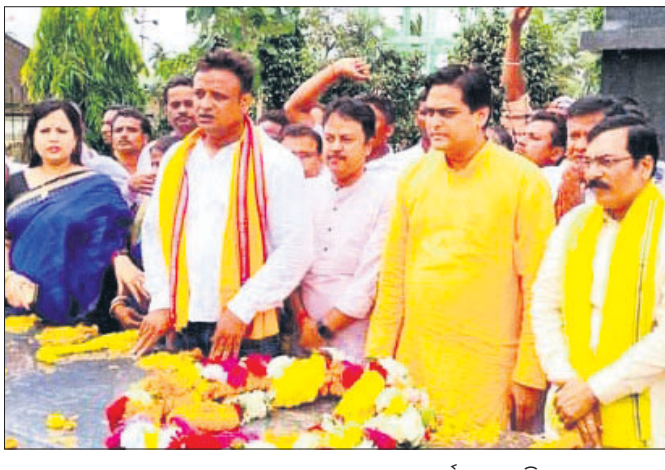
ଶହୀଦ ପୀଠରେ କେନ୍ଦ୍ରମନ୍ତ୍ରୀ ଶାନ୍ତ ଠାକୁର ଶ୍ରଦ୍ଧାପୂଜନ ଅର୍ପଣ କରୁଛନ୍ତି।