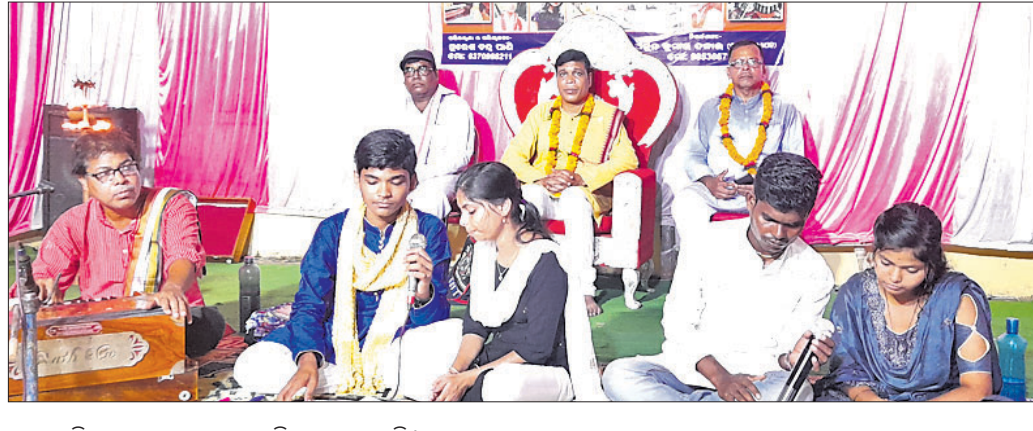
ମୁଖ୍ୟ ଅତିଥିଙ୍କ ସମ୍ମାନରେ ଭଜନ ପରିବେଷଣ ହେଉଛି।