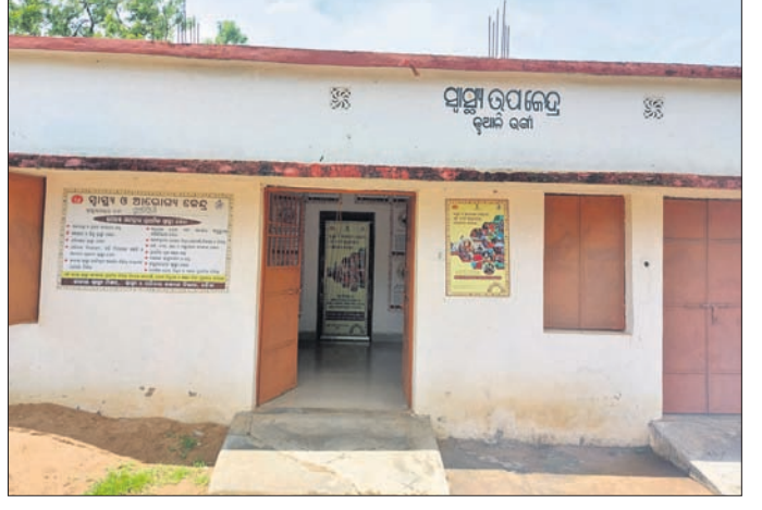
କୁଆଳିକୋଟା ସ୍ୱାସ୍ଥ୍ୟ ଓ ଆରୋଗ୍ୟ କେନ୍ଦ୍ର।

ମୟୂରଭଞ୍ଜ ଜିଲ୍ଲା ମୋରଡ଼ା ବ୍ଲକ୍ ଉପାଚ୍ଚ ଅଞ୍ଚଳ କୁଆଳିକୋଟା ସ୍ୱାସ୍ଥ୍ୟ ଓ ଆରୋଗ୍ୟ କେନ୍ଦ୍ରରେ ରୋଗୀସେବା ବିପର୍ଯ୍ୟୟ ହୋଇ ପଡ଼ିଛି। ଡାକ୍ତର ଓ ଫାର୍ମାସିଷ୍ଟ ନ ଥିବା ଯୋଗୁଁ ସ୍ୱାଧୀନର୍ଥକ ଭରସାରେ ଚାଲିଛି ଏହି ଉପ ସ୍ୱାସ୍ଥ୍ୟକେନ୍ଦ୍ର। ବ୍ଲକ୍ ମୁଖ୍ୟାଳୟ ତିତ୍ତଡ଼ା ଡାକ୍ତରଖାନାଠାରୁ ୧୩ କି.ମି. ଓ କିଶାନଚାଣ୍ଡି ଗୋଷ୍ଠୀ ସ୍ୱାସ୍ଥ୍ୟକେନ୍ଦ୍ରଠାରୁ ୨୦ କି.ମି. ଦୂରରେ ଥିବାରୁ ଉକ୍ତ ସ୍ୱାସ୍ଥ୍ୟ ଉପକେନ୍ଦ୍ର ଉପରେ କୁଆଳିକୋଟା, ତାହିସାହି, ଭୈରଙ୍ଗୀଶୋଳ, ପୂର୍ଣ୍ଣଚନ୍ଦ୍ରପୁର, ମାଲୁଦି ଆଦି ୫ଟି ଗାଁର ପ୍ରାୟ ପାଞ୍ଚ ହଜାରରୁ ଊର୍ଦ୍ଧ୍ୱ ଲୋକେ ଚିକିତ୍ସା ପାଇଁ ନିର୍ଭର କରିଥାନ୍ତି। ଉକ୍ତ ସ୍ୱାସ୍ଥ୍ୟକେନ୍ଦ୍ର ଦୁଇଜଣ ନିର୍ମାଣ ନେଇ