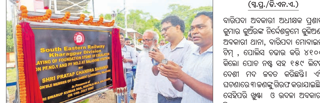
ରେଳ ଷ୍ଟେଶନରେ ଏକ୍ସାଲେଟର ନିର୍ମାଣ ପାଇଁ ଶିଳାନିଧାସ କରାଯାଇଛି।

ବାଲେଶ୍ୱର ରେଳଷ୍ଟେଶନରେ ଯାତ୍ରୀଙ୍କ ସୁବିଧା ଲାଗି ଦକ୍ଷିଣପୂର୍ବ ରେଳପଥ ଖଡ଼ଗପୁର ମଣ୍ଡଳ ୧ ଓ ୨ ନଂ. ପ୍ଲାଟଫର୍ମରେ ଦୁଇଟି ଲିଫ୍ଟ କାର୍ଯ୍ୟ ସମ୍ପାଦନ ପରେ ଏମ୍ପି ପ୍ରତିପଦ ଚନ୍ଦ୍ର ଷଡ଼ଙ୍ଗା ଗୁରୁବାର ଅପରାହ୍ଣରେ ଉଦ୍ଘାଟନ କରିଛନ୍ତି। ଏଥିସହିତ ଉଚ୍ଚ ଦୁଇ ପ୍ଲାଟଫର୍ମରେ ଦୁଇଟି ଏକ୍ସାଲେଟର ନିର୍ମାଣ ଲାଗି ଶିଳାନିଧାସ କରାଯାଇଛି। ନୂତନ ଷ୍ଟେଶନ ଗୃହ ନିର୍ମାଣ ପାଇଁ ଯେଉଁ ପରିବାରମାନଙ୍କୁ ବିକ୍ରେୟ ହେବାକୁ ପଡ଼ିବ ସେମାନଙ୍କ ପାଇଁ ସମସ୍ତ ପ୍ରକାର ସୁବିଧା ସୁଯୋଗ ସହିତ ରେମୁଣା ସହରାଞ୍ଚଳରେ ଜମି ଆବେଦନ କରାଯିବ।