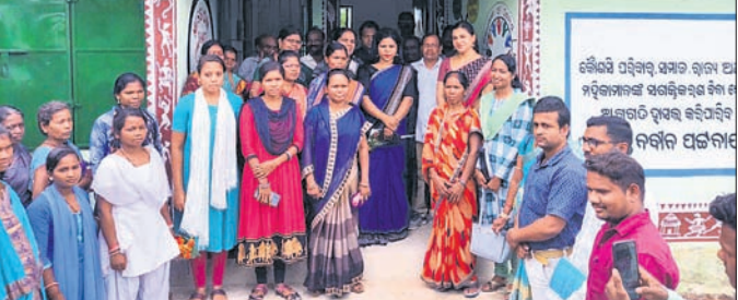
ଜିଲ୍ଲାପାଳ ମିଶନଶକ୍ତି ଗୃହଠାରେ ମହିଳାମାନଙ୍କ ସହ ଆଲୋଚନା କରୁଛନ୍ତି।