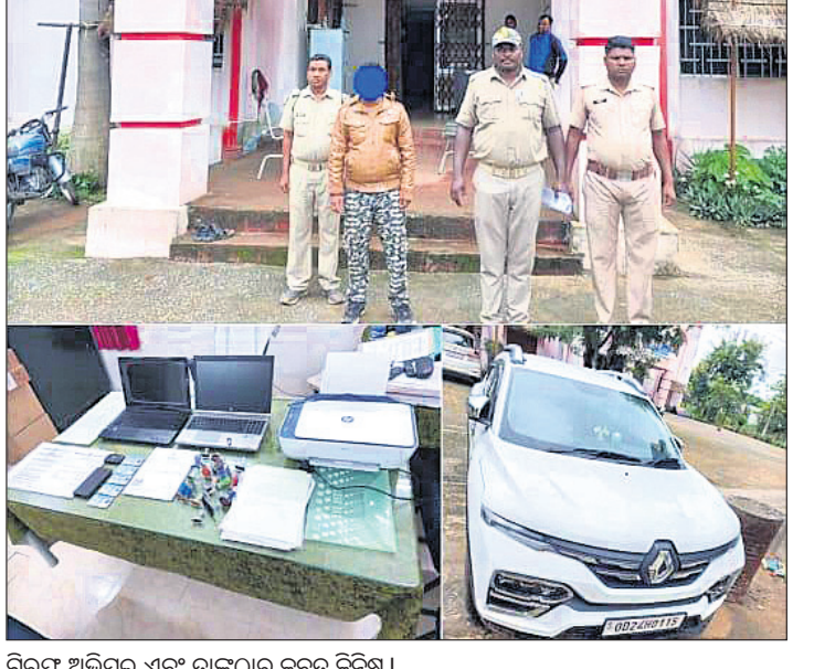
ଗିରଫ ଅଭିଯୁକ୍ତ ଏବଂ ତାଙ୍କଠାରୁ କବଚ ଜିନିଷ।