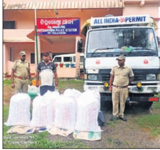
କୋରାପୁଟ, ୧୪୭ (ବି.ପ୍ର.)- ଗୁପ୍ତ ଚାନ୍ଦରରୁ ୬ କୁଇଣ୍ଟାଲ ଗଞ୍ଜେଇ ଜବତ କରାଯାଇଛି।