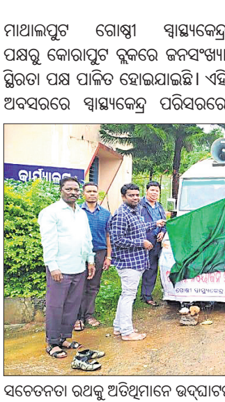
କୋରାପୁଟ ବ୍ଲକରେ ଜନସଂଖ୍ୟା ସ୍ଥିରତା ପକ୍ଷ ପ୍ରଚାର କରାଯାଇଛି।