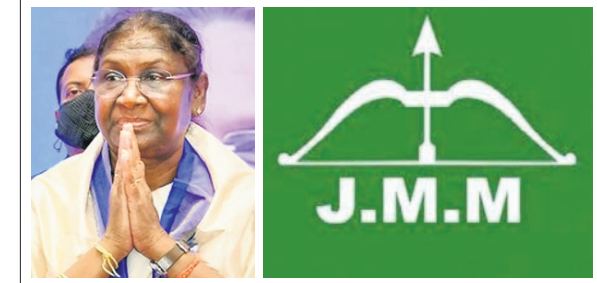
ରାଷ୍ଟ୍ର, ୧୪୭ ପୂର୍ବତନ ରାଜ୍ୟପାଳ ଶ୍ରୀମତୀ ପ୍ରାର୍ଥନା ହୋଇଛନ୍ତି ସ୍ୱାଧୀନତା ପରେ ପ୍ରଥମ ଥର ପାଇଁ ଆଦିବାସୀ ସମ୍ପ୍ରଦାୟର ଜଣେ ମହିଳାଙ୍କୁ ରାଷ୍ଟ୍ରପତି ପ୍ରାର୍ଥୀ କରାଯାଇଛି ।

ନୂଆଦିଲ୍ଲୀ, ୧୪୭ ରାଷ୍ଟ୍ରପତି ନିର୍ବାଚନରେ ଏନଡିଏ ପ୍ରାର୍ଥୀ ଶ୍ରୀମତୀ ପ୍ରାର୍ଥନା ପ୍ରତି କଂଗ୍ରେସ ନେତା ଭାରତୀୟ ଜନତା ପାର୍ଟି(ଭାଜପା) ଏକ ପ୍ରକାର ଆକ୍ରମଣ ରହିଛି ।