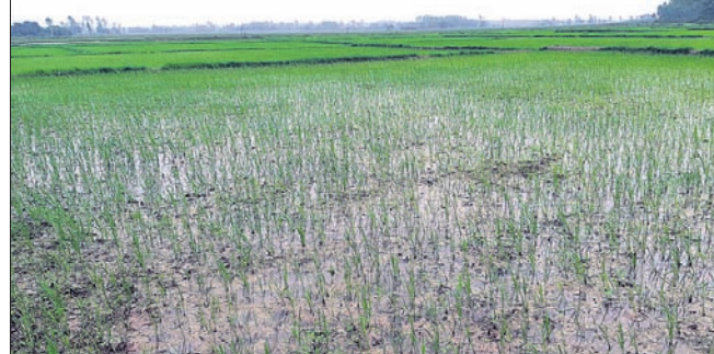
କୁରୁବା, ୧୪୭ (ବି.ପ୍ର.)