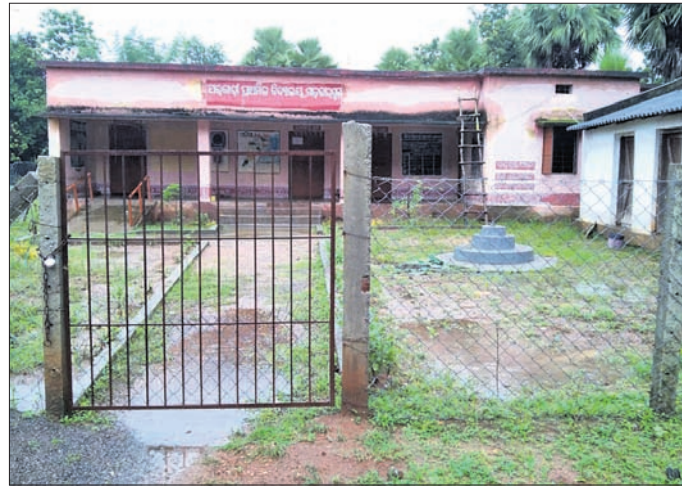
ରୁଧିରୀ ମାଟର୍କାଳଗୁଡ଼ା ବିଦ୍ୟାଳୟରେ ପଢ଼ିଥିବା ପିଲା।

ମାଲକାନଗିରି ଜିଲ୍ଲାରେ ଶିକ୍ଷାର ବିକଳ ଚିତ୍ର ଦେଖିବାକୁ ମିଳିଛି। କେଉଁ ବିଦ୍ୟାଳୟକୁ ପିଲା ଆସୁଛନ୍ତି ହେଲେ ଶିକ୍ଷକ ଦେଖା ମିଳୁନି, ଆଉ କେଉଁ ପିଲାମାନେ ବିଦ୍ୟାଳୟକୁ ଆସୁ ନ ଥିବା ବେଳେ ଶିକ୍ଷକ ବିଦ୍ୟାଳୟରେ ତାଲା ପକାଇ ରାଜିଯାଉଛନ୍ତି।