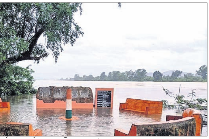
ବର୍ଷାରେ ଜଳାଶୁଧ ହୋଇ ପଡ଼ିଥିବା ଅଞ୍ଚଳ।

ମାଲକାନଗିରି ଜିଲ୍ଲାରେ ଲଗାଣ ବର୍ଷା ଭାରି ରହିଥିବାରୁ ଦିନକୁ ଦିନ ସ୍ଥିତି ବିଚିତ୍ରରେ ଲାଗିଛି। ଏଥିଯୋଗୁ ଜିଲ୍ଲାର ବିଭିନ୍ନ ନଦୀ ନାଳରେ ଜଳ ସ୍ତର ବୃଦ୍ଧି ପାଇଛି। ସିଲେଟୁ, ସାବେରୀ, ପୋଟେରୁ ଓ କାଲୁରୁକୋଣ୍ଡା ନଦୀରେ ଜଳସ୍ତର ବିପଦ ସଙ୍କେତ ଉପରେ ପ୍ରବାହିତ ହେଉଛି। ମୋରୁ ସାମାନ୍ତଃ ୦.୫ ମିଟର ଆନ୍ଧ୍ର ପ୍ରଦେଶର କାଲେଟୁ ଗାଁ ନିକଟରେ ୩୨୬ ନମ୍ବର କାଟାୟ ରାଜପଥ ଉପରେ ଗତ ୪ ଦିନ ଧରି ୫ ଫୁଟ ଉଚ୍ଚତାରେ ବନ୍ୟାଜଳ ପ୍ରବାହିତ ହେଉଛି। ଫଳରେ ମାଲକାନଗିରି ଜିଲ୍ଲାର ମୋରୁ ଓ ଆନ୍ଧ୍ର ପ୍ରଦେଶର ଚିତ୍ତୁର ମଧ୍ୟରେ ଯୋଗାଯୋଗ ବିଚ୍ଛିନ୍ନ ରହିଛି। ମୋରୁ ସାମାନ୍ତରେ ଗତ ୪ ଦିନ ହେଲା ଶତାଧିକ ଯାନବାହାନ ଅଟକି ରହିଛି। ଗୋଦାବରୀ ନଦୀରେ ତୃତୀୟ ବିପଦ ସଙ୍କେତ ୫୩ ଫୁଟ ରହିଥିବା ବେଳେ ବରମାନ ସେଠାରେ