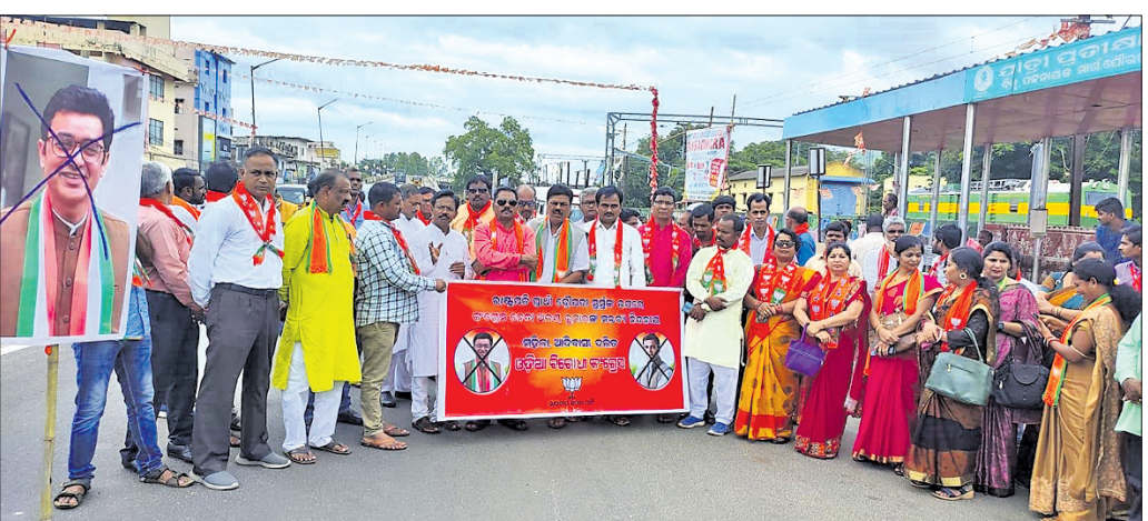
ରାୟଗଡ଼ା ଅଫିସ, ୧୪।୭