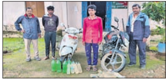
ରାୟଗଡ଼ା ଅଧିକାରିକ, ୧୪୭୭(ଡି.ଏନ୍.ଏ.)

ନିର୍ମାଣର ମାସେ ନ ପୁରୁଣୁ ପିନ୍ଧୁ ଉଠି ଦବିଗଲା ରାସ୍ତା