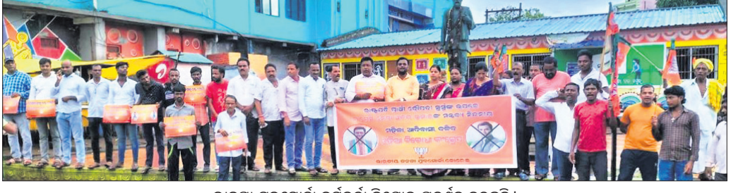
ଭାଜପା ଯୁବମୋର୍ଚ୍ଚା କର୍ମକର୍ତ୍ତା ବିକ୍ଷୋଭ ପ୍ରଦର୍ଶନ କରୁଛନ୍ତି।