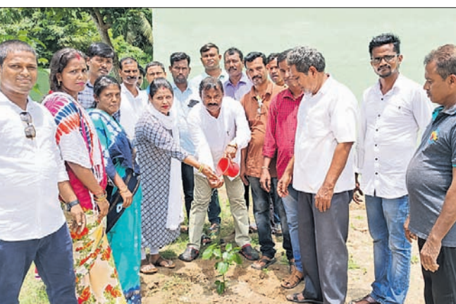
ବିଶ୍ୱନାଥପୁରସ୍ଥିତ ବିଦ୍ୟାଳୟରେ ବିଜେଡି ପକ୍ଷରୁ ଚାରାରୋପଣ କରାଯାଇଛି ।