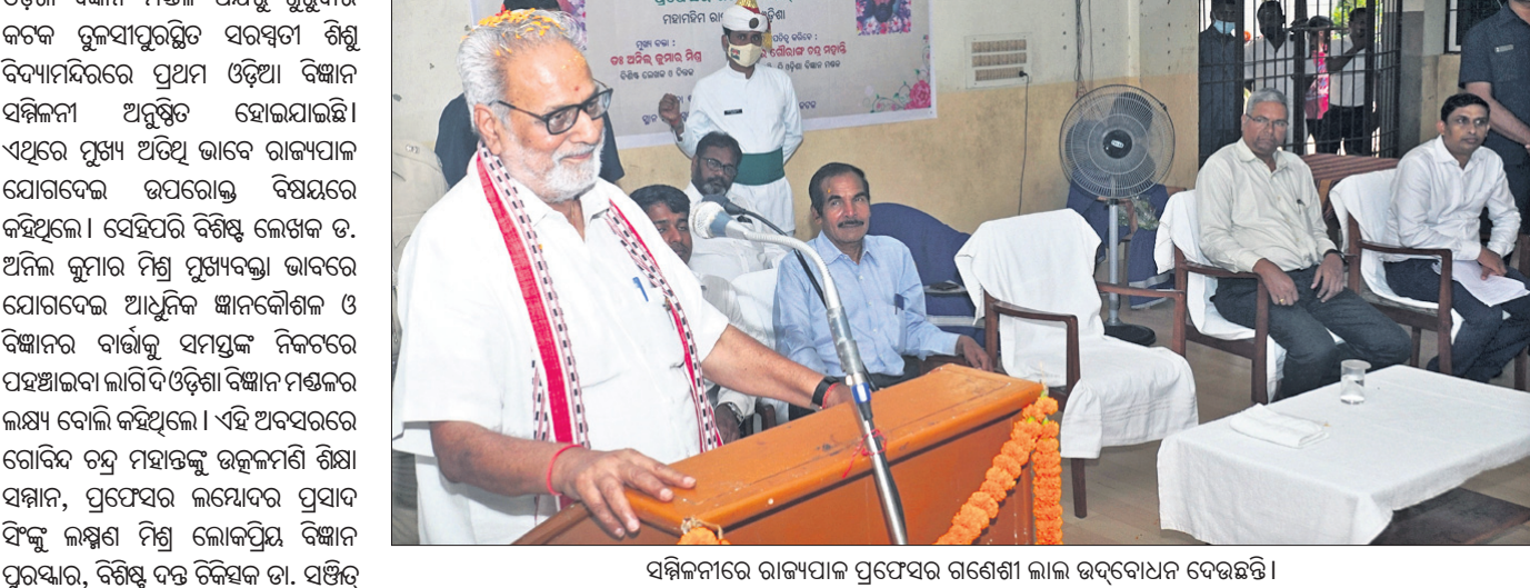
ସମ୍ମିଳନୀରେ ରାଜ୍ୟପାଳ ପ୍ରଫେସର ଗଣେଶ ଲାଲ ଉଦ୍‌ବୋଧନ ଦେଉଛନ୍ତି।