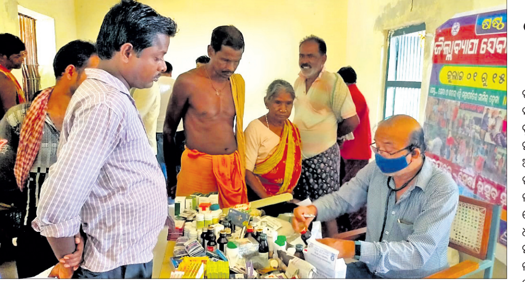
ବାମଗ୍ରାମରେ ଆୟୋଜିତ ସ୍ୱାସ୍ଥ୍ୟ ସେବା ଶିବିର ।

ଦଶପଲ୍ଲୀ, ୧୫୫୭ (ଡି.ଏନ.ଏ.): ନୟାଗଡ଼ ଜିଲ୍ଲା ଦଶପଲ୍ଲୀ ବ୍ଲକର ଆଦିବାସୀ ବହୁଳ ବାମ ଗ୍ରାମରେ ରୁଧିରା ସେବା ଉତ୍ସବ ଅନୁଷ୍ଠିତ ହୋଇଯାଇଛି । ନୟାଗଡ଼ ଜିଲ୍ଲା ସେବା ଉତ୍ସବ ସମିତି ପକ୍ଷରୁ ଗତ ୧ ତାରିଖରୁ ଆରମ୍ଭ ହୋଇଥିବା ସେବା ଉତ୍ସବରେ ଚକ୍ରପାନ, ଖାଦ୍ୟ ବନ୍ଧନ, ଓ ଅସହାୟଙ୍କୁ ଆର୍ଥିକ ସହାୟତା ପ୍ରଦାନ ଆଦି କାର୍ଯ୍ୟକ୍ରମ ଅନୁଷ୍ଠିତ ହେଉଥିବା ବେଳେ ବାମ ଗ୍ରାମରେ ମାଗଣା ସ୍ୱାସ୍ଥ୍ୟସେବା ଶିବିର ଅନୁଷ୍ଠିତ ହୋଇଥିଲା । ନୟାଗଡ଼