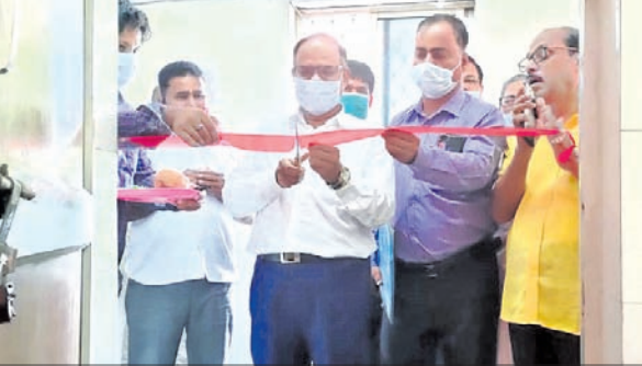
ଜନ୍ମମୃତ୍ୟୁ ପଞ୍ଜୀକରଣ ସେବାକୁ ସିଦ୍ଧିପୂର୍ଣ୍ଣ ଉଦ୍ଘାଟନ କରୁଛନ୍ତି ।

ନୟାଗଡ଼ ଜିଲ୍ଲା ପୁଞ୍ଜୀ ଚିକିତ୍ସାଳୟ (ଡିଏସ୍‌ଏଚ୍)ରେ ଗୁରୁବାର ଜନ୍ମମୃତ୍ୟୁ ପଞ୍ଜୀକରଣ ସେବା ଆରମ୍ଭ ହୋଇଛି । ଏହାକୁ ସିଦ୍ଧିପୂର୍ଣ୍ଣ ମନୋଭାବେ ଉଦ୍ଘାଟନ କରିଛନ୍ତି । ଜିଲ୍ଲା ଚିକିତ୍ସାଧିକାରୀ (ସାଧାରଣ ସେବା) ତଥା