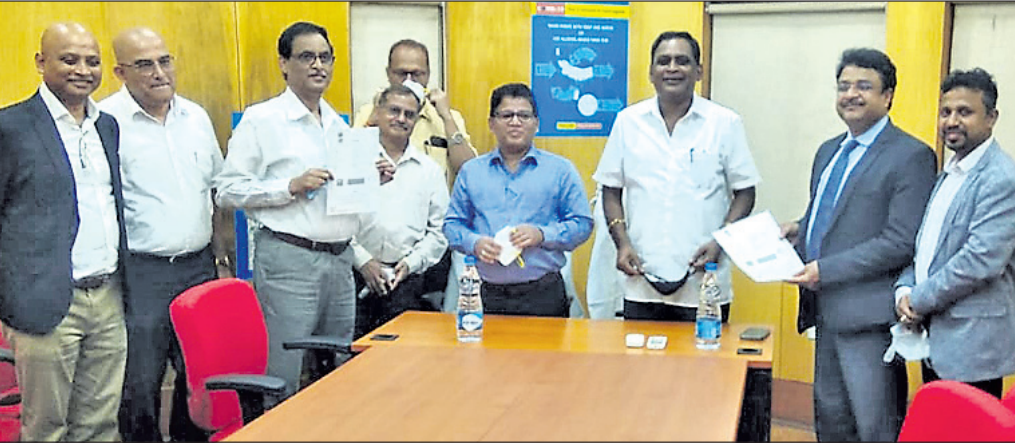
ବୁଝାମଣାପତ୍ର ସ୍ୱାକ୍ଷର ବେଳେ ଉପସ୍ଥିତ ସାମ୍ବାନମନ୍ତ୍ରୀ ନବକିଶୋର ଦାସ ଓ ଅନ୍ୟ କାର୍ଯ୍ୟକର୍ତ୍ତା।

ଆସ୍ତର ସିଏମ୍‌ଆଇ ହସ୍ପିଟାଲ ଓ ରାଜ୍ୟ ସରକାରଙ୍କ ମଧ୍ୟରେ ଏକ ବୁଝାମଣାପତ୍ର