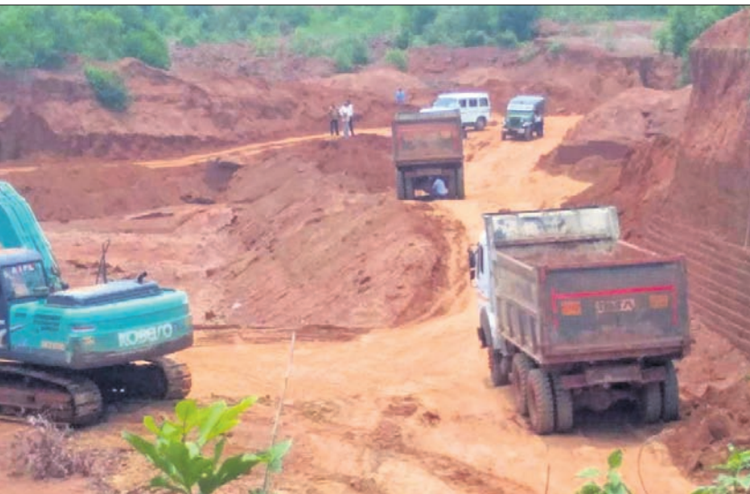
ଖନନ ଫଳରେ କାଳୁ ଜଙ୍ଗଲ ପତା ହୋଇଛି ।