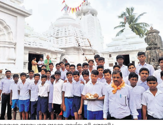
ଛାତ୍ରମାନେ ନୀଳମାଧବଙ୍କ ପୀଠରେ ପୂଜାର୍ଚ୍ଚନା କରି ଚେଷ୍ଟା କରୁଛନ୍ତି ।

ଖଞ୍ଜପଡ଼ା, ୧୫୫୭ (ସ.ପ୍ର.) ଖଞ୍ଜପଡ଼ା ବ୍ଲକ ଅଧୀନ କଣ୍ଠିଲୋ ନୀଳମାଧବ ବିଦ୍ୟାପୀଠର ୭୨ତମ ପ୍ରତିଷ୍ଠା ଦିବସ ଅନୁଷ୍ଠିତ ହୋଇଯାଇଛି । ବିଦ୍ୟାଳୟର ଛାତ୍ରମାନେ ବର୍ଷା ସମୟ ପୂର୍ବରୁ ଯୁକ୍ତମାନଙ୍କୁ ଆସି ଶିକ୍ଷୟିତ୍ରୀ, ଶିକ୍ଷକମାନଙ୍କ ସହ ଗ୍ରାମ ପରିକ୍ରମା କରିବା ସହିତ ଶ୍ରୀ ନୀଳମାଧବଙ୍କ ମନ୍ଦିରକୁ ଯାଇ ପୂଜାର୍ଚ୍ଚନା କରିଥିଲେ ।