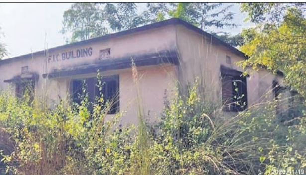
ଅବହେଳିତ ଅବସ୍ଥାରେ ରହିଥିବା ଗୋଦାମ ।

ପିଲାମାନଙ୍କ ସମ୍ପର୍କରେ ଆସିପାଲୁ ନ ଥିବାରୁ ଛାତ୍ରାଛାତ୍ରୀମାନେ ଧନାତ୍ମକ ବିଭାଗରେ ଅଧ୍ୟୟନ କରିବାକୁ ଆଗ୍ରହୀ ଥିବା ସତ୍ତ୍ୱେ ପ୍ରଥମ (ପ୍ରାଥମିକ) ଚୟନରେ କଳା, ବିଜ୍ଞାନ କିମ୍ବା ବାଣିଜ୍ୟ ବିଭାଗରେ ନାମ ଲେଖାଇବାକୁ ସୂଚିତ କରୁଥିବା ବେଳେ ୨ୟ (ପ୍ରାଥମିକ) ଚୟନରେ ଧନାତ୍ମକ ବିଭାଗ ପାଇଁ ସୂଚନା ଦେଉଛନ୍ତି । ଫଳରେ ପ୍ରଥମ ଚୟନରେ ପିଲାମାନେ କଳା ବିଭାଗ ହେଉ କି ବିଜ୍ଞାନ କିମ୍ବା ବାଣିଜ୍ୟ ବିଭାଗରେ ସିଲେକ୍ସନ ହୋଇଯାଉଛନ୍ତି । ଫଳରେ ଧନାତ୍ମକ ସିଟ ଖାଲି ପଡ଼ିଯାଇଛି । ତେଣୁ ଏ ଦିଗରେ ମହାବିଦ୍ୟାଳୟ ପକ୍ଷରୁ ଜନସଚେତନତା ସୃଷ୍ଟି କରିବାର ଆବଶ୍ୟକତା ରହିଛି ।