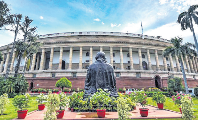
କୋଣସି ଶବ୍ଦ ଉପରେ କଟକଣା କରି କରାଯାଇ ନାହିଁ। ସଦସ୍ୟମାନେ ଗୃହନ ମର୍ଯ୍ୟାଦା ପ୍ରତି ଧ୍ୟାନଦେବା ଉଚିତ।