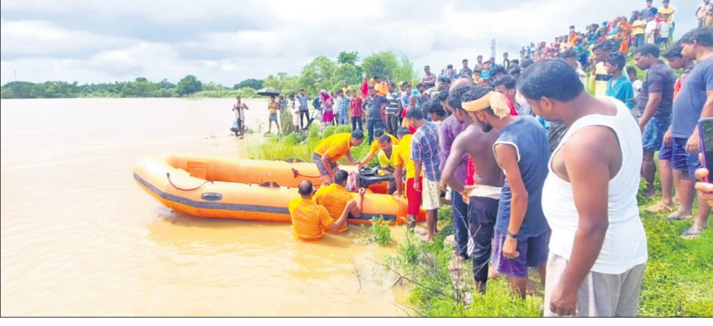
ଅଗ୍ନିଶମ ବାହିନୀ ନିଖୋଜ ଯୁବକଙ୍କୁ ଖୋଜାଖୋଜି କରୁଛନ୍ତି।

ବିଞ୍ଚାରପୁର, ୧୪୫୭(ଡି.ଏନ୍.ଏ.): ବିଞ୍ଚାରପୁର ଥାନା ଅନ୍ତର୍ଗତ ବାଙ୍କିପାଳ ନିକଟସ୍ଥ ଖାରସ୍ରୋତା ନଦୀକୁ ଗାଧୋଇବାକୁ ଯାଇ ଜଣେ ଯୁବକ ନିଖୋଜ ହୋଇ ଯାଇଛନ୍ତି। ଖବର ମିଳିବା ପରେ ବିଞ୍ଚାରପୁର ଓ ଯାଜପୁର ଅଗ୍ନିଶମ ବାହିନୀ କର୍ମଚାରୀ ପହଞ୍ଚି ସହାୟତା ପ୍ରଦାନ କରିବା ପାଇଁ ଯତ୍ନ ଗ୍ରହଣ କରିଛନ୍ତି। ହେଲେ ସମ୍ପୂର୍ଣ୍ଣ ଯୁବକଙ୍କ ପତ୍ନୀ ମିଳି ପାରିନାହିଁ।