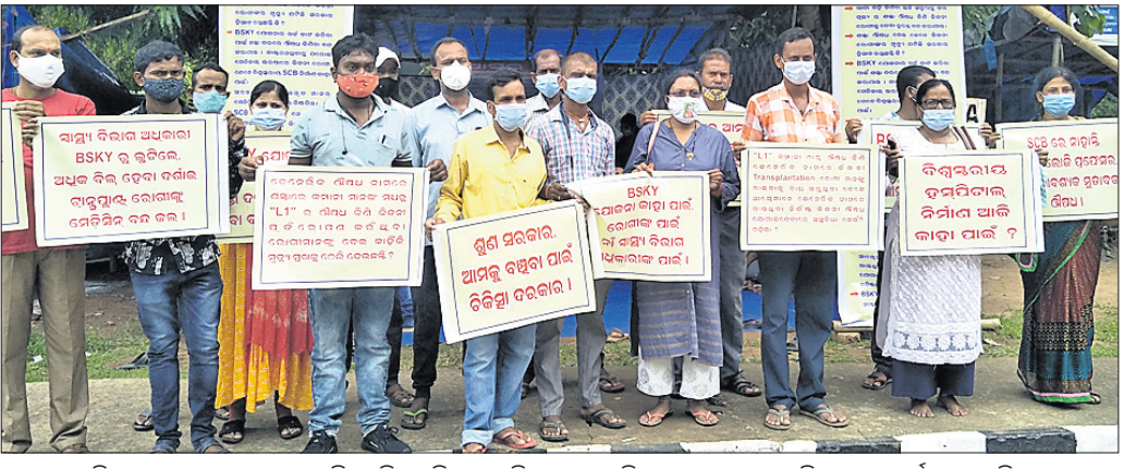
ବିଧାନସଭା ସମ୍ମୁଖ ଲୋକ୍ଷର ପିଏମ୍‌ଜିରେ କିର୍ତ୍ତୀ ପ୍ରତିରୋଧଣ କରିଥିବା ରୋଗୀମାନେ ବିକ୍ଷୋଭ ପ୍ରଦର୍ଶନ କରୁଛନ୍ତି।