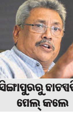
ସିଙ୍ଗାପୁରରୁ ଗାଟସ୍‌ଡିକୁ ଫେଲ୍ କଲେ

ଲକ୍ଷ୍ନୌ, ୧୪୧୭: ଦୁଇ ଦିନ ତଳେ ଉତ୍ତରପ୍ରଦେଶର ଲକ୍ଷ୍ନୌରେ ନୁଆ କରି ଖୋଲିଥିବା ଲୁଲୁ ମଲ୍‌ରେ ନମାଜପଠାକୁ ନେଇ ବିବାଦ ଦେଖାଦେଇଛି।