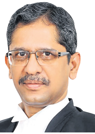
ସିଜେଆଇ ଏନ୍.ଭି. ରମନ