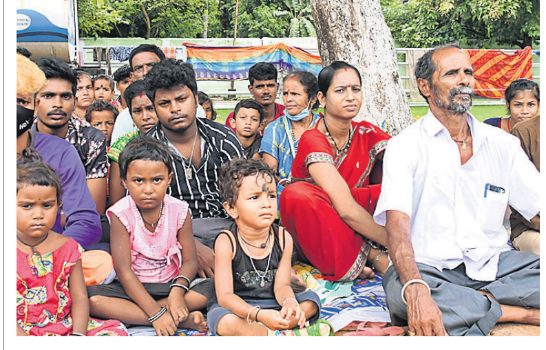
କ୍ରାଇମ୍‌ପ୍ରାଣ୍ଟ୍‌ସ୍‌ ବାହା ମିଥ୍ୟା ହତ୍ୟା ମାମଲାରେ ଫସିଥିବା ବ୍ରହ୍ମପୁର ପାଣିଗ୍ରାହୀ ପେଣ୍ଡ ପିଟିପିଟିଆ ନଗରର ୫ ପରିବାର କେଏ ଲଢ଼ିବା ପାଇଁ ଘର ଓ କମି ବିକି ଚଳିତକାଳ ହେବା ପରେ ନ୍ୟାୟ ପାଇଁ ଭୁବନେଶ୍ୱର ଲୋୟର ପିଏମ୍‌ସିରେ ପିଲାଛୁଆ ଧରି ଧାରଣା ଦେଇଛନ୍ତି।

ବୈଠକରେ ବିଭାଗର ସ୍ୱଳ୍ପ ନିର୍ଦ୍ଦେଶକ (ବିହନ), ସ୍ୱଳ୍ପ ନିର୍ଦ୍ଦେଶକ (ସାର), ସ୍ୱଳ୍ପ ନିର୍ଦ୍ଦେଶକ (ପଲ୍ଲସେସ)ଙ୍କ ସମେତ ବିଭାଗୀୟ ବରିଷ୍ଠ ଅଧିକାରୀ ଉପସ୍ଥିତ ଥିବାବେଳେ ଭିଡିଓ କନ୍ଫରେନ୍ସ ମାଧ୍ୟମରେ ସମସ୍ତ ଜିଲ୍ଲାର ମୁଖ୍ୟ ଜିଲ୍ଲା କୃଷି ଅଧିକାରୀ, ବ୍ଲକ୍ କୃଷି ଅଧିକାରୀ, ସହକାରୀ କୃଷି ଅଧିକାରୀ, ଏଗ୍ରିକଲଚର ଡିଭିଜନ୍ ଅଫିସର, ଆସିଷ୍ଟାଣ୍ଟ ସିଡି ପ୍ରଡକ୍ଟ୍ସ ଅଫିସର ଆଦିଙ୍କ ସମ୍ପର୍କରେ କୃଷି କାର୍ଯ୍ୟ ନେଇ ସଚିବଙ୍କୁ ତଥ୍ୟ ଉପସ୍ଥାପନ କରିଥିଲେ।