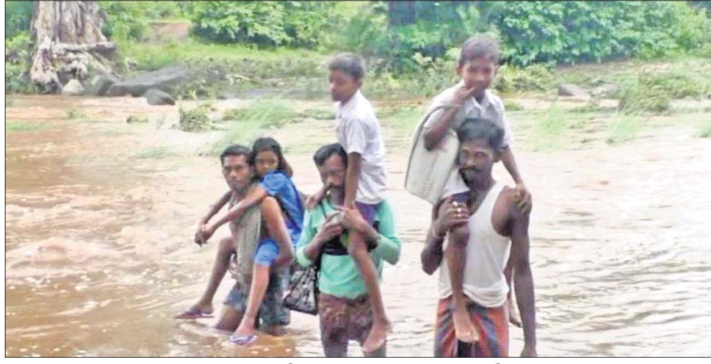
ଛାତ୍ରୀଛାତ୍ରଙ୍କୁ ପରିବାର ଲୋକେ କାନ୍ଧେଇ ଘରକୁ ନେଉଛନ୍ତି।

ବୌଦ୍ଧ ଜିଲ୍ଲା ହରଭଙ୍ଗା ବ୍ଲକ୍ ବାଣୀଭୂଷଣପୁର ଗ୍ରାମପଞ୍ଚାୟତ ତିରିସିରା ଗ୍ରାମର ୧୪ ଛାତ୍ରୀଛାତ୍ର ଗୁରୁବାର ସ୍କୁଲକୁ ଯାଇ ଘରକୁ ଫେରିପାରି ନ ଥିଲେ। ଅପରାହ୍ନରେ ସ୍କୁଲରୁ ଘରକୁ ଫେରୁଥିବାବେଳେ ଲକ୍ଷ୍ମୀନାଳରେ ଉଜ୍ଜ୍ୱଳା ପାଣି ପ୍ରବାହିତ ହେଉଥିବାରୁ ନାକ ପାରିହୋଇ ନ ପାରି ଅଟକି ଯାଇଥିଲେ। ତେଣୁ ନାକ ପାର୍ଶ୍ୱରେ ଜାତୀୟ ରାଜପଥ କଡ଼ରେ ଥିବା ଏକ ଗ୍ୟାରେଜରେ ରାତିରେ ରହିବାକୁ ବାଧ୍ୟ ହୋଇଥିଲେ। ଶୁକ୍ରବାର ସକାଳୁ ନାକରେ ପାଣି କମିବା ପରେ ସେମାନଙ୍କ ସମ୍ପର୍କୀୟ ଗ୍ୟାରେଜକୁ ଆସି ଛାତ୍ରୀଛାତ୍ରଙ୍କୁ କାନ୍ଧରେ ବୋହି ନାକ ପାରକରି ଘରକୁ ନେଇଥିଲେ। ହରଭଙ୍ଗା ବ୍ଲକ୍ ହେତୁକାର୍ତ୍ତବ୍ୟ ପଞ୍ଚାୟତ ବାଣୀଭୂଷଣପୁର ହୋଇଥିଲେ ବି ଉକ୍ତ ପଞ୍ଚାୟତର କେତେକ ଗ୍ରାମକୁ ଏବେବି ଠିକ୍ ଭାବେ ରାସ୍ତା ନାହିଁ। ସେଥିମଧ୍ୟରେ ତିରିସିରା ଅନ୍ୟତମ। ଗ୍ରାମରେ ପଞ୍ଚାୟତ ୧୦୦ରୁ ଅଧିକ ଗରିବ ପରିବାର ବସବାସ କରନ୍ତି। ଗ୍ରାମଟି ଖୋର୍ଦ୍ଧା-ବଲାଙ୍ଗୀର ଜାତୀୟ ରାଜପଥ କଡ଼ରେ ଥିଲେ ମଧ୍ୟ ଗାଁକୁ ଯିବାକୁ ହେଲେ ଲକ୍ଷ୍ମୀନାଳ ପାରହେବାକୁ ପଡ଼ିଥାଏ। ଗ୍ରାମବାସୀ ନାକ ପାରି ହେବା ପରେ ହିଁ