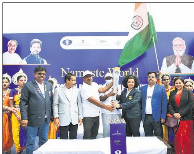
ପୁରୀଠାରେ ଚେଷ୍ ଅଲିମ୍ପିଆଡ୍ ମାଗଲକୁ ସ୍ୱାଗତ କରାଯାଇଛି ।