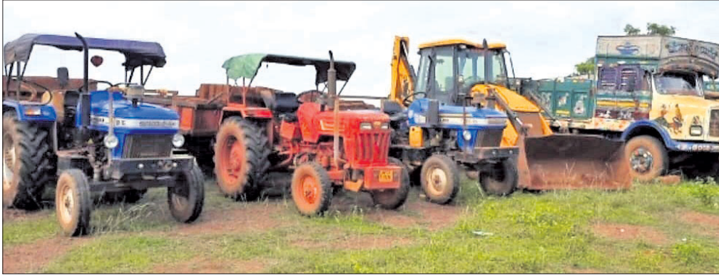
ଜବତ ହୋଇଥିବା ଟ୍ରକ୍, ଟ୍ରାକ୍ଟର ଓ ପାଞ୍ଚାଉଟିଲର।

ଖୋର୍ଦ୍ଧା ଜିଲ୍ଲାରେ ଲଘୁ ଖଣିକ ସମ୍ପଦ ଚୋରାଚାଳଣା ବଢ଼ିଚାଲିଛି। ପ୍ରତ୍ୟକ୍ଷ ଶରଧାପୁର ଖଣିରୁ ଅନୁମତିରେ ଗାଳିଛି ଶରଧାପୁର ଜୁଣିର ଯୁକ୍ତି। ଚୋରା ଚାଳାଣୀକୁ ରୋକିବା ଲାଗି ଜାତୀୟ ଗ୍ରାମ ଟ୍ରିଭ୍ୟୁନାଲର ଛାଡ଼ ପରେ ଜିଲ୍ଲା ପ୍ରଶାସନ ପକ୍ଷରୁ ଚଢ଼ାଇ ପ୍ରକାଶ ପାଇଛି। ଏନେଇ ଜିଲ୍ଲା ପ୍ରଶାସନ ପକ୍ଷରୁ ରାଜସ୍ୱ, ଜଙ୍ଗଲ ଓ ପୋଲିସ୍ ପ୍ରଶାସନକୁ ନେଇ ସ୍ୱତନ୍ତ୍ର ଚିଠି ଗଠନ କରାଯାଇଛି। ଏହି ଚିଠି ବିଭିନ୍ନ ପଥର ଖଣିରେ ଚଢ଼ାଇ ଜାରି ରଖିଛି। ଶୁକ୍ରବାର ଖୋର୍ଦ୍ଧା ତହସିଲ ଅନ୍ତର୍ଗତ ଶରଧାପୁର ଚରଡ଼ୁଆସ୍ଥିତ କାଳୁ ଜଙ୍ଗଲରେ ବେଆଇନ ଭାବେ ଚାଲିଥିବା ଖଣିରେ ଚଢ଼ାଇ କରାଯାଇଥିଲା। ଘଟଣାସ୍ଥଳକୁ ୨ଟି କେସିବି ମେଶିନ, ୫ ଟ୍ରାକ୍ଟର, ଗୋଟିଏ ମିନିଟ୍ରକ୍, ୨ଟି ପାଞ୍ଚାଉଟିଲର ଜବତ ହୋଇଛି। ଏହି ଘଟଣାରେ ୩ଜଣଙ୍କୁ ଅଟକ ରଖାଯାଇଛି। ଚୋରାଚାଳଣା ଆଇ. ଗୌରବ ଶିବାଜୀଙ୍କ ନେତୃତ୍ୱରେ ତହସିଲଦାର ଇସ୍ମିତ୍ ସାହୁଙ୍କ ସମେତ ରାଜସ୍ୱ ଓ ପୋଲିସ୍ ଚିଠି ସାମିଲ ଥିଲେ। ଅନ୍ୟପକ୍ଷରେ ପ୍ରଶାସନ ପକ୍ଷରୁ