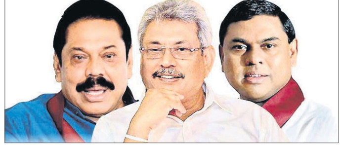
ମହିୟା ରାଜପାଟ୍ଟେ, ଗୋଟାବାୟା ରାଜପାଟ୍ଟେ, ବାସିଲ ରାଜପାଟ୍ଟେ