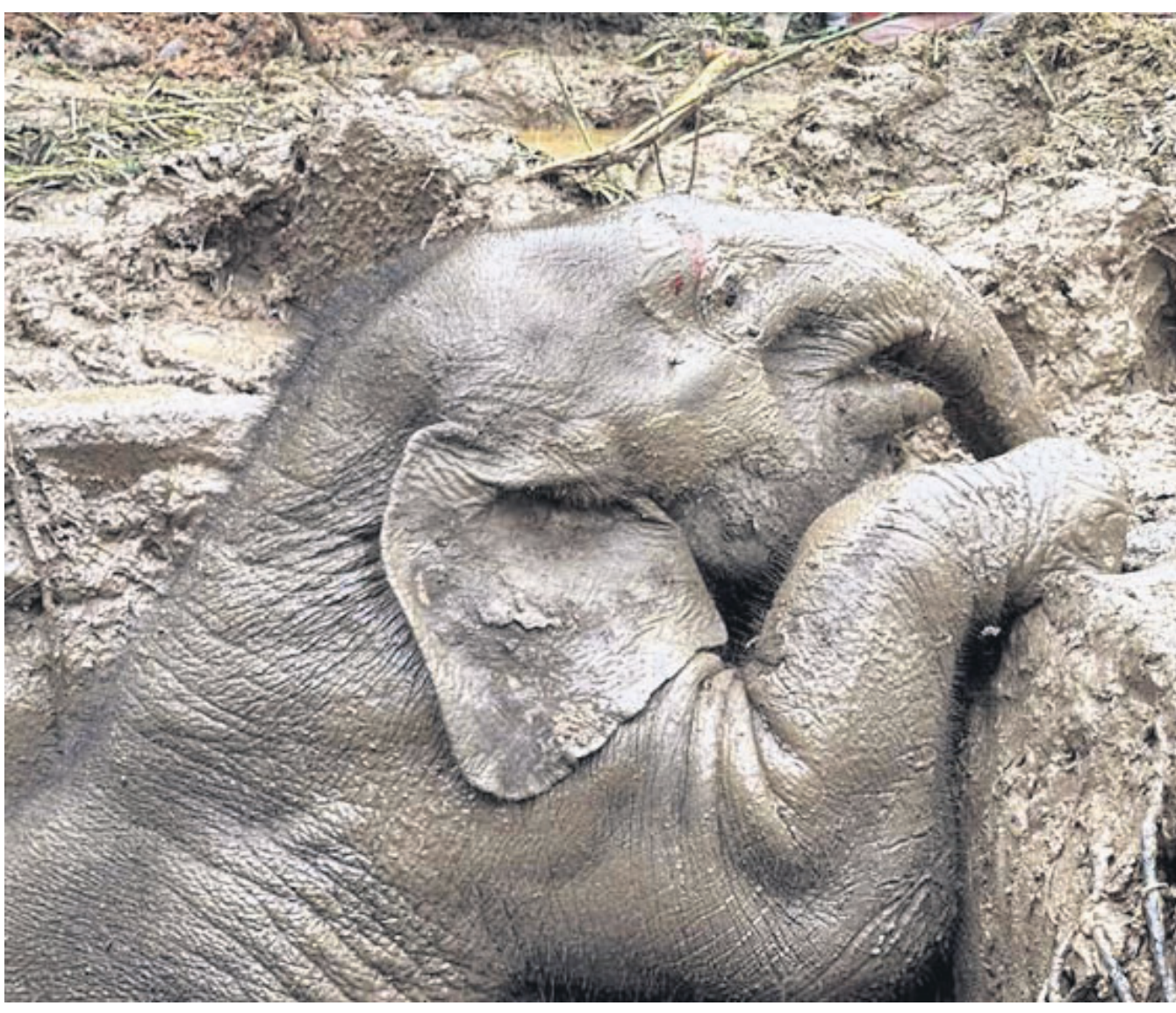
ଆଇଲାଣ୍ଡର ନାଶୋନ ନାୟୋକ ପ୍ରଦେଶରୁ ଖାଦ୍ୟ ଯାଇ ଜାତୀୟ ଉଦ୍ୟାନର ଏକ ଖାଲରେ ଖସିପଡ଼ିଥିବା ହାତୀ ଶାବକ ଉଠିବା ପାଇଁ ଉଦ୍ୟମ କରୁଛି।