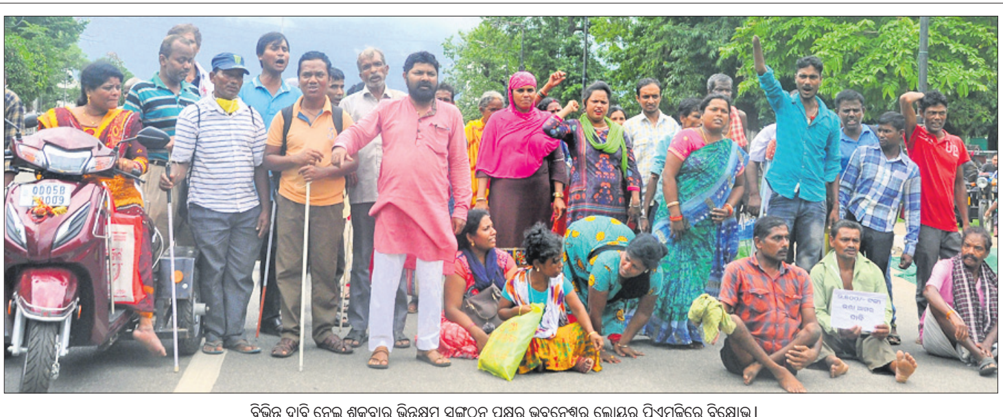
ବିଭିନ୍ନ ଦାବି ନେଇ ଶୁକ୍ରବାର ଭିନେକ୍ସନ ସଙ୍ଗଠନ ପକ୍ଷରୁ ଭୁବନେଶ୍ୱର ଲୋକସଭା ପିଏମ୍‌ଜିରେ ବିରୋଧ।