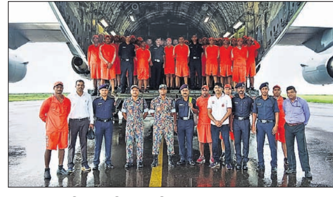
ଗୁଜରାଟ ଗସ୍ତ କରିଥିବା ଏନ୍‌ଡିଆରଏଫ୍ ଦଳ।

ଗୁଜରାଟରେ ଭୟଙ୍କର ବନ୍ୟା ପରିସ୍ଥିତି ରହିଛି। ଏଭଳି ସମୟରେ ସେଠାକାର କ୍ଷତିଗ୍ରସ୍ତ ଲୋକଙ୍କୁ ସୁରକ୍ଷା ଦେବା ଓ ଉଦ୍ଧାର କରିବା ବିମାନ ବନ୍ଦରକୁ ଯାଇ ସେଠାରୁ ପାଇଁ ଓଡ଼ିଶାର ଏନ୍‌ଡିଆରଏଫ୍ ଏକ ସ୍ୱତନ୍ତ୍ର ବିମାନରେ ଗୁଜରାଟର ଦଳ ଗୁଜରାଟ ଯାଇଛି। ଶୁକ୍ରବାର ପୁରୁଣ ଅଭିଯୁକ୍ତ ଗ୍ରହଣ କରିଛି।