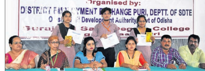
କାର୍ଯ୍ୟକ୍ରମରେ ଅତିଥି ଓ ଅନ୍ୟମାନେ ।