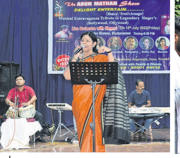
ଡିଲାଇଡ୍ ଏଣ୍ଟରଟେନ୍‌ମେଣ୍ଟ୍‌ ପକ୍ଷରୁ ବଲିଭିଡ୍‌ ଓ ଓଲିଭିଡ୍‌ର ଲୋକପ୍ରିୟ ଗୀତକୁ ନେଇ ଭୁବନେଶ୍ୱର ସୂଚନା ଭବନରେ ଶୁକ୍ରବାର ସନ୍ଧ୍ୟାରେ ଅନୁଷ୍ଠିତ ସଙ୍ଗୀତ ଭିକି କାର୍ଯ୍ୟକ୍ରମ।