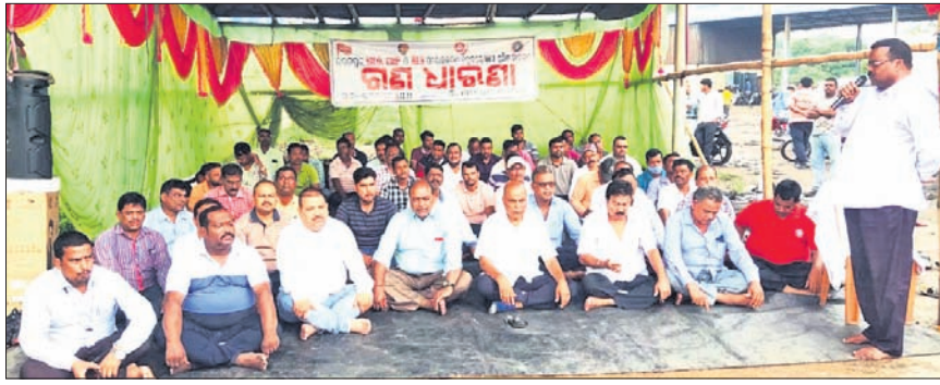
ଶ୍ରମିକ ନେତାମାନେ ଧାରଣାରେ ବସିଛନ୍ତି।