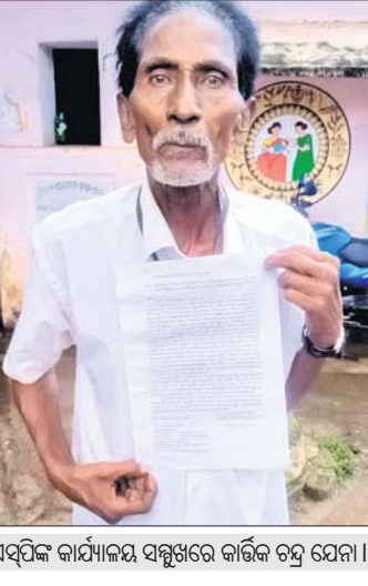
ଏସ୍ପିଙ୍କ କାର୍ଯ୍ୟକ୍ରମ ସମ୍ମୁଖରେ କାର୍ଯ୍ୟକ୍ରମ ଯେନା।

କେନା ଠିକଣାକୁ କାଟି ପଞ୍ଚାୟତରାଜ କରିବା ସହ ଏସ୍ପିଙ୍କ ମାନବ ପରିତ୍ରା ଓ ବୁଲିକଣା କନଷ୍ଟ୍ରକ୍ସନ୍ କୁ ଯାକ୍ତର ନେଇ ଗତ ଜୁନ ୧୮ରେ ତାଙ୍କୁ ଧାରେଣ୍ଡ କରିବା ପାଇଁ ତାଙ୍କୁ ଧାରେଣ୍ଡ ଥିଲା। ସେ ଘରେ ନ ଥିବାରୁ ସେମାନେ ଫେରି ଆସିଥିଲେ। ପରେ ୨୩ ତାରିଖରେ ବନ୍ଧୁ ପୋଲିସ୍ ତାଙ୍କୁ ଘରୁ ଉଠାଇ ଆନାକୁ ନେଇଥିଲା। ଆନାକୁ ଆସିବା ପରେ ଧାରେଣ୍ଡ ଥିବା ବ୍ୟକ୍ତିଙ୍କୁ ଠିକଣା ଯାକ୍ତ ହେବାରୁ ଅଧିକାରୀ କାର୍ଯ୍ୟକ୍ରମ ଯେନା ଚାକିରୀ ଗ୍ରାମର