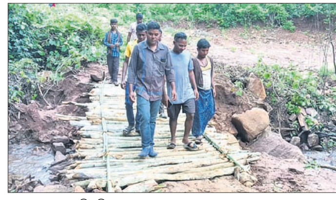
ଗ୍ରାମବାସୀଙ୍କ ଦ୍ୱାରା ତିଆରି କରାଯାଇଥିବା ଅସ୍ଥାୟୀ କାଠପୋଲ ।

ପ୍ରଶାସନ, ରାଜନେତା ସମସ୍ତଙ୍କୁ ଜଣାଇଥିଲେ ମଧ୍ୟ କେହି ଶୁଣିଲେନି। ଲୁଗାପାଣି ନାକ ଉପରେ ପୋଲ ନିର୍ମାଣ ପ୍ରତିଶ୍ରୁତିରେ ରହିଗଲା। ଶେଷରେ ବାଧ୍ୟ ହୋଇ ଗାଁ ଲୋକେ ନାକ ଉପରେ ଏକ ଅସ୍ଥାୟୀ କାଠ ପୋଲ ତିଆରି କଲେ। ରାୟଗଡ଼ା ଜିଲ୍ଲା ଗୁଡାରି ବ୍ଲକ ଅନ୍ତର୍ଗତ ପେଡିଲି ପଞ୍ଚାୟତର ପାହାଡ଼ି ପୁରୁକୁଣା ଗ୍ରାମରେ ଏଭଳି ଚିତ୍ର ଦେଖିବାକୁ ମିଳିଛି। ଗବଡ଼ପଦର ଠାରୁ ପୁରୁକୁଣା ଗାଁକୁ ଦୂରତା ପ୍ରାୟ ୮ କି.ମି.। ଗାଁକୁ ରହିଥିବା ରାସ୍ତା ସମ୍ପୂର୍ଣ୍ଣ ବନ୍ଧା, ପାହାଡ଼ ଘେରା ଏବଂ ପଥୁରିଆ ରାସ୍ତା। ଏହି ରାସ୍ତାରେ ଚାଲି ଚାଲି ଯିବା କଷ୍ଟକର।