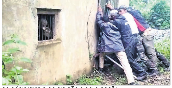
ବନ୍ଦ କର୍ମଚାରୀମାନେ ଭାଲୁକୁ କାଟି କରିବାକୁ ଉଦ୍ୟମ କରୁଛନ୍ତି।

ନବରଙ୍ଗପୁର ଜିଲ୍ଲା ଉମରକୋଟ ବ୍ଲକ ମୁର୍ତ୍ତୁମା ଗ୍ରାମରେ ଶୁକ୍ରବାର ଏକ ରୋଚକ ଘଟଣା ଘଟିଛି। ଫିଲ୍ମ ଷ୍ଟାଲରେ ଘଟଣା ବନ୍ଦିତାଙ୍କ ଏବଂ ଗ୍ରାମବାସୀଙ୍କୁ ଚକମା