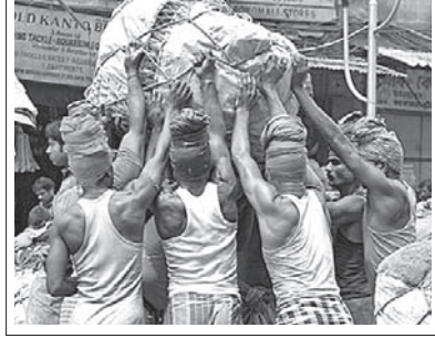
ଆୟ ଉପରେ ୧୬୩

୧୨୫ ମିଲିଅର୍ଡ୍ ଡଲାର ଉପରେ ଫେଡେରାଲ୍ ଇନ୍ଦ୍ କମ୍ପାଣୀ ୨୩.୭ ମିଲିଅର୍ଡ୍ ଡଲାର ଦେଇଛି, ତା' ମାନେ ୧୯ ଶତାଂଶ । ସେହି କାଳରେ ବଫେଟ୍ କ୍ଷମ୍ପର୍କି ୨୪.୩ ମିଲିଅର୍ଡ୍ ଡଲାର ବଢ଼ିଗଲା, ତା' ମାନେ ପ୍ରକୃତ ତିକସ ହାର (ଟ୍ରୁ ଟାକ୍ସ ରେଟ୍) ୦.୧୦% । ସେହିପରି ଟେସ୍ଲାର ଟିକ୍ସ ଏବିଜିକ୍ସିଟିଭ୍ ମସ୍କ ୧.୫୨ ବିଲିଅର୍ଡ୍ ଡଲାର ଆୟ ଉପରେ ୪୫୫ ମିଲିଅର୍ଡ୍ ଡଲାର ଦେଲା, ତା'ର ସମ୍ପର୍କି ୧୩.୯ ବିଲିଅର୍ଡ୍ ଡଲାର ବଢ଼ିଥିବା ବେଳେ ତୁ ଟାକ୍ସ ରେଟ୍ ୩.୨୭% । ଆମାଜନର ଟିକ୍ସ ଏବିଜିକ୍ସିଟିଭ୍ ଓ ଖଣିଚନ୍ଦ୍ ପୋଷ୍ଟର ମାଲିକ ବେରୋସ୍ ୪.୨୨ ବିଲିୟର୍ଡ୍ ଡଲାର ଆୟ ଉପରେ ୧୬୩