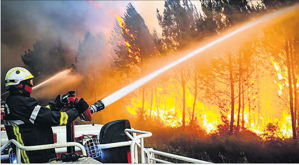
ଫ୍ରାନ୍ସର ଲାଭରାସ୍ ନିକଟ ଜଙ୍ଗଲରେ ଲାଗିଥିବା ନିଆଁର ପାଇଁ ପାଇପ୍ ଯୋଗେ ପାଣି ଛତାଯାଉଛି।

ଲଣ୍ଡନ, ୧୬୬୭: ଯୁରୋପୀୟ ଦେଶରେ ଚଳିତ ବର୍ଷ ରେକର୍ଡ ଭାଙ୍ଗିଛି ତାପମାତ୍ରା। ଏହାର ପ୍ରକାଶପରେ ପର୍ଯ୍ୟାୟ, ପ୍ରାୟ, ସେନ, ମରୋକ୍କର ବିଭିନ୍ନ ଜଙ୍ଗଲରେ ଭାଷଣ ନିଆଁ ଲାଗି ହଜାର ହଜାର ହେକ୍ଟର ଜମିକୁ ବୃକ୍ଷଲତା ସମ୍ପୂର୍ଣ୍ଣ ଜଳିଯାଇଛି। ଦକ୍ଷିଣ ଯୁରୋପୀୟ ଦେଶରେ ଗତ କିଛି ସପ୍ତାହ ହେଲା ଗୋଟିଏ ପରେ ଗୋଟିଏ ଜଙ୍ଗଲରେ ନିଆଁ ଲାଗୁଥିବାରୁ ଏହାକୁ ଲିଭାଇବା ଚ୍ୟାଲେଞ୍ଜିଂ ହୋଇପଡ଼ିଛି। ଫଳରେ ପ୍ରକୃତ ତାପମାତ୍ରାଠାରୁ ସ୍ଥାନୀୟ ଅଞ୍ଚଳଗୁଡ଼ିକରେ ଗତି ବଢ଼ିଛି। ପବନରେ ନିଆଁ ଉଡ଼ି ଆଖପାଖ ଅଞ୍ଚଳର ଘର ଜଳିଯାଇଛି। ଲୋକଙ୍କୁ ସୁରକ୍ଷିତ ସ୍ଥାନକୁ ନିଆଁ ଉଡ଼ିବାବେଳେ ଅଗ୍ନି ନିର୍ବାପନ ପାଇଁ ହଜାର ହଜାର ସଂଖ୍ୟାରେ କର୍ମଚାରୀ ନିଯୋଜିତ ହୋଇଛନ୍ତି। କେବଳ ପର୍ଯ୍ୟଟନରେ ୩,୫୦୦ରୁ ଊର୍ଦ୍ଧ୍ୱ ଅଗ୍ନିଶମ କର୍ମଚାରୀ ମୁତୟନ ହୋଇଛନ୍ତି। ଏକ ବିମାନ ଯାତାରେ ଜଙ୍ଗଲରେ ପାଣିବୋମା ପକା ଯାଉଥିବାବେଳେ ସେନ ସାମାଜିକ ଫୋର୍ସ କୋରା ଏରିଆରେ ଫ୍ଲେମ୍ ଡୁର୍ଭିଟାଗ୍ରାସ୍ତ ହେବାରୁ ଜଣେ ପର୍ଯ୍ୟଟକ ପାଇଲଟଙ୍କ ମୃତ୍ୟୁ ଘଟିଛି। ଯୁରୋପର ବିଭିନ୍ନ ସ୍ଥାନରେ ପ୍ରଥମ ଥର ପାଇଁ ତାପମାତ୍ରା ୪୫ ଡିଗ୍ରୀ ସେଲସିୟସ୍ ଚଢ଼ିଛି। ତ୍ରିଟେନରେ ଅଦ୍ୟାବଧି ସର୍ବାଧିକ ତାପମାତ୍ରା ୩୮.୭ ଡିଗ୍ରୀ (୧୦୧.୯ ଡିଗ୍ରୀ ଫାହେନହିଟ) ରେକର୍ଡ ହେଉଥିବାବେଳେ ଆସନ୍ତା ସପ୍ତାହରେ ପ୍ରଥମ ଥର ପାଇଁ ଏହା ୪୦ ଡିଗ୍ରୀ ସେଲସିୟସ୍ ଚଢ଼ି ଯାଇପାରେ ବୋଲି ଜଣାଯାଉଛି।