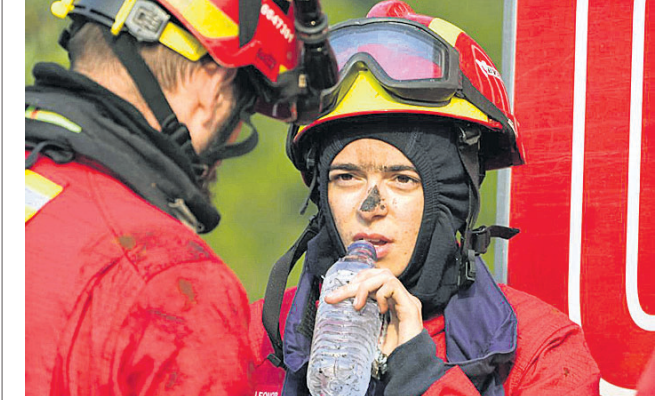
ପର୍ଯ୍ୟଟକ ଆନିଆଓ ନିକଟ ଲଗୋଆ ପର୍ବତ ଗ୍ରାମରେ ନିଆଁ ଲିଭାଇ ଥିବା ପଡ଼ିଥିବା ଅଗ୍ନିଶମ ବାହିନୀ କର୍ମଚାରୀମାନେ ପାଣି ପିଇଛନ୍ତି।

ପ୍ରବଳ ଗ୍ରୀଷ୍ମପ୍ରବାହର ସମ୍ମୁଖୀନ ହେଉଥିବା ସେନ, ଜର୍ମାନୀ, ଫ୍ରାନ୍ସ, ଯୁରୋପୀୟ ଦେଶଗୁଡ଼ିକରେ ଜଙ୍ଗଲ ନିଆଁ ଆୟତ୍ତ କରିବା କାଠିକର ପାଠ ହୋଇଛି। ଯୁରୋପୀୟ ଫରୋସ୍ (ଇଏସ୍‌ଏଆଇଏସ୍) ଡିପୋର୍ଟ ଅନୁସାରେ ନିଆଁ ଲାଗି ଯୁରୋପରେ ୨୦୦୦ ମସିହା ପରେ ୨୦୧୧ରେ ବିପାତ ସର୍ବାଧିକ ଜଙ୍ଗଲ ନଷ୍ଟ ହୋଇଛି। ଏଥିଯୋଗୁଁ ଜର୍ମାନୀରେ ୨୦୦୧, ୨୦୧୩ ନିୟୁତ ହେକ୍ଟର ଜଙ୍ଗଲ ଜଳିଯାଇଥିବାବେଳେ ଇଟାଲୀରେ ୧୫୪,୫୭୭ ନିୟୁତ ଏବଂ ଆଲବେନିଆରେ ୧୩୪,୬୭୩ ନିୟୁତ ହେକ୍ଟର ଜଙ୍ଗଲ ନଷ୍ଟ ହୋଇଛି। ୨୦୧୮ରେ କେନ୍ଦ୍ରୀୟ ଏବଂ ଉତ୍ତର ଯୁରୋପରେ ରେକର୍ଡ ସଂଖ୍ୟାରେ ଜଙ୍ଗଲ ନିଆଁ ଲାଗି ବ୍ୟାପକ କ୍ଷୟକ୍ଷତି ହୋଇଥିଲା। ଜଳବାୟୁ ପରିବର୍ତ୍ତନ ଯୋଗୁଁ ଏକ ଶତାବ୍ଦୀ ତଳେ ଥିବା ତାପମାତ୍ରା ୫ରୁ ୧୦ ଡିଗ୍ରୀ ବୃଦ୍ଧି ପାଇଛି। ବିଶ୍ୱପାତନ, ପାଣିପାଗରେ ମନୁଷ୍ୟକୃତ ହସ୍ତକ୍ଷେପ ଯୋଗୁଁ ଭାଷଣ ଗରମ, ବନ୍ୟା, ବାତ୍ୟା, ମରୁଡ଼ି ଭଳି ବିପର୍ଯ୍ୟୟ ବଢ଼ିଗଲାଣି। ଯୁରୋପରେ ଆସନ୍ତା ଜୁଲାଇ କିମ୍ବା ଏପ୍ରିଲରୁ ଜୁଲାଇ ୨୦୧୩ ନିୟୁତ ହେକ୍ଟର ଜଙ୍ଗଲ ଜଳିଯାଇଥିବାବେଳେ କେତେକ କରାଯାଇଥିବାବେଳେ ସ୍ଥାନରେ ଏହା ୪୭ ଡିଗ୍ରୀ ଛୁଟିଛି।