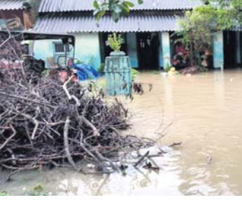
ବାଲୁଗାଁ, ୧୭।୭ (ଡି.ଏନ୍.ଏ.) ଲଗାଣ ବର୍ଷା ଯୋଗୁଁ ଲୋକଙ୍କୁ ବ୍ଲକ ଅଧୀନ ୨୦ରୁ ଊର୍ଦ୍ଧ୍ୱ ଗ୍ରାମ ଜଳବନ୍ଦୀରେ ରହିଥିବା ବେଳେ ଏକାଧିକ ଗ୍ରାମକୁ ଯୋଗାଯୋଗ ବିଚ୍ଛିନ୍ନ ହୋଇପଡ଼ିଛି। ବର୍ଷା ଜଳ ଘରେ ପଶିବାରୁ ଲୋକଙ୍କ ଜୀବନ ବିପନ୍ନ ହୋଇପଡ଼ିଛି। ଆଲୁଆ ପଞ୍ଚାୟତର ପାଇକକୁଶିଡ଼ିହ, ରାହାଣବେଳା, ବାଲୁଆ, ଖେତ୍ରପାଳ, ଆଲୁଆ, ବାଳିଆପାଟଣା, ବ୍ରାହ୍ମଣ କୁଶିଡ଼ିହ, ଲକ୍ଷ୍ମୀଧରପୁର, କୁମୁନାପାଟଣା ପଞ୍ଚାୟତର କାଲୁରା, ସାମନ୍ତସିଂହାର ପୁର, କୁମୁନା ପାଟଣା, ହାରାପୁର ଏବଂ ସିଙ୍ଗେଶ୍ୱର ପଞ୍ଚାୟତର ଧୂଆଁଳ, କୁମୁନାପଡ଼ା, ବିଷୁଡିହ ପଞ୍ଚାୟତର କୋଡ଼ରା ଆଦି ଗ୍ରାମ ପାଣି ଘେରରେ ରହିଛି। ସାମନ୍ତସିଂହାରପୁର ଠାରୁ ବାଲୁଗାଁ ପର୍ଯ୍ୟନ୍ତ ରାସ୍ତାରେ ତିନି ଫୁଟରୁ ଊର୍ଦ୍ଧ୍ୱ ପାଣି ପ୍ରଭାବିତ ହେଉଛି।

ଓଡ଼ିଏ ସମେତ ବିଭିନ୍ନ ରାସ୍ତା ଉପରେ ପାଣି ଜମି ରହିଛି। ବାଣପୁର ବ୍ଲକର ଦେଓଗାଁ, ଗାଲୁଆ, ଭେଟେଶ୍ୱର, ଭବାନୀପୁର, ଆୟରପୁର ପଞ୍ଚାୟତର କେତେକ ଗ୍ରାମରେ ପାଣି ଜମି ରହିଛି। ଗାଲୁଆ ପଞ୍ଚାୟତର ଭାମପୁର, ସାନହଳୁଆ ଓ ସମେତ ବାଲେଡିହ, ଭେଟେଶ୍ୱର, ମାରିଆ ପୋଖରୀ, ଆୟତପୁର ରୋଡ଼, ବିଷୁଡିହ, ନନ୍ଦପୁର ପଞ୍ଚାୟତର ସୁନାକେରା, ମାଁ ନେତାମରାଳ ମନ୍ଦିର ନିକଟ ଆଦି ସ୍ଥାନରେ ୨୦ରୁ ଊର୍ଦ୍ଧ୍ୱ ଗାଁରେ ବନ୍ୟାଜଳ ପ୍ରବାହିତ ହେଉଛି। ଏଥିପାଇଁ ଯାତାୟତ ବ୍ୟାହତ ହେବା ସହ ଉକ୍ତ ସ୍ଥଳ ଗ୍ରାମ ବାହ୍ୟ ଜଗତକୁ ବିଚ୍ଛିନ୍ନ ହୋଇପଡ଼ିଛି। ଦୁର୍ଦ୍ଦଶା ମଧ୍ୟରେ ଏହି ବୁଲ ଗ୍ରାମର ଲୋକ ରହିଛନ୍ତି। କୌଣସି ପ୍ରଶାସନିକ ଅଧିକାରୀ ଘଟଣାସ୍ଥଳରେ ପହଞ୍ଚି ନ ଥିବା ଗ୍ରାମବାସୀ ଜଣାଇଛନ୍ତି। ଏହି ରାସ୍ତା ଉପରେ ୧୫ଟି ଗ୍ରାମର ପ୍ରାୟ ୧୦୫୫ଟି ଲୋକ ନିର୍ଭର କରିଥାନ୍ତି। ସେହିପରି ବାଣପୁର ବିଜ୍ଞାପିତ ଅଞ୍ଚଳ ପରିସର ୧, ୨, ୧୩ ଏବଂ ୧୨ ନମ୍ବର