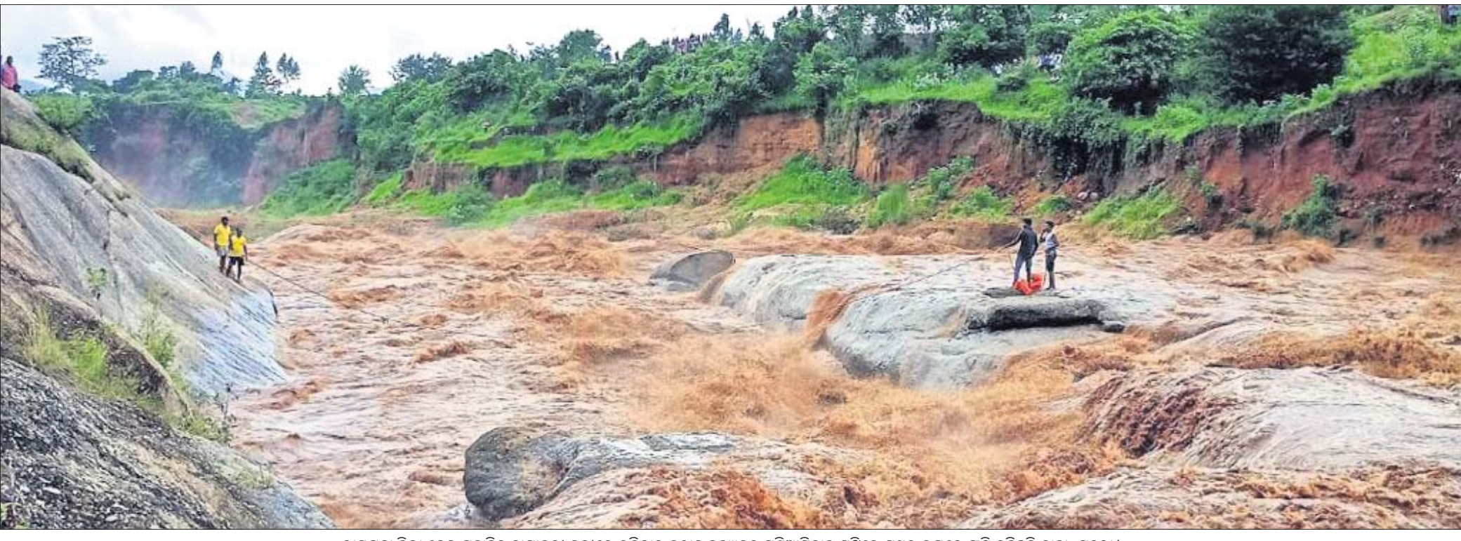
ରାୟଗଡ଼ା ଜିଲା ବେଳ ପ୍ରବାହିତ ନାଗାବଳୀ ନଦୀରେ ରବିବାର ହଠାତ୍ ବନ୍ୟାଜଳ ପଶିଆସିବାରୁ ମଝିରେ ପଥର ଉପରେ ଫସି ରହିଛନ୍ତି ଦାଦା, ପୁରୁଣା।

ମାଲକାନଗିରି, ୧୭।୭ (ଡି.ଏନ୍.ଏ.): ପ୍ରବଳ ବର୍ଷା ଯୋଗୁଁ ଗତ ୬ଦିନ ଧରି ଓଡ଼ିଶା ସହ ଆନ୍ଧ୍ର ପ୍ରଦେଶ ବନ୍ୟାରେ ପ୍ରଭାବିତ ହୋଇଛି। ଏହି ବନ୍ୟାରେ ଅନେକ ଘରମ୍ପା, ଚାଷଜମି ନଷ୍ଟ ହୋଇଥିବା ବେଳେ ଏଥିରୁ ବାଦ ପଡିନାହାନ୍ତି ବନ୍ୟାଜନ୍ତୁ। ଏପରି ଏକ ଦୃଶ୍ୟ ଦେଖିବାକୁ ମିଳିଛି ଓଡ଼ିଶା ସାମାନ୍ୟ ଆନ୍ଧ୍ର ପୂର୍ବ ଗୋଦାବରୀ ନିକଟରେ। ଏହି ଜିଲାର କାଟିୟମ ନୁକ ଅନ୍ତର୍ଗତ ପୁଲସଲକା ଗ୍ରାମ ନିକଟ ଧବଳେଶ୍ୱର ବ୍ୟାରେଜ୍ ନିକଟରେ ଥିବା ଗୋଦାବରୀ ନଦୀର ଏକ ଟାପୁରେ ୧୦୦ରୁ ଊର୍ଦ୍ଧ୍ୱ ହରିଣ ଫସି ରହିଛନ୍ତି। ପୂର୍ବ ଗୋଦାବରୀ ନଦୀରେ ବନ୍ୟାଜଳ ବୁଦ୍ଧି ପାଇବାରୁ ଏହି ହରିଣପଲ ଟାପୁରେ ଫସିରହିଥିବା ଜଣାପଡିଛି। ନିକଟସ୍ଥ ଗ୍ରାମବାସୀ ଜଳରେ ପହଞ୍ଚି ଆସୁଥିବା ୪ଟି ହରିଣକୁ ଉଦ୍ଧାର କରିଥିବା ବେଳେ ଗୋଟିଏ ହରିଣକୁ କୁକୁରମାନେ ମାରି ଦେଇଛନ୍ତି। ଏହି ଘଟଣା ଜାଣିବା ପରେ ଆନ୍ଧ୍ର ଗୋଦାବରୀ ଜିଲାର ବନ ବିଭାଗ ଅଧିକାରୀ ଓ କର୍ମଚାରୀମାନେ ଘଟଣା ସ୍ଥଳରେ ପହଞ୍ଚି କିପରି ହରିଣଗୁଡ଼ିକୁ ସୁରକ୍ଷିତ ଭାବେ ଉଦ୍ଧାର କରାଯିବ ସେ ନେଇ ଉଦ୍ୟମ କରି ରଖିଛନ୍ତି।