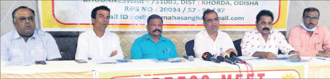
ସରକାରଙ୍କ ନୂଆ ଜିଏସ୍ଟି ହାର ଲାଗୁ ପ୍ରତିବାଦରେ ଓଡ଼ିଶା ବ୍ୟବସାୟୀ ମହାସଂଘ ପକ୍ଷରୁ ଆୟୋଜିତ ଖବରଦାତା ସମ୍ମିଳନୀରେ ଉପସ୍ଥିତ ବରିଷ୍ଠ ସଦସ୍ୟ ।

ଭୁବନେଶ୍ୱର, ୧୭/୭(ସ୍ୱା/ରୋ) ସାଧାରଣତଃ ୧୫ ବର୍ଷ ଭିତରେ ଯେଉଁ ଖାଦ୍ୟ ସାମଗ୍ରୀଗୁଡ଼ିକ ଉପରେ ସରକାରୀ ଟିକସ ଧାର୍ଯ୍ୟ କରାଯାଇ ନ ଥିଲା ତାହା ଏବେ ହେବାକୁ ଯାଉଛି । ଫଳରେ କେବଳ ବ୍ୟବସାୟୀ ଗୁଡ଼ିକ, ଗରିବ ଲୋକ ଆର୍ଥିକ, ପାରିବାରିକ ଏବଂ ସାମାଜିକ ସମସ୍ୟାର ସମ୍ମୁଖୀନ ହେବେ । ତେଣୁ ଖାଦ୍ୟ ପଦାର୍ଥ ଉପରେ କେନ୍ଦ୍ର ସରକାର ଯେଉଁ ୫% ଦ୍ରବ୍ୟ ଏବଂ ସେବା କର (ଜିଏସ୍ଟି) ଲାଗାଇବାକୁ ଯାଉଛନ୍ତି, ସେଗଣାସାକ ସ୍ୱାସ୍ଥ୍ୟ ଦୃଷ୍ଟିରୁ ସେହି ନିଷ୍ପତ୍ତିରେ ପରିବର୍ତ୍ତନ କରନ୍ତୁ ବୋଲି ବ୍ୟବସାୟୀ ମହାସଂଘ ଦାବି କରିଛି । ଯଦି ସରକାର ଏ ନିଷ୍ପତ୍ତିକୁ ପ୍ରତ୍ୟାହାର ନ କରିବେ ତେବେ ଆସନ୍ତା ୨୬ରେ ଭୋପାଳରେ ହେବାକୁ ଥିବା ସର୍ବଭାରତୀୟ ବୈଠକରେ ମହାସଂଘର ପରବର୍ତ୍ତୀ ପଦକ୍ଷେପ ଗ୍ରହଣ କରାଯିବ ବୋଲି ଚେତାବନୀ ଦିଆଯାଇଛି । ଭୁବନେଶ୍ୱରରେ ରବିବାର