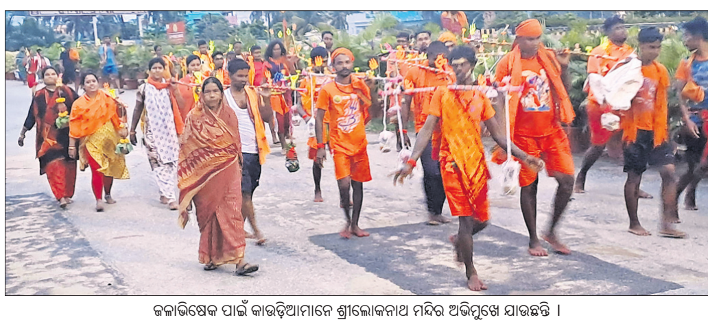
ଜଳାଭିଷେକ ପାଇଁ କାରଡ଼ିଆମାନେ ଶ୍ରୀଲୋକନାଥ ମନ୍ଦିର ଅଭିମୁଖେ ଯାଉଛନ୍ତି।

ନିୟୋଜିତ ହେବେ। ଭକ୍ତମାନେ କିଭଳି ଶୁଖିଳିତ ଭାବେ ଦର୍ଶନ ଓ ଜଳାଭିଷେକ କରିବେ ସେନେଇ ମୁଖ୍ୟତଃ ଧ୍ୟାନ ଦିଆଯିବ। ଜୁଲାଇ ୧୮, ୨୫ ଓ ଅଗଷ୍ଟ ୧ ଓ ୮ ତାରିଖରେ ସୋମବାର ପଡ଼ୁଥିବାରୁ ସଂପୂର୍ଣ୍ଣ ଦିନରୁ ଚିକିତ୍ସା ଅଧିକ ପୋଲିସ୍ ପୁରୁଷା ହେବେ। ଅନ୍ୟ ଦିନରୁ ଚିକିତ୍ସାରେ ଗହଳି ଅପେକ୍ଷାକୃତ ଭାବେ କମ୍ ରହିବ। ଏଣୁ ଆବଶ୍ୟକ ପୋଲିସ୍ କର୍ମଚାରୀ ବରିଷ୍ଠ ପୋଲିସ୍ ଅଧିକାରୀଙ୍କ ସମେତ କନଷ୍ଟେବଲ ଓ ସେମାନାଗଣାମାନେ