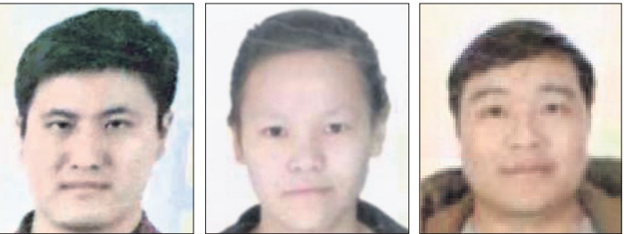
୩ ଚାଇନା ନାଗରିକ

ଲୋକ୍ ଆପ୍ ଠକେଇ ପାମଲୀ ■ ବିଦେଶ ଲ' ଏନ୍‌ଫୋର୍ସମେଣ୍ଟ ଏଜେନ୍ସିର ନିଆଯାଇଛି ସହାୟତା ■ ଏୟାରପୋର୍ଟ, ସି ବିର୍ ସମେତ ଅନ୍ୟାନ୍ୟ ଚେକ୍ ପୋଷ୍ଟରେ ଆଇର୍ଟି ■ ଇଣ୍ଡୋନେସିଆ, ଶ୍ରୀଲଙ୍କା, ପାକିସ୍ତାନ, ନେପାଳ, ବାଂଲାଦେଶରେ ଠକେଇ ଚେର ■ ଭାରତୀୟ ମୁଖ୍ୟ ନୀତିନକ୍ଷ୍ମା ପତରାଉଚରା ଚଳାଇଛି ଇଓଡିଏ