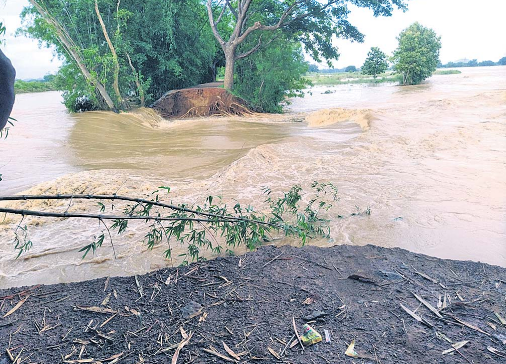
ଶନିବାର ରାତିରୁ ଆରମ୍ଭ ହୋଇଥିବା ଲଗାଣ ବର୍ଷା ଯୋଗୁଁ ନୟାଗଡ଼ ଜିଲା ନୟାଗଡ଼ ବ୍ଲକର ବାଲିକୁଦିଆରେ ଲୁଣିଝରା ନଦୀ ମାଲବନ୍ଧରେ ୭୫ ଫୁଟର ଘାଇ ସୃଷ୍ଟି ହୋଇଛି।

ଲଗାଣ ବର୍ଷାରେ ନୟାଗଡ଼ ଜିଲାର ବିଭିନ୍ନ ସ୍ଥାନରେ ବନ୍ୟା ପରିସ୍ଥିତି ସୃଷ୍ଟି କରିଛି। ଶନିବାର ରାତିରୁ ଆରମ୍ଭ ହୋଇଥିବା ଲଗାଣ ବର୍ଷାରେ ଲୁଣିଝରା, କୁମୁନା ପରା ନଦୀରେ ବନ୍ୟା ଆସିଛି। ନୟାଗଡ଼ ବ୍ଲକର ବାଲିକୁଦିଆରେ ଲୁଣିଝରା ନଦୀ ମାଲବନ୍ଧରେ ୭୫ ଫୁଟର ଘାଇ ସୃଷ୍ଟି ହୋଇଛି। ଏହି ଘାଇ ପାଇଁ ଗହୀରର ୫୫୫ ଏକର ଜମିରେ ବନ୍ୟାଜଳ ପ୍ରବେଶ କରିଛି। ଜିଲାରେ ୧୨୦ରୁ ଊର୍ଦ୍ଧ୍ୱ ଘର ଭାଙ୍ଗିଛି। ସେହିଭଳି ନୟାଗଡ଼ ବ୍ଲକର ଲକ୍ଷ୍ମୀପ୍ରସାଦ ପଞ୍ଚାୟତ ବାଗବାଟି ଡିହଗାଁରେ ୪୫୫ ଏକର ବନ୍ୟାଜଳ ଲହଡ଼ି ଭାଙ୍ଗିଛି। ଏଥିପାଇଁ ବହୁ ପରିବାର କ୍ଷତିଗ୍ରସ୍ତ ହୋଇଛନ୍ତି। ବାଲିକୁଦିଆ ଗାଁ ଭିତରେ ୧୫୫ ୨ ଫୁଟ ଉଚ୍ଚର ବନ୍ୟାଜଳ ପ୍ରବାହିତ ହେଉଛି। ପୁଣି ନୟାଗଡ଼ ବ୍ଲକର ଯଦୁପୁର ସ୍କୁଲ, ରାଉତରାପୁର ନୂଆସାହି ପରି ୧୦ରୁ ଊର୍ଦ୍ଧ୍ୱ ଗାଁରେ ବନ୍ୟାଜଳ ପଶିଛି। ଓଡ଼ିଶା ବ୍ଲକର କୁରାଳ-ଓଡ଼ିଶା ରାସ୍ତା ରବିବାର ପୂର୍ବାହ୍ନ ୮ଟାରୁ ଅପରାହ୍ନ ୨ଟା ପର୍ଯ୍ୟନ୍ତ ବିଚ୍ଛିନ୍ନ ହୋଇପଡ଼ିଥିଲା। କୁମୁନା ନଦୀର କୁରାଳ ପୋଲ ଉପରେ ୨ ଫୁଟର ବନ୍ୟାଜଳ ପ୍ରବାହିତ ହେବାରୁ ଏପରି