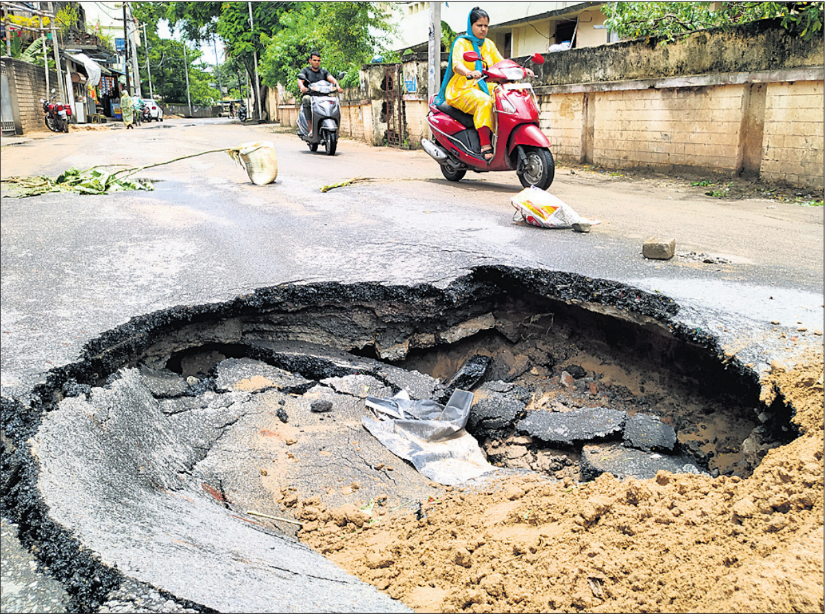
ନିମ୍ନମାନର କାର୍ଯ୍ୟ ଯୋଗୁ କଟକ ରୁଳାପୁର ଟିଲି ଲେନ୍ ରାସ୍ତା ମଝିରେ ରବିବାର ଦୃଷ୍ଟି ହୋଇଥିବା ଗର୍ଭ ।