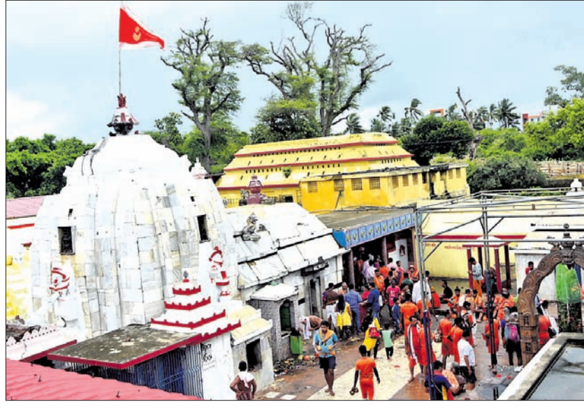
ଶ୍ରୀଲୋକନାଥ ପୀଠରେ କାର୍ତ୍ତିକ ଅଭିଷେକ

ଶ୍ରୀକ୍ଷେତ୍ର ପ୍ରଥମ ସୋମବାରରେ ଶ୍ରୀଲୋକନାଥ ପୀଠରେ ପ୍ରବଳ ଭିଡ଼