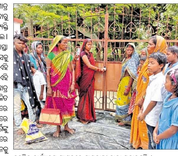
ତହସିଲ କାର୍ଯ୍ୟାଳୟ ଫାଟକରେ ଗ୍ରାମବାସୀ ତାଲା ପକାଇଛନ୍ତି।

ରାସ୍ତାରେ ଯାତାୟତ କରୁଥିଲେ। ମାତ୍ର ଏହି ରାସ୍ତାଟି ବ୍ୟକ୍ତିଗତ ଭାବରେ ଥିବାରୁ କିଛି ଦିନ ତଳେ କେତେଜଣ ବ୍ୟକ୍ତି ବାହୁଙ୍ଗା ବାଟ୍ ପକାଇ ଦେଇଥିଲେ। ଫଳରେ ଦୀର୍ଘ ମାସ ଧରି ଖଣ୍ଡିତ ରାସ୍ତା ପାଇଁ ଦଳିତ ପରିବାର ତହସିଲ ଅଫିସ୍‌କୁ ଚୋଡ଼ି ଚୋଡ଼ି ନିରାଶ ହେବା ପରେ ଏହି ଧାରଣା ଦେଇଥିଲେ। ଅପରପକ୍ଷେ ଏହି ଦଳିତ ସାହିର ୧୫ରୁ ଊର୍ଦ୍ଧ୍ଵ ଛାତ୍ରାଛାତ୍ର ସ୍ତୁଳ ଯାଇପାରୁ ନ ଥିବାବେଳେ ଦଳିତ ପରିବାର ଏବେ ବନ୍ଦୀ ଅବସ୍ଥାରେ ଅଛନ୍ତି। ଏପରି ଅଭିଯୋଗ ସମ୍ପର୍କରେ ତହସିଲଦାର ଏସ୍.କେ. ସାହିରଙ୍କୁ ପଚାରିବାରେ ଅଭିଯୋଗ ଘଟଣାରେ ରୁଚୁଛୁ ଦିଆଯାଇ ଲିକା ପ୍ରଶାସନକୁ ଜଣାଇ ଦିଆଯାଇଛି ବୋଲି କହିଥିଲେ।