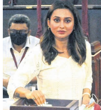
ପଶ୍ଚିମବଙ୍ଗ ବିଧାନସଭାରେ ଭୋଟ ଦେଉଛନ୍ତି ଟିଏମ୍‌ସି ଏମ୍ପି ମିମି ଚକ୍ରବର୍ତ୍ତୀ।