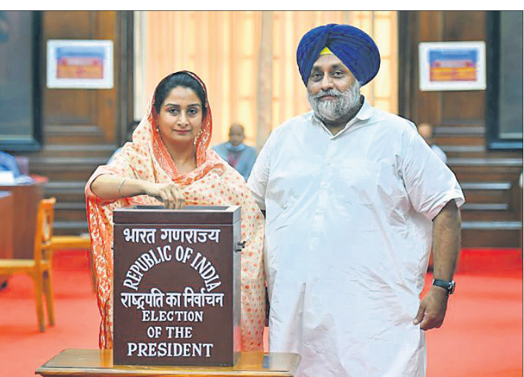
ପାର୍ଲିମେଣ୍ଟରେ ଏସ୍‌ଏଚ୍ ପୁଷ୍ୟାଳୟର ସିଂ ବାଦଲ ଓ ତାଙ୍କ ସ୍ତ୍ରୀ ତଥା ପୂର୍ବତନ କେନ୍ଦ୍ରମନ୍ତ୍ରୀ ହରସିମ୍ବରତ କୌର ବାଦଲ ଭୋଟ ଦେଉଛନ୍ତି।