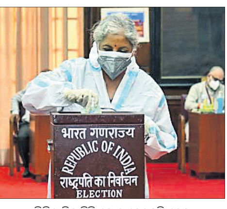
ପିପିଇ କିଏ ପିଠି ଭୋଟ ଦେଉଛନ୍ତି କେନ୍ଦ୍ର ଅର୍ଥମନ୍ତ୍ରୀ ନିର୍ମଳା ସାତାରାମନ।