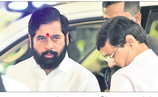
ମହାରାଷ୍ଟ୍ର ପୁଷ୍ୟାଳୟ ଏକନାଥ ଶିରେ ଭୋଟ ଦେବା ପାଇଁ ବିଧାନସଭାରେ ପହଞ୍ଚିଛନ୍ତି।

୧୧ କେବଳ ରାଜନୈତିକ ଯୁଦ୍ଧ ଲଢ଼ୁନାହିଁ। ଏହି ଲଢ଼େଇ ସରକାରଙ୍କ ବିରୋଧରେ। ସେମାନେ ଅଧିକ ଶକ୍ତିଶାଳୀ ହୋଇ ବିଭିନ୍ନ ଦଳ ଭାଙ୍ଗିଛନ୍ତି, ଭୋଟ ପାଇଁ ଲୋକଙ୍କୁ ବାଧ୍ୟ କରୁଛନ୍ତି। ମୋତେ ପରାଜିତ କରିବା ପାଇଁ ଅର୍ଥବଳ ବ୍ୟବହାର ହୋଇଛି। ଦେଶରେ ଗଣତନ୍ତ୍ର ଚିତ୍ତୁରହିବ କି ନା ତାହା ଏହି ନିର୍ବାଚନରୁ ସ୍ପଷ୍ଟ ହେବ। -ସଶଞ୍ଜ ସିହ୍ନା, ବିରୋଧୀ ପ୍ରାର୍ଥୀ