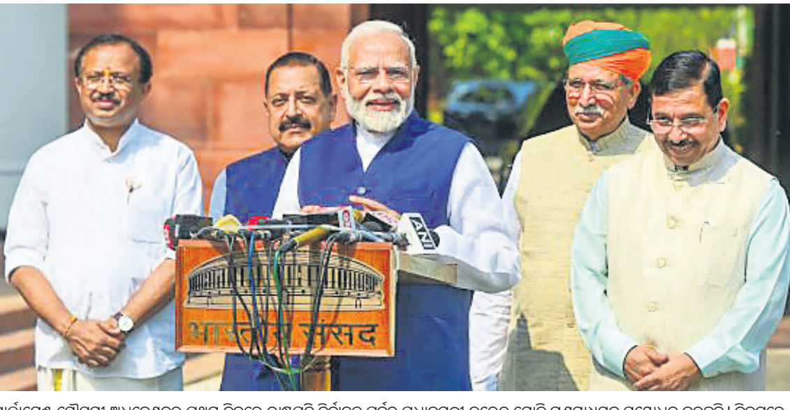
ପାର୍ଲିମେଣ୍ଟ ମୋଡ଼ିପୁରା ଅଧିବେଶନର ପ୍ରଥମ ଦିନରେ ରାଷ୍ଟ୍ରପତି ନିର୍ବାଚନ ପୂର୍ବରୁ ପ୍ରଧାନମନ୍ତ୍ରୀ ନରେନ୍ଦ୍ର ମୋଦି ଗଣମାଧ୍ୟମକୁ ସମ୍ବୋଧନ କରୁଛନ୍ତି। ନିକଟରେ ଅଛନ୍ତି ସଂସଦୀୟ ବ୍ୟାପାର ମନ୍ତ୍ରୀ ପ୍ରହାଦ ଗୋଷୀ, ରାଷ୍ଟ୍ରମନ୍ତ୍ରୀ ଜିତେନ୍ଦ୍ର ସିଂ, ଅର୍ଜୁନରାମ ମେଘଠାଳ ଏବଂ ଭି. ମୁରଲିଧରନ୍।