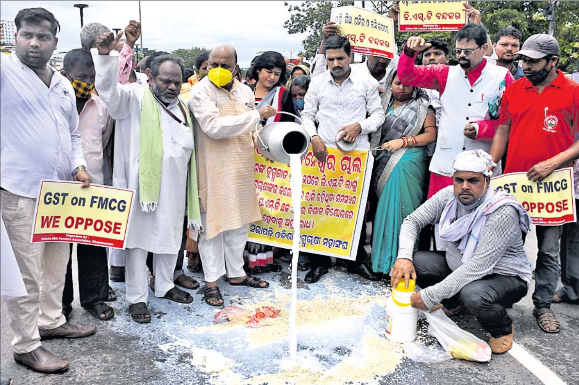
ଦହି, ପନିର, ଘୋଳଦହି ଆଦି ଉପରେ ୫% ଜିଏସ୍ଟି ଲାଗୁ କରି ବିରୋଧ କରି ସୋମବାର ଓଡ଼ିଶା ରୁଗ୍ମତାମୀ ମହାସଂଘ ପକ୍ଷରୁ ଭୁବନେଶ୍ୱର ଲୋକସଭା ପିଏମ୍‌ଜିରେ ଅନୁଷ୍ଠିତ ବିରୋଧ ଶୋଭାଯାତ୍ରାରେ ରୁଗ୍ମତାମୀମାନେ ରାସ୍ତାରେ ଯାଉ ଢାଳି ପ୍ରତିବାଦ ଜଣାଇଛନ୍ତି।