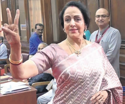
ପାର୍ଲିମେଣ୍ଟ ହାଉସ୍ରେ ଭୋଟ ଦେବା ପରେ ବିଜୟ ସଙ୍କେତ ଦେଖାଇଛନ୍ତି ମଥୁରା ଏମ୍ପି ହେମା ମାଲିକା।