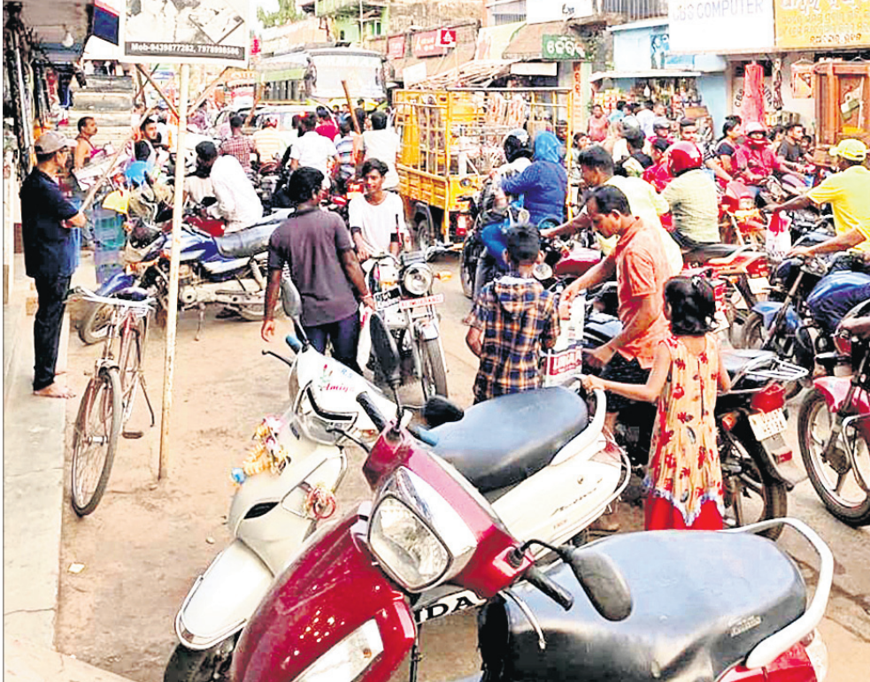
ନୂଆ ବଜାରରେ ଅସମ୍ଭବ ଟ୍ରାଫିକ୍ ଜାମ୍।

ସହରରେ ମୁଣ୍ଡ ଟେକୁଛି ବଡ଼ ବଡ଼ ମଲ୍। ଏଭଳି ବ୍ୟବସାୟିକ ପ୍ରତିଷ୍ଠାନରେ ଦୈନିକ ହେଉଛି ବହୁଲଙ୍କ ଚକାର କାରବାର। ଗ୍ରାହକଙ୍କୁ ଆକର୍ଷିତ କରିବାକୁ ଦିନରାତି ରଙ୍ଗବେରଙ୍ଗ ଆଲୋକରେ ଟପକୁଥିବା ଏହି ମଲ୍ଗୁଡ଼ିକ କିନ୍ତୁ ଭୁଲିଯାଇଛନ୍ତି ସୁରକ୍ଷା ସମ୍ପର୍କିତ ନିୟମ। ନିଆଁ ଲାଗିଲେ କେଉଁ ରାସ୍ତା ଦେଇ ଯିବାର ବାହାରକୁ ବାହାରି ହେବ, କମ୍ ସମୟ ଭିତରେ କେମିତି ଅଗ୍ନି ପ୍ରଶମନ କରାଯାଇପାରିବ ସେ ସମ୍ପର୍କରେ ନା ଅଛି କର୍ମଚାରୀଙ୍କ ଧାରଣା ନା ସେମାନଙ୍କୁ ଦିଆଯାଇଛି ବିଧିବଦ୍ଧ ପ୍ରଶିକ୍ଷଣ।