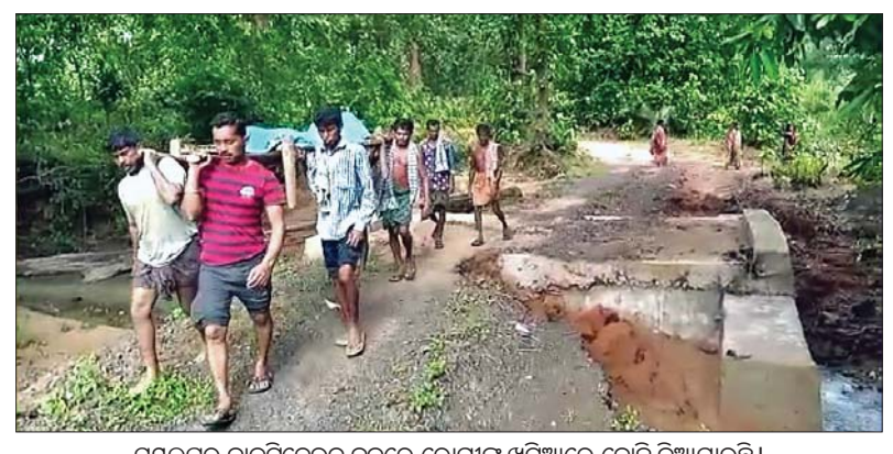
ସମ୍ପଲ୍ପୁର ନାକଟିଦେଉଳ ବ୍ଲକ୍ରେ ରୋଗୀଙ୍କୁ ଖଟିଆରେ ବୋହି ନିଆଯାଉଛି।

ସରକାର ଗ୍ରାମାଞ୍ଚଳର ବିକାଶକୁ ଗୁରୁତ୍ୱ ଦେଇ ବିଭିନ୍ନ ଯୋଜନା କାର୍ଯ୍ୟକାରୀ କରୁଛନ୍ତି। ଏଥିପାଇଁ ବିପୁଳ ଅର୍ଥ ବ୍ୟୟ ହେଉଛି। କିନ୍ତୁ ବାସ୍ତବ କ୍ଷେତ୍ରରେ ଉତ୍ତର ଯୋଜନାର ସୁଫଳ ଗ୍ରାମାଞ୍ଚଳରେ ପହଞ୍ଚି ପାରୁନାହିଁ। ରାଜନୈତିକ ଲକ୍ଷ୍ୟଗୁଡ଼ି ଏବଂ ପ୍ରଶାସନର ଆନ୍ତରିକତା ଅଭାବ ଯୋଗୁଁ ସାଧାରଣ ଦୀର୍ଘ ସାତ ଦଶନ୍ଧି ପରେ ବି ସମ୍ପଲ୍ପୁର ଲିଲା ନାକଟିଦେଉଳ ବ୍ଲକ୍ କମ୍ପାନୀନାମା ଏବଂ ବଡ଼ବିଲ ପରି ଦୁର୍ଗମ ଗ୍ରାମରେ ବିକାଶର ପୂର୍ଣ୍ଣ ଉର୍ଦ୍ଧ୍ୱ ପାରିନାହିଁ ଆଜି ପୁଣ୍ୟ ଏହି ଦୁଇ ଗ୍ରାମର ଲୋକେ ବର୍ଷା ଦିନେ ଏକ ପ୍ରକାରର ଅଭିଶପ୍ତ ଜୀବନ ନେଇ ଚଳି ରହିବାକୁ ବାଧ୍ୟ ହେଉଛନ୍ତି।