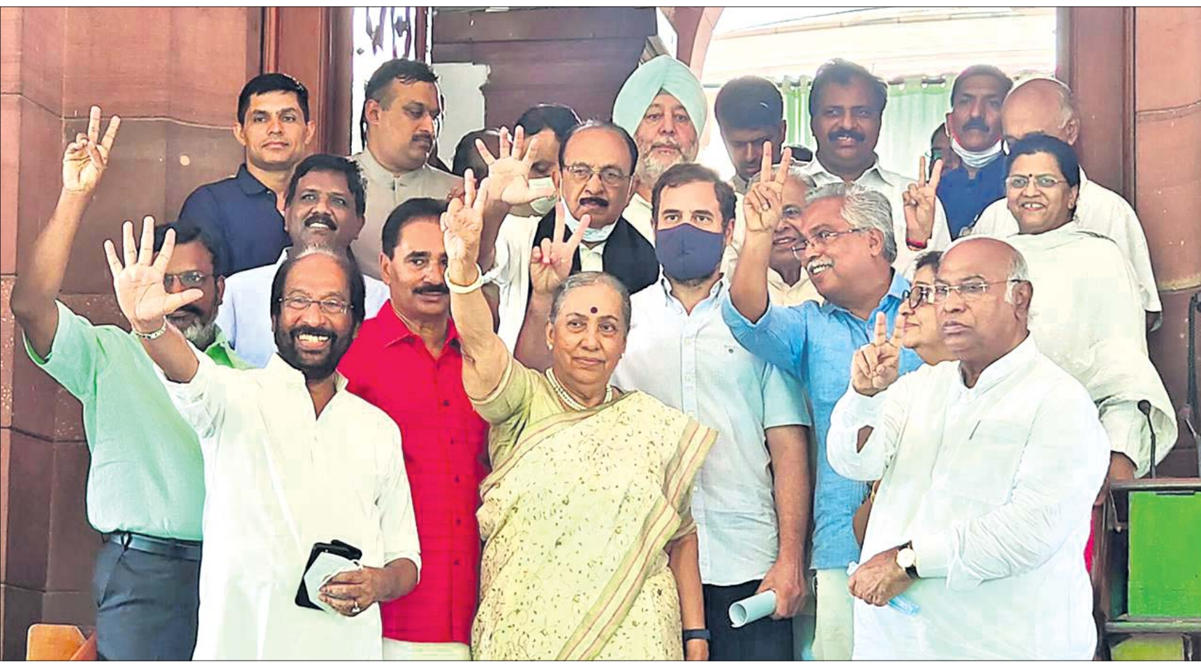
ମିଳିତ ବିରୋଧୀଙ୍କ ଉପରାଷ୍ଟ୍ରପତି ପ୍ରାର୍ଥୀ ମାର୍ଗରେଟ ଆଲଭାଙ୍କ ମଙ୍ଗଳବାର ପ୍ରାର୍ଥନା ସମୟରେ କଂଗ୍ରେସ ନେତା ରାହୁଲ ଗାନ୍ଧୀ, ମିଳିତାହୁଁନ ଖାର୍ଗେଙ୍କ ସମେତ ଅନ୍ୟ ଦଳର ନେତୃବୃନ୍ଦ।

■ 'ମୁନ୍ନାଭାଇ ଏମ୍ବିବିଏସ୍' ଶୈଳୀରେ କାର୍ଯ୍ୟକରୁଛି ରାଜକେନ୍ଦ୍ର ■ ପରୀକ୍ଷାର୍ଥୀଙ୍କ ପାଇଁ ଉତ୍ତର ଲେଖୁଛନ୍ତି ଏକ୍ସପର୍ଟ, ୮ ଗିରଫ ମଧ୍ୟରେ ଏହି ଜାଲିଆତି ବ୍ୟାପିଥିବା ସନ୍ଦେହ କରାଯାଉଛି। ବଲିଉଡ଼ ଫିଲ୍ମ 'ମୁନ୍ନାଭାଇ ଏମ୍ବିବିଏସ୍' ଶୈଳୀରେ ରାଜକେନ୍ଦ୍ର କାର୍ଯ୍ୟ କରୁଥିବା ଜଣାପଡ଼ିଛି। ରାଜକେନ୍ଦ୍ର ଚଳାଇଥିବା ଗୋଷ୍ଠୀ ପକ୍ଷରୁ ପରୀକ୍ଷାର୍ଥୀଙ୍କ ପାଇଁ ଉତ୍ତର ଲେଖିପାରୁଥିବା ଏକ୍ସପର୍ଟ (ପେପର ସଲଭର)ମାନଙ୍କୁ ନିୟୋଜିତ କରାଯାଉଛି। ୧୯ ପୃଷ୍ଠା-୪