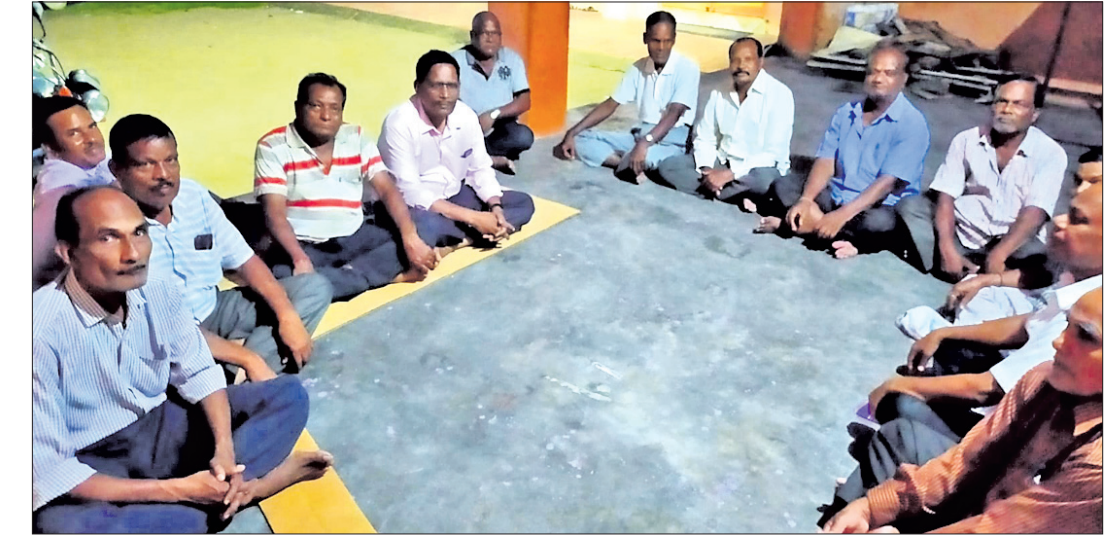
ବୈଠକରେ ଭେଟେରାନ୍ସ କ୍ଲବ୍‌ର ସଦସ୍ୟମାନେ।

ପରଜଙ୍ଗ, ୧୯୮୭(ଡି.ଏନ.ଏ.) ଅଞ୍ଚଳବାସୀଙ୍କ ମଧ୍ୟରେ ସୁସଂସ୍କୃତି ସ୍ଥାପନ କରିବାକୁ ଭେଟେରାନ୍ସ କ୍ଲବ୍ ଦ୍ୱାରା ପ୍ରସ୍ତାବ ଦିଆଯାଇଛି।