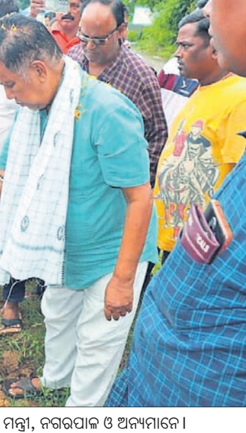
ଚାରାରୋପଣ କାର୍ଯ୍ୟକ୍ରମରେ ମନ୍ତ୍ରୀ, ନଗରପାଳ ଓ ଅନ୍ୟମାନେ।