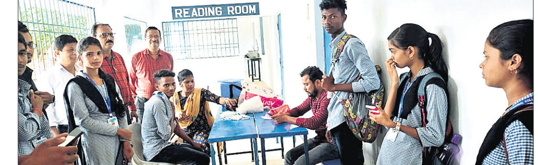
ବୁସ୍ତର ତୋଳ ପ୍ରଦାନ କରାଯାଇଛି।

ଆଠମଲ୍ଲିକ, ୧୯୮୭(ଡି.ଏନ.ଏ.) ଆଠମଲ୍ଲିକ ଜିଲ୍ଲାରେ କୋଭିଡ୍ ସଂକ୍ରମଣ ବହୁମୁଖୀ ବେଳେ ଗତ ୧୫ ତାରିଖ ରୁ ବୁସ୍ତର ତୋଳ କରାଯାଇଛି।