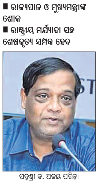
ପଦ୍ମଶ୍ରୀ ଡ. ଅଜୟ ପରିଡ଼ା

ଭୁବନେଶ୍ୱର, (ବୁଧବାର) / ଧର୍ମଶାଳା, ୧୯୮୭ (ଡି.ଏନ.ଏ.) ଜୀବବିଜ୍ଞାନ ପ୍ରତିଷ୍ଠାନ(ଆଇଏଲ୍ଏସ୍) ନିର୍ଦ୍ଦେଶକ ପଦ୍ମଶ୍ରୀ ଡ. ଅଜୟ ପରିଡ଼ାଙ୍କ ମଙ୍ଗଳବାର ପରଲୋକ ଘଟିଛି।