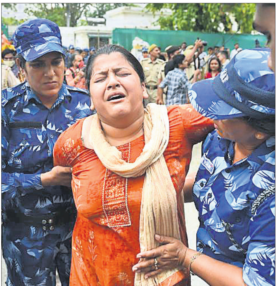
କେନ୍ଦ୍ର ସରକାରଙ୍କ ଦରବୃତ୍ତି, ବେକାରି ଓ ବକିତ ମୁଦ୍ରାଝାଡ଼ିକୁ ନେଇ ନୂଆଦିଲ୍ଲୀଠାରେ ମଙ୍ଗଳବାର ଯୁବକଂଗ୍ରେସ ପକ୍ଷରୁ ବିରୋଧୀ ପ୍ରଦର୍ଶନ ବେଳେ ଜଣେ ମହିଳା କର୍ମୀଙ୍କୁ ପୋଲିସ୍ ଉଠାଇ ରେକ୍ଟର କରାଯାଇଥିଲା।

ଉପରାଷ୍ଟ୍ରପତି ନିର୍ବାଚନ ପାଇଁ ବିରୋଧୀ ଦଳ ପକ୍ଷରୁ ମନୋନୀତ ପ୍ରାର୍ଥୀ ମାର୍ଗାରେଡ଼ ଆକାଶ କରନ୍ତି। ନିର୍ବାଚନ ପାଇଁ ଡର ନାହିଁ। ହାର୍-ଇନ୍-ଇଟ୍ ଜୀବନର ଆଶା ବୋଲି ନାମାଙ୍କନ ଦାଖଲ ବେଳେ ମାର୍ଗାରେଡ଼ କହିଛନ୍ତି। ନାମାଙ୍କନପତ୍ର ଦାଖଲ ସମୟରେ କଂଗ୍ରେସ ପୂର୍ବତନ ଅଧ୍ୟକ୍ଷ ରାହୁଲ ଗାନ୍ଧୀ, ଏନ୍.ଏ.ପି. ପୁଷ୍ପା ଶର୍ମା ପାଞ୍ଚୁରୀ, ରାଜ୍ୟସଭା ବିରୋଧୀ ଦଳ ପୁଷ୍ପା ମଲିକାର୍ଜୁନ ଖାର୍ବେ ଏବଂ ଲୋକସଭା କଂଗ୍ରେସ ଦଳ ପୁଷ୍ପା ଅଧୀନ ରଞ୍ଜନ ଚୌଧୁରୀ ପ୍ରମୁଖ ନେତା ଉପସ୍ଥିତ ଥିଲେ। ଆସନ୍ତା ଅଗଷ୍ଟ ୬ରେ ଉପରାଷ୍ଟ୍ରପତି ନିର୍ବାଚନ ଅନୁଷ୍ଠିତ ହେବ। ଅଗଷ୍ଟ ୧୦ରେ ବର୍ତ୍ତମାନ ଉପରାଷ୍ଟ୍ରପତି ଏମ୍. ଭେଙ୍କୟା ନାଇଡୁଙ୍କ କାର୍ଯ୍ୟକାଳ ଶେଷ ହେବ। ଏନ୍.ଏ.ପି. ପକ୍ଷରୁ ପ୍ରାର୍ଥୀ ଜଗଦୀପ ଧନକର ଯୋଗଦାନ ନାମାଙ୍କନପତ୍ର ଦାଖଲ କରିଛନ୍ତି।