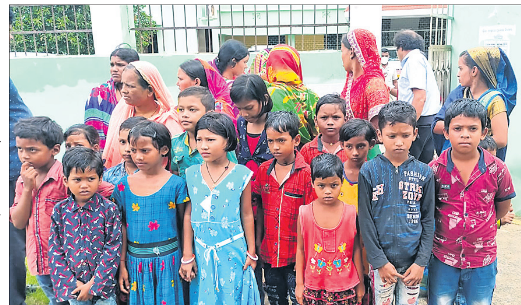
ଜିଲାପାଳଙ୍କୁ ଭେଟିବାକୁ ଆସିବାକୁ ଚକ୍ରଧରପୁର ଗ୍ରାମର ଛାତ୍ରଛାତ୍ରୀ, ଅଭିଭାବକମାନେ।

ବାସ୍ତବ ସମସ୍ୟା ନ ରୁଡ଼ି, ଗ୍ରାମବାସୀଙ୍କ ସହ ବିନା ଆଲୋଚନାରେ କରାଯାଇଥିବା ବିଦ୍ୟାଳୟ ସମ୍ମିଳଣରେ ଶିକ୍ଷା ବିଭାଗ ଏକଥା ଭୁଲିଗଲା, କୋମଳମତି ପିଲାମାନେ ୫ କିଲୋମିଟର ଜଙ୍ଗଲ ରାସ୍ତା ଅତିକ୍ରମ କରି କିପରି ସ୍କୁଲକୁ ଆସିବେ। ଏବେ ସମସ୍ୟା ବଡ଼ ଜଟିଳ ହୋଇଛି। ଜନଶୂନ୍ୟ ଜଙ୍ଗଲିଆ ପଥରେ କେତେବେଳେ ହାତୀ ତ କେତେବେଳେ ଜଙ୍ଗଲୀ ବାରୁଆ ଓ ମାଙ୍କଡ଼ଙ୍କ ଆତଙ୍କ ଦେଖାଦେଉଛି। ହେଲେ ଶିକ୍ଷା ପାଇଁ ଅନ୍ୟ ବିକଳ ନ ଥିବାରୁ କୋମଳମତି ପିଲାମାନେ ପ୍ରତିଦିନ ଜୀବନକୁ ବାଜି ଲଗାଉଛନ୍ତି।