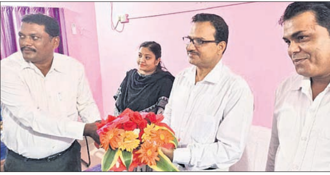
ନୂଆ ସରକାର, ଏସଡିଜେଏମ୍‌ଙ୍କୁ ସ୍ୱାଗତ କରାଯାଇଛି।

ଆଠମଲ୍ଲିକ, ୧୯୮୭(ଡି.ଏନ.ଏ.) ଆଠମଲ୍ଲିକ ବାର୍ ଆସୋସିଏସନ ପକ୍ଷରୁ ମଞ୍ଜୁରୀ ପ୍ରଦାନ କରାଯାଇଛି।