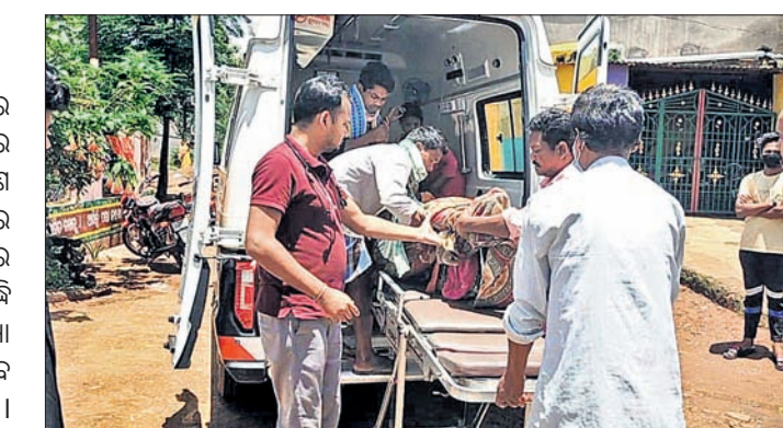
ଗୁରୁତର ରୋଗୀଙ୍କୁ ଆମ୍ବୁଲାନ୍ସ ଯୋଗେ ଡାକ୍ତରଖାନା ପଠାଯାଇଛି।

କୋରାପୁଟ ଜିଲ୍ଲା ଦଶମକ୍ରମରୁ ଜଣେ ପୁଣି ଝାଡ଼ାବାଡ଼ି ଦେଖାଦେଇଛି। ଏଥିରେ ଜଣକର ମୃତ୍ୟୁ ହୋଇଥିବା ବେଳେ ୬ଜଣ ଆକ୍ରାନ୍ତ ହୋଇଛନ୍ତି। ପୁଣି ଝାଡ଼ାବାଡ଼ିରେ ଜଣକର ମୃତ୍ୟୁ ହୋଇଥିଲା। ଫଳରେ ଏବେ ମୃତକଙ୍କ ସଂଖ୍ୟା ୨୯ ବୃଦ୍ଧି ପାଇଥିବା ବେଳେ ଆକ୍ରାନ୍ତଙ୍କ ସଂଖ୍ୟା ୨୨ରେ ପହଞ୍ଚିଛି। ୬ ଆକ୍ରାନ୍ତ ଏବେ ଡାକ୍ତରଖାନାରେ ଚିକିତ୍ସାଧୀନ ଅଛନ୍ତି। ଏମାନଙ୍କ ଘର ଗିରଫୁଆ ପଞ୍ଚାୟତର ଛତାଆଇ ଗ୍ରାମରେ।