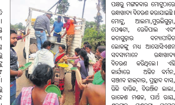
ଆସୋସିଏଶନ ସଦସ୍ୟମାନେ ରକ୍ଷାଖାଦ୍ୟ ବଣ୍ଟନ କରୁଛନ୍ତି।

ଚଳିତବର୍ଷ ମୋଟୁର ବନ୍ୟାଜନିତ ପରିସ୍ଥିତି ଗତ ତିନିବର୍ଷର ରେକର୍ଡ ଭାଙ୍ଗିଛି। ଓଡ଼ିଶା, ଆନ୍ଧ୍ର, ତେଲଙ୍ଗାନାରେ ପର୍ଯ୍ୟାପ୍ତ କ୍ଷୟକ୍ଷତି ହୋଇଛି। ବନ୍ୟାଜନ କମ୍ପୁଥିବା ସତ୍ତ୍ୱେ ଏବେ ବି ଲୋକଙ୍କ ଘର ଜଳମଗ୍ନ ହୋଇରହିଛି। ଆଶ୍ର ନିଜ ଅଞ୍ଚଳର କାଲେରୁ ଏବଂ ଆଖପାଖ ଅଞ୍ଚଳର ଲୋକଙ୍କୁ ଉଦ୍ଧାର କରିବା ପୁରର କଥା ଚିଲିଟ ସାମଗ୍ରୀ ମଧ୍ୟ ଏପର୍ଯ୍ୟନ୍ତ ଯୋଗାଇନାହିଁ। ଅନ୍ୟପକ୍ଷରେ ଓଡ଼ିଶା ସରକାରଙ୍କ ପକ୍ଷରୁ ଉକ୍ତ ଅଞ୍ଚଳରେ ଦାକର କାର୍ଯ୍ୟ ସହ ଶୁଖିଲା ଖାଦ୍ୟ ବିତରଣ କରାଯାଇଛି। କାଲେରୁବାସୀଙ୍କୁ ଏମ୍.ଏ.ଏ. ୧୯୧୭(ଡି.ଏନ.ଏ.)