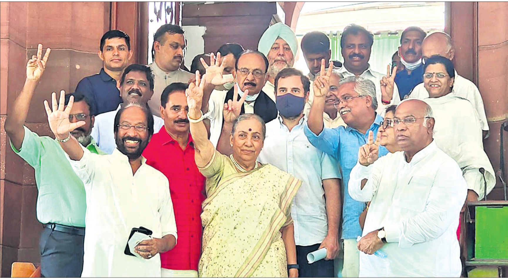
ମିଳିତ ବିରୋଧୀଙ୍କ ଉପରାଷ୍ଟ୍ରପତି ପ୍ରାର୍ଥୀ ମାର୍ଗରେ ଅଲଭାକ ମଙ୍ଗଳବାର ପ୍ରାର୍ଥନା ସମୟରେ କଂଗ୍ରେସ ନେତା ରାହୁଲ ଗାନ୍ଧୀ, ମଲିକାର୍ଜୁନ ଖାର୍ଗେଙ୍କ ସମେତ ଅନ୍ୟ ଦଳର ନେତୃବୃନ୍ଦ।

■ 'ମୁନ୍ନାଭାଇ ଏମ୍ବିବିଏସ୍' ଶୈଳୀରେ କାର୍ଯ୍ୟକରୁଛି ରାଜକେନ୍ଦ୍ର ■ ପରୀକ୍ଷାର୍ଥୀଙ୍କ ପାଇଁ ଉତ୍ତର ଲେଖୁଛନ୍ତି ଏକ୍ସପର୍ଟ, ୮ ଗିରଫ ମଧ୍ୟରେ ଏହି ଜାଲିଆତି ବ୍ୟାପିଥିବା ସନ୍ଦେହ କରାଯାଇଛି। ବଲିଉଡ଼ ଫିଲ୍ମ 'ମୁନ୍ନାଭାଇ ଏମ୍ବିବିଏସ୍' ଶୈଳୀରେ ରାଜକେନ୍ଦ୍ର କାର୍ଯ୍ୟ କରୁଥିବା ଜଣାପଡ଼ିଛି। ରାଜକେନ୍ଦ୍ର ଚଳାଇଥିବା ଗୋଷ୍ଠୀ ପକ୍ଷରୁ ପରୀକ୍ଷାର୍ଥୀଙ୍କ ପାଇଁ ଉତ୍ତର ଲେଖିପାରୁଥିବା ଏକ୍ସପର୍ଟ (ପେପର ସଲଭର)ମାନଙ୍କୁ ନିୟୋଜିତ କରାଯାଇଛି। ପୃଷ୍ଠା-୪