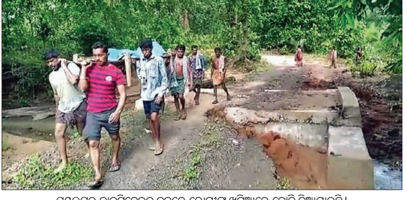
ସମ୍ପଲ୍ପୁର ନାକଟିଦେଉଳ ବ୍ଲକରେ ରୋଗୀଙ୍କୁ ଖଟିଆରେ ବୋହି ନିଆଯାଉଛି।

ସରକାର ଗ୍ରାମାଞ୍ଚଳର ବିକାଶକୁ ଗୁରୁତ୍ୱ ଦେଇ ବିଭିନ୍ନ ଯୋଜନା କାର୍ଯ୍ୟକାରୀ କରୁଛନ୍ତି। ଏଥିପାଇଁ ବିପୁଳ ଅର୍ଥ ବ୍ୟୟ ହେଉଛି। କିନ୍ତୁ ବାସ୍ତବ କ୍ଷେତ୍ରରେ ଉନ୍ନତ ଯୋଜନାର ସୁଫଳ ଗ୍ରାମାଞ୍ଚଳରେ ପହଞ୍ଚି ପାରୁନାହିଁ। ରାଜନୈତିକ ଲକ୍ଷ୍ୟକୁ ଏବଂ ପ୍ରଶାସନର ଆନ୍ତରିକତା ଅଭାବ ଯୋଗୁଁ ସାଧାରଣ ଦୀର୍ଘ ସାତ ଦଶନ୍ଧି ପରେ ବି ସମ୍ପଲ୍ପୁର ଲିଲା ନାକଟିଦେଉଳ ବ୍ଲକର କମଳାନାଳା ଏବଂ ବଡ଼ବିଲ ପରି ଦୁର୍ଗମ ଗ୍ରାମରେ ବିକାଶର ପୂର୍ଣ୍ଣ ଉର୍ଦ୍ଧ୍ୱ ପାରିନାହିଁ। ଆଜି ସୁଦ୍ଧା ଏହି ଦୁଇ ଗ୍ରାମର ଲୋକେ ବର୍ଷା ଦିନେ ଏକ ପ୍ରକାରର ଅଭିଶପ୍ତ ଜୀବନ ନେଇ ଚଳି ରହିବାକୁ ବାଧ୍ୟ ହେଉଛନ୍ତି।