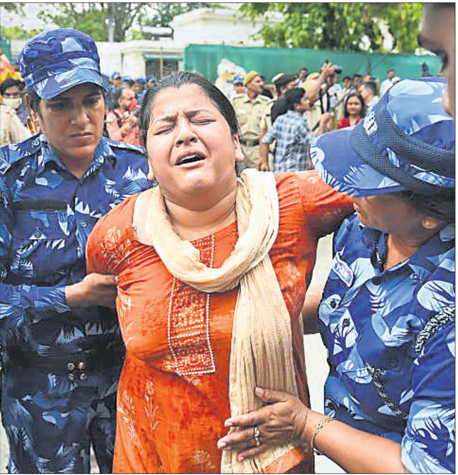
କେନ୍ଦ୍ର ସରକାରଙ୍କ ଦରବୁଜି, ବେକାରି ଓ ବକିତ ମୁଦ୍ରାଝାଡ଼ିକୁ ନେଇ ନ୍ୟୁଆର୍କାଠାରେ ମାଜକବାର ଯୁବକଂଗ୍ରେସ ପକ୍ଷରୁ ବିରୋଧୀ ପ୍ରଦର୍ଶନ ବେଳେ ଜଣେ ମହିଳା କର୍ମୀଙ୍କୁ ପୋଲିସ୍ ଉଠାଇ ରେଜିଷ୍ଟର କରିଛନ୍ତି।

ଉପରାଷ୍ଟ୍ରପତି ନିର୍ବାଚନ ପାଇଁ ବିରୋଧୀ ଦଳ ପକ୍ଷରୁ ମନୋନୀତ ପ୍ରାର୍ଥୀ ମାର୍ଗାରେଟ ଆଲ୍‌ଭା ମାଜକବାର ନାମାକନ ପତ୍ର ଦାଖଲ କରିଛନ୍ତି। ନିର୍ବାଚନ ପାଇଁ ତର ନାହିଁ। ହାର୍-ଇଫ ଜୀବନର ଆଶ ବୋଲି ନାମାକନ ଦାଖଲ ବେଳେ ମାର୍ଗାରେଟ କହିଛନ୍ତି। ନାମାକନପତ୍ର ଦାଖଲ ସମୟରେ କଂଗ୍ରେସ ପୂର୍ବତନ ଅଧ୍ୟକ୍ଷ ରାହୁଲ ଗାନ୍ଧୀ, ଏନ୍‌ସିପି ପୁଷ୍ପା ଶରଦ ପାଞ୍ଜର, ରାଜ୍ୟସଭା ବିରୋଧୀ ଦଳ ପୁଷ୍ପା ମଲିକାର୍ଜୁନ ଖାର୍ବେ ଏବଂ ଲୋକସଭା କଂଗ୍ରେସ ଦଳ ପୁଷ୍ପା ଅଧୀନ ରଞ୍ଜନ ଚୌଧୁରୀ ପ୍ରମୁଖ ନେତା ଉପସ୍ଥିତ ଥିଲେ। ଆସନ୍ତା ଅଗଷ୍ଟ ୨୦ରେ ଉପରାଷ୍ଟ୍ରପତି ନିର୍ବାଚନ ଅନୁଷ୍ଠିତ ହେବ। ଅଗଷ୍ଟ ୧୦ରେ ବର୍ତ୍ତମାନ ଉପରାଷ୍ଟ୍ରପତି ଏମ୍. ଭେଙ୍କୟା ନାଇଡୁଙ୍କ କାର୍ଯ୍ୟକାଳ ଶେଷ ହେବ। ଏନଡିଏ ପକ୍ଷରୁ ଚୟନ କରାଯାଇଥିବା ଉପରାଷ୍ଟ୍ରପତି ପ୍ରାର୍ଥୀ ଜଗଦୀପ ଧନକର ସୋମବାର ନାମାକନପତ୍ର ଦାଖଲ କରିଛନ୍ତି।