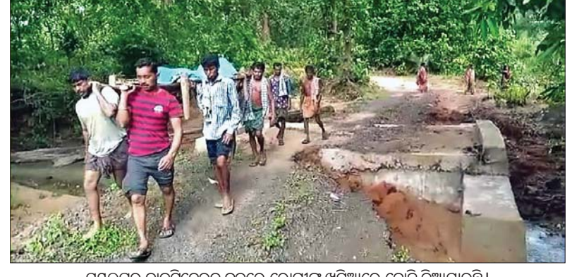
ସମ୍ପଲ୍ପୁର ନାକଟିଦେଉଳ ବ୍ଲକ୍ରେ ରୋଗୀଙ୍କୁ ଖଟିଆରେ ବୋହି ନିଆଯାଉଛି।

ସରକାର ଗ୍ରାମାଞ୍ଚଳର ବିକାଶକୁ ଗୁରୁତ୍ୱ ଦେଇ ବିଭିନ୍ନ ଯୋଜନା କାର୍ଯ୍ୟକାରୀ କରୁଛନ୍ତି। ଏଥିପାଇଁ ବିପୁଳ ଅର୍ଥ ବ୍ୟୟ ହେଉଛି। କିନ୍ତୁ ବାସ୍ତବ କ୍ଷେତ୍ରରେ ଉତ୍ତର ଯୋଜନାର ସୁଫଳ ଗ୍ରାମାଞ୍ଚଳରେ ପହଞ୍ଚି ପାରୁନାହିଁ। ରାଜନୈତିକ ଲକ୍ଷ୍ୟଗୁଡ଼ି ଏବଂ ପ୍ରଶାସନର ଆନ୍ତରିକତା ଅଭାବ ଯୋଗୁଁ ସାଧାରଣ ଦୀର୍ଘ ସାତ ଦଶନ୍ଧି ପରେ ବି ସମ୍ପଲ୍ପୁର ଲିଲା ନାକଟିଦେଉଳ ବ୍ଲକ୍ କମ୍ପାନୀନାମା ଏବଂ ବଡ଼ବିଲ୍ ପରି ଦୁର୍ଗମ ଗ୍ରାମରେ ବିକାଶର ପୂର୍ଣ୍ଣ ଉର୍ଦ୍ଧ୍ୱ ପାରିନାହିଁ ଆଜି ସୁଦ୍ଧା ଏହି ଦୁଇ ଗ୍ରାମର ଲୋକେ ବର୍ଷା ଦିନେ ଏକ ପ୍ରକାରର ଅଭିଶପ୍ତ ଜୀବନ ନେଇ ଚଳି ରହିବାକୁ ବାଧ୍ୟ ହେଉଛନ୍ତି।