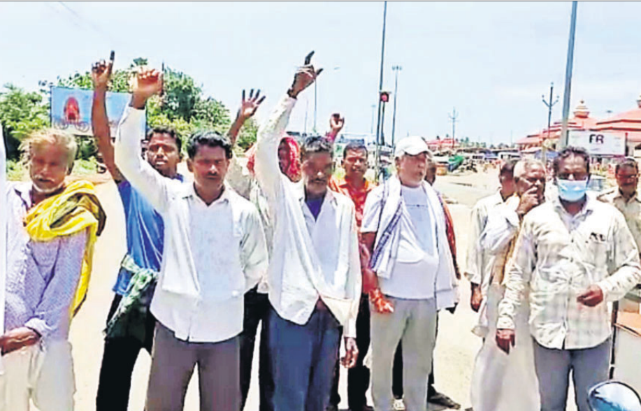
ପୁରୀ ମାଳଗପାଟପୁରଠାରେ ବନ୍ଦ ପାଳନ ସମୟରେ ବିରୋଧ ପ୍ରଦର୍ଶନ