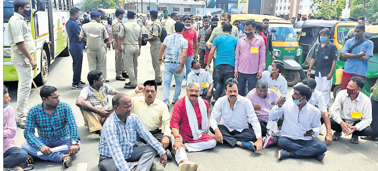
ନବନିର୍ମାଣ କୃଷକ ସଂଗଠନ ଦ୍ୱାରା ବିଆଯାଇଥିବା ଓଡ଼ିଶା ବନ୍ଦ ଡାକରାରେ ସାମିଲ ହୋଇ ରାସ୍ତାବନ୍ଦକୋରେ ବସିଥିବା କଂଗ୍ରେସ ନେତୃମଣ୍ଡଳୀ ।