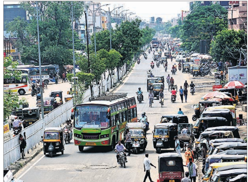
କଟକ ବାଦାମବାଡ଼ିରେ ବନ୍ଦ ପାଳନ ସମୟରେ ସ୍ୱାଭାବିକ ଜୀବନଯାତ୍ରା ।