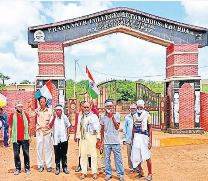
ଖୋର୍ଦ୍ଧା ପ୍ରାଣନାଥ ମହାବିଦ୍ୟାଳୟ ସମ୍ମୁଖରେ ନବ ନିର୍ମାଣ କୃଷକ ସଂଘର ସଭ୍ୟ ।