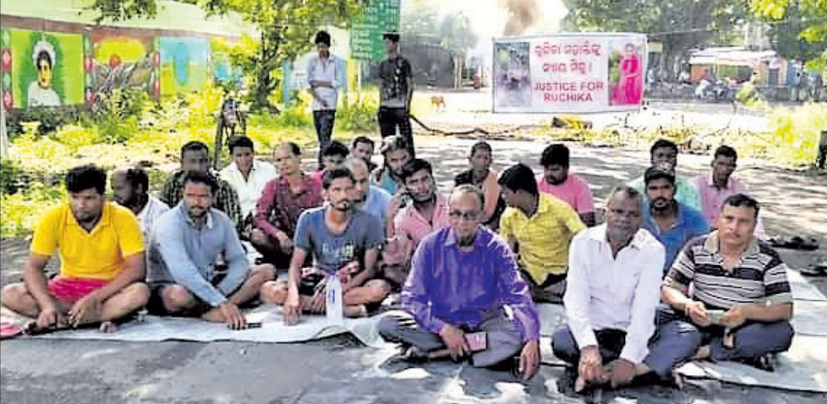
କଟାଡ଼ି ହାଇସ୍କୁଲ ଛକ ପୁରୁଣା କଟକ ସମଲପୁର ରାସ୍ତା ଅବରୋଧ କରି ଧାରଣା ବିଆଯାଇଛି ।