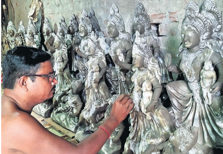
ଆସୁଛି ଖୁବୁରୁକୂଣୀ ଓଷା: କଟକ କୁସାର ସାହି ଅଞ୍ଚଳରେ ଜଣେ ଶିଳ୍ପୀ ଖୁବୁରୁକୂଣୀଙ୍କ ମୂର୍ତ୍ତି ତିଆରି କରୁଛନ୍ତି।