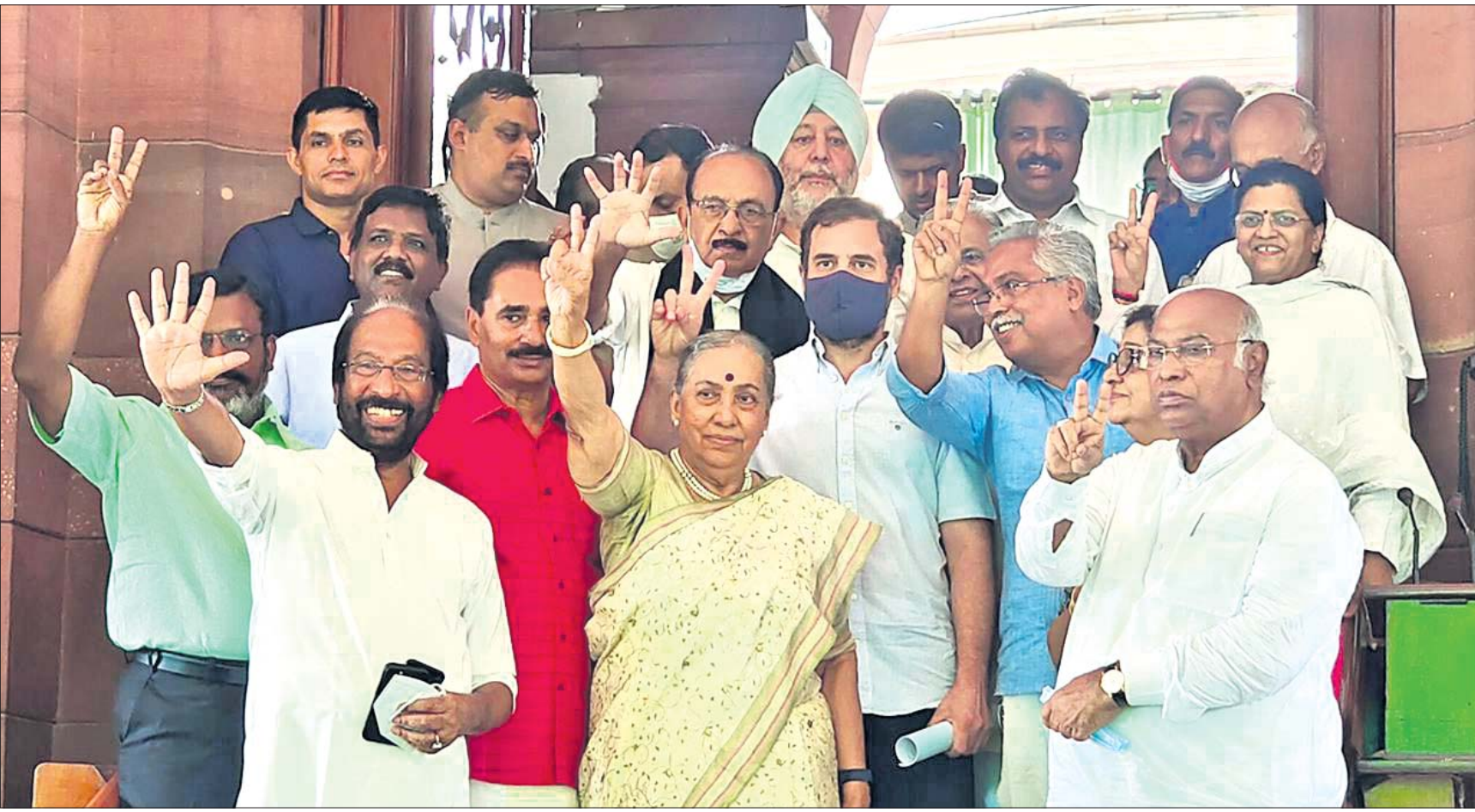
ମିଳିତ ବିରୋଧୀଙ୍କ ଉପରାଷ୍ଟ୍ରପତି ପ୍ରାର୍ଥୀ ମାର୍ଗରେଟ୍ ଆଲଭାଙ୍କ ମଙ୍ଗଳବାର ପ୍ରାର୍ଥନା ସମୟରେ କଂଗ୍ରେସ ନେତା ରାହୁଲ ଗାନ୍ଧୀ, ମିଲିକାର୍ଜୁନ ଖାର୍ଗେଙ୍କ ସମେତ ଅନ୍ୟ ଦଳର ନେତୃବୃନ୍ଦ।

■ 'ମୁନ୍ନାଭାଇ ଏମ୍ବିବିଏସ୍' ଶୈଳୀରେ କାର୍ଯ୍ୟକରୁଛି ରାଜକେନ୍ଦ୍ର ■ ପରୀକ୍ଷାର୍ଥୀଙ୍କ ପାଇଁ ଉତ୍ତର ଲେଖୁଛନ୍ତି ଏକ୍ସପର୍ଟ, ୮ ଗିରଫ ମଧ୍ୟରେ ଏହି ଜାଲିଆତି ବ୍ୟାପିଥିବା ସନ୍ଦେହ କରାଯାଉଛି। ବଲିଉଡ୍ ଫିଲ୍ମ 'ମୁନ୍ନାଭାଇ ଏମ୍ବିବିଏସ୍' ଶୈଳୀରେ ରାଜକେନ୍ଦ୍ର କାର୍ଯ୍ୟ କରୁଥିବା ଜଣାପଡ଼ିଛି। ରାଜକେନ୍ଦ୍ର ଚଳାଇଥିବା ଗୋଷ୍ଠୀ ପକ୍ଷରୁ ପରୀକ୍ଷାର୍ଥୀଙ୍କ ପାଇଁ ଉତ୍ତର ଲେଖିପାରୁଥିବା ଏକ୍ସପର୍ଟ (ପେପର ସଲଭର)ମାନଙ୍କୁ ନିୟୋଜିତ କରାଯାଉଛି। ୧୬ ପୃଷ୍ଠା-୪