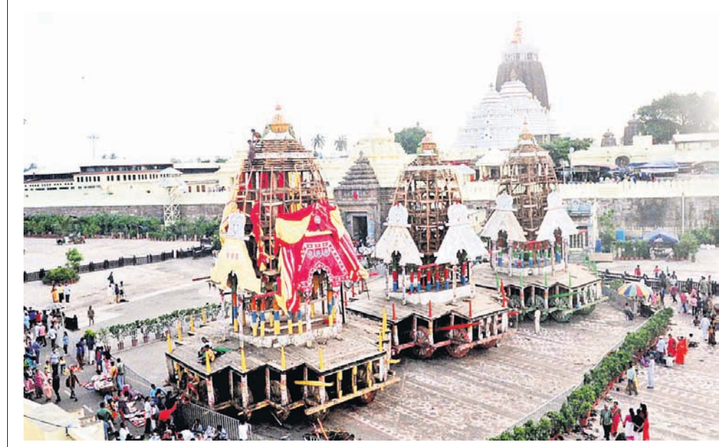
ଘୋଷଯାତ୍ରା ସରିବା ପରେ ଶ୍ରୀମନ୍ଦିର ସମ୍ମୁଖରେ ଥିବା ତିନି ରଥରୁ ମଙ୍ଗଳବାର କନା ଓ କଳସ କଢ଼ାଯାଇଛି।

ଅଜଣା ଉପକ୍ରମ ଆସୁଥିବା କୌଣସି ଲିଙ୍କ୍ ଉପରେ କ୍ଲିକ୍ କରନ୍ତୁ ନାହିଁ। ମୋବାଇଲ୍ ଫୋନ୍‌ର ବ୍ଲୁଟୁଥ୍ କୋନେକ୍ଟିଭ୍ ପାସୱାର୍ଡ୍ କୁ ସେବ୍ କରି ରଖନ୍ତୁ ନାହିଁ। ଯଥାସମ୍ଭବ ଅଜଣା ଲିଙ୍କ୍ ମୋବାଇଲ୍ ନମ୍ବର ଏବଂ ଓଡ଼ିପି ଦେଇ ପଞ୍ଜୀକରଣ କରିବାକୁ ବନ୍ଧୁକୁ ଟିକା ପାଇଁ କେନ୍ଦ୍ର ସରକାରଙ୍କ ପ୍ରଦତ୍ତ ଲିଙ୍କ୍ ଓ ଆପ୍ଲିକେସନ୍ ବ୍ୟବହାର କରନ୍ତୁ। ଲିଙ୍କ୍ ମାଧ୍ୟମରେ ଠକେଇ ଏବେ ଏକ ସହଜ ପଦ୍ଧତିରେ ପରିଣତ ହୋଇଛି। ଏଭଳି ଠକେଇ ସାଇବର ଠକମାନେ ସହଜରେ ଟଙ୍କା ଲୁଟ୍ କରିପାରୁଛନ୍ତି ବୋଲି ସାଇବର ଏକ୍ସପର୍ଟ ସ୍ୱପ୍ନା ସାଥୀଙ୍କ କହିଛନ୍ତି। ସେ ଆହୁରି କହିଛନ୍ତି, ସବୁ ସାଇବର ଠକେଇ ପରେ ଏକ ଗୋଲ୍ଡେନ୍ ଆଖିର ଥାଏ। ଠକେଇର ଏକ ଘଣ୍ଟା ଭିତରେ ଟଙ୍କା ମିଳିବାର ସୁଯୋଗ ଅଧିକ ରହିଥାଏ। ତେଣୁ ଠକେଇ ହେଲେ ଯଥାଶୀଘ୍ର ସାଇବର ଆନାରେ ଅଭିଯୋଗ କରାଯିବା ଦରକାର।