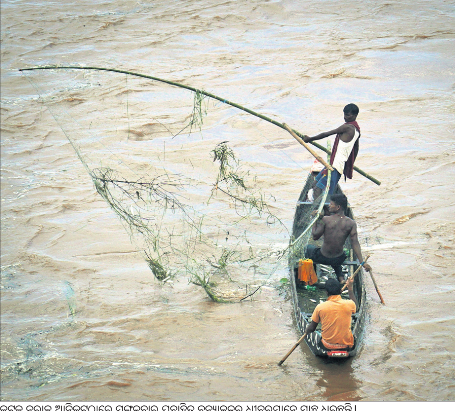
କଟକ ନଦୀକୂଳ ଆନନ୍ଦନଗରୀ ପ୍ରବାହିତ ବନ୍ୟାଜଳକୁ ଧାବନମାନେ ମାଛ ଧରୁଛନ୍ତି